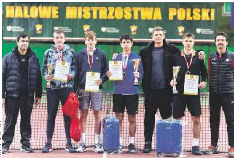
Kadeci Górnik Bytom spisali się bardzo dobrze

Świetnie spisali się tenisiści Górnik Bytom, którzy wybrali się do miasta Mikołaja Kopernika na silnie obsadzone Mistrzostwa Polski Kadetek i Kadetów.