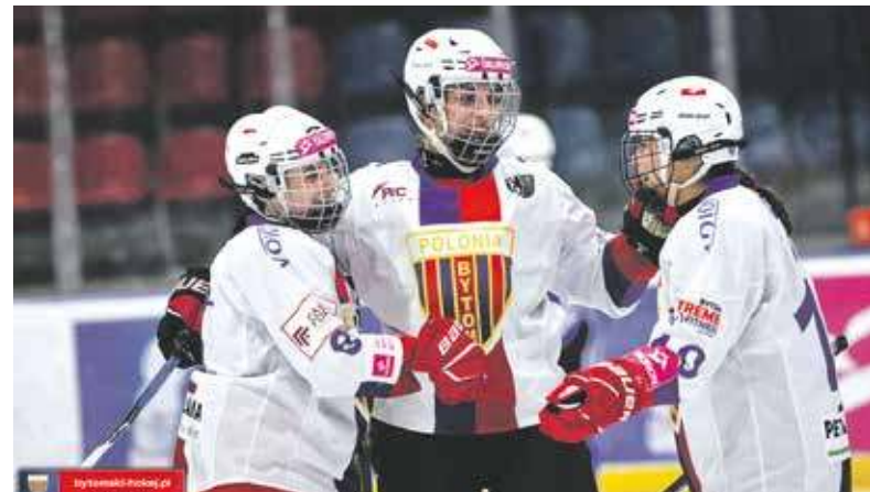
Bytomianki pewnie zmierzają po kolejny tytuł

W niedzielę przed południem odbył się drugi mecz tych ekip. Nasza była stuprocentowym faworytem. To starcie