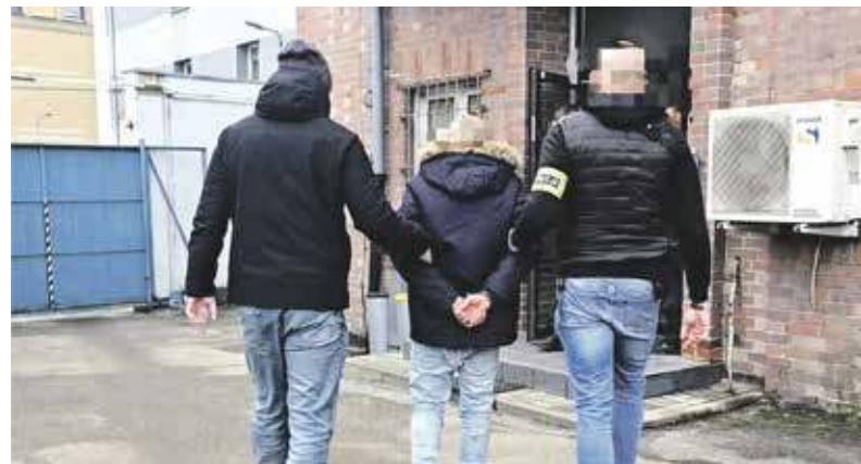
67-latek w rękach policji

Zatrzymanym okazał się 67-latek, który w całym niecnym proced-