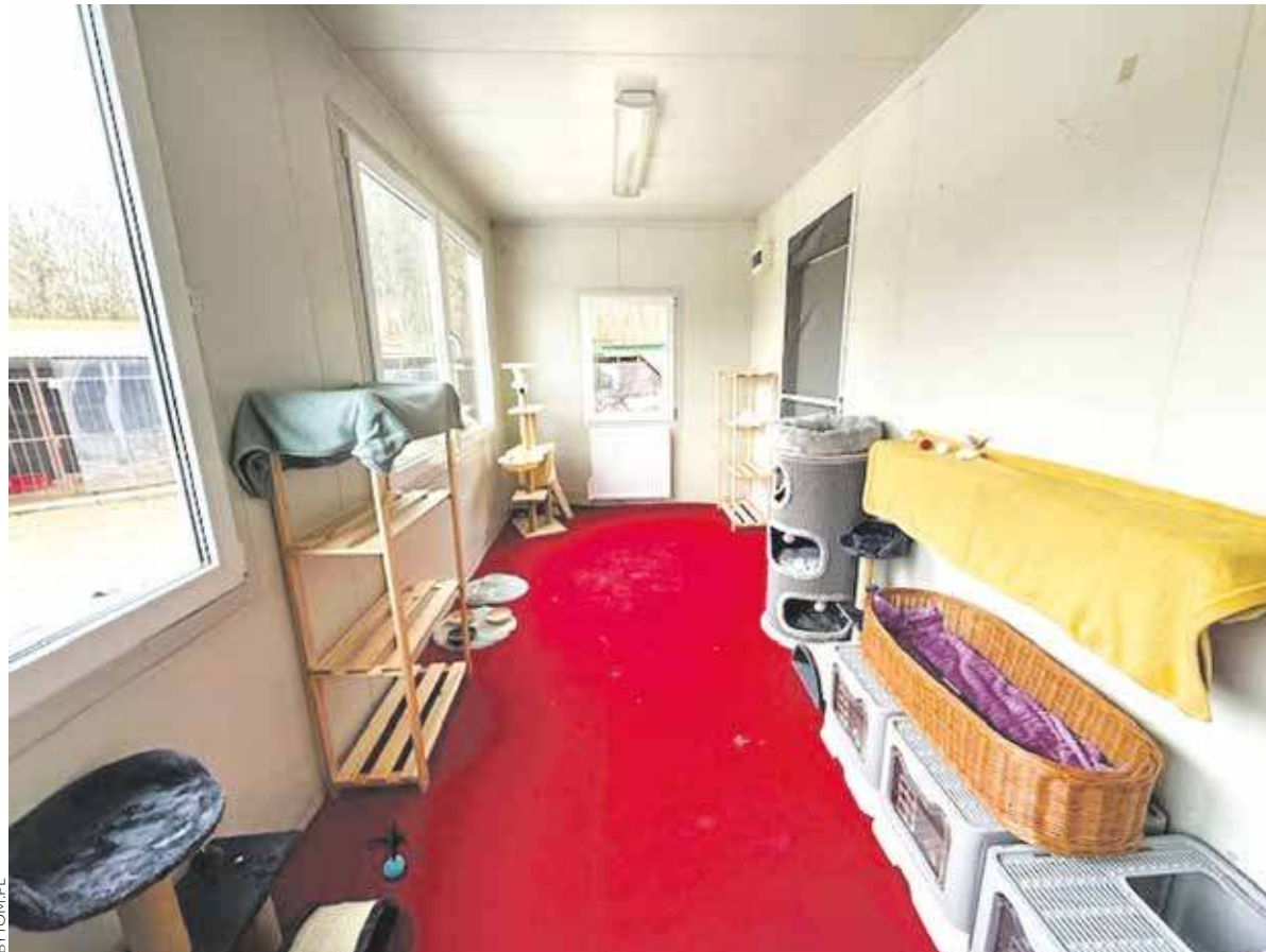
Nowa kociarnia została dobrze wyposażona

BYTOM. TRWA INTENSYWNE WPROWADZANIE NOWYCH PORZĄDKÓW W MIECHOWICKIM SCHRONISKU DLA BEZDOMNYCH ZWIERZĄT PO TYM, JAK KONTROLĘ NAD NIM PRZEJĘŁO MIASTO. NA DAWNEGO ZARZĄDCĘ NAŁOŻYŁO ONO KARĘ UMOWNĄ WYNOSZĄCĄ PRZESZŁO 482 TYSIĄCE ZŁOTYCH.