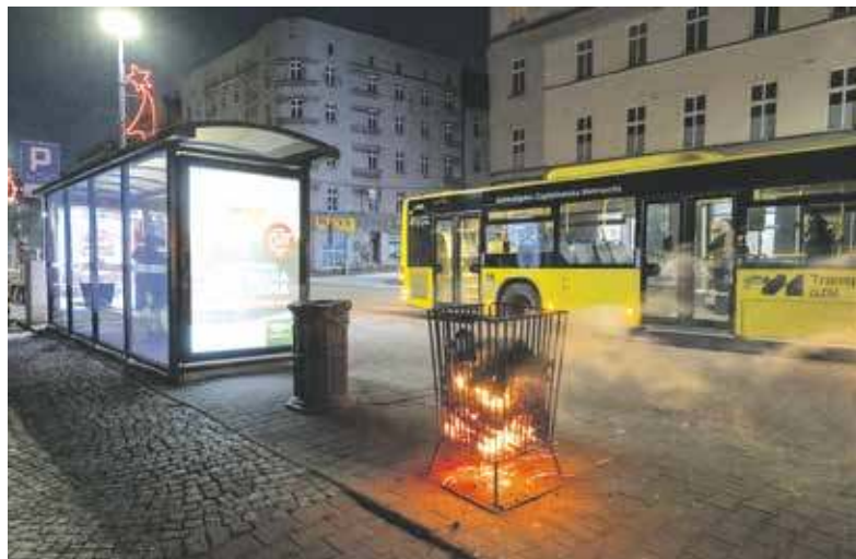
Jeden z koksowników stanął przy ulicy Piłsudskiego

Placówki te są pełne. Jak informowano podczas wspomnianego sztabu