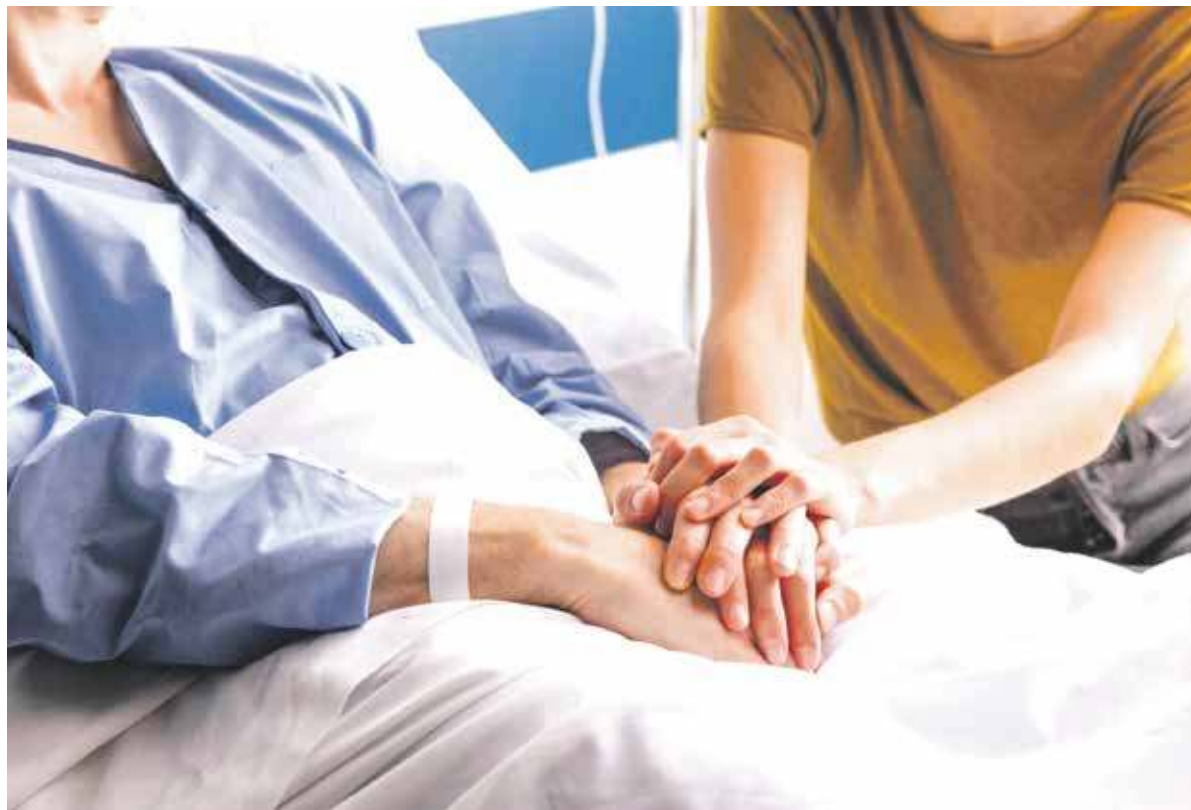
Pacjent, który trafi do szpitala w trybie nagłym może być objęty opieką gwarantowaną przez pakiet onkologiczny

BYTOM. OSOBY, CIERPIĄCE NA NOWOTWORY MAJĄ PRAWO DO SZYBSZEJ DIAGNOSTYKI I LECZENIA. CHOROBY ONKOLOGICZNE BARDZO CZĘSTO SZYBKO SIĘ ROZWIJAJĄ, WIĘC CZAS MA TUTAJ SZCZEGÓLNE, A TAK NAPRAWDĘ DECYDUJĄCE W PROCESIE LECZENIA ZNACZENIE.