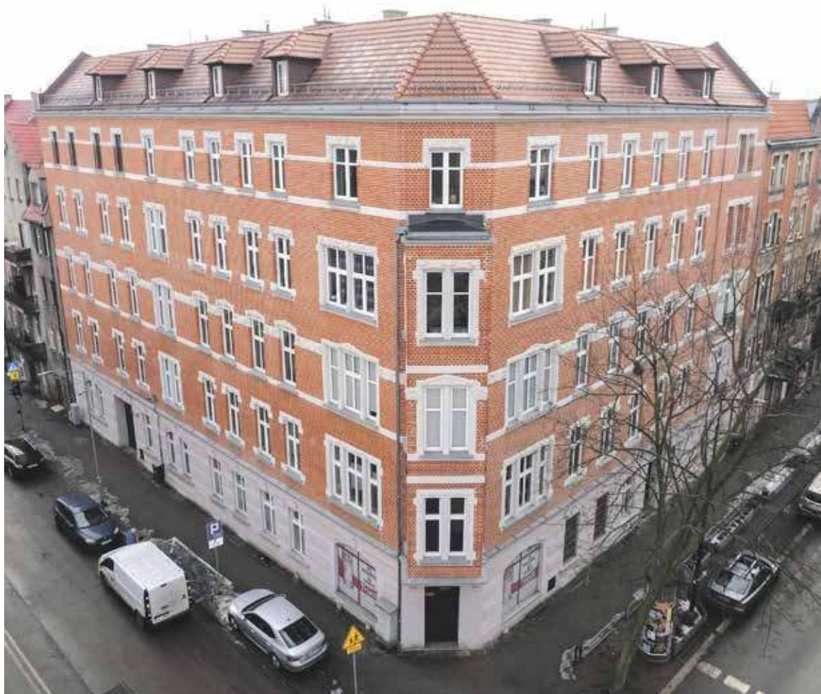
Dzięki milionom z Warszawy tak pięknie odnowionych kamienic będziemy mieli znacznie więcej