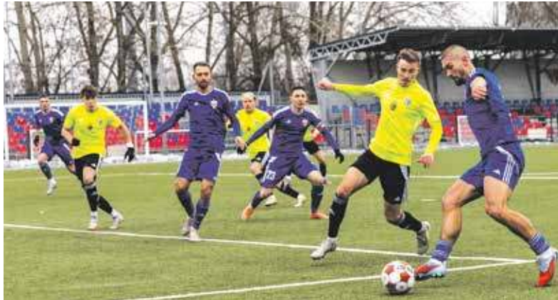
W ostatnim sparingu bytomianie strzelili 5 goli

A jakie cele mu postawiono? No właśnie nie awans. W trakcie inau-