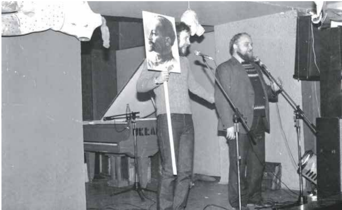
Członkowie bytomskiego kabaretu Cuba i Przyjaciele również występowali na Mulimare 79

Sprawę obiektową artyści założono 10 kwietnia 1970 roku. Jej celem było: „niedopuszczenie do wykorzystania