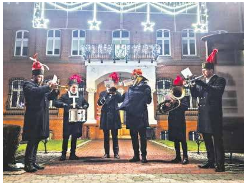
Radzionkowski USC mieści się w gmachu Ratusza, ale orkiestra górnicza na ślubach zwyczajowo nie gra

Ale jeszcze tylko przez rok, bo radzionkowski USC ponownie się przeniesie, tym razem do Rojcy na ulicę Kużaja. Jego siedzibą będzie część budynku, w której mieściła się MBP. Ta przypomnijmy funkcjonuje od pewnego czasu w położonym nieopodal, zmodernizowanym budynku dawnej Restauracji U Blachuta. Gmach ten został kupiony przez miasto. Przeprowadzka USC nastąpi za 12 miesięcy, bo trzeba najpierw odpowiednio zaadaptować dawne pomieszczenia biblioteczne. Koszt zaplanowanych robót wyniesie przeszło 649 tys. zł. Inwestycja będzie dofinansowana ze środków dotacji celowej, jaką Radzionków pozy-