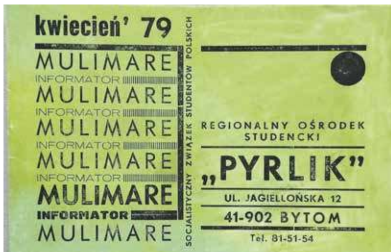
Festiwal Mulimare w 1979 roku „obsługiwało” 12 tajnych współpracowników Służby Bezpieczeństwa

Już 11 kwietnia został opracowany „plan zabezpieczenia” festiwalu Mulimare. Czytamy w nim m.in.: „Z posiadanego rozeznania operacyjnego wynika, że udział w X Festiwalu Kulturalnym Mulimare weźmie Kabaret TEY z Poznania oraz Kabaret Piwnica pod Baranami z Krakowa, znane z prezentowania w swych tekstach kontrowersyjnych treści politycznych”. Dlatego jednym z celów działań w ramach sprawy Artyści miało być: „niedopuszczenie do wykorzystania tej imprezy przez elementy antysocjalistyczne w jakikolwiek sposób. (...) Szczególnej kontroli poddani zostaną członkowie Kabaretu Tey z Poznania oraz Kabaretu Piwnica pod Baranami z Krakowa. (...)