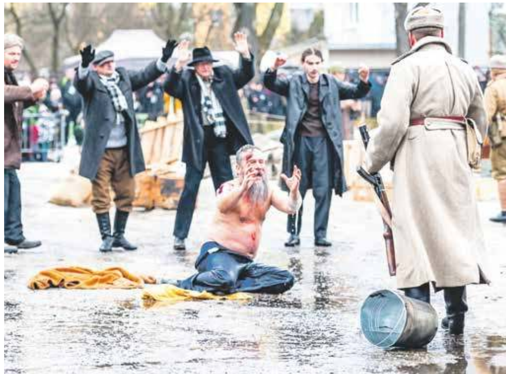
Wiele spośród odegranych scen było bardzo przejmujących