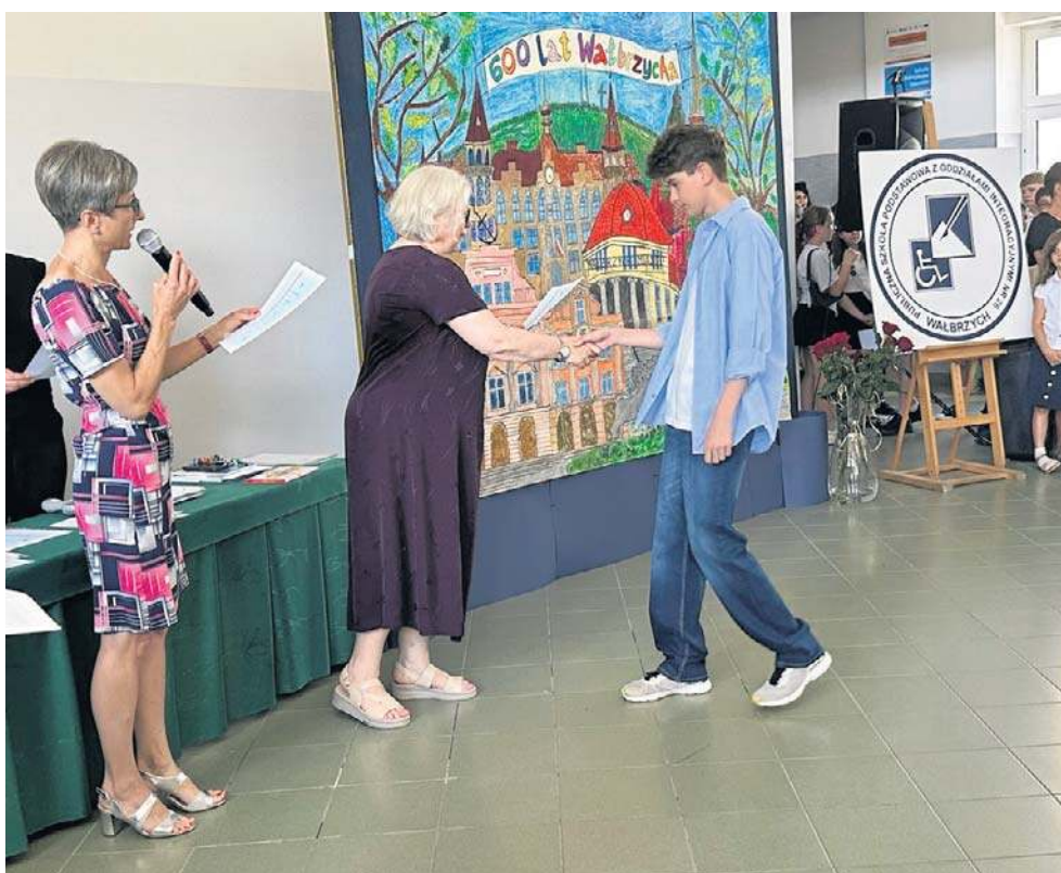
Czerwone paski na świadectwie to zawsze powód do domu