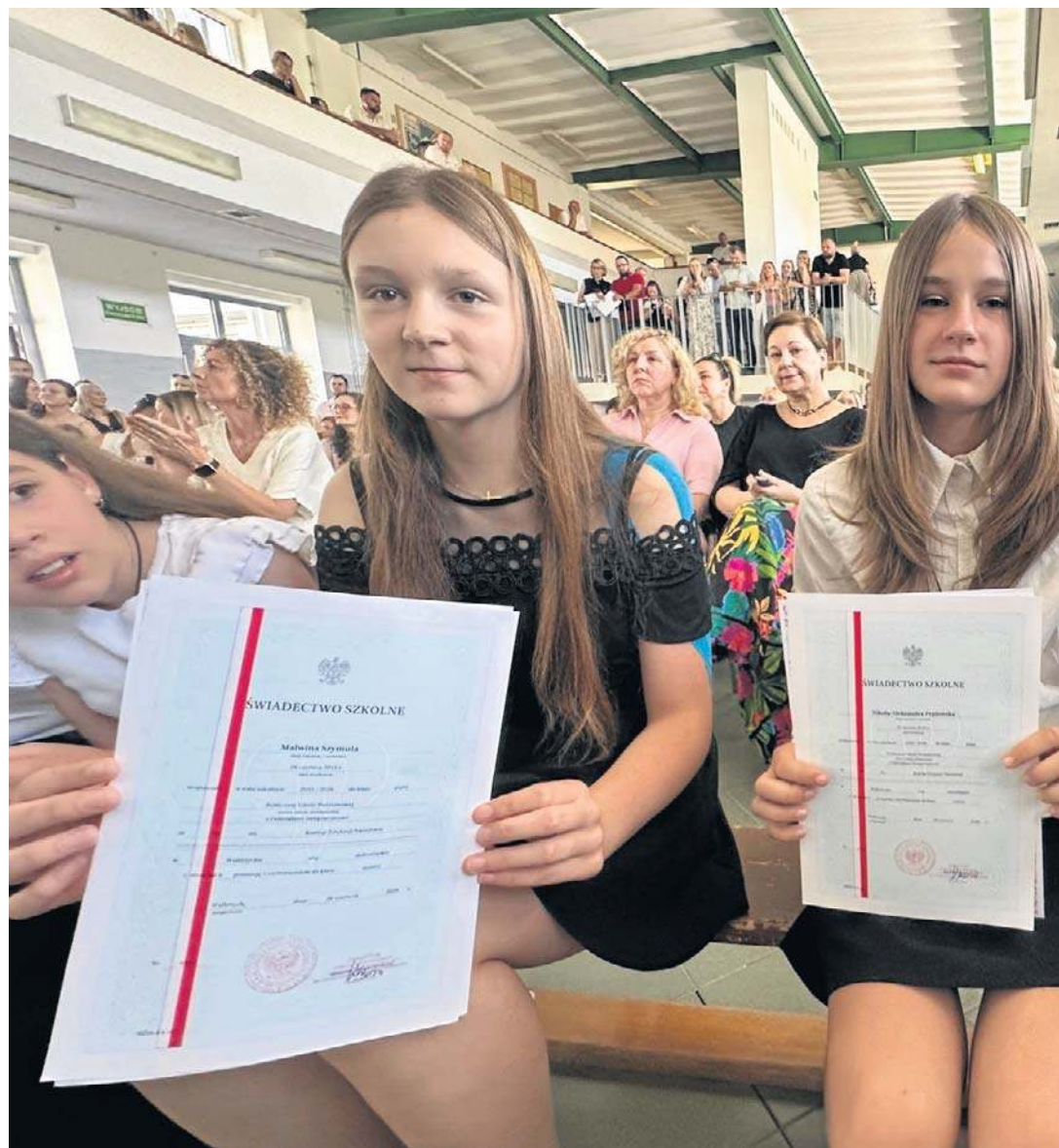
Odświętnie ubrani uczniowie i nauczyciele pożegnali w piątek rok szkolny w Szkole Podstawowej