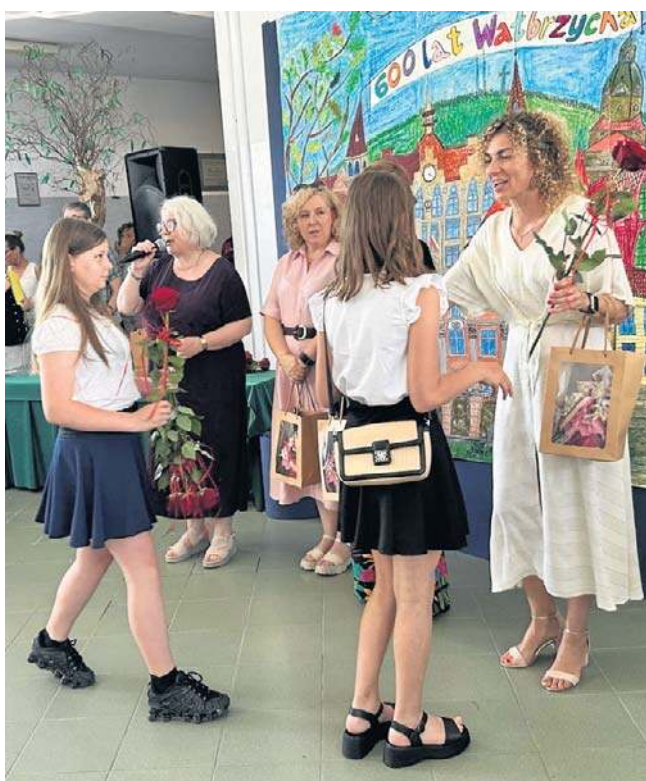
Najlepsi uczniowie mogli liczyć na tradycyjne wyróżnienia. Gratulujemy!