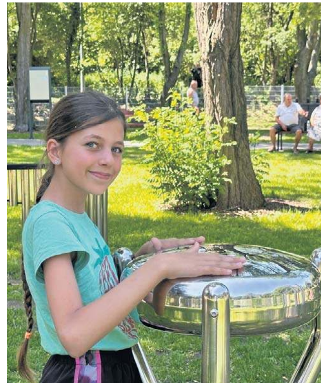
Na otwarciu pojawiły się dzieci i młodzież. Wszyscy byli zachwyceni muzycznymi rozwiązaniami