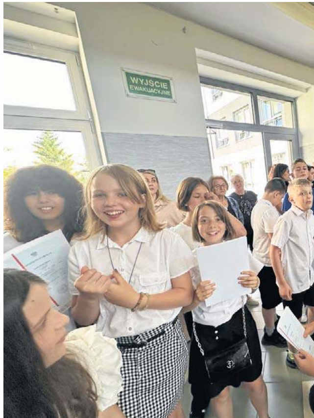
Uczniowie odbierali świadectwa z czerwonymi paskami, a rodzice podziękowania za wspieranie szkoły