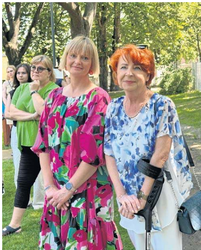
Na otwarciu pojawili się również mieszkańcy. Podkreślali mnogość czekających tu atrakcji