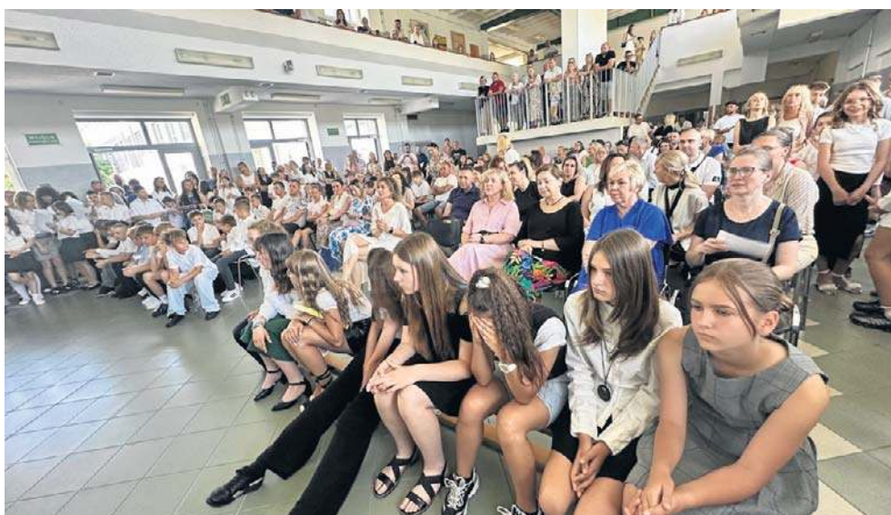
Dla uczniów to najważniejszy dzień w roku szkolnym