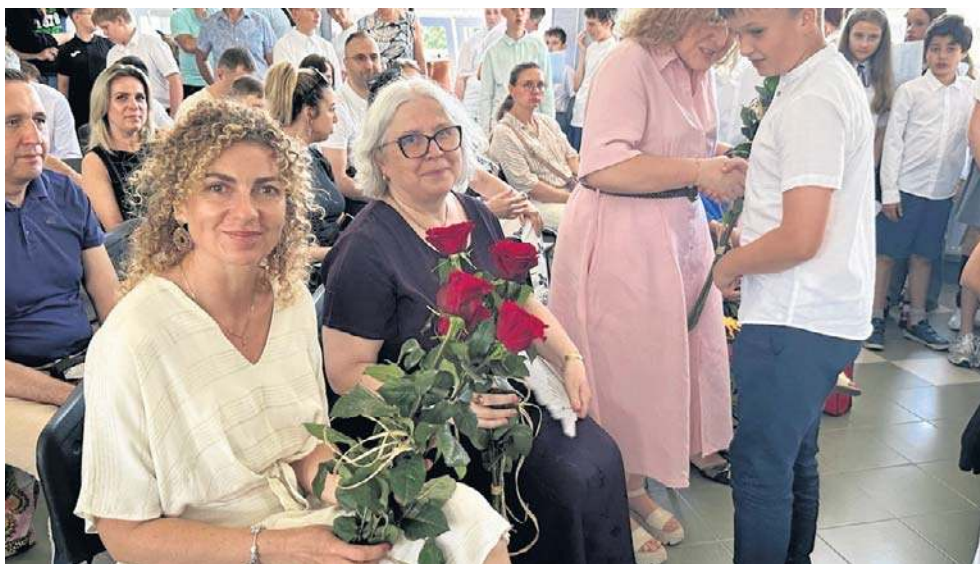
Jak koniec roku, to nie mogło zabraknąć kwiatów