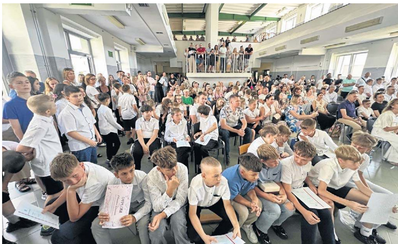
Całe grono pedagogiczne nagrodzone zostało oklaskami za przemijający rok szkolny