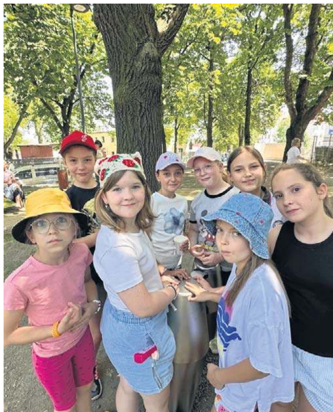
Skwer nosi im. wybitnego filharmonika Józefa Wiłkomirskiego

Więcej na portalu wałbrzych.naszemiasto.pl.