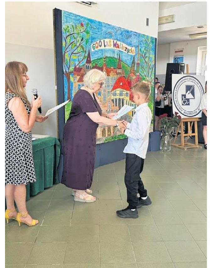
Nowy dyrektor zostanie wybrany/a w konkursie, zachęcamy do śledzenia komunikatów w BIP UM