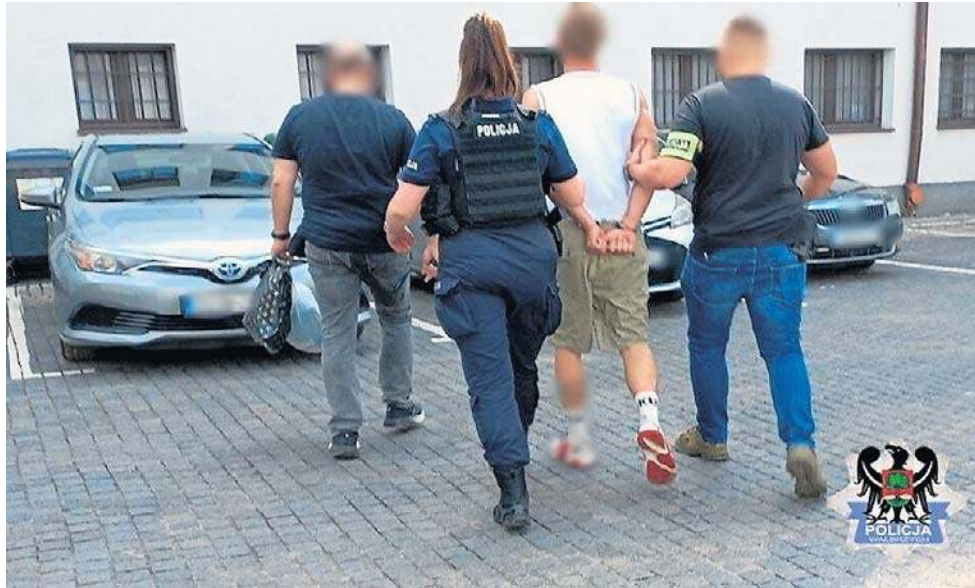
Oprawcy porwali 28-latkę, grozili mu, dźgali nożem, okradli i wywieźli do lasu