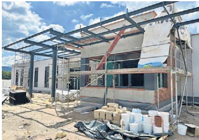
Tak wygląda obecnie budynek administracji przy ul. Beethovena w Wałbrzychu

Następny trzon hali, ten wyższy to warsztat napraw bieżących, gdzie są planowane naprawy wynikające z przebiegu czy upływu czasu. Na tej hali będą zainstalowane m.in. podnośniki od kolumnowych elektrycznych po hydrauliczne oraz specjalny, ogromny podest, na którym będą wykonywane prace na dachu autobusów, bo gros rzeczy w „elektrykach”, „wodorowcach” i „hybrydach” znajdują się właśnie na dachu