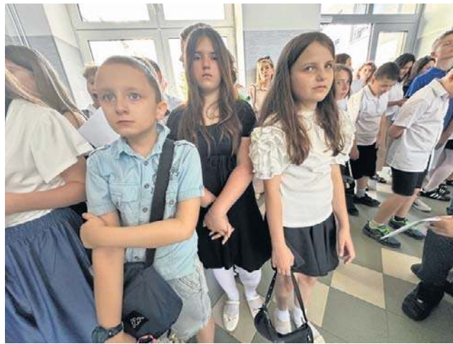
Uczniowie mają teraz dwa wakacje laby. Zazdrościmy i już wypatrujemy pierwszego dnia września