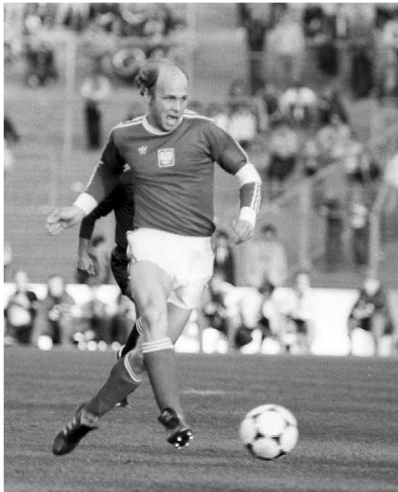
Grzegorz Lato: wolę wspominać mecze, w których nie wpisywałem się na listę strzelców, ale wygraliśmy

Nie ma specjalnych wyników na mistrzostwach świata. I po prawdzie szczególnie to nie dziwi, bo tam gra też