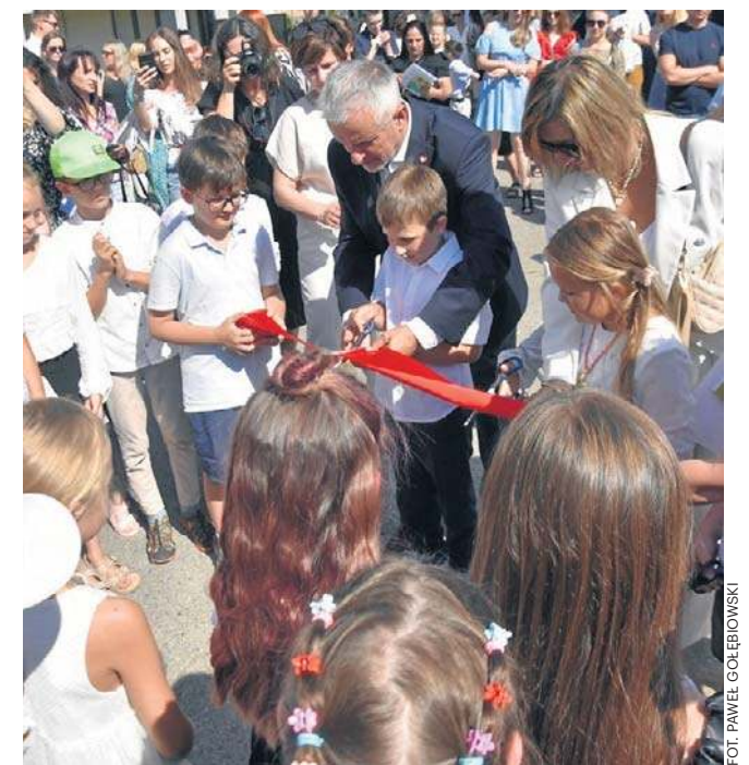
Zupełnie nowa szkoła dla około tysiąca uczniów ma powstać do września 2028 roku

- W czasach kiedy zamyka się szkoły, my budujemy nową. Pozyskaliśmy jednak środki z funduszu związanego z zamykaniem kopalń. To będzie szkoła zbudowana dla dzieci i wnuków górników, hutników i wszystkich, którzy