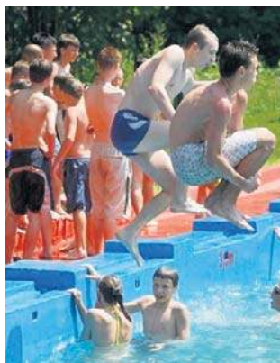
Basen na osiedlu Rusnionowa był czynny do 2013 roku

Umowę podpisano w czerwcu, dokument ma być gotowy za trzy miesiące, będzie stanowił podstawę do przygotowania procesu inwestycyjnego i przyszłych postępowań dotyczących opracowania dokumentacji projektowej i realizacji przedsięwzięcia.