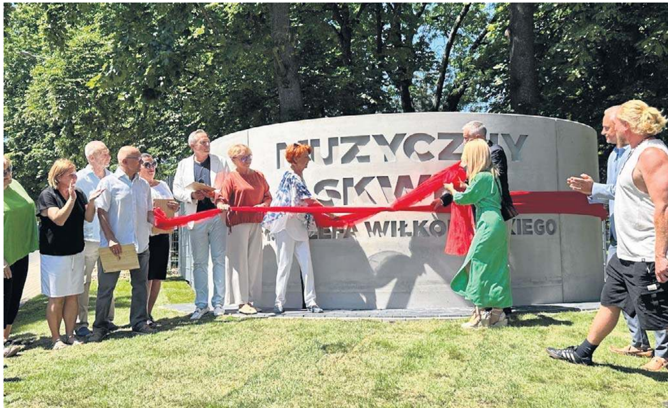
Przy ul. 15-lecia w sąsiedztwie Szkoły Muzycznej zielona przestrzeń nabrała nowego charakteru, pojawiły się m.in. urządzenia, na których można grać, a także ławeczki i scena.