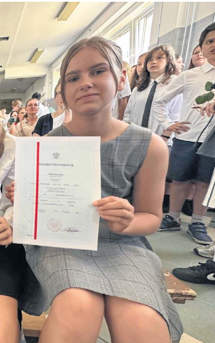
wej nr 26 w Wałbrzychu