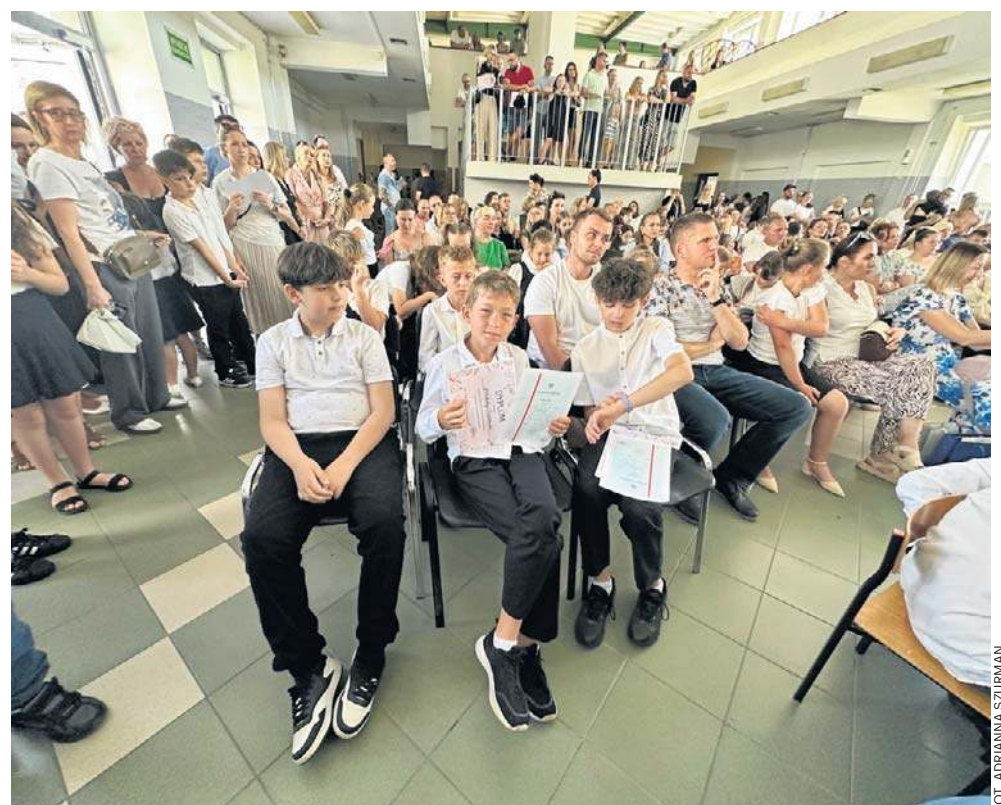
Koniec roku to również okazja do wręczenia dyplomów za szczególne osiągnięcia