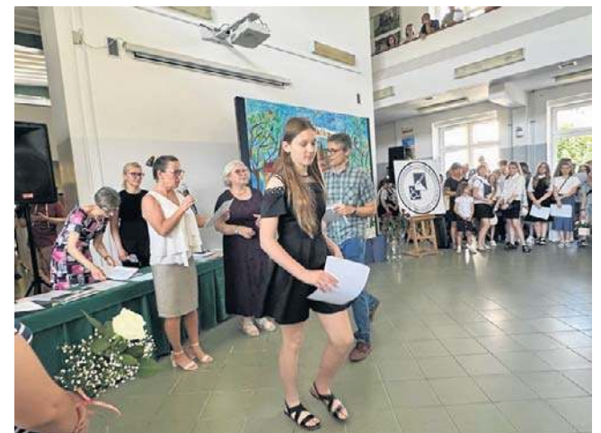
Więcej zdjęć z tej wyjątkowej uroczystości na naszym portalu wałbrzych.naszemiasto.pl