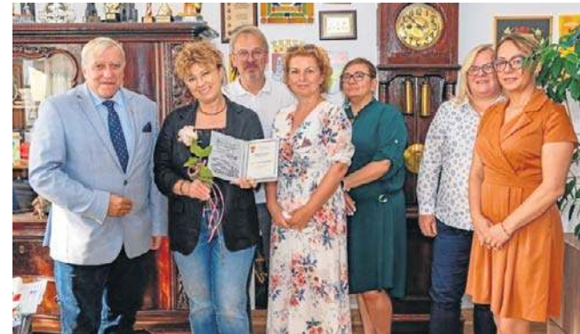
Właścicielka Kawiarenki Smaków z Sokołowska została wyróżniona Paszportem Mieroszowa

Słynna Kawiarenka to wspaniała wizytówka regionu - dzięki m.in. podawanej tam wyjątkowej Bezcie Ani jest jednym z najbardziej rozpoznawalnych i najwyższej ocenianych miejsc na turystycznej