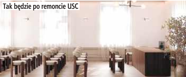
Tak będzie po remoncie USC

w latach 1961–1963, a w 1969 roku oficjalnie wpisano go do rejestru zabytków. Od 13 listopada 1971 roku, po uroczystym otwarciu podczas obchodów 25-lecia urzędów stanu cywilnego w powiecie lubelskim, obiekt nieprzerwanie służy jako siedziba USC. Obecnie przygotowano już pełną dokumentację projektową oraz pozyskano niezbędne pozwolenia od konserwatora zabytków, co otwiera drogę do realizacji prac.