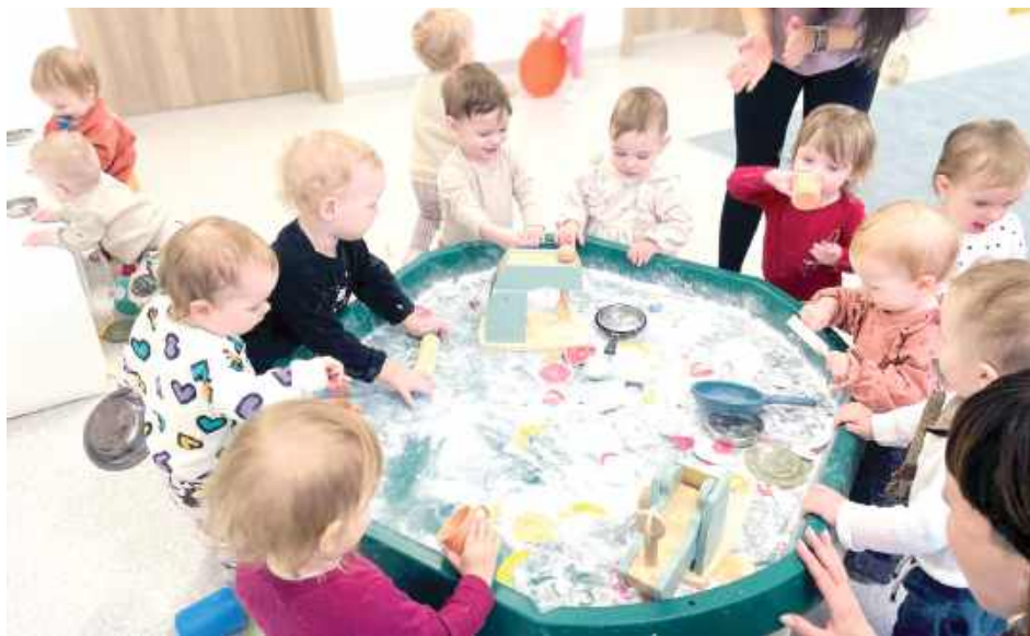
Dzień naleśnika w żłobku w Łęcznej

Dzieci z ogromnym entuzjazmem włączyły się w proces przygotowywania tego popularnego przysmaku pod czujnym okiem swoich opiekunek. Grupa „Elfy” oraz pozostali podopieczni z wielkim zaciekawieniem łączyły i mieszały składniki na ciasto, ucząc się przy tym podstaw współpracy i czerpiąc radość z każdego etapu przygotowań. Podczas gdy masa była gotowa, maluchy miały okazję obserwo-