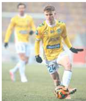
Porażka Motoru przyczyniła się do awansu Jagielloni na pozycję lidera tabeli