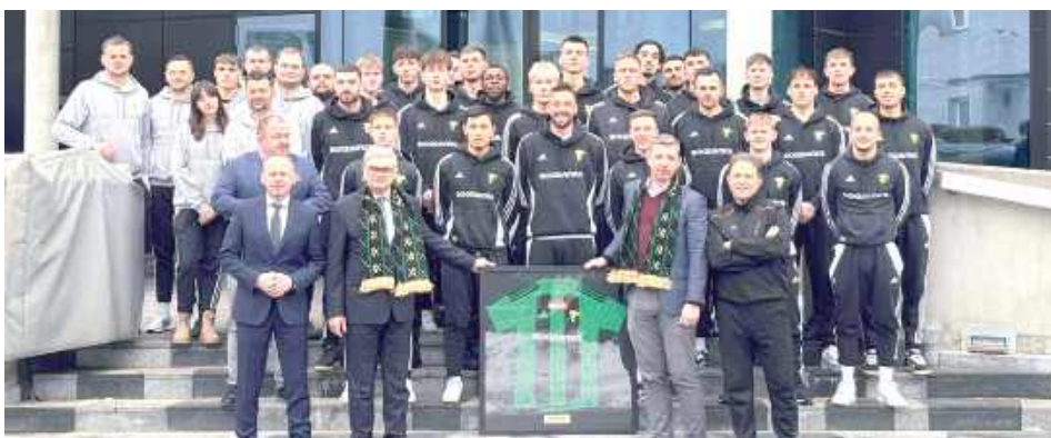
Zarząd kopalni Bogdanka wraz z zespołem i prezesem Górnika Łęczna

Dla klubu z Łęcznej współpraca z kopalnią to znacznie więcej niż