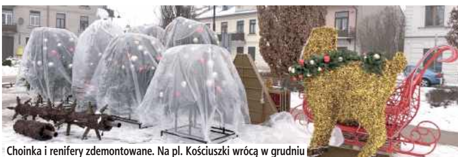
Choinka i renifery zdemontowane. Na pl. Kościuszki wrócą w grudniu

Zgodnie z wieloletnią tradycją, wraz z początkiem lutego z przestrzeni publicznej znikają ostatnie symbole minionych świąt. Tegoroczny demontaż