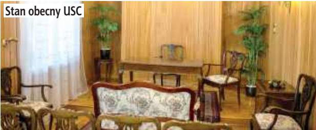
Stan obecny USC

Przedstawione zostały plany nowej inwestycji w Łęcznej, która ma na celu przywrócenie pełnej świetności siedzibie Urzędu Stanu Cywilnego. Zaplanowane prace zakładają gruntowną modernizację wnętrza obiektu oraz dobudowanie nowej części do istniejącej bryły budynku.