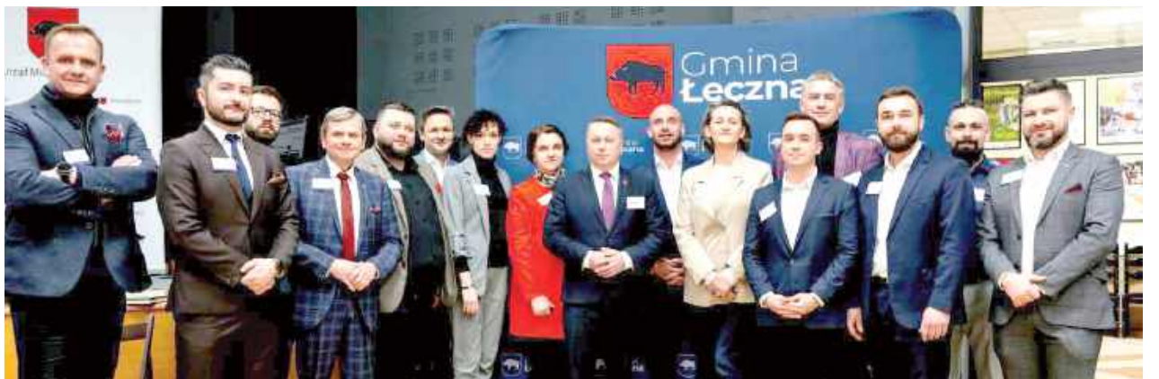
Głównym motywem wizyty przedstawicieli organizacji BNI Fortuna oraz zaproszonych gości było szczegółowe zapoznanie się z potencjałem gospodarczym Łęcznej

We wtorek, 3 lutego Centrum Kultury w Łęcznej stało się miejscem ważnego dialogu gospodarczego zorganizowanego pod hasłem „Współpraca w biznesie kluczem do rozwoju”. Wydarzenie to, przygotowane wspólnie przez Gminę Łęczna oraz grupę BNI Fortuna, przyciągnęło liczne grono lokalnych przedsiębiorców