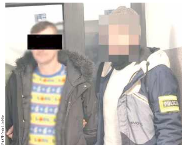
W chwili zatrzymania mężczyzna w organizmie miał 2,5 promila alkoholu