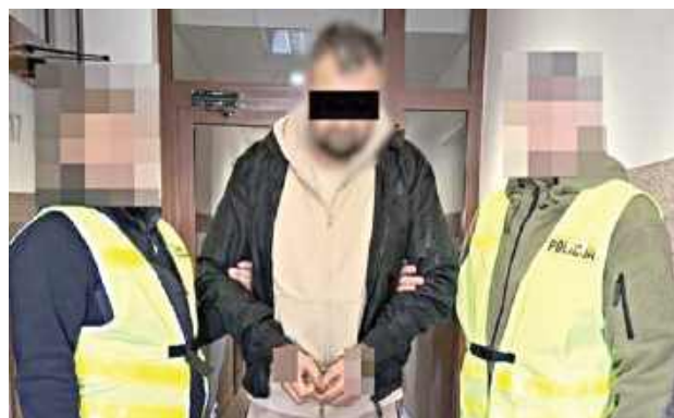
Na wniosek prokuratora Sąd Okręgowy w Lublinie rozstrzygnął kwestię dalszego aresztowania myśliwego

Gdy Sąd Rejonowy Lublin-Zachód w Lublinie decydował o aresztowaniu 50-latek w listopadzie ub.r., zażalenie na to złożył obrońca myśliwego. Zażalenie to rozpatrywał wówczas Sąd Okręgowy w Lublinie, który nie zgodził się z obrońcą i decyzję sądu podtrzymał. W przypadku przedłużania tymczasowego aresztowania, jak już wspomniano, decyzję podejmuje już sąd okręgowy. Ewentualne zażalenie rozstrzygnie tu sąd wyższej instancji,