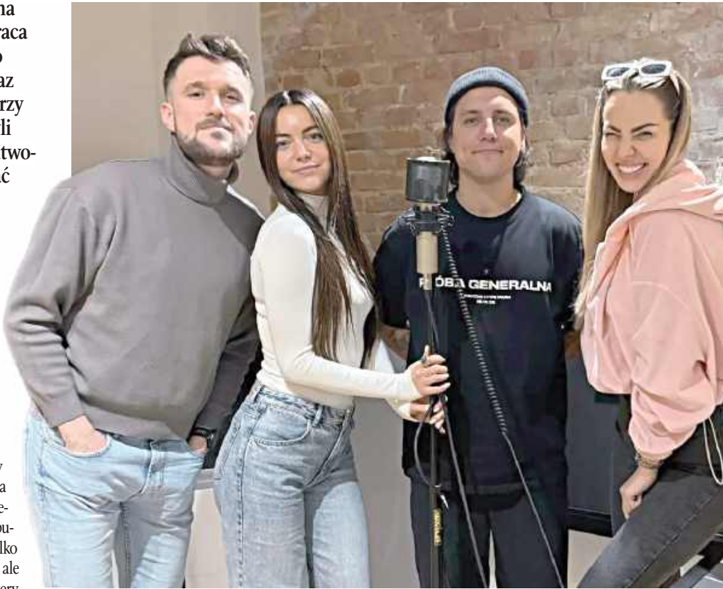
Defis, MiłyPan oraz Topky znowu razem

Ich poprzedni wspólny utwór „Jeden taniec jedna noc” w momencie premiery zdobył ogromną popularność - teledysk nie tylko bijąc rekordy wyświetleń, ale stał się jednym z charakterystycznych brzmień gatunku