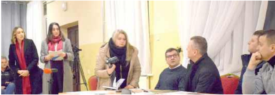
Spotkanie w Przypisówce w sprawie budowy spalarni zwłok zwierzęcych, na którym mieszkańcy wypowiedzieli się przeciwko takiej inwestycji

Jak napisano we wniosku, spalanie zwłok zwierzęcych będzie się odbywało metodą termiczną w piecu krematoryjnym gazowym. Działki, którymi jest zainteresowane przedsiębiorstwo, są objęte planem zagospodarowania gminy Firlej jako tereny projektów przemysłowych i z dopuszczeniem mogących znacząco oddziaływać na środowisko. Lubelskie