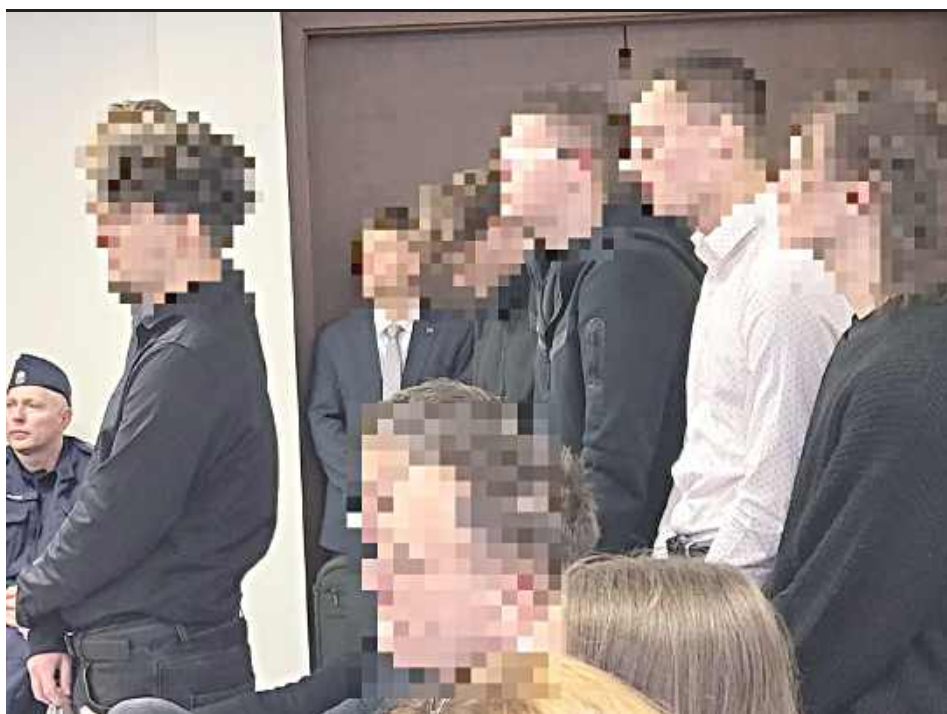
Sędzia zatrzymywał nagranie i kolejno wypytywał uczestników - „kto to powiedział?”, a mężczyźni kolejno się przyznawali