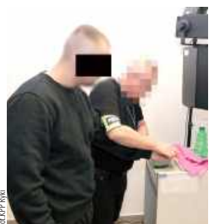
27-latek usłyszał zarzuty posiadania marihuany, posiadania znacznej ilości amfetaminy oraz podrobienia dokumentów

27-latek usłyszał zarzuty posiadania marihuany, posiadania