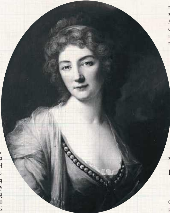
Portret Marynki Czartoryskiej (Marii Wirtemberskiej) pędzla Lampiego

Józef II-gi, będąc w Lwowie, parokrotnie rzekł publicznie do