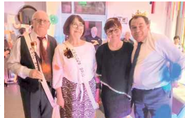
Karnawałowe wspomnienia w stylu retro