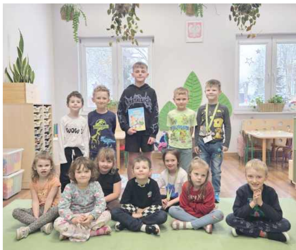
Wydarzenie „Luty z Cukierkiem” będzie kontynuowane w placówce do 12 lutego

Szkoła w Zofiówce, we współpracy z Akademią Przedszkolaka, zainaugurowała wyjątkowe wydarzenie czytelnicze pod hasłem „Luty z Cukierkiem - Książki z Pazurem”. Inicjatywa ta ma na celu zachęcenie najmłodszych do obcowania