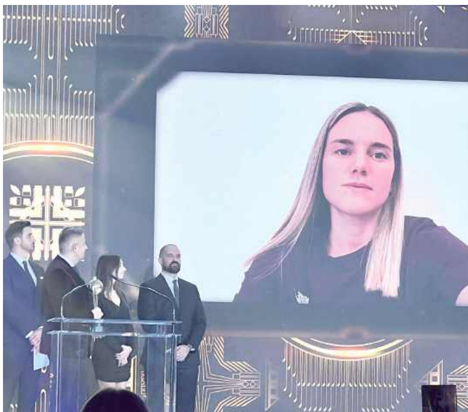
Zawodniczka w nagraniu do uczestników gali