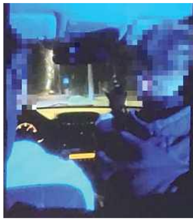
Już po złożeniu wyjaśnień przez wszystkich uczestników wypadku, sąd odtworzył w sali rozpraw nagrania zarejestrowane przez nich telefonami w aucie na niedługo przed tragedią. I rzeczywiście - jest wesoło. Mężczyźni krzyczą, dopingują kierowcę, żartują. Są wyraźnie rozentuzjzmowani

„I rura, kur...! Daj kur... miodu!” - krzyczano w aucie.