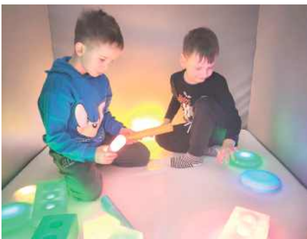
Sala została wyposażona w szeroką gamę zabawek sensorycznych i edukacyjnych, a także profesjonalny sprzęt do integracji sensorycznej.