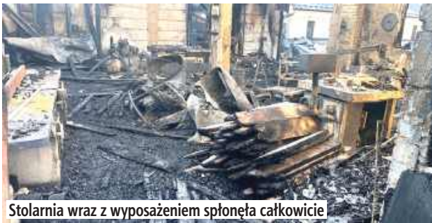
Stolarnia wraz z wyposażeniem spłonęła całkowicie

- W pierwszej fazie naszych działań na miejscu pojawiły się zastępy z OSP Leokadiów. Nasze działania polegały na zabezpieczeniu miejsca działania i podaniu czterech prądów wody w natarciu na palący się kompleks. Łącznie na miejscu działań było 8 zastępów jednostek ochrony przeciwpożarowej w sile 43 ratowników - informuje kpt. Głogowski.