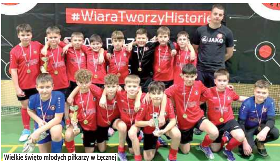
Wielkie święto młodych piłkarzy w Łęcznej

W kategorii rocznika 2013 najlepsza okazała się drużyna gospodarzy, Katolicki Klub Sportowy Wiara Łączna „A”, wyprzedzając Gminny Ludowy Klub Sportowy Ludwiniak Ludwin oraz Akademię Piłkarską Dys. Na dalszych miejscach uplasowały się zespoły Błękit Cyców, Lublinianka Lublin oraz druga ekipa gospodarzy, Wiara Łączna „B”.