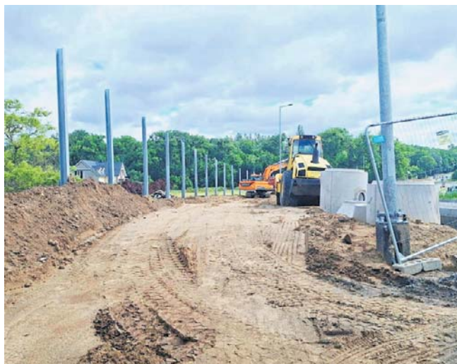
Prace przy budowie obwodnicy

- Czy to będzie dobre rozwiązanie, czas pokaże. Przekonałam się po zbudowaniu - mówił nam mężczyzna, który mieszka w części, która będzie skomunikowana z rondem. - W stronę centrum miasta będzie mi wyjechać łatwiej, ale na Wiejską czy Ukośną, to już trzeba będzie kluczyć - dodaje. Z dłuższego odcinka Owocowej trzeba będzie bowiem wjechać na nowe rondo, a później skręcić w Czarnieckiego, dalej w Puszkina, by na końcu wybrać dojazd do krótszego odcinka Owocowej. Tak będzie się jeździło już na początku lipca, gdy dla samochodów zostanie udostępniony wjazd na nowe rondo.