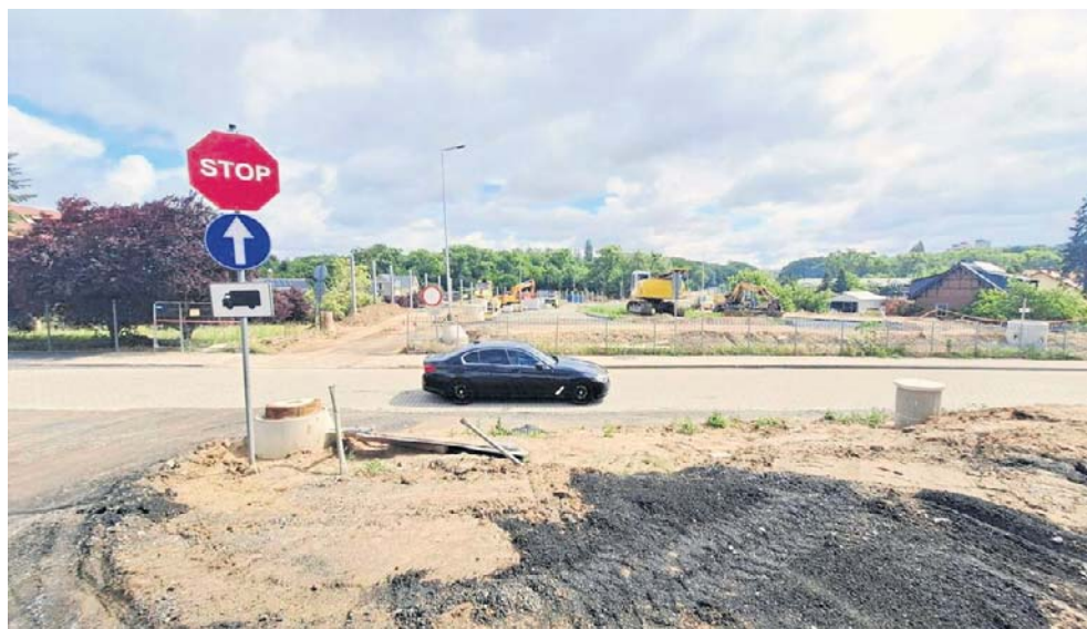
Ten fragment zbudowanej z kostki ul. Owocowej zostanie zasypany