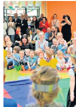
Żłobek przy Maczka miał być rozbudowany. Teraz nie ma takiej potrzeby

W Żłobku Miejskim nr 1 przy ul. Wróblewskiego wszystkich miejsc jest 100, ale wolnych jest aż 27. Żłobek nr 2 przy ul.