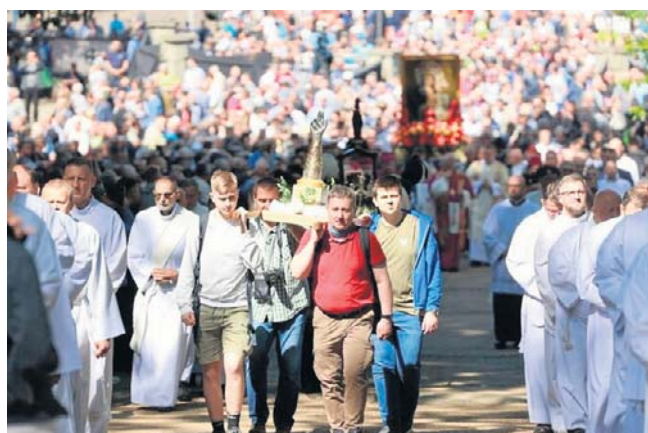
Pielgrzymka mężczyzn i młodzieńców w Piekarach Śląskich corocznie gromadzi wiernych z całego regionu

15 marca 2027 r. wygaśnie koncesja na eksploatację odcinka autostrady A4 Katowice-Kraków, którą ma spółka Stalexport Autostrada Małopolska (SAM), należąca do Grupy Stalexport Autostrady. Droga przejdzie pod zarząd GDDKiA, co oznacza, że i ona stanie się wówczas bezpłatna (poza ruchem ciężarowym).