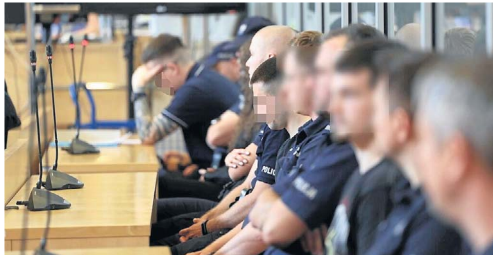
Przestępcy reklamowali się jako Yakuza. W ciągu dwóch lat działalności zarobili na czysto ponad 15 milionów złotych

30 stycznia 2026 roku Prokuratura Rejonowa w Rybniku skierowała do Sądu Okręgowego w Gliwicach akt oskarżenia obejmujący główny wątek przeprowadzonego śledztwa tj.