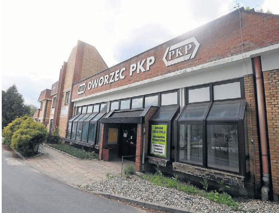
Mieszkańcy Mikołowa czują się związani ze „swoim” dworcem i opowiadają się za jego przebudową

Przeprowadzona analiza stanu technicznego wykazała szereg problemów konstrukcyjnych i eksploatacyjnych obecnego obiektu. Dotyczy one m.in. zawilgocenia attyk i elementów elewacji, problem z dachem, wentylacją grawita-