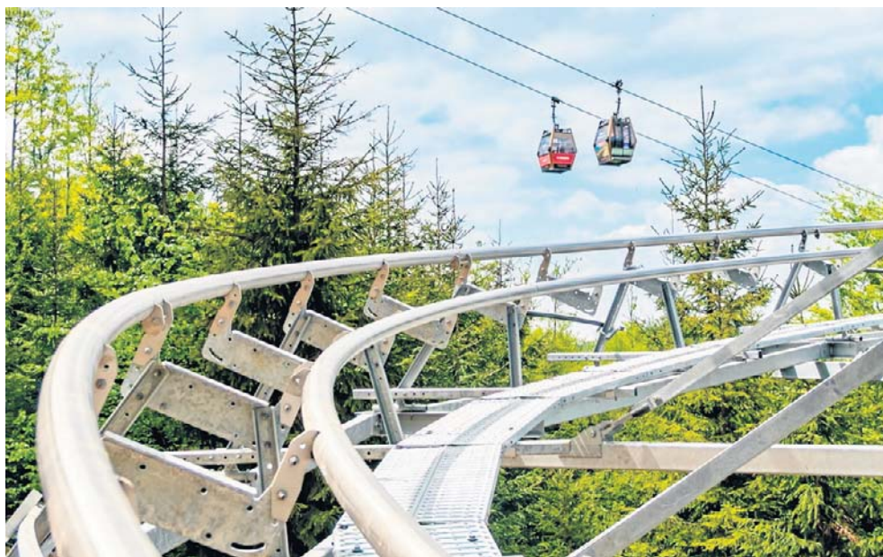
Salamandra Alpine Coaster będzie najnowocześniejszą, całoroczną kolejką grawitacyjną w Beskidach

Na amatorów wrażeń czeka niezwykle dynamiczny około 750-metrowy tor. Zjazd to prawdziwy rollercoaster emocji: wagoniki początkowo mkną tuż nad leśnym runem, by po chwili