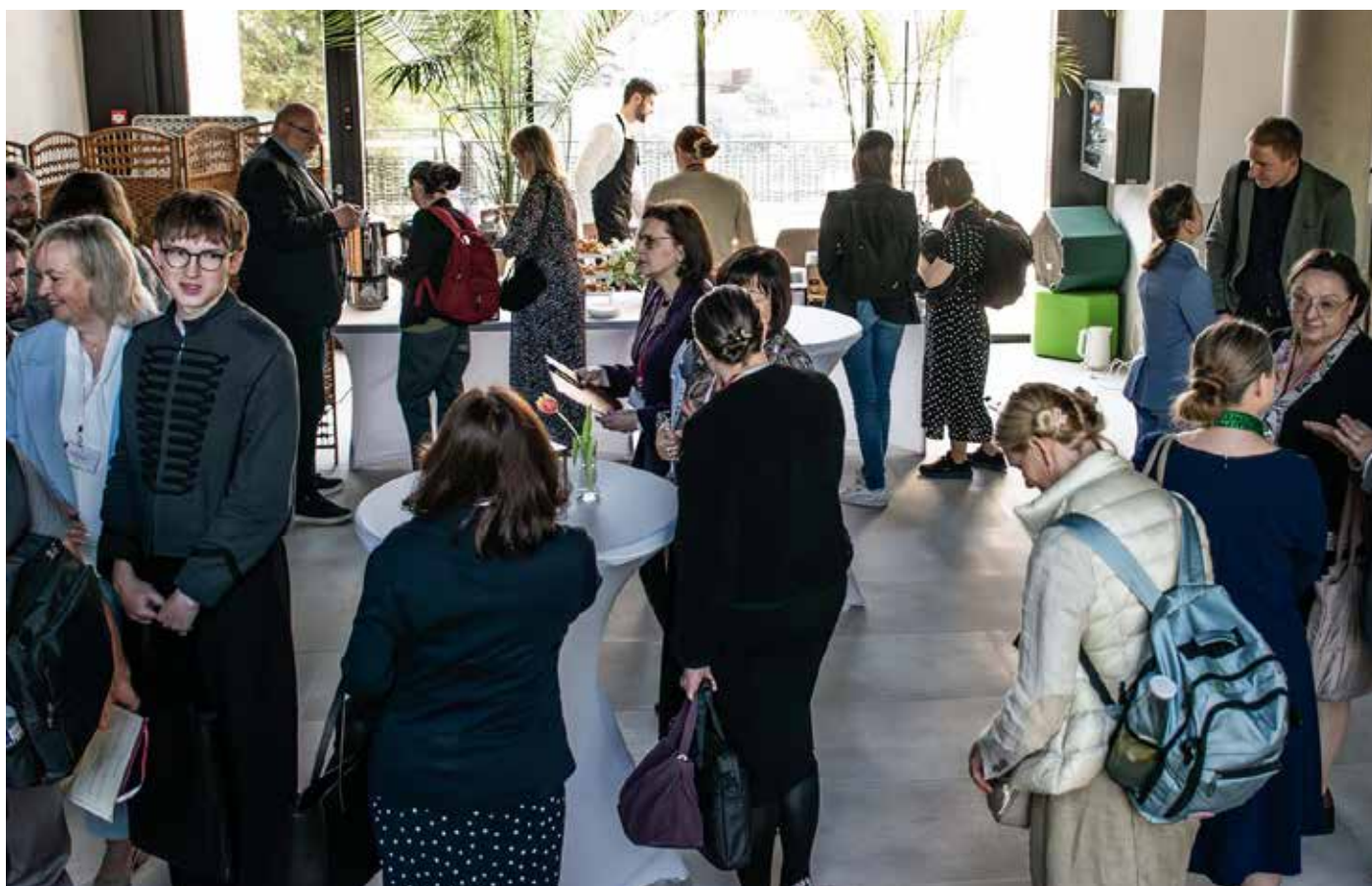
Konferencja studencko-doktorancka była okazją do wymiany kontaktów, także pomiędzy samymi studentami Fot. Diana Wołkanowska, oprac. A.K.

W Wilnie odbyła się konferencja studentów i doktorantów Uniwersytetu w Białymstoku. To dobra okazja, aby zapoznać się z polskimi organizacjami studenckimi działającymi w filii tej uczelni w Wilnie. Jak się dowiadujemy, jedna z czterech jest w trakcie reaktywacji.