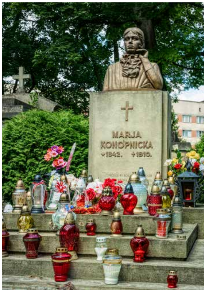
Grób Marii Konopnickiej na Cmentarzu Łyczakowskim we Lwowie