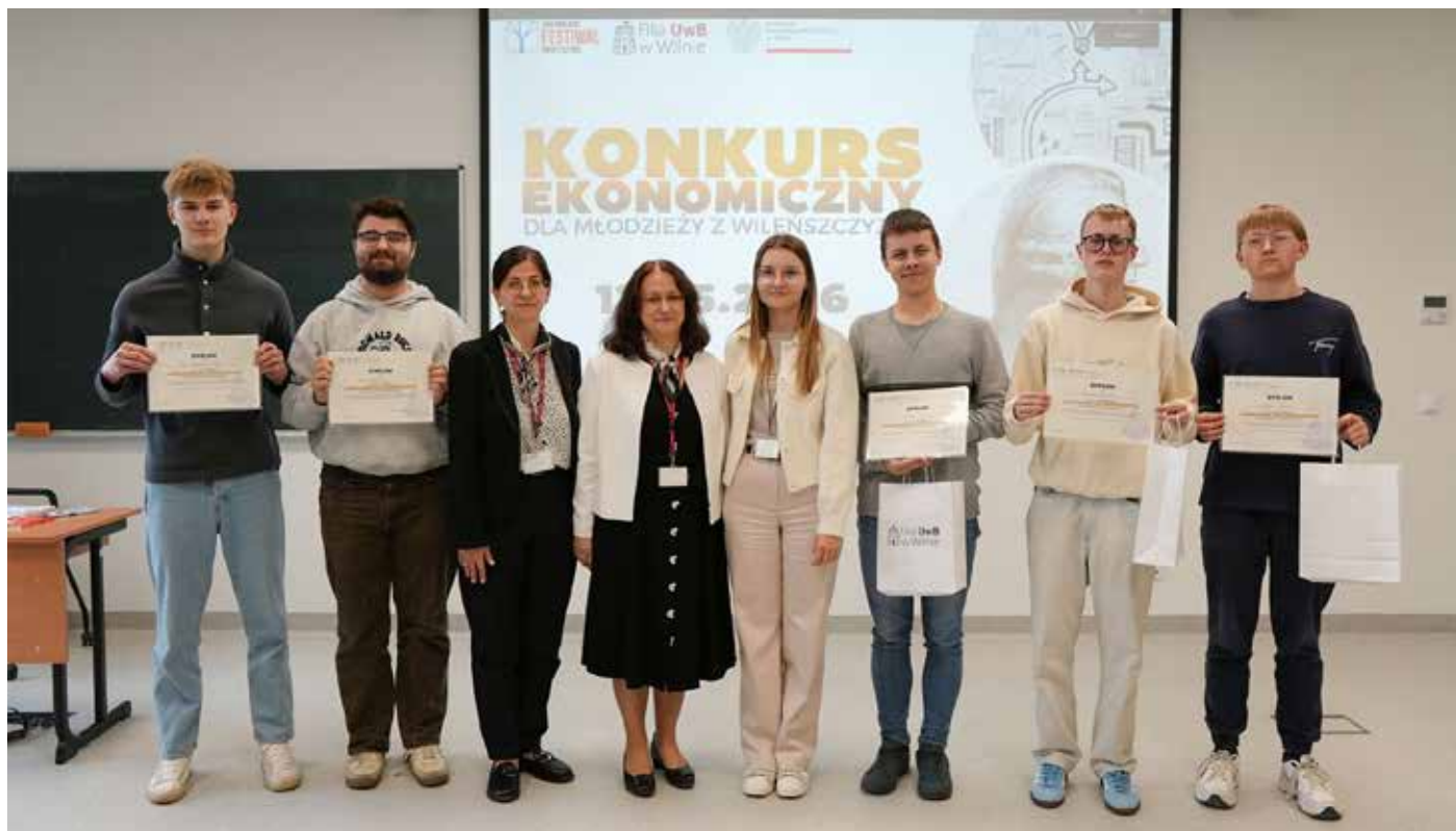
Koło Naukowe Ekonomii popularyzuje wiedzę, chociażby poprzez konkursy (na zdjęciu: laureaci tegorocznego konkursu ekonomii)

Patronem koła został wybrany Robert Schuman. Był on jednym z najważniejszych twórców integracji europejskiej po II wojnie światowej oraz współtwórcą idei dzisiejszej Unii Europejskiej. »