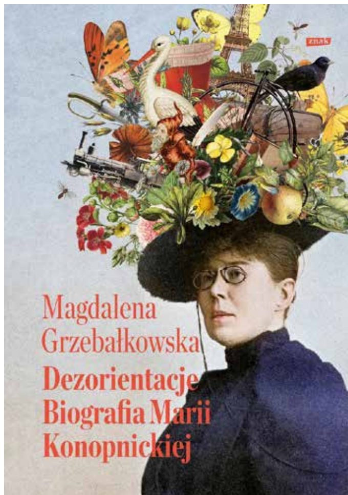
Książka Magdaleny Grzebałkowskiej została wydana w 2024 r.

Maria Konopnicka była niedawno bohaterką spotkania klubu czytelniczego „Akapity i Marginesy” – cyklicznych spotkań z literaturą, które odbywają się w DKP w Wilnie przy ul. Naugarduko 76.