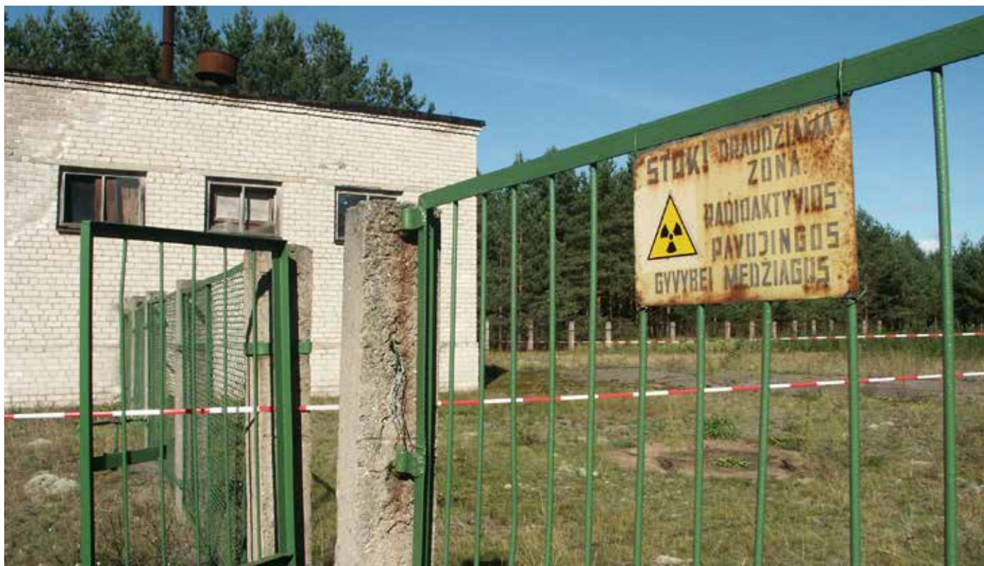
Uporządkowanie obiektu w Mejszagole ma znaczenie nie tylko praktyczne, lecz także symboliczne.