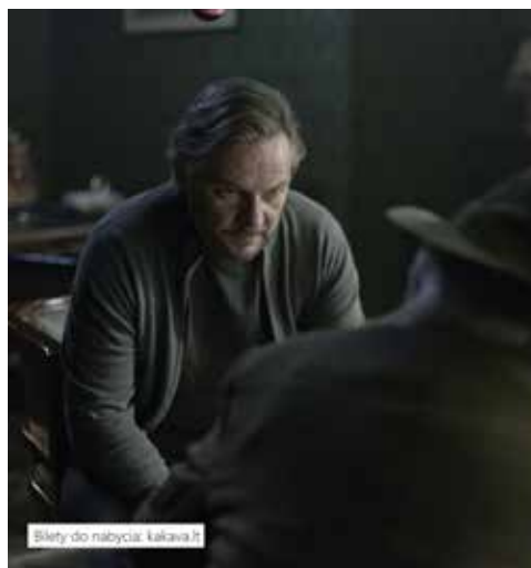
Bilety do nabycia: kultura.pl

Mężczyznom coraz trudniej odnaleźć się w szybko zmieniającym świecie. Rosnąca siła kobiet, zmiany kulturowe mają na to wpływ. Mam nadzieję, że nasz film daje nadzieję. ■