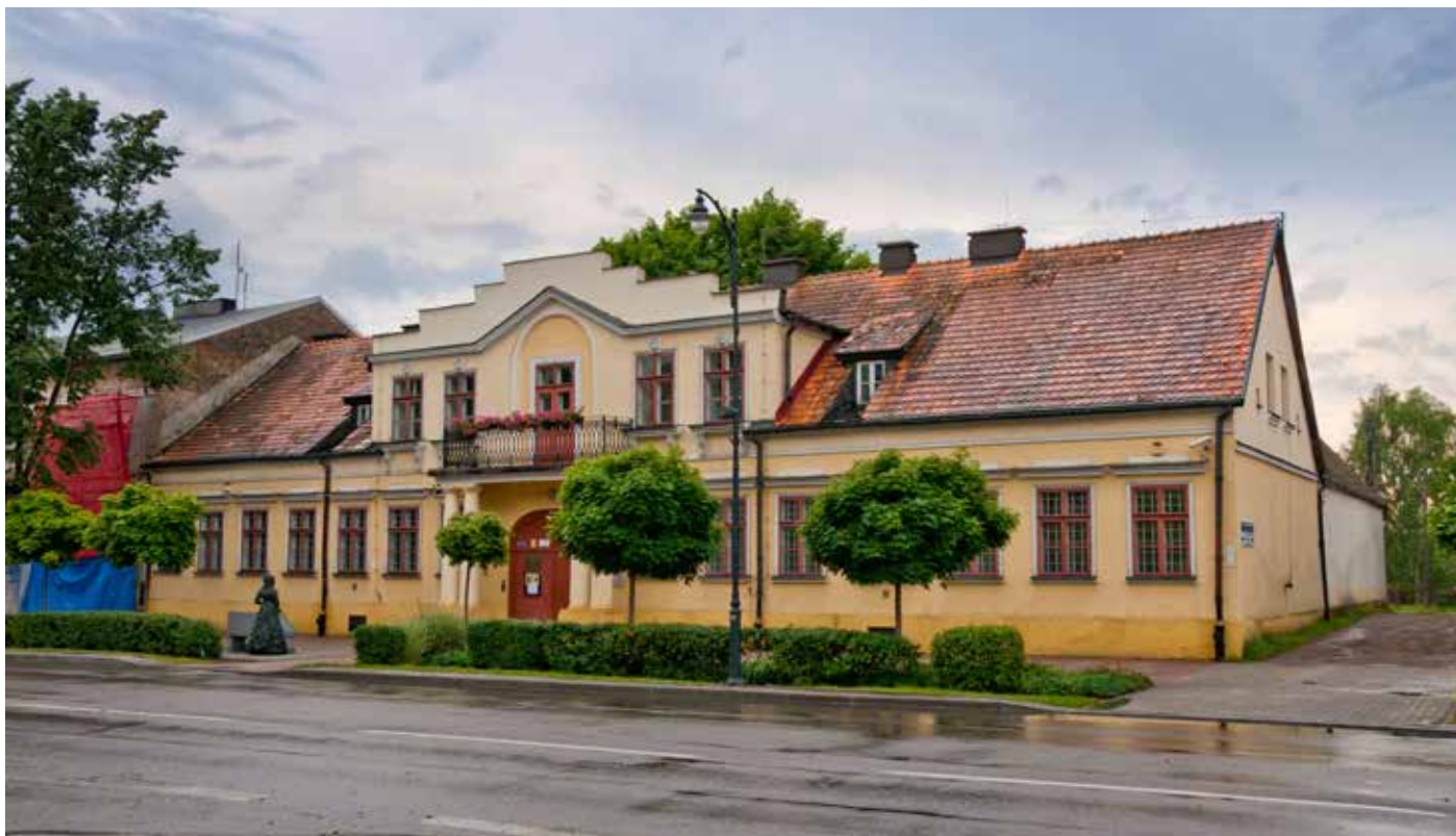
Dom narodzin Marii Konopnickiej w Suwałkach, obecnie mieści się w nim muzeum pisarki

Związek z Jarosławem umierał śmiercią naturalną. Marię coraz bardziej irytowały jego przywary i wady. Czytamy: „Była znudzona i osamotniona niczym zamknięty w klatce ptak”. Zabrała więc swoich sześcioro dzieci i opuściła męża, przenosząc się do Warszawy, gdzie zarabiała na życie korepetycjami i pisaniem. Jak napisze potem w jednym z autobiograficznych wierszy, nie mogła znieść dłużej ograniczeń, jakie narzucał ➤