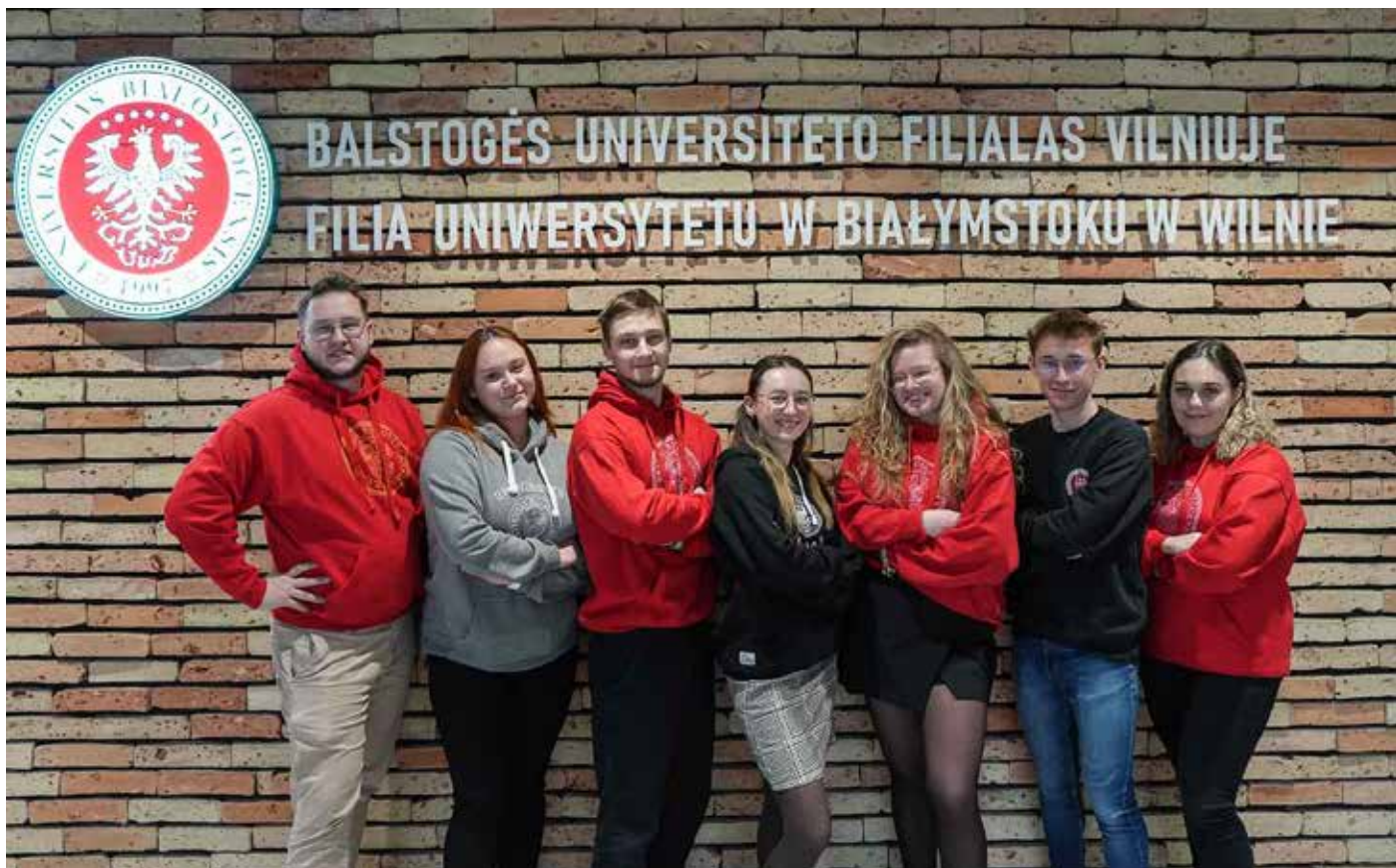
Samorząd Studencki jest swoistą kłamrą dla społeczności żaków w filii

Koło oficjalnie koncentruje się na trzech głównych filarach. Pierwszy filar to warsztaty, projekty i wspólne sesje kodowania. Studenci zdobywają wiedzę zarówno z podstaw pro- ➤