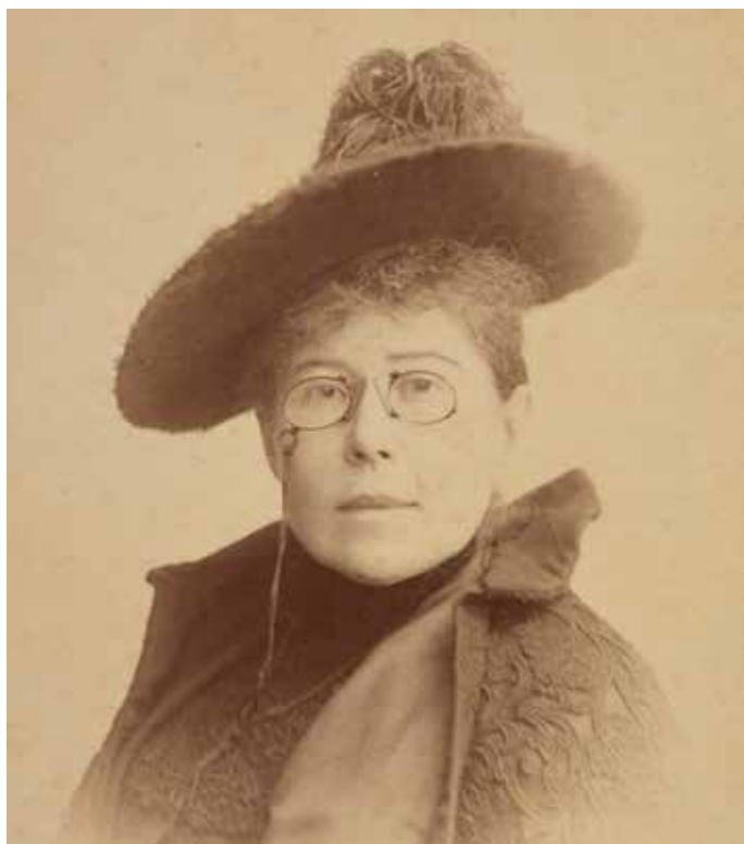
Portret fotograficzny Marii Konopnickiej, ok. 1897 r.