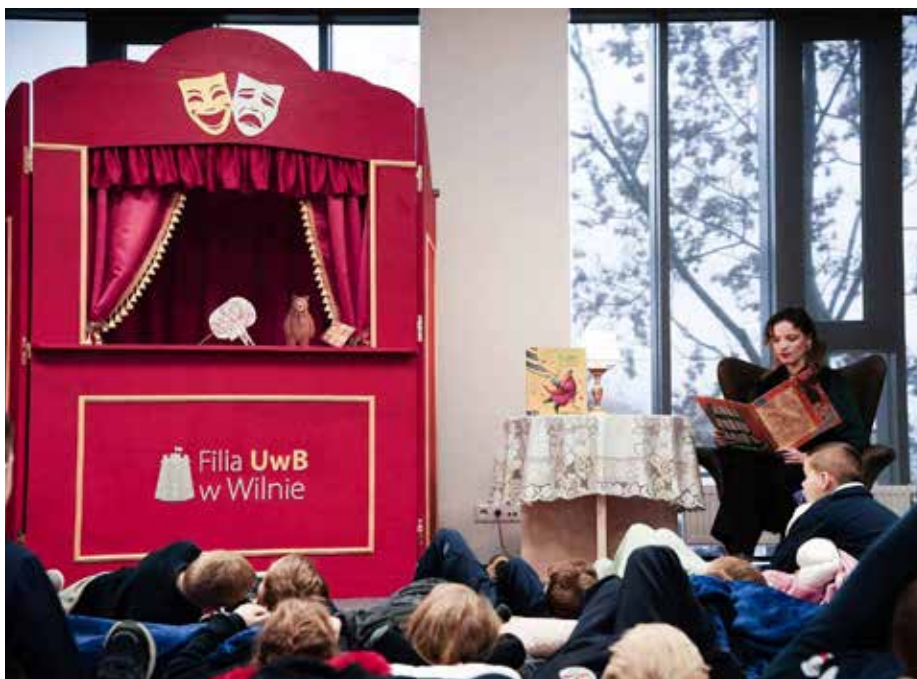
„Pedagodzy” organizują specjalne spektakle dla dzieci z polskich szkół

– Samorząd organizuje otrzęsiny [symboliczne powitanie pierwszorocznych studentów – przyp. red.], spotkania świąteczne, dekorowanie uczelni, a w tym roku po raz pierwszy przeprowadził również akcję krwiodawstwa [we współpracy z Polskim Stowarzyszeniem Medycznym na Litwie – przyp. red.]. Informacje dla studentów przekazywane są głównie za pośrednictwem mediów społecznościowych oraz podczas bezpośrednich spotkań na uczelni. Ważnym elementem działalności jest także współ-