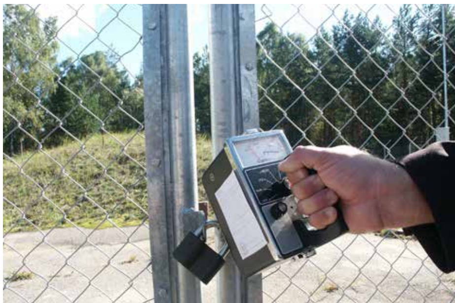
Większości dawnego składowiska nadano status „zielonego obszaru”, co oznacza, że spełnia ono wymogi bezpieczeństwa

W 2012 r. odbyło się na Litwie referendum w sprawie budowy elektrowni atomowej. Ponad 60 proc. głosujących opowiedziało się przeciwko budowie. ■