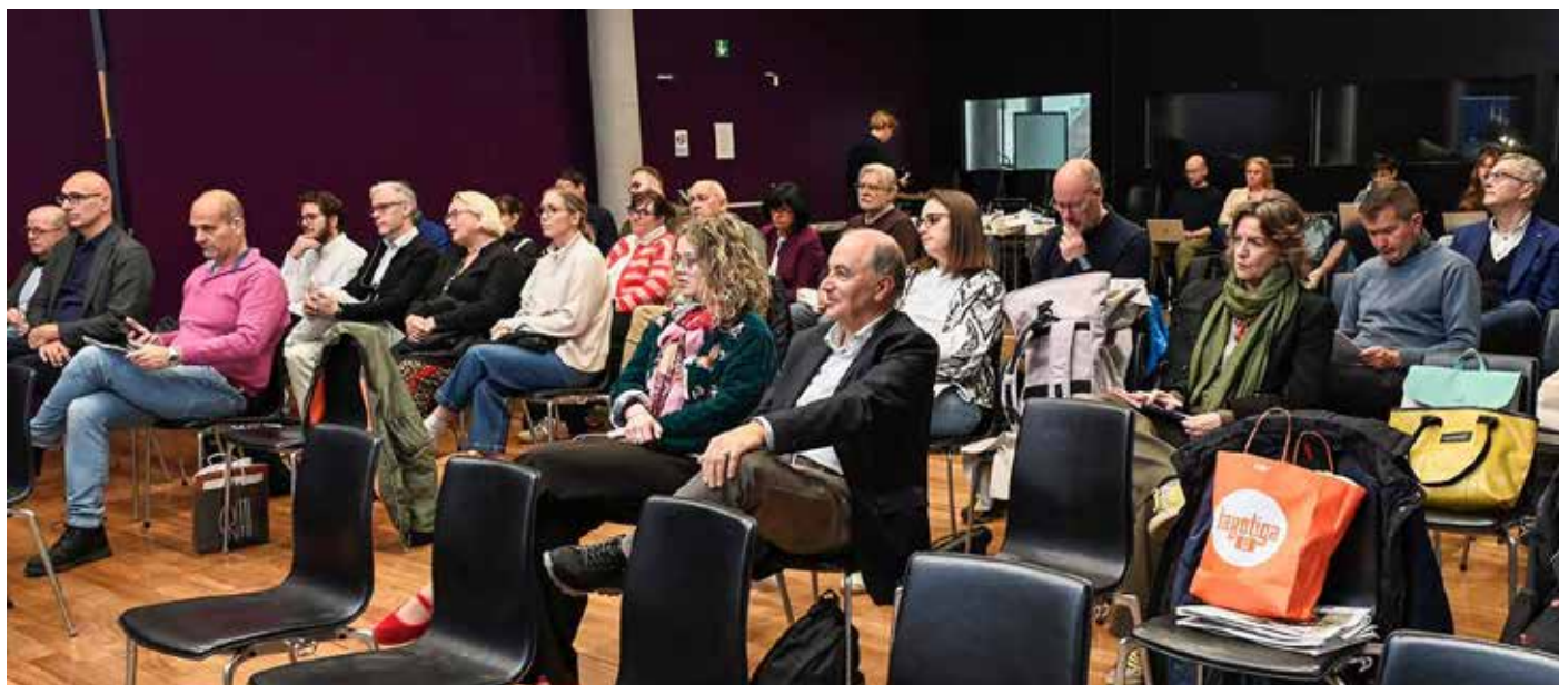
Zjazd zgromadził przedstawicieli 29 redakcji

Następny zjazd MIDAS w 2027 r. odbędzie się na Wyspach Alandzkich w Finlandii. ■