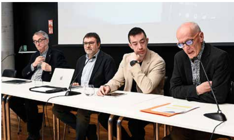
Odbył się specjalny panel dotyczący sztucznej inteligencji i języków mniejszości

Jedną z najważniejszych wiadomości dla całego środowiska było podsumowanie rocznej działalności grupy roboczej ds. sztucznej inteligencji. To pierwsza tego typu wyspecjalizowana struktura w ramach MIDAS, która zajmuje się wymianą doświadczeń w zakresie wykorzystywania nowych technologii w redakcjach mniejszościowych.