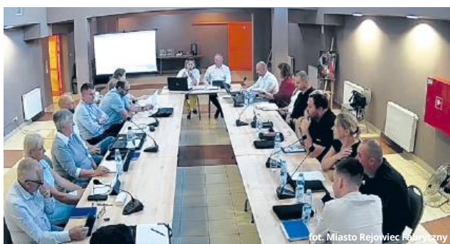
Sala Rady Miasta Rejowiec Fabryczny - sala konferencyjna

Jednogłośnie, ale po wcześniejszej dyskusji, została przyjęta uchwała dotycząca umieszczenia głazu i pamiątkowej tablicy w pobliżu obiektu dworca kolejowego w Rejowcu Fabrycznym. O co dokładnie pytali radni?