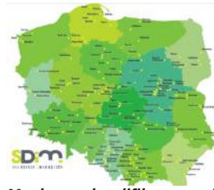
Mapka z zakwalifikowanymi szkołami

Tegoroczna edycja odbywa się pod hasłem „Porozmawiaj-MY o edukacji obywatelskiej”. Uczniowie i uczennice będą mieć