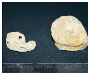
Ołów, z którego żołnierze odlewali zapasowe, karabinowe kule

uwagę zasługują dwa stosunkowo rzadkie zabytki. To niewielkie kęsy ołowiu, które pełniły funkcję swoistych „magazynków” używanego przez żołnierzy surowca. Były one przekazywane żołnierzom w ramach zaopatrzenia, a następnie – już w obozie – przetwarzane na pociski za pomocą tzw. kulolejek.