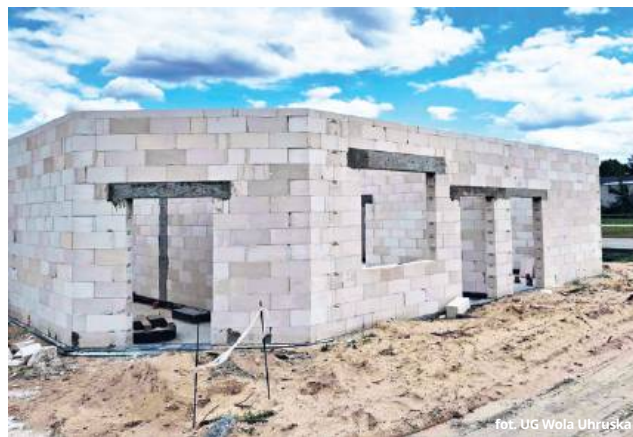
UJ Wola Uhruska

- Z satysfakcją obserwuję, jak szybko postępują prace budowlane – inwestycja rośnie w oczach i nabiera realnych kształtów. Budowa przedszkola i żłobka to nie tylko inwestycja w infrastrukturę, ale przede wszystkim w przyszłość – w edukację, rozwój i wsparcie lokal-