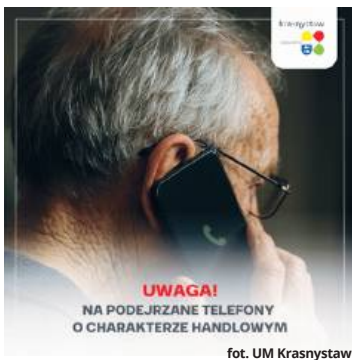
fol. UM Krasnostaw

● KRASNYSTAW W ostatnich dniach do mieszkańców Krasnegostawu docierają telefoniczne zaproszenia na rzekome spotkania organizowane z okazji Dni Krasnegostawu. Podczas rozmów osoby dzwoniące powołują się na wydarzenia miejskie, proponując udział w prezentacjach o charakterze handlowym. Urząd miasta wydał w tej sprawie oficjalny komunikat, w którym stanowczo odcina się od takich działań.