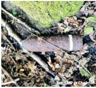
fol. KMP w Chełmie

GM. BIAŁOPOLE Podczas rutynowego obchodu lasu w gminie Białopole leśniczy natknął się na pocisk artyleryjski z okresu II wojny światowej. Na miejsce natychmiast wezwano patrol policji, który zabezpieczył teren do czasu przybycia saperów.