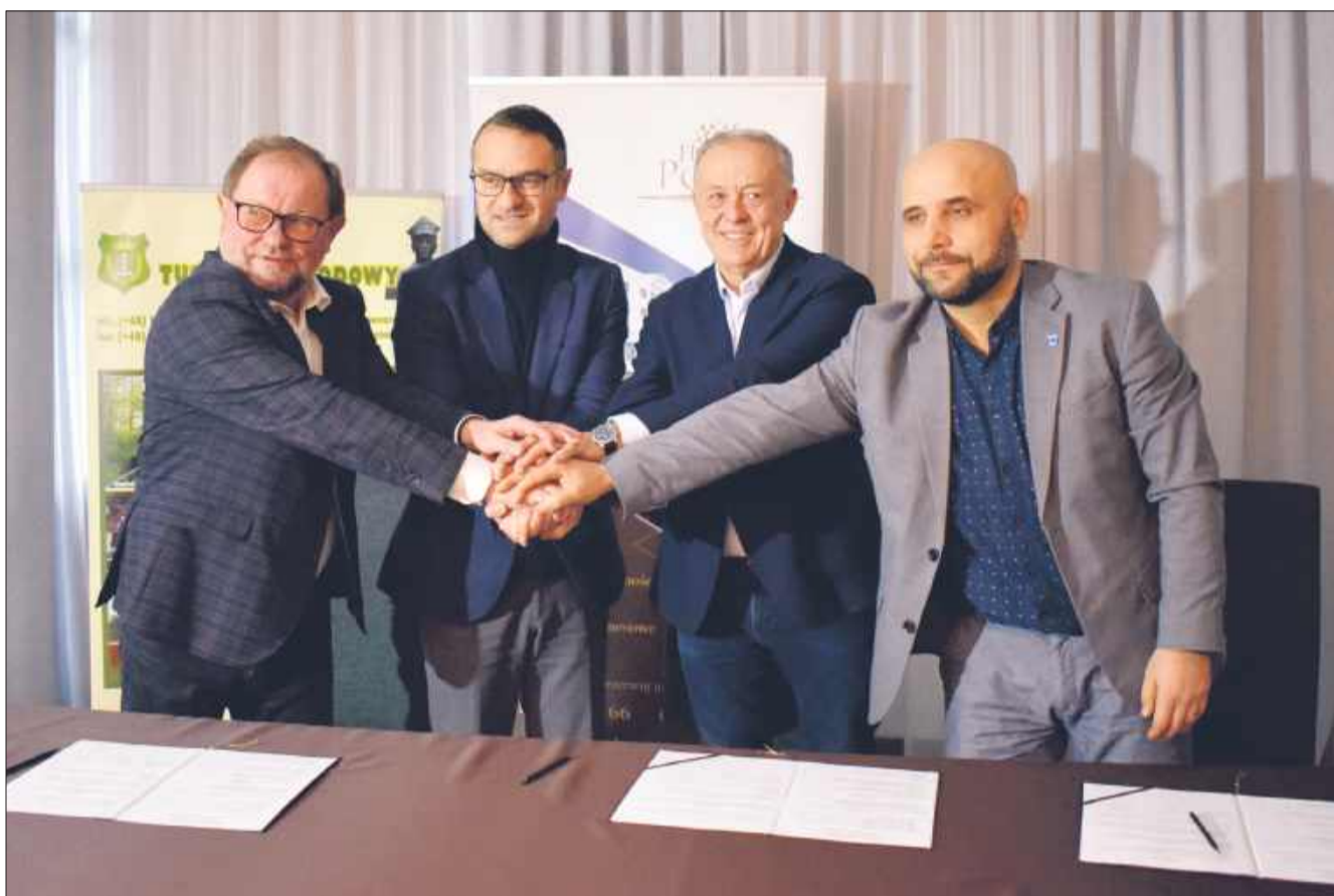
Centrum Treningowe Tuszów (CTT) jest odpowiedzią na rosnące potrzeby zarówno profesjonalnych drużyn, jak i mieszkańców regionu.

- Pomyśl narodził się w ubiegłym roku, gdy zakończyliśmy inwestycję w infrastrukturę sportową w naszej gminie. Chcieliśmy, by nasze obiekty służyły nie tylko mieszkańcom, ale też stały się częścią większego projektu regionalnego. Centrum