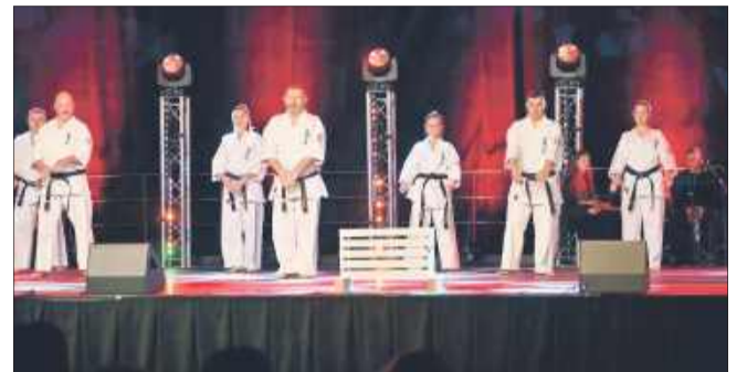
Pokaz sportowy w wykonaniu Mieleckiego Klubu Kyokushin Karate.