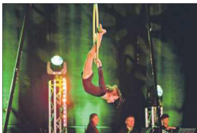
AKROMIELEC również zachwycił swoimi występami.