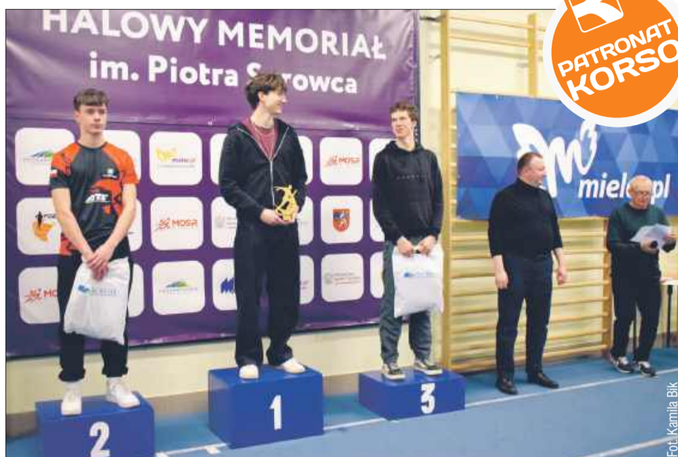
Nagrody wręczał m.in. prezydent Tomasz Leyko.

Serdecznie gratulujemy wszystkim zawodnikom za ich determinację i wysiłek. Szczególne wyrazy uznania kierujemy do zwycięzców poszczególnych