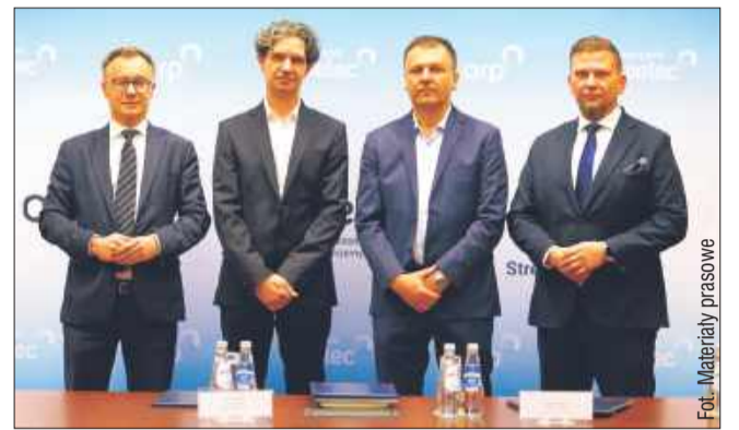
Decyzje o wsparciu są jednymi z najwyższych kwotowo przyznanych w ramach strefy mieleckiej.

Wręczone 9 stycznia dwie decyzje o wsparciu są jednymi