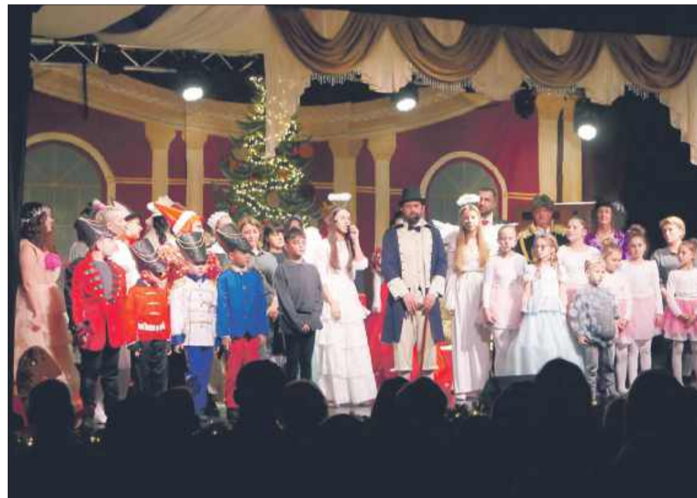
Przedstawienie zostało dopracowane w najdrobniejszych szczegółach.