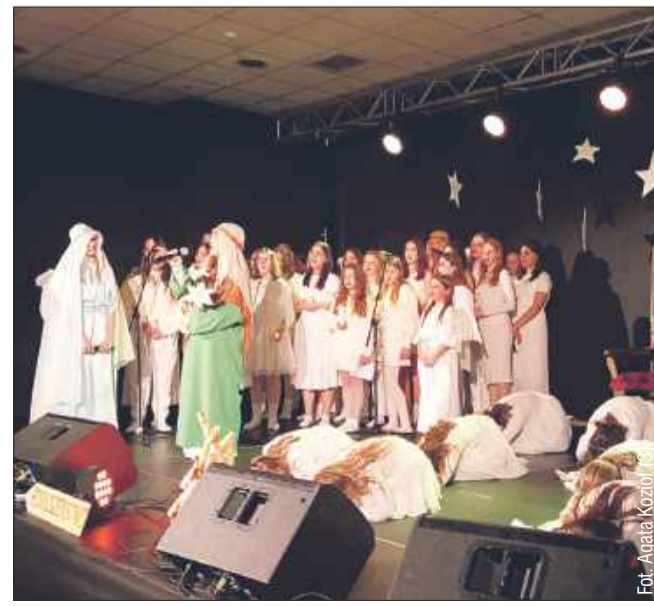
Jasełka w wykonaniu SP nr 13 w Mielcu.