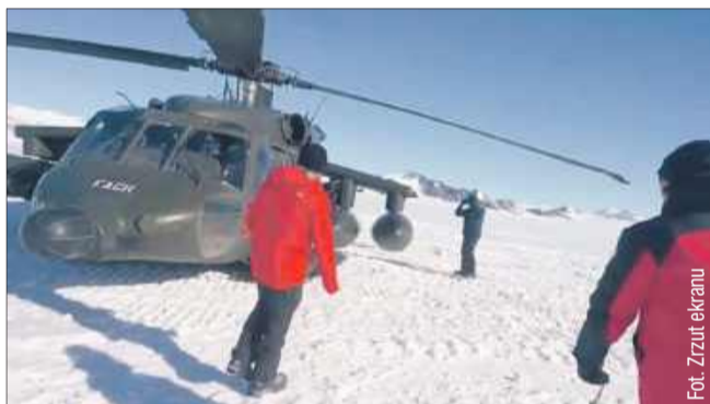
Helikoptery z Mielca dotarły aż na Antarktydę!

Helikopter z Mielca stał się uczestnikiem niezwykle wydarzenia! Dwa śmigłowce Black Hawk i dwa samoloty Twin Otter, należące do Chilijskich Sił Powietrznych wylądowały na biegunie w ramach operacji Estrella Polar III. Wyprawa, choć nie była pierwszą tego typu misją, zyskała historyczne znaczenie, ponieważ po raz pierwszy na biegunie południowym przetransportowano chilijską głowę państwa!