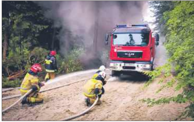
Na strażaków na służbie czeka wiele niespodzianek i wyzwań. Ćwiczenia pomagają w poznaniu schematów działań.

Wśród miejscowych zagrożeń znajdują się między innymi zagrożenia naturalne, takie jak powódzie, podtopienia, silne wiatry powodujące uszkodzenia budynków lub powalenie drzew,