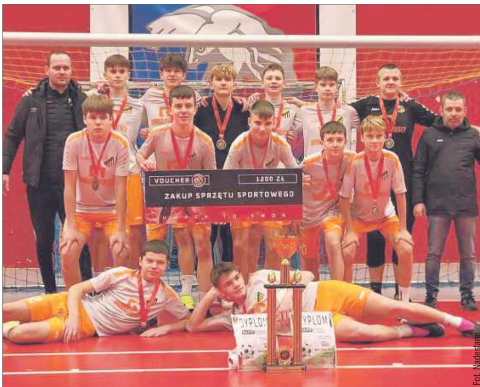
Kraków okazał się bardzo gościnny dla Plonu Kawęczyn.