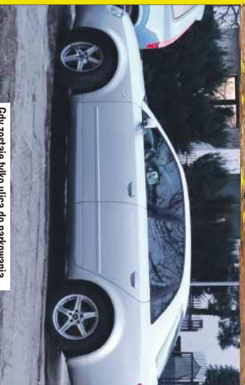
Gdy zostaje tylko ulica do parkowania...