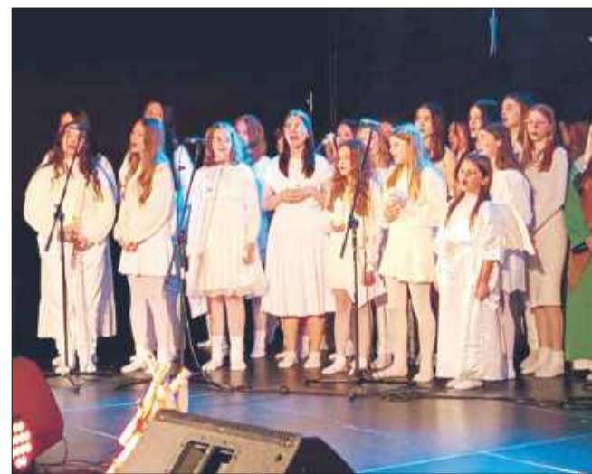
Na scenie pojawiło się mnóstwo aniołków.