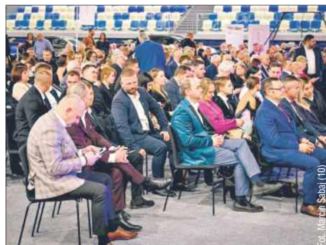
Na galę przybyli reprezentanci mieleckich klubów sportowych.