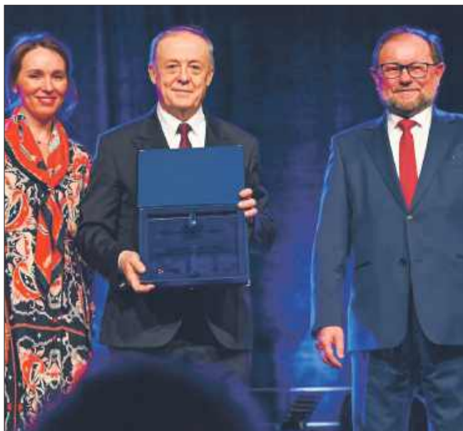
Inwestycja Roku dla gminy Tuszów Narodowy.