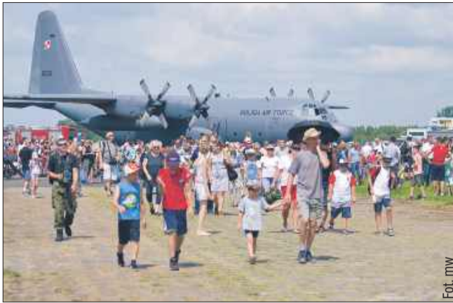
AirShow w Mielcu w 2018 roku. Wtedy lotnisko odwiedziło 40 tysięcy widzów. Jak będzie w tym roku?

– Na mieleckim niebie zobaczymy najlepszych polskich pilotów akrobacyjnych, historyczne maszyny oraz nowoczesne samoloty odrzutowe – zdradził