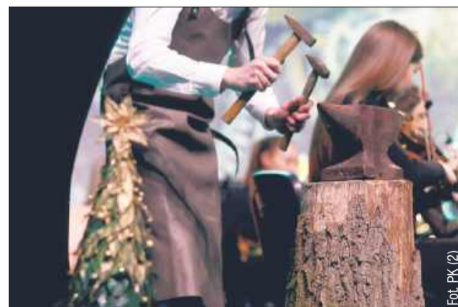
W jednym z utworów artysta wykonał na scenie partię... młotka!

wieczoru był występ dwóch par tancerzy, którzy w eleganckich strojach zatańczyli walca wiedeńskiego. Ich taniec, pełen lekkości i wdzięku, wspaniale uzupełnił muzyczną część koncertu, wzbudzając entuzjastyczne oklaski publiczności.