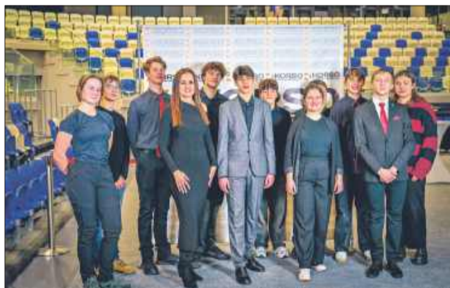
Przy organizacji gali duży wkład miała Młodzieżowa Rada Miejska w Mielcu na czele z opiekunem Moniką Cwiok. Dziękujemy!