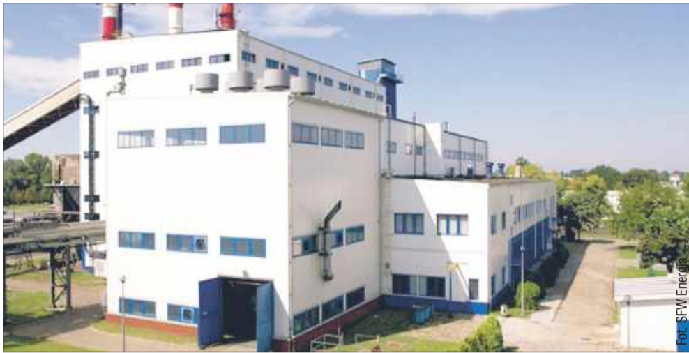
Do 2030 roku Elektrociepłownia Mielec musi zaprzestać spalania węgla.

Elektrociepłownia Mielec stoi przed przełomowym wyzwaniem. Zgodnie z unijnymi wymogami, do 2030 roku zakład musi ograniczyć emisję zanie-