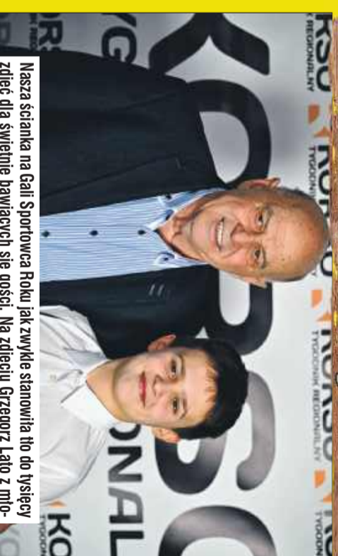
Nasza ścianka na Gali Sportowca Roku jak zwykle stanowiąła tło do tysięcy zdjęć dla świetnie bawiących się gości. Na zdjęciu Grzegorz Lato z mło-dym adeptem sportu.