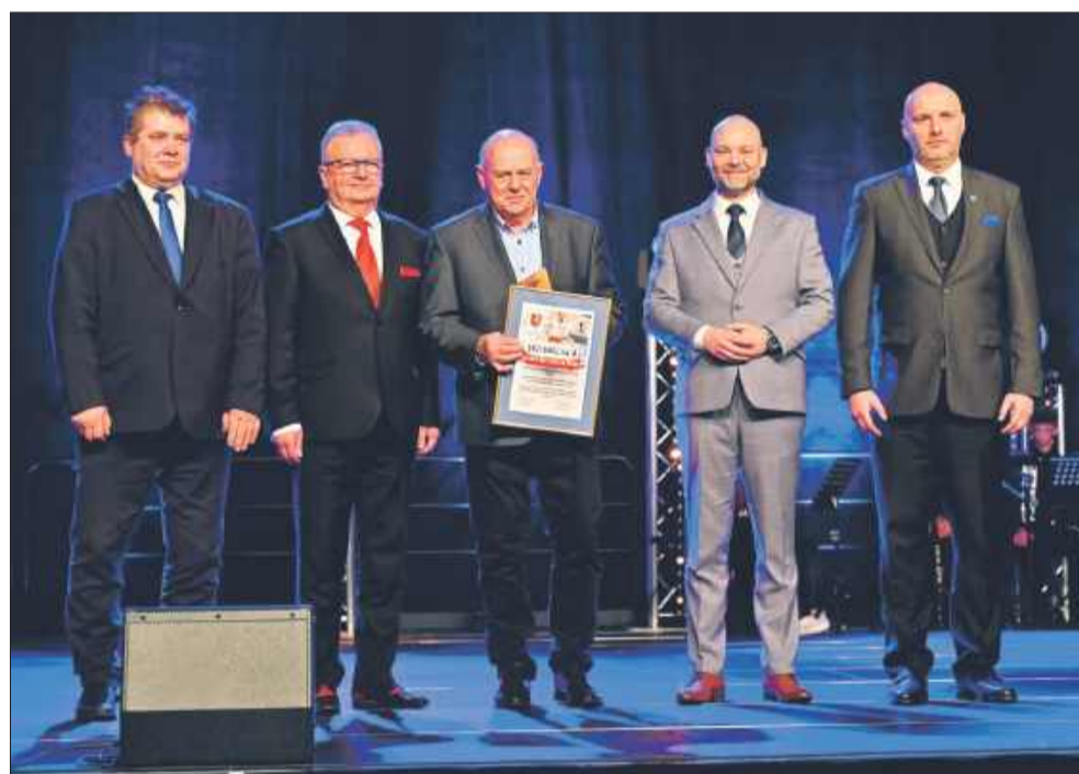
Legenda Mieleckiego Sportu - Grzegorz Łato. Uehonorowany przez władze miasta oraz powiatu.