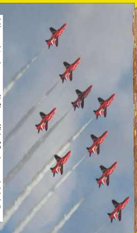
Jakie samoloty zobaczymy na Air Show w Mielcu? Przekonamy się już niedługo.