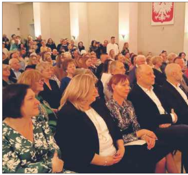
Sala wypełniła się po brzegi.