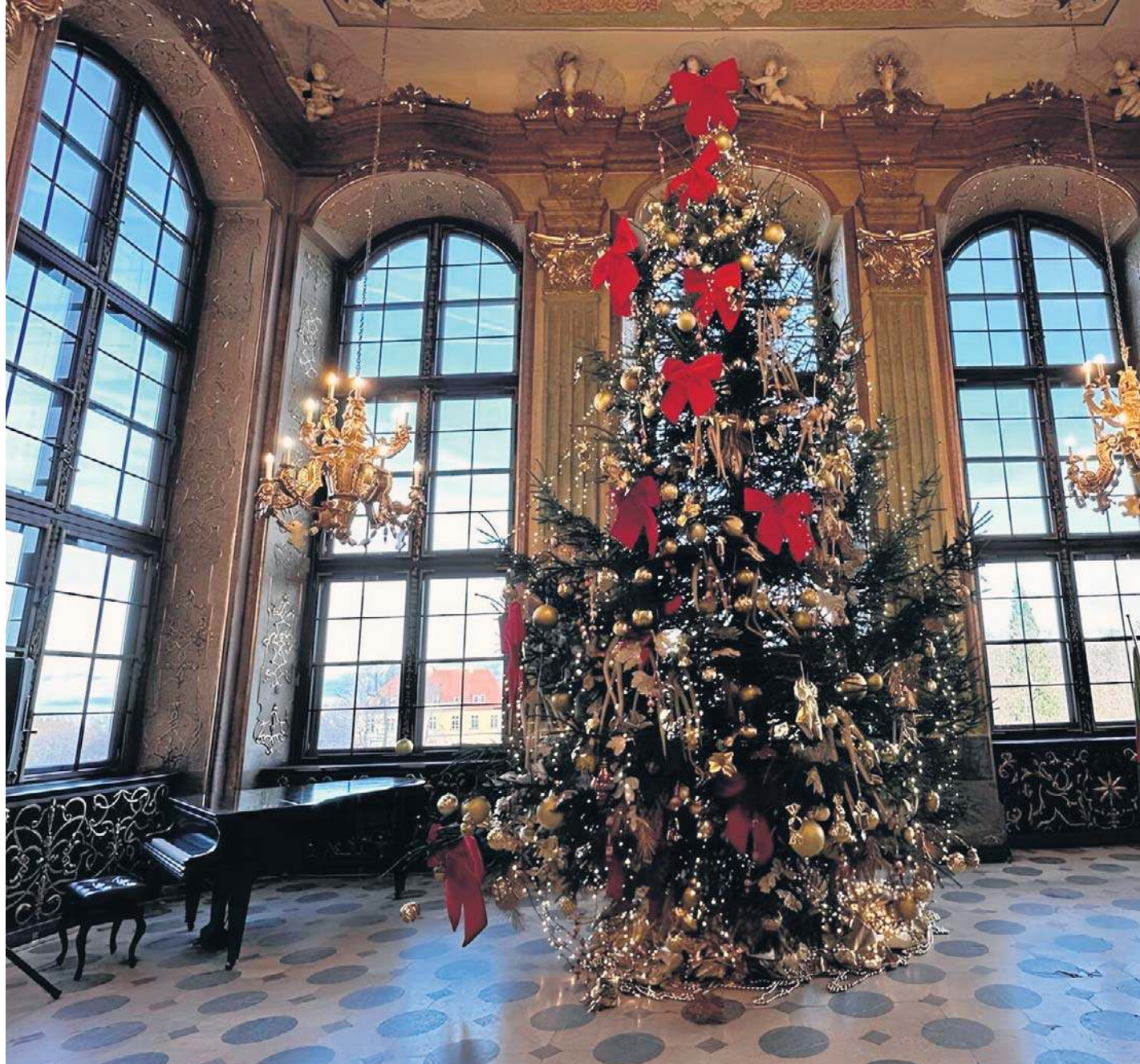
Wędrując przez Książ, odkrywamy aranżacje inspirowane tradycyjnymi świątami, motywami i królewską estetyką

2. Zwiedzanie z audioguide - propozycja łącząca świąteczne doznania z fascynującą historią zamku. Audioprzewodnik wprowadzi odwiedzających w świat księżęcych losów, tworząc spójną i nastrojową opowieść.