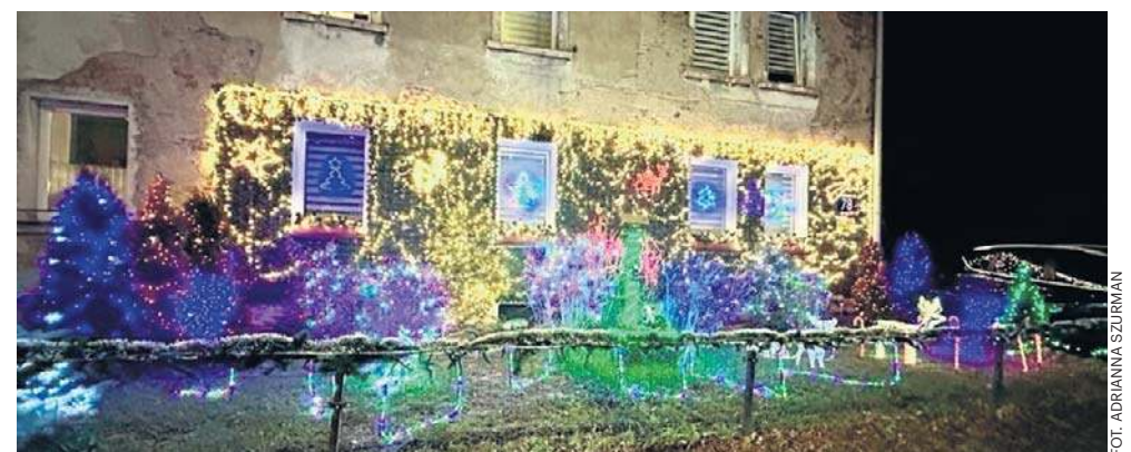
Griswoldowie z Wałbrzycha zapowiedzieli, że będą mieć 50 000 światełek