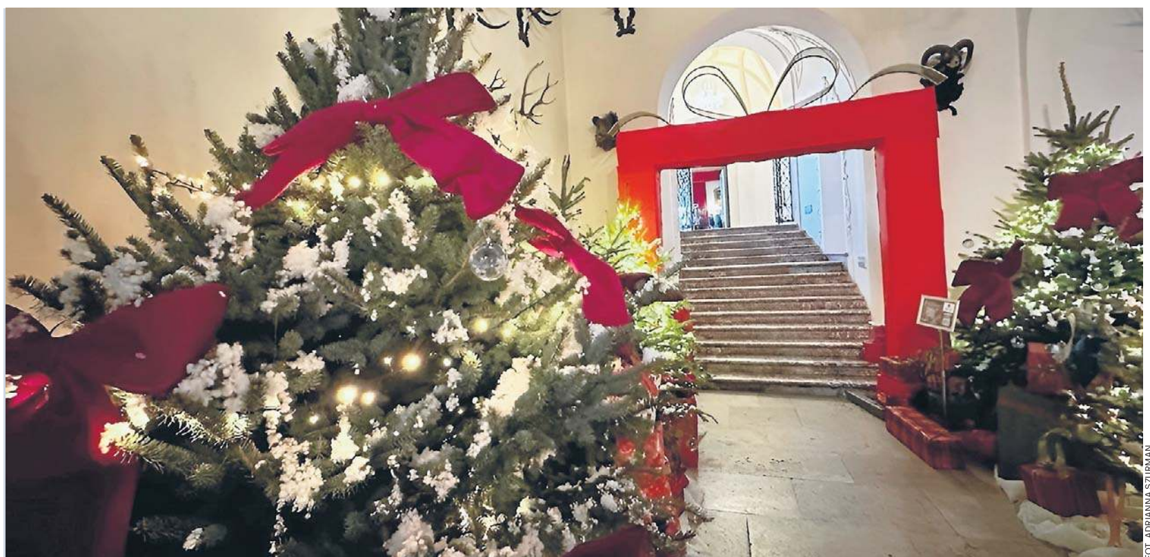
Wystawa zachwyca rozmachem, detalem i wyjątkową atmosferą