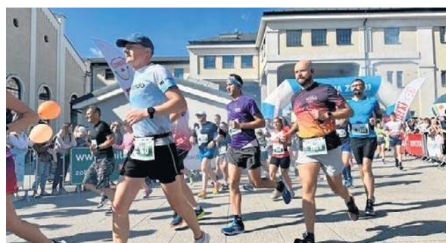
Tak startowano do 25. Toyota Eko Półmaratonu Wałbrzych

Zapisy do 26. Toyota Eko Półmaratonu Wałbrzych ruszą na początku 2026 roku.