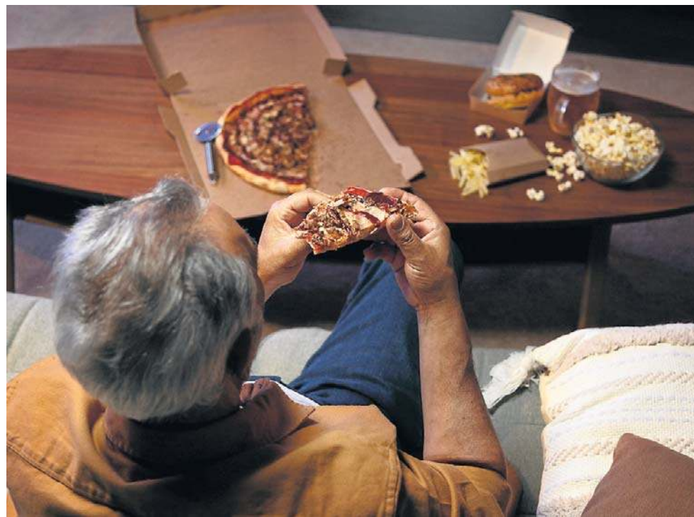
Osoby jedzące w pojedynkę częściej mają nieodpowiednią dietę, tracą na wadze i szybciej stają się kruchymi w sensie fizycznym i psychicznym. Szczególnie osoby starsze stają się słabsze i bardziej podatne na choroby, gdy jedzą posiłki same

Niedobory składników odżywczych również się kumulują. Badania wykazały, że osoby jedzące samotnie spożywały mniej białka, potasu, witaminy A i innych kluczowych składników odżywczych – czytamy w bada-