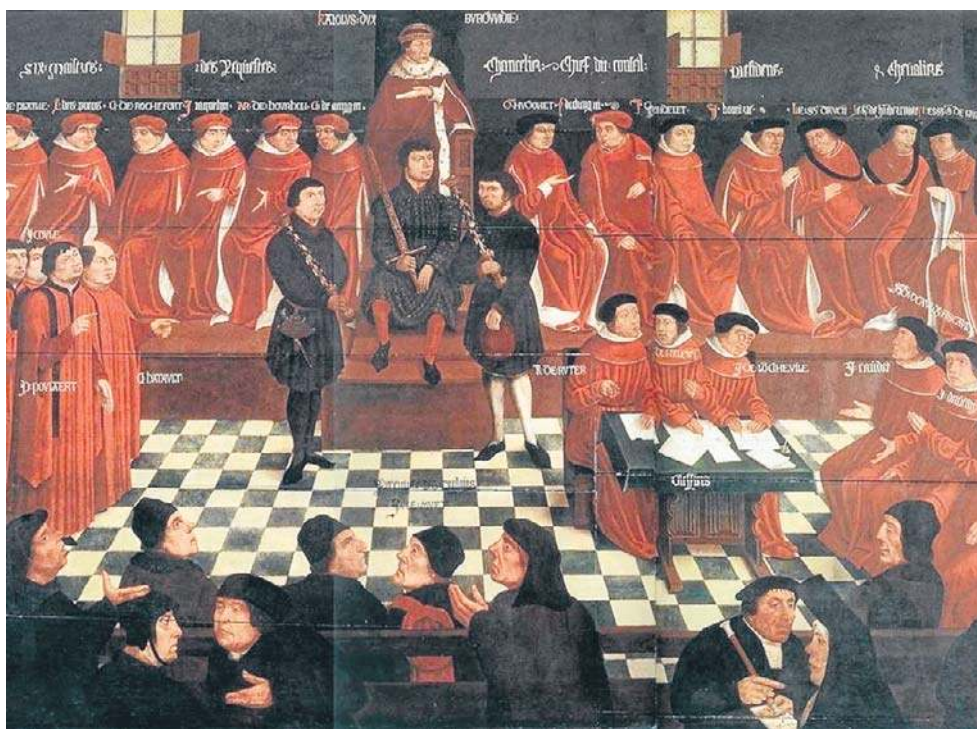
Sobór rozpoczęło w 1545 r. 66 uczestników kardynałów, arcybiskupów i generałów zakonnych

Lapowiedział go papież Paweł III bullą „Laetare Ierusalem” („Raduj się Jerozolimol!”) z 19 listopada 1544 r., określając następujące cele przyszłego soboru. Były nimi: wytopienie herezji, odnowienie dyscypliny kościelnej i poprawa obyczajów, oraz wprowadzenie zewnętrznego pokoju w całym Kościele. Słusznie zatem nazwano ten sobór „kontreformatywnym”.