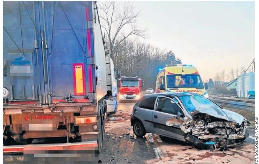
Niestety pomimo ciągłych akcji i apeli policjantów, część kierowców wciąż jeździ brawurowo i nie przestrzega przepisów

Gmina Głuszycza apeluje do osób, które wsparły fałszywą zbiórkę, o kontakt z Komisariatem Policji w Głuszycy przy ul. Grunwaldzkiej 85 - osobiście lub telefonicznie (tel. 47 87 575 00). Każdy sygnał pomoże w wyjaśnieniu sprawy. EW