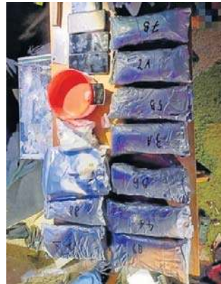
Zabezpieczono blisko 9 kg narkotyków

- Podczas przeszukania funkcjonariusze w jednym z pomieszczeń mieszkalnych ujawnili rozsypany na stole biały proszek, który po przebadaniu okazał się amfetaminą. Zabezpieczono także kilka paczek wypełnionych białą substancją - testy w laboratorium potwierdziły, że również była to amfetamina. Wstępnie oszacowano, że czarnorynkowa wartość zabezpieczonych