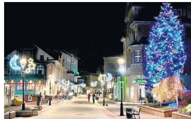
Po zmroku Szczawno-Zdrój rozbłyska feerią świątecznych barw

- Mamy dwie ważne zmiany w regulaminie: uściślono, że kategoria „Balkon” obejmuje nie tylko balkon, ale całą przynależną do mieszka-