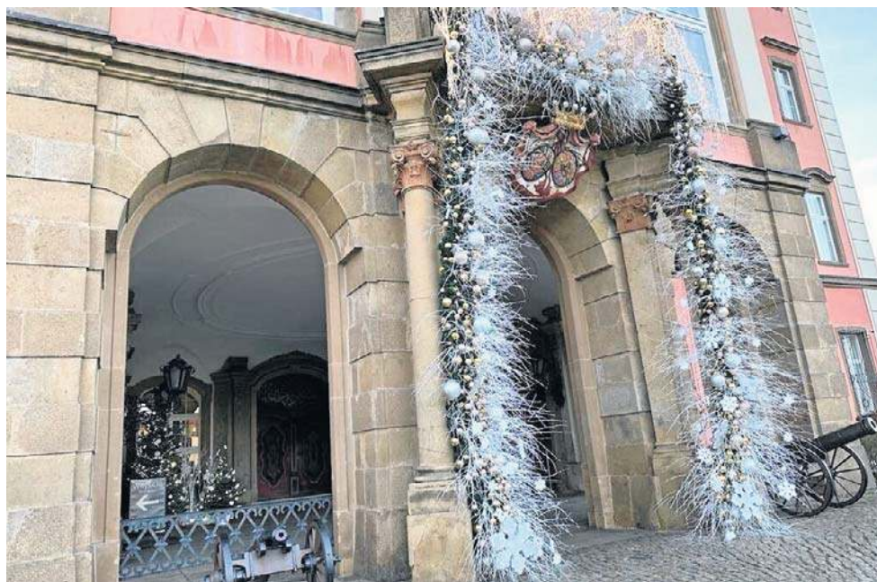
Wchodząc do zamku, od pierwszego kroku czujemy, że trafiliśmy do świata, gdzie każdy detal został dopracowany z mistrzostwem