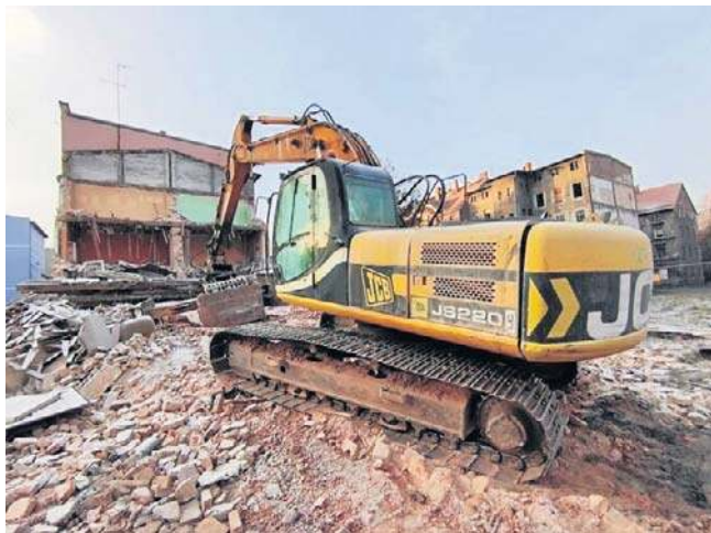
Prowadzone obecnie trzy rozbiórki to jedne z działań zaplanowanych na kończący się rok 2025