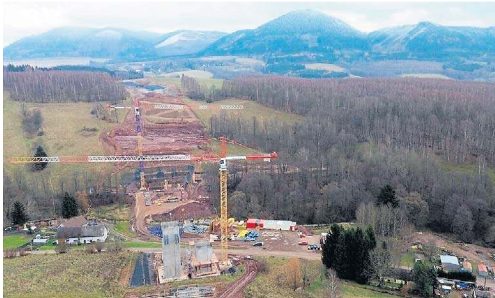
Budowa mostów i wiaduktów w pobliżu miejscowości Bernartice. Na tym odcinku D11 pracują już potężne żurawie, powstają pierwsze betonowe konstrukcje - podpory przyszłych wiaduktów.

Dziś musimy ten odcinek pokonywać również w 4 godziny. Drogą A4 i S3 po stronie polskiej, a następnie przez długi odcinek, lokalnymi drogami w Czechach. Minęło już ponad 2 lata od otwarcia polskiego fragmentu drogi ekspresowej S3 do granicy z Czechami, tu kończy się komfor-