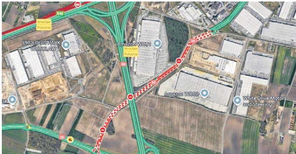
Fragment drogi krajowej nr 35 Wałbrzych-Wrocław, który został wyłączony z ruchu w obu kierunkach

- drugie to skrzyżowanie z ul. Wrocławską biegnącą do Tyńca Małego.