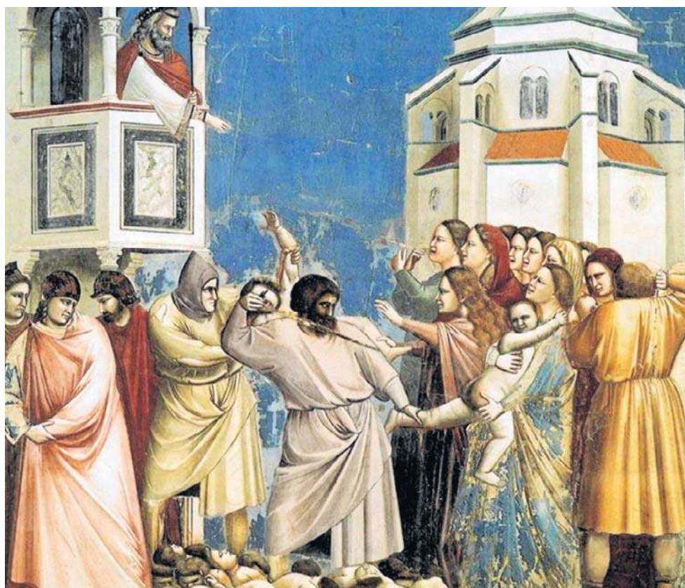
Rzeź niewiniątek – fresk Giotto di Bondone z ok. 1305 r. W oknie wieży stoi Herod

Co dużo gadać: Herod był psychopatycznym okrutnikiem. Dopuścił się wielu mordów, poszukując rzeczywistych lub domniemych spisków mogących pozbawić go władzy. Prócz Mariamne zamordował też swojego pierwotnego syna