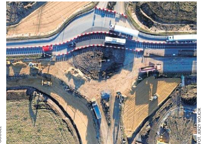
Trwa rozbudowa ronda na drodze krajowej. Wprowadzono objazdy, które zwiększyły ruch i spowodowały korki na węźle bielańskim

- Całkowicie zamknięty jest ponad 1,5-kilometrowy odcinek drogi krajowej nr 35 pomiędzy Bielaniami Wrocławskimi a Tyńcem Małym - informuje Generalna Dyrekcja Dróg Krajowych i Autostrad. - Objazd tego fragmentu prowadzi drogą