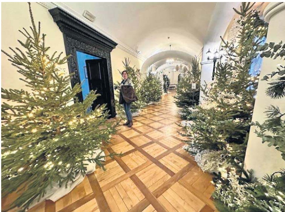
Komnaty, korytarze i sale zamku rozświetliły tysiącami lampek