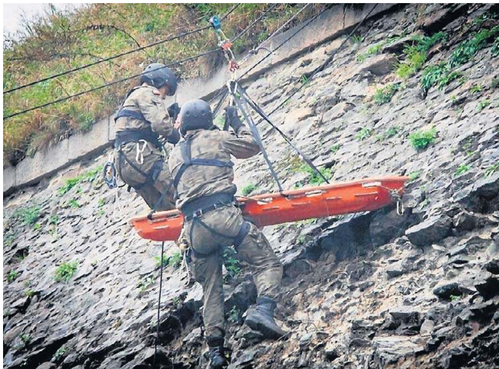
Zawody ratowniczo-taktyczne WINTERTIDE odbyły się w Twierdzy Kłodzko

- Na miejscu natychmiast udzielono poszkodowanym niezbędnej pomocy, a następnie powiadomiono pogotowie ratunkowe oraz policję. Zabez-