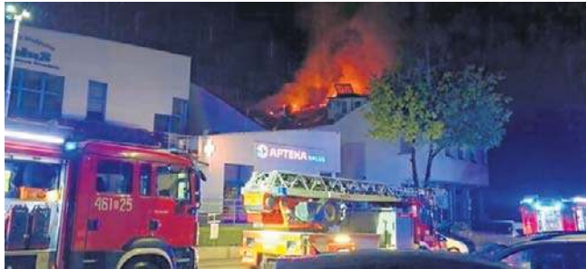
Pożar przychodni w Kłodzku (zdjęcie archiwalne)