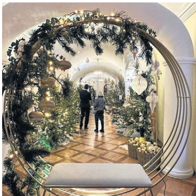
Każde pomieszczenie opowiada inną zimową historię