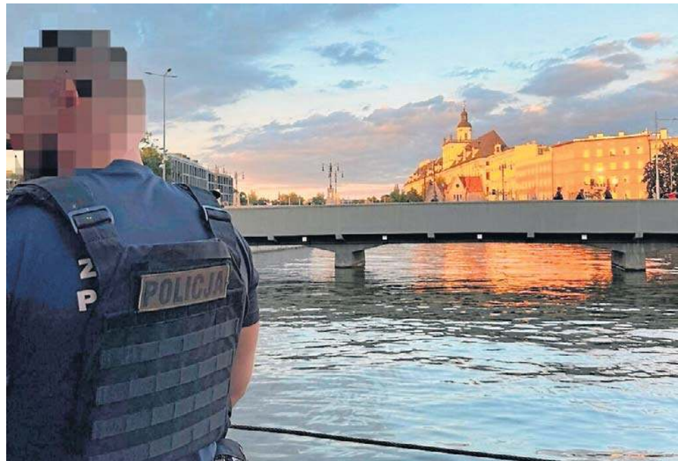
Ciało licealisty wyłowiono z Odry w rejonie ulicy Nowy Świat we Wrocławiu