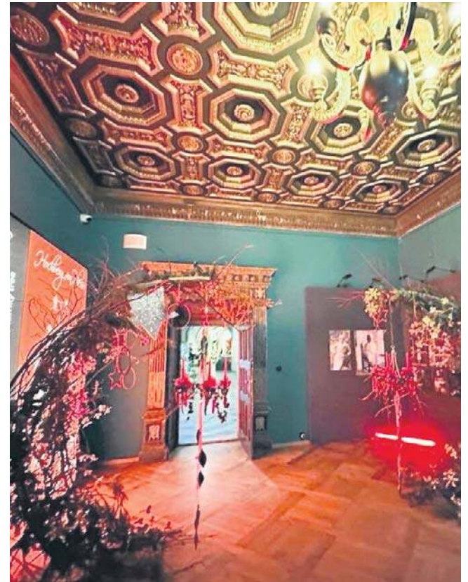
Hasłem tegorocznej wystawy jest Royal Christmas - połączenie klasycznej świątecznej atmosfery z nutą królewskiej elegancji