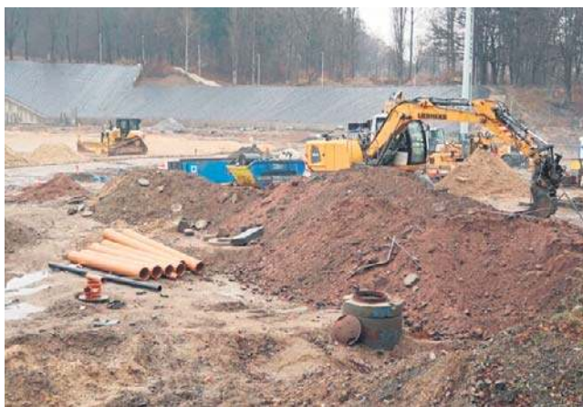
Plac budowy w grudniu 2025

- Teraz prace trwają głównie budynku tworzonemu na zapleczu stadionu. Wewnątrz powstają posadzki,