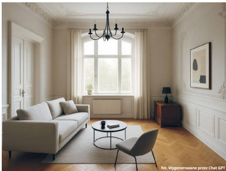
fot. Wygenerowane przez Chat GPT