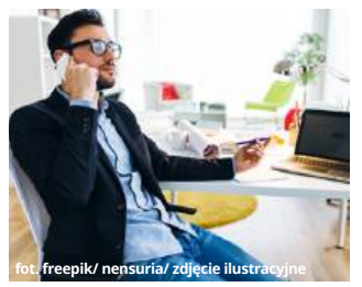
zdjęcie ilustracyjne

Z kolei 20 listopada o godz. 10:00 w Krasnymstawie i Cheł-