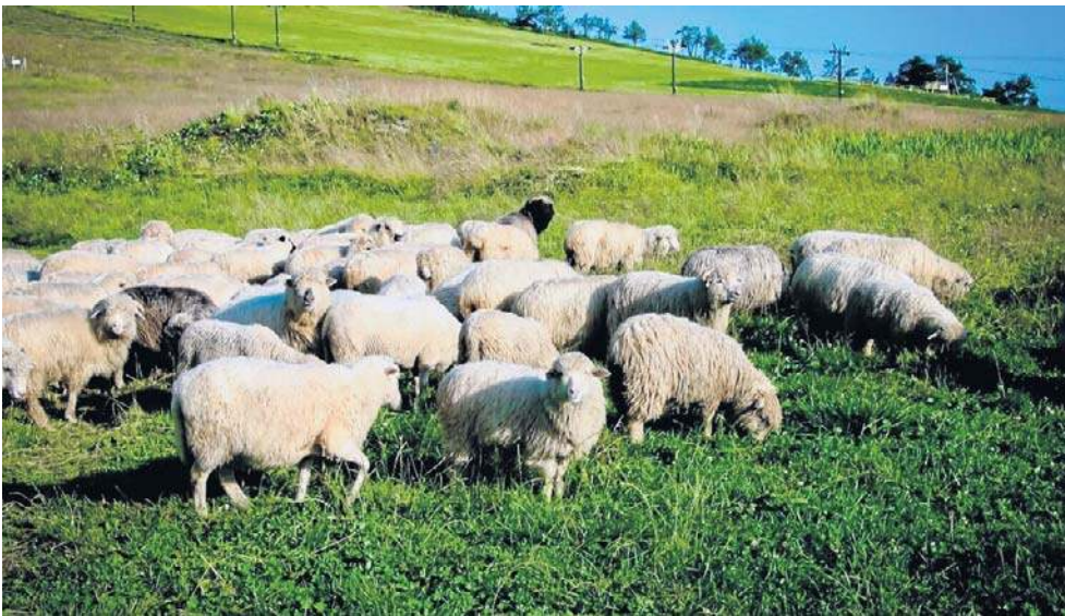
W Górach Sowich od lat jest prowadzona hodowla owiec. Trafiły tutaj z Podhala.