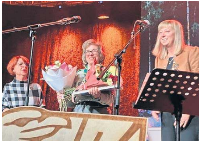
Sala Łańcuskowa była wypełniona po brzegi członkami ZHP - obecnymi i byłymi - ich bliskimi oraz sympatykami.

szczytnego tytułu Zasłużony dla Miasta Wałbrzycha. Warto dodać, że w mieście działa również Rada Przyjaciół Harcerzy. Byli również radni i pracownicy UM w Boguszowie-Gorcach oraz podległych mu jednostek, bez których harcerstwo w mieście pod Dzikowcem po prostu by nie istniało.