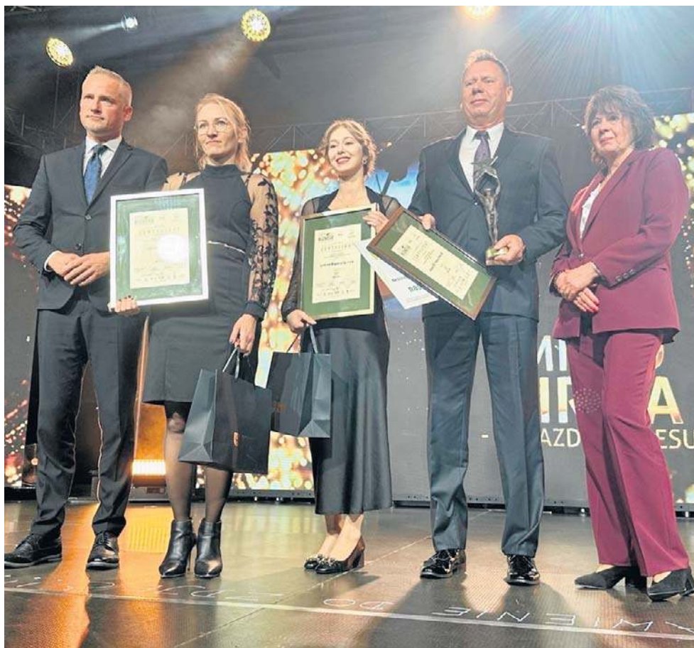
Za Gwiazdami Biznesu stoją ludzie, którzy łączą pasję, odpowiedzialność i odwagę.

Zwycięzcami Gwiazd Biznesu 2025 w poszczególnych kategoriach zostali: