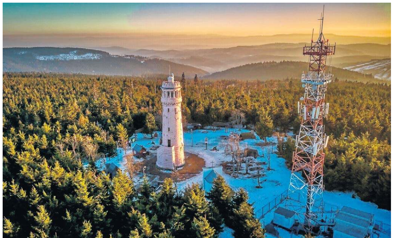
Najwyższym szczytem pasma jest Wielka Sowa (1015 m n.p.m.). Na jej szczycie znajduje się 25-metrowa wieża widokowa.