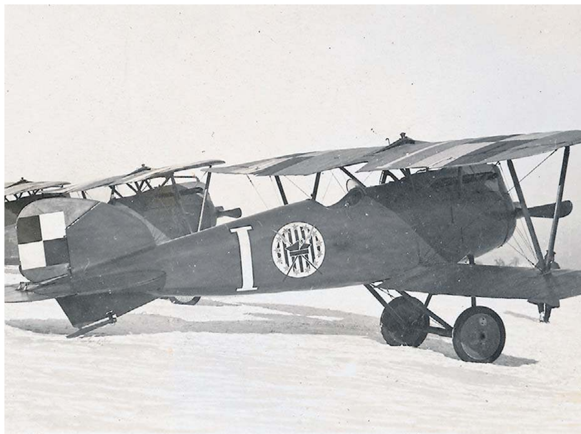
Albatrosy DIII w wersji Oeffag serii 253 były pierwszymi myśliwcami Eskadry Kościuszkowskiej.