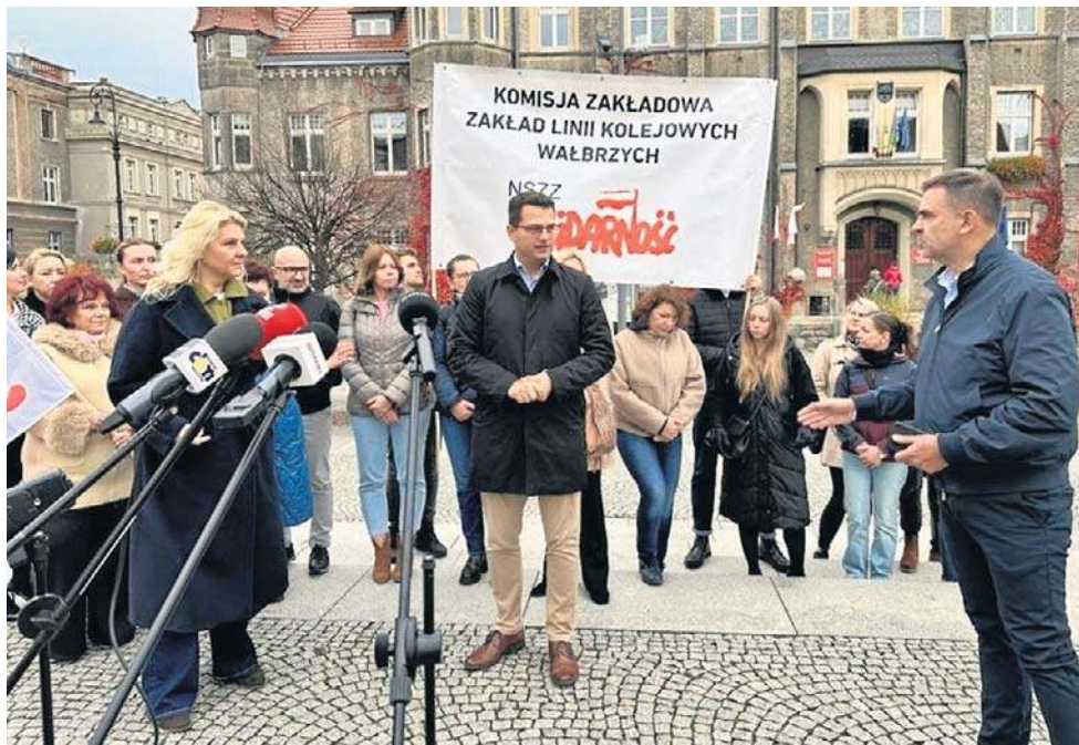
Protest pracowników Zakładu Linii Kolejowych w Wałbrzychu przeciwko likwidacji ZLK.

- Nawet jeśli dostaniemy propozycję przejścia do zakładu we Wrocławiu, to nie wszyscy będą mogli tam dojeżdżać. Poza tym tu mamy swoje rodziny, życie. Wiemy też z doświadczenia, że zazwyczaj taka reorganizacja oznacza likwidację miejsc pracy. Przecież wiele naszych stanowisk się zdubluje. Możemy dostać propozy-