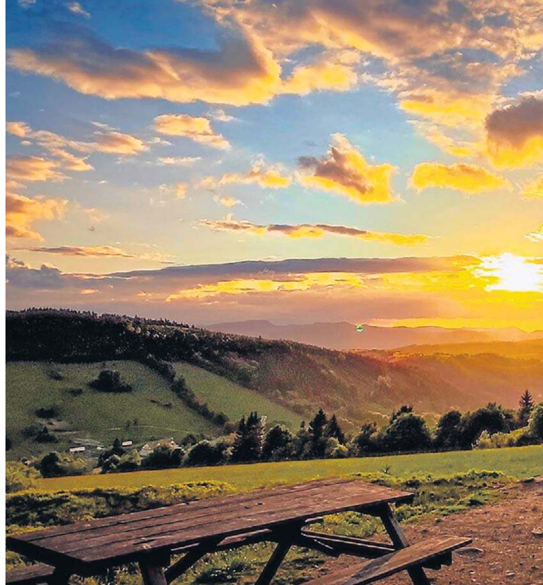
Góry Sowie są jednymi z najbardziej malowniczych w Polsce. Od przełęczy Woliborskiej aż po prz