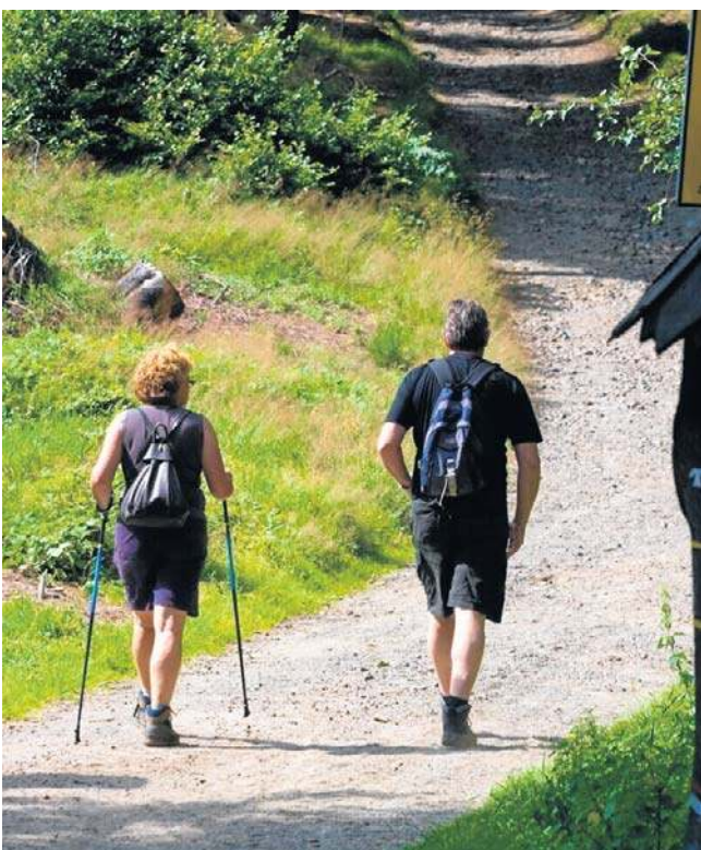
Entuzjaści pieszych i rowerowych wędrówek mają do wyboru wiele wygodnych, urokliwych szlaków.