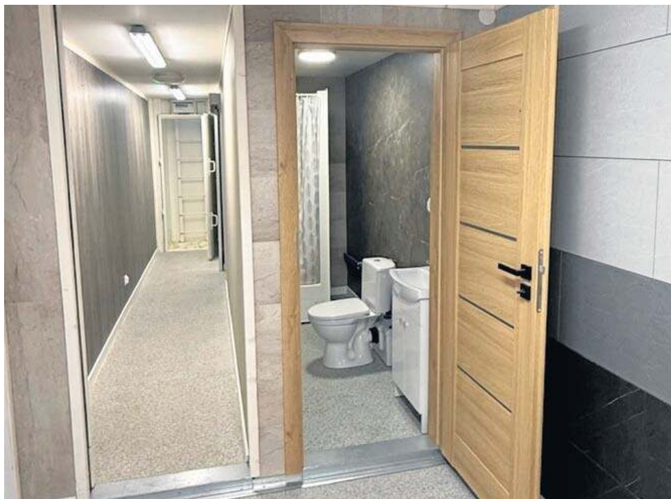
Mobilny punkt ochronny to moduł, zabezpieczony balistycznie. Chroni też przed ostrzałem z broni maszynowej oraz falą uderzeniową i odłamkami.

wybudowała nowy obiekt ochronny od kilkudziesięciu lat. Założenie jest takie, że ma on służyć jako ukrycie dla pracowników naszej firmy. Proszę zwrócić uwagę, ile się mówi o szkoleniach, o tym, że coś będzie robione, że jest potrzeba zrobienia itd... Wszyscy mówią – my robimy.