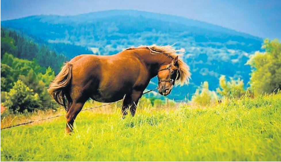
Praktycznie wszystkie szczyty są odsłonięte i gwarantują turystom piękne widoki.