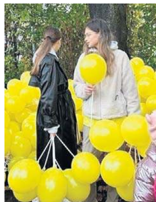
Uczniowie obsadzili żonkilkami kolejne pole nadziei.

Oddział stacjonarny hospicjum w Wałbrzychu liczy obecnie 20 łóżek. Potrzebujących jest jednak znacznie więcej. Pod opieką hospicjum domowego (czyli w domach pacjentów) znajduje się obecnie od 130 do 150 osób z miasta i powiatu wałbrzyskiego. ©