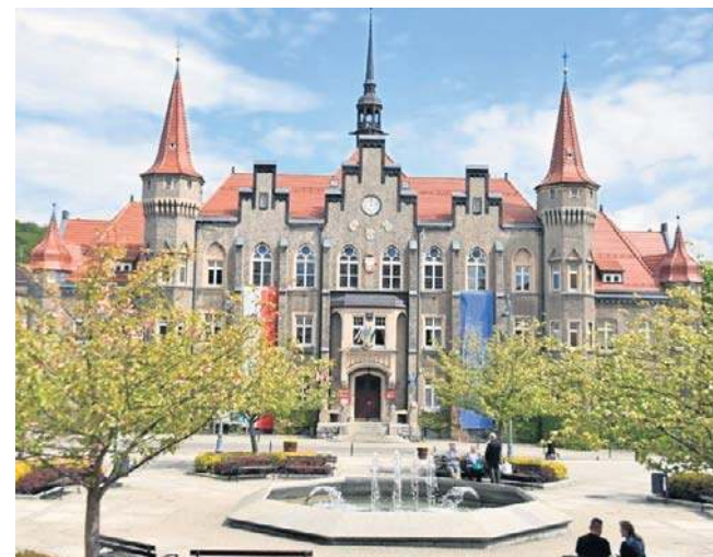
W Wałbrzychu blask odzyska osiem zabytkowych budynków. To obiekty użyteczności publicznej, m.in. Ratusz.

Zakończenie wszystkich ośmiu remontów zaplanowano do końca 2026 roku. Wtedy po termomodernizacji będą już doskonale znane mieszkańcom gmachy: I Liceum Ogólnokształcącego przy ul. Paderewskiego 17, II Liceum Ogólnokształcącego przy Al. Wyzwolenia 34, budynki UM przy ulicach Matejki 1, Matejki 2, Matejki 3, Pl. Magistrackim 1 i Słowackiego 23A, a także Poradni Psychologiczno-Pedagogicznej przy ul. Karkonoskiej 2. ©