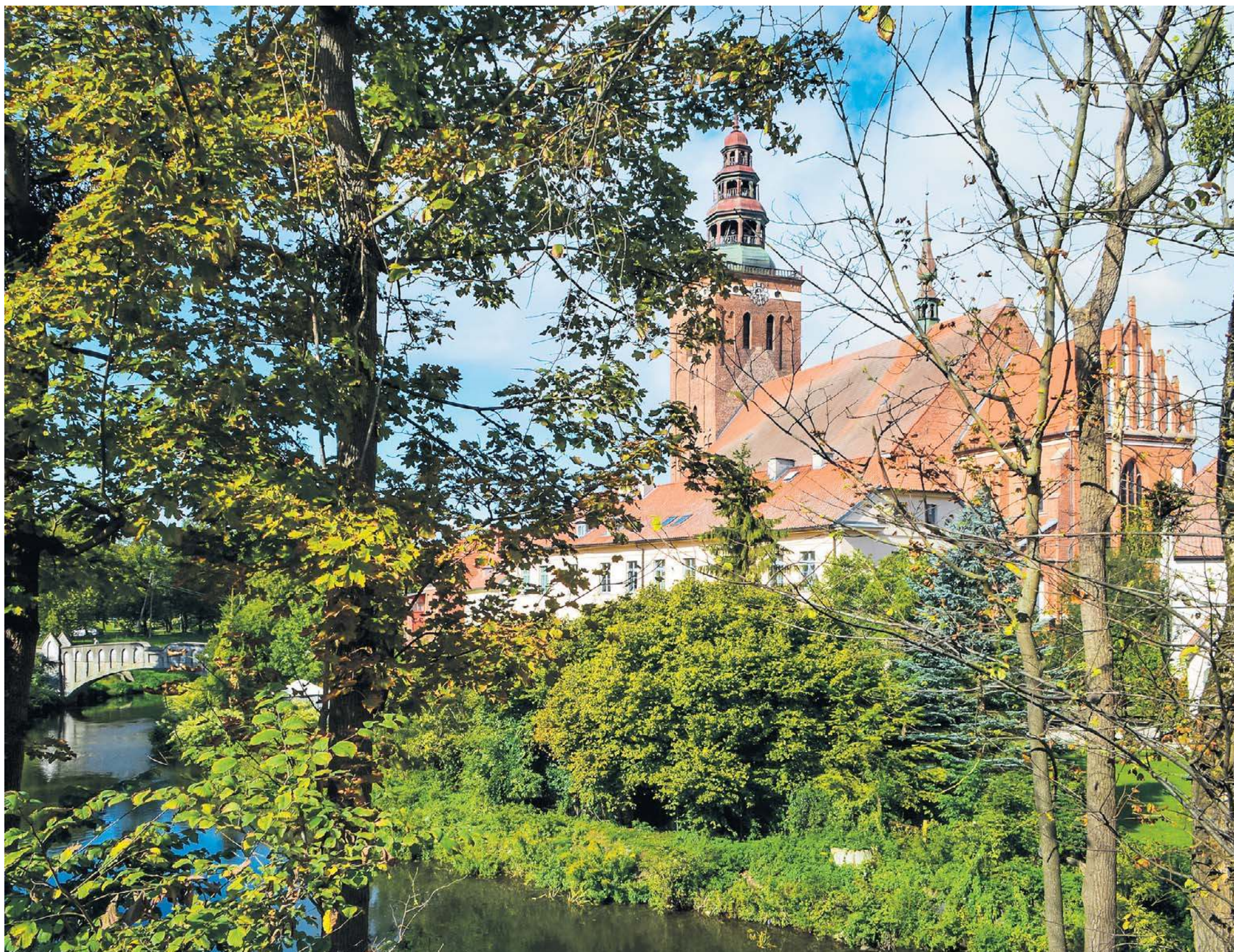
Lidzbark Warmiński to jedno z najmłodszych uzdrowisk w Polsce – zobacz jego zamek, starówkę i nowoczesne atrakcje