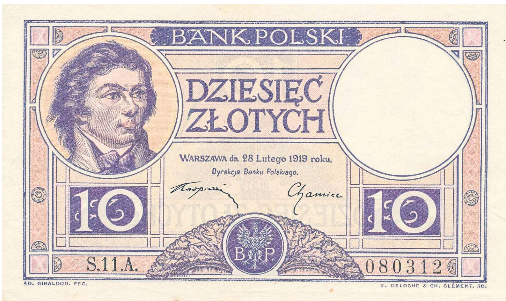
Dziesięć złotych polskich. Banknot został dopuszczony do obiegu 28 lutego 1919 roku

● Tuż po odzyskaniu niepodległości w 1918 roku niepodzielną władzę w kraju sprawował Józef Piłsudski ● Miał on głos decydujący w kwestiach politycznych i wojskowych, ale chciał on także podejmować najważniejsze decyzje w zakresie reformy walutowej