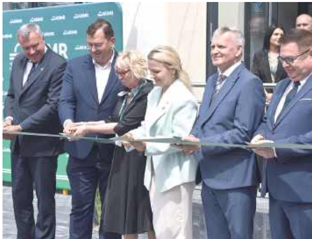
Przecięcia wstęgi dokonał osobiście minister Rolnictwa i Rozwoju Wsi, Stefan Krajewski