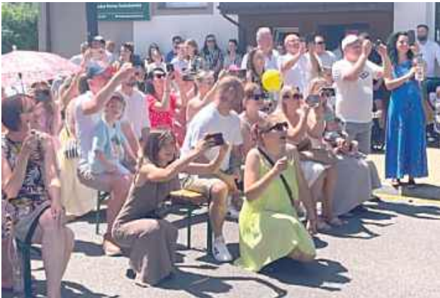
Wielkie emocje pod małą sceną