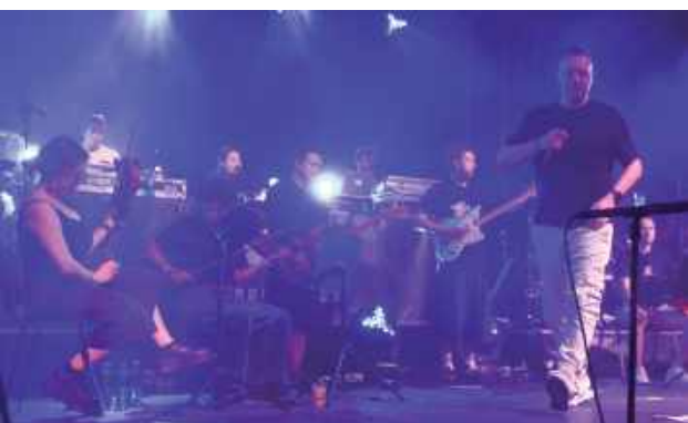
Finałowy koncert Paktofoniki dostarczył uczestnikom wielu emocji