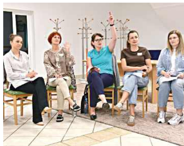
W wydarzeniu udział wzięło kilkanaście kobiet

Wydarzenia zostały zrealizowane w ramach projektu realizowanego przez Bibliotekę Publiczną Gminy Terespol „Literacka przestrzeń kobiet”, dofinansowanego ze środków Ministra Kultury i Dziedzictwa Narodowego z Funduszu Promocji Kultury.