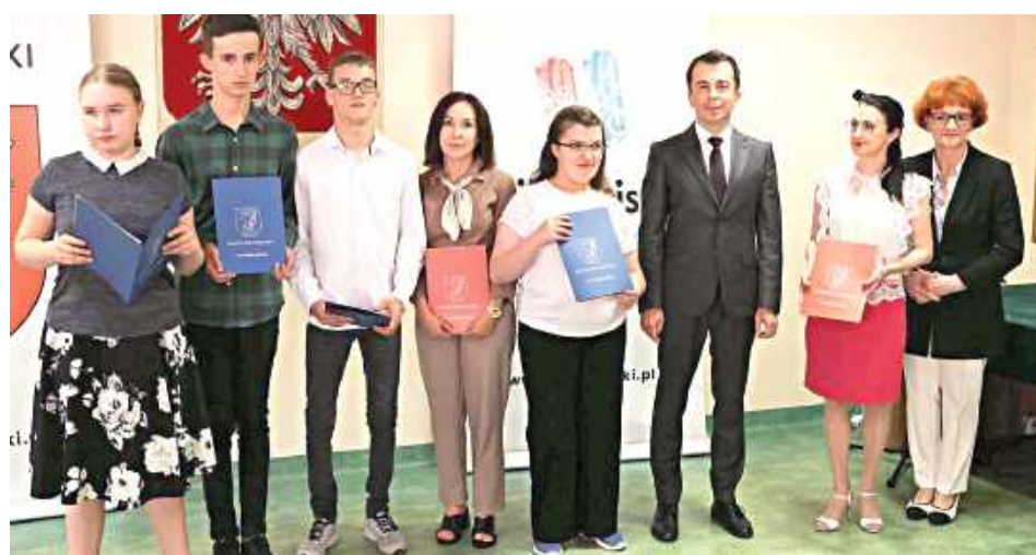
Uczniowie i nauczyciele ZSS