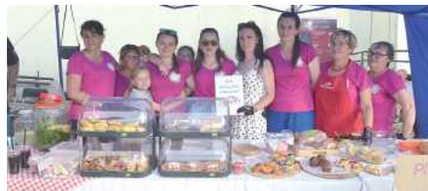
Panie z KGW „Wólczanki” Wólka Biska