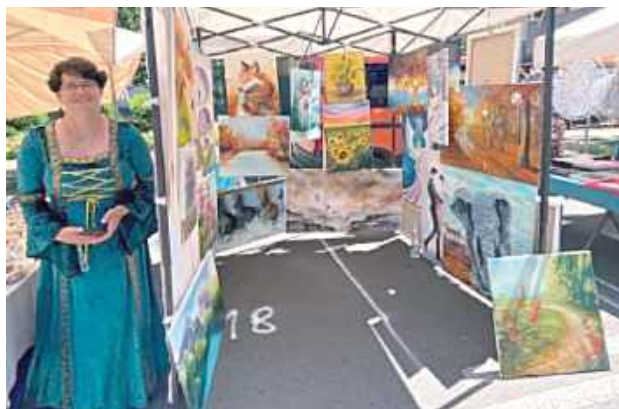
Na jarmarku pojawiło się ponad 60 wystawców. Pokazali między innymi swoje rękodzieło