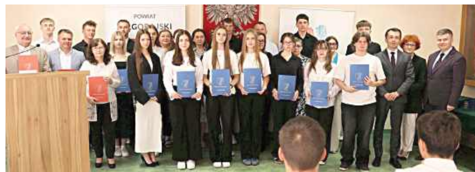
Uczniowie i nauczyciele ZSBiO