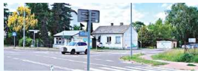
Policjanci ustalili, że motorowerem kierował 16-letni mieszkaniec gminy Tomaszów Lubelski

Do groźnego zdarzenia drogowego doszło na ulicy Piłsudskiego w Tomaszowie Lubelskim. 16-letni kierowca motorowerem potrafił 15-latkę, która przechodziła przez oznakowane przejście dla pieszych. Poszkodowana z obrażeniami ciała trafiła do szpitala.