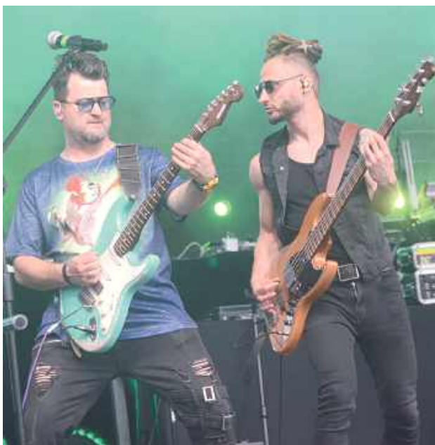
Rockowe brzmienia rozbrzmiewały w Biłgoraju