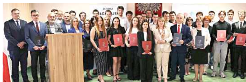
Uczniowie i nauczyciele RCEZ