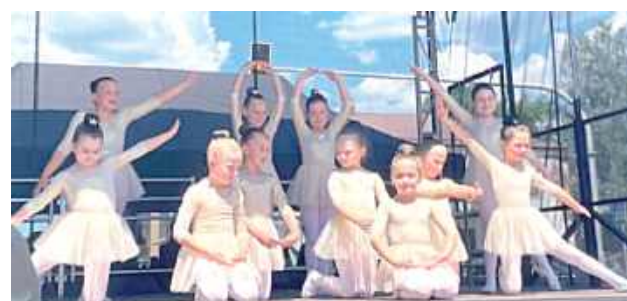
W niedzielę na małej scenie prezentowali się lokalni artyści. Zespół Queen z BCK