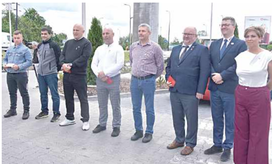
Odnaka III stopnia „Zasłużony Honorowy Dawca Krwi”