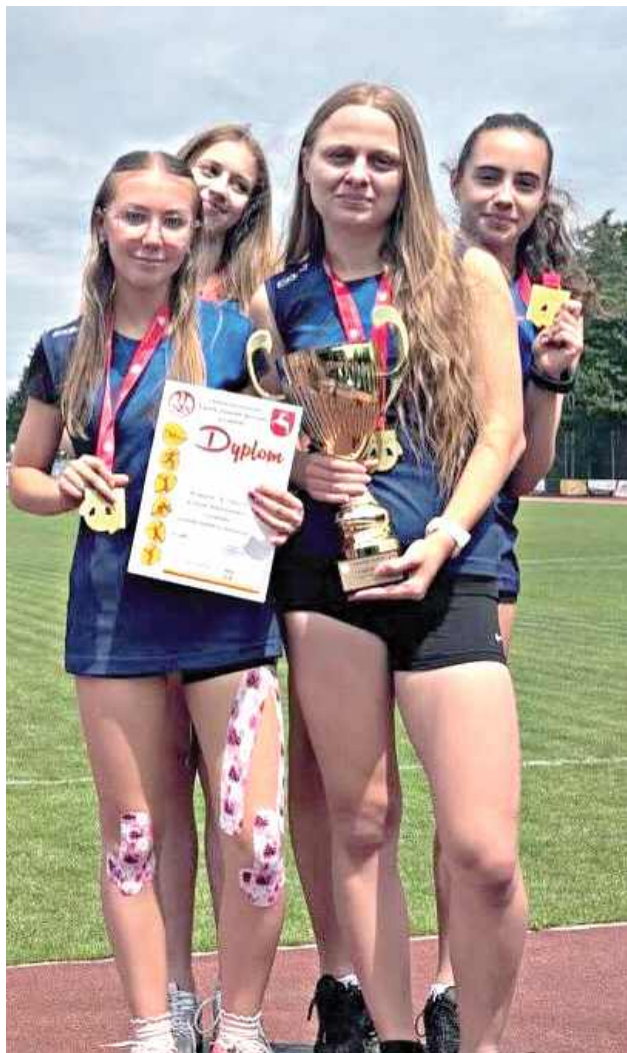
Biłgorajska sztafeta 4 x 400 m najlepsza w województwie lubelskim

Biłgoraj ma powód do dumy. Młode lekkoatletki z I LO im. ONZ pokazały absolutną klasę.