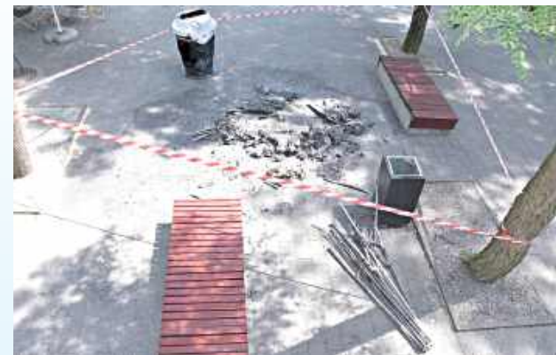
Straty w parku w Tomaszowie Lubelskim oszacowano na kwotę blisko 15 tys. zł

Miał być bezkarny akt wandalizmu, skończyło się policyjnym dozorem i widmem więzienia.