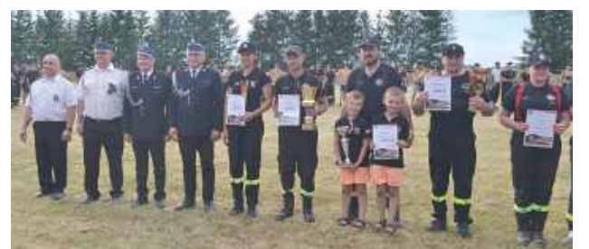
Zwycięskie drużyny z gminy Biszcza