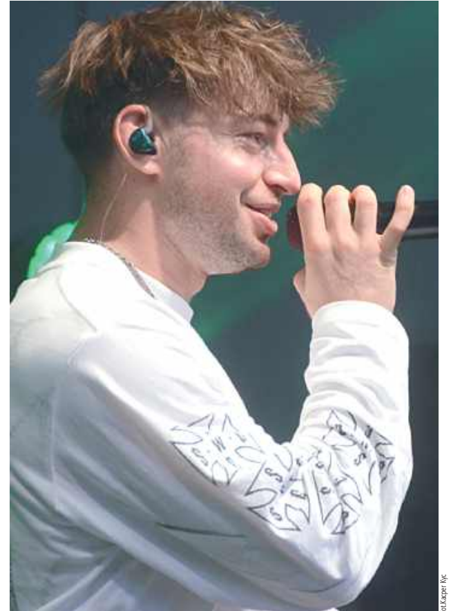
Koncert Edzia był jednym z najgłośniejszych momentów całego wydarzenia