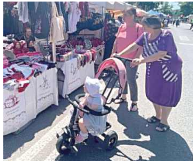
To był weekend inny niż wszystkie w Biłgoraju