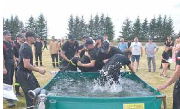
Tego dnia było bardzo duszno i gorąco, więc przydało się trochę wody dla ochłody!