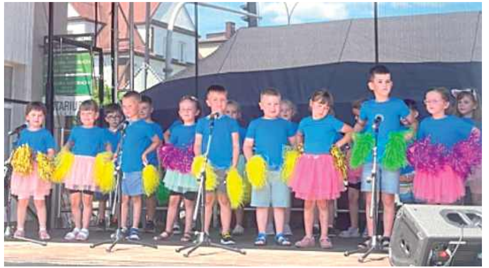
Młodzi artyści z przedszkola Bambini na małej scenie Dni Biłgoraja