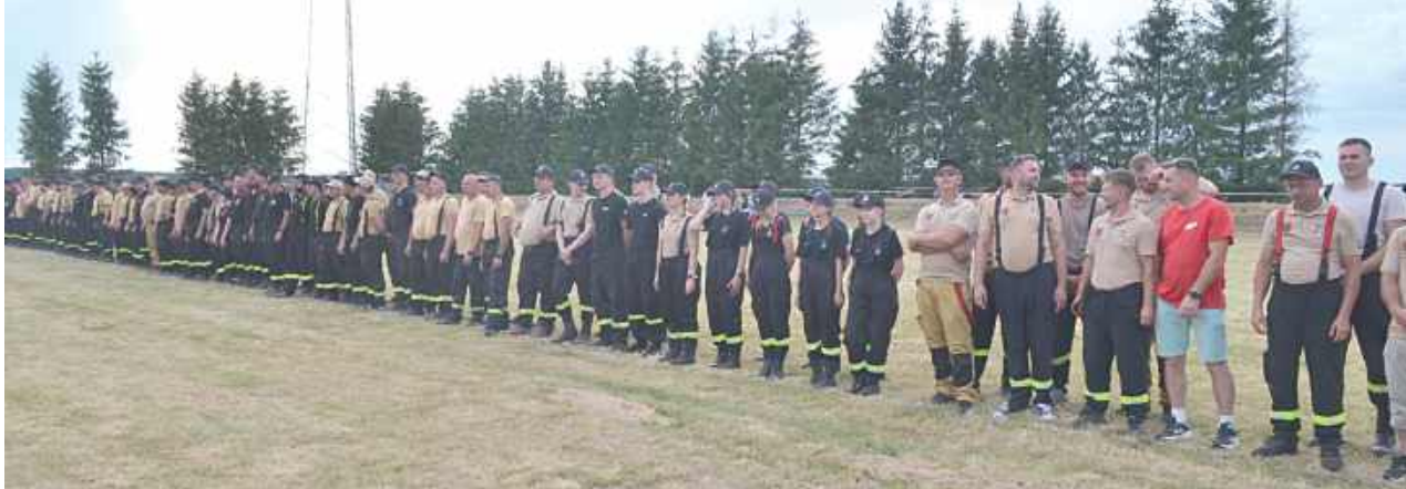
W zawodach wzięło udział 35 drużyn, w tym cztery żeńskie