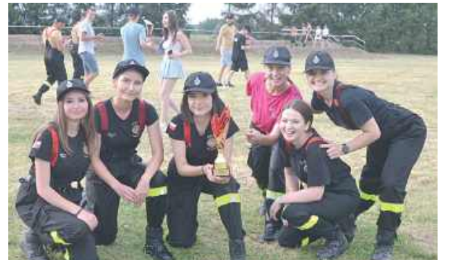
Zwycięskie dziewczyny z OSP Dąbrówka