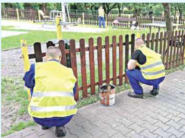
W ramach ekologicznego programu resocjalizacyjnego, osadzeni z Zamościa sprzątają parki i odnawiają miejską infrastrukturę

Grupa więźniów z Zakładu Karnego w Zamościu opuściła cele, aby zadbać o porządek i estetykę miasta. W ramach ekologicznego programu resocjalizacyjnego osadzeni sprzątają parki, odnawiają miejską infrastrukturę, a niebawem wyczyszczą również lokalne szlaki rowerowe. Wspólna akcja z Zakładem Usług Komunalnych potrwa aż do jesieni.