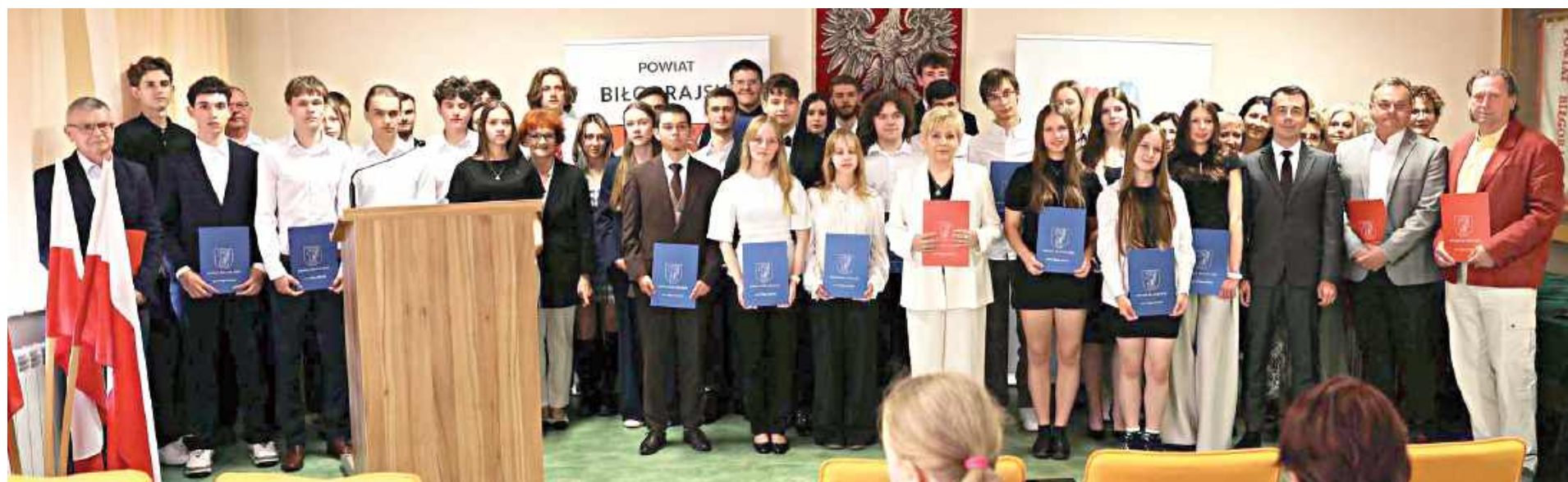
Uczniowie i nauczyciele I LO im. ONZ

W piątek, 19 czerwca sala konferencyjna Starostwa Powiatowego w Biłgoraju wypełniła się po brzegi najbystrzejszymi umysłami regionu. Władze powiatu uroczystie podsumowały rok szkolny 2025/2026, wyróżniając uczniów, którzy swoimi sukcesami w ogólnopolskich olimpiadach i konkursach przedmiotowych rozstawili Ziemię Biłgorajską.