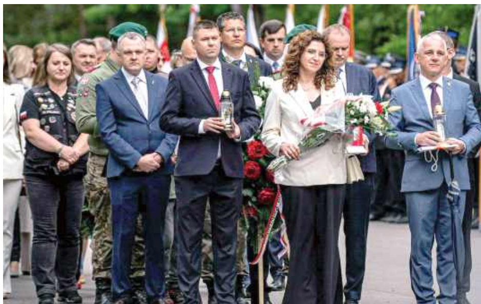
W wydarzeniu uczestniczyli przedstawiciele gminy Goraj

Uroczystości rocznicowe odbyły się w miejscu bitwy i miały podniosły charakter.