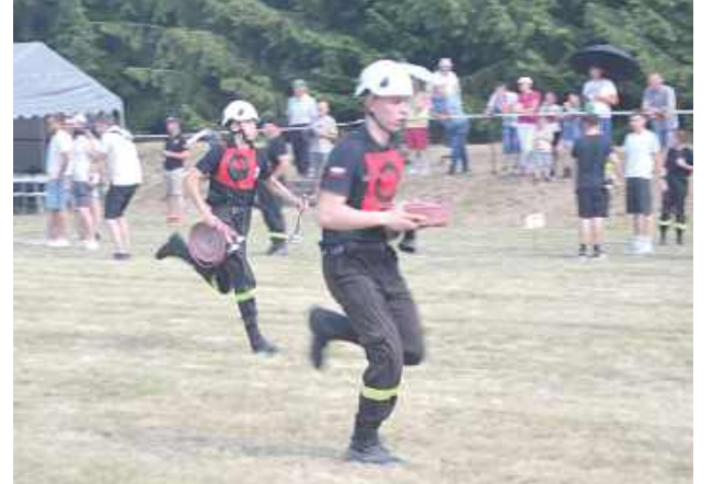
Jedną z konkurencji była sztafeta pożarnicza

W niedzielę 21 czerwca na stadionie sportowym w Biszczy odbyły się Międzygminne Zawody Strażackie.