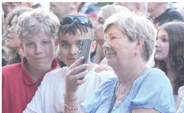
Wśród fanów można było znaleźć zarówno tych młodych, jak i starszych