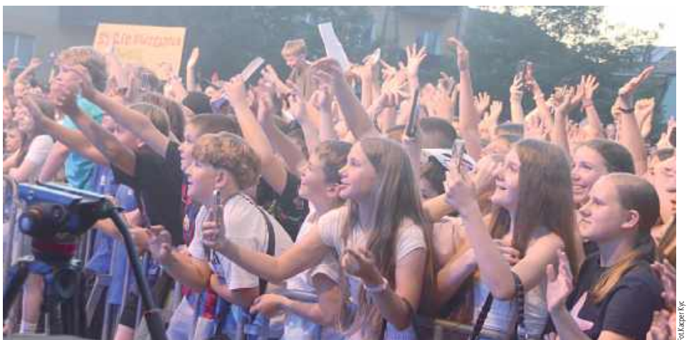
Tłum pod sceną bawił się od pierwszego do ostatniego utworu