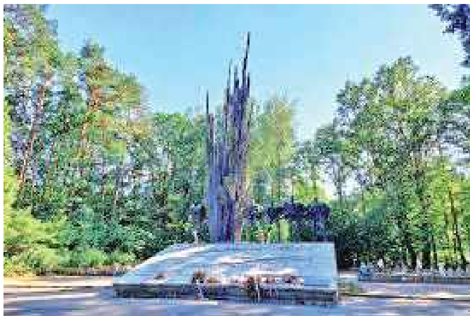
Pomnik na Porytowym Wzgórzu, wykonany wg projektu Bronisława Chromego

Celem operacji „Sturmwind I” była likwidacja oddziałów partyzanckich przed nadejściem frontu wschodniego. W nocy z 14 na 15 czerwca oddziały NOW-AK „Ojca Jana” pod dowództwem Bolesława Usowa „Konara” zdołały jednak przedrzeć się przez niemiecki pierścień okrażeńia.