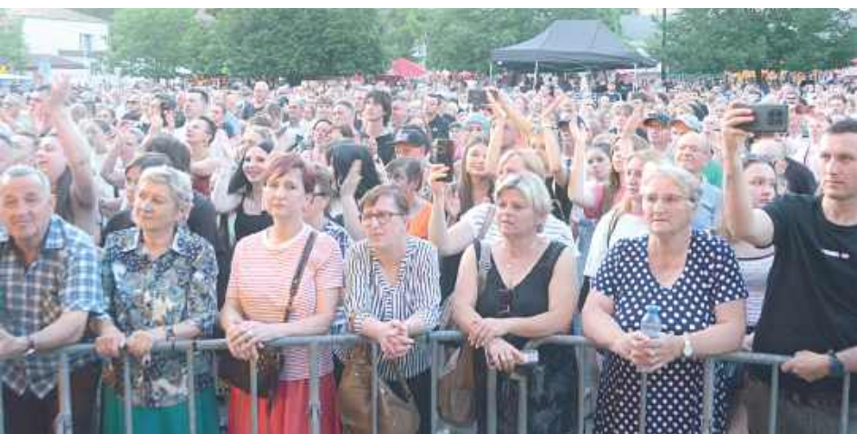
Publiczność chętnie śpiewała razem z legendarnym zespołem