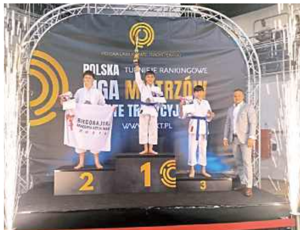
Biłgorajscy karatecy wrócili z pięcioma medalami