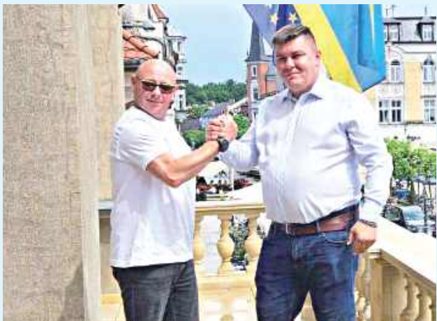
Szczebrzeszyn i Pszczyna zacieśniają współpracę

- Podczas naszej wizyty w Pszczynie podpisaliśmy Deklarację Współpracy pomiędzy Gminą Szczebrzeszyn a Gminą Pszczyna. Wspólna inicjatywa kulturalna, jaką było odsłonięcie w Pszczynie rzeźby słyn-