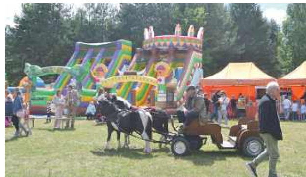
Dla najmłodszych czekało wiele atrakcji