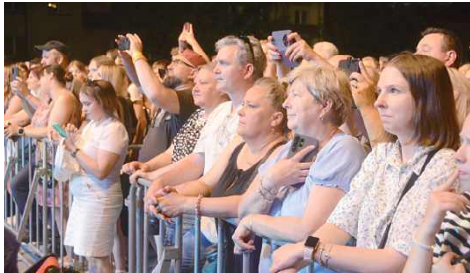
Znane utwory porwały publiczność do wspólnego śpiewania