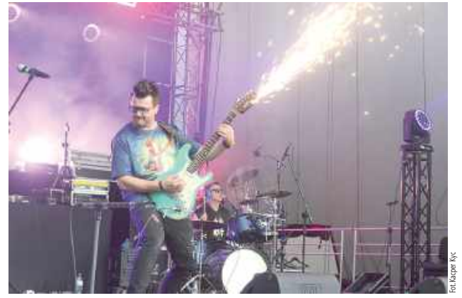
Fani rocka nie mogli narzekać na brak emocji