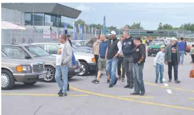
W niedzielne przedpołudnie wielu miłośników zawitało na biłgorajskim Autodromie

W niedzielę, 14 czerwca, na biłgorajskim Autodromie odbywa się 3. Biłgorajski Zlot Pojazdów Zabytkowych. Można podziwiać pojazdy, które przed laty jeździły po polskich drogach. Można było podziwiać samochody, motory, a nawet rowery. Organizatorami wydarzenia są: Grupa Biłgorajskie Klasyki, Fundacja Auto Pasja oraz Autodrom Biłgoraj.