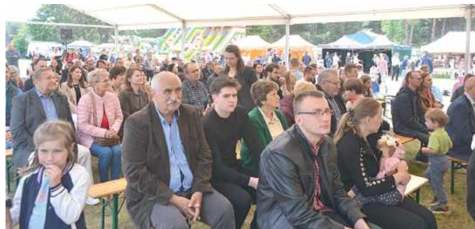
Wydarzenie cieszyło się ogromnym zainteresowaniem