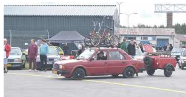
Popołudniu zabytkowe auta przemierzały przez Biłgoraj