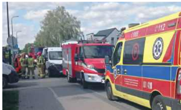
Telefon, który upadł, uruchomił funkcję automatycznego wykrywania wypadku i wysłał alarm do służb

Interwencja służb na ul. Moniuszki w Biłgoraju okazała się fałszywym alarmem. Powodem zgłoszenia był iPhone, który po upadku automatycznie wysłał powiadomienie o możliwym wypadku. Na miejsce skierowano służby ratunkowe.