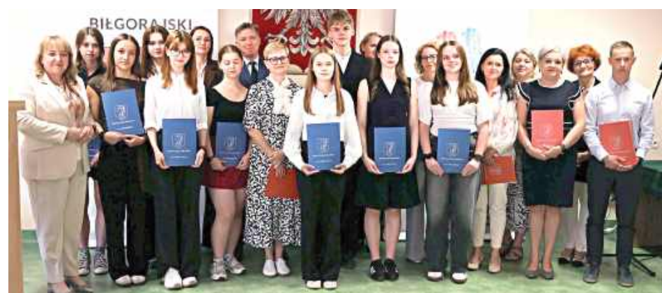
Uczniowie i nauczyciele ZSiO