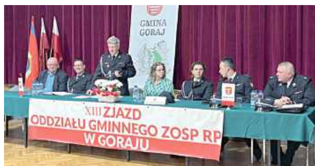
Druhowie podsumowali minioną kadencję i wybrali swoim przedstawicieli na kolejną

Delegaci jednogłośnie udzieliли absolutorium ustępującym władzom, wyrażając tym samym uznanie dla ich pracy, poświęcenia i zaangażowania na rzecz rozwoju