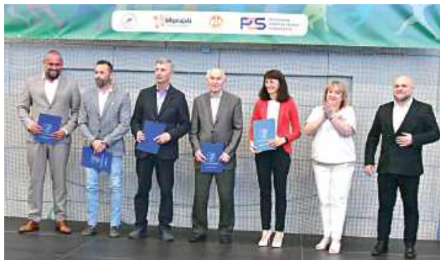
Działacze sportowi nagrodzeni