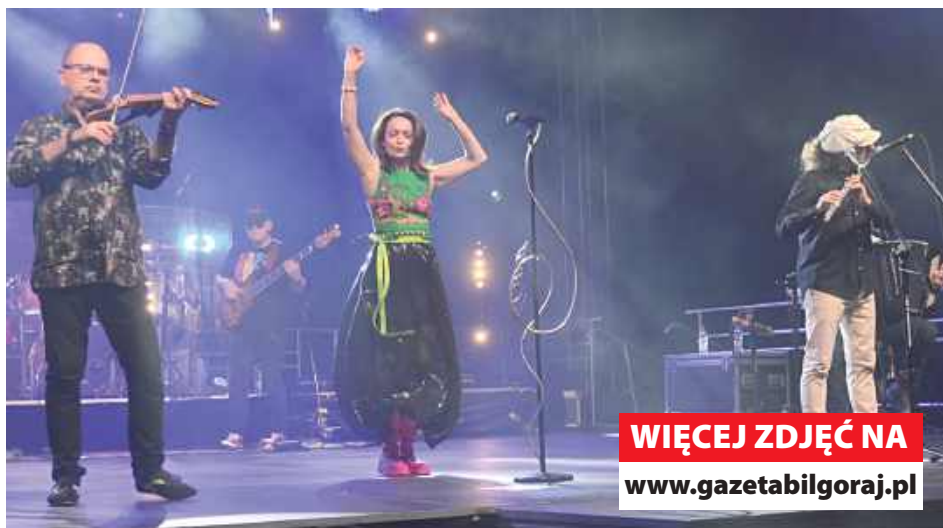
Największe przeboje Brathanków wybrzmiały podczas sobotniego wieczoru