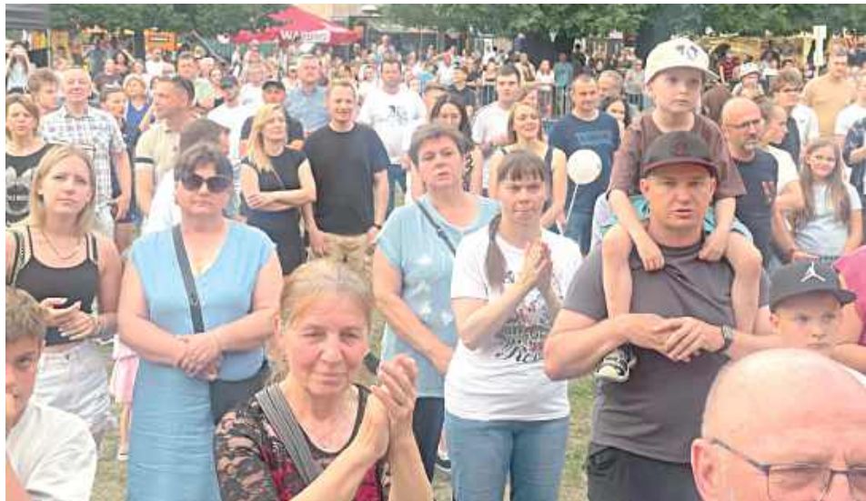
Pogoda dopisała, a wydarzenie cieszyło się sporym zainteresowaniem