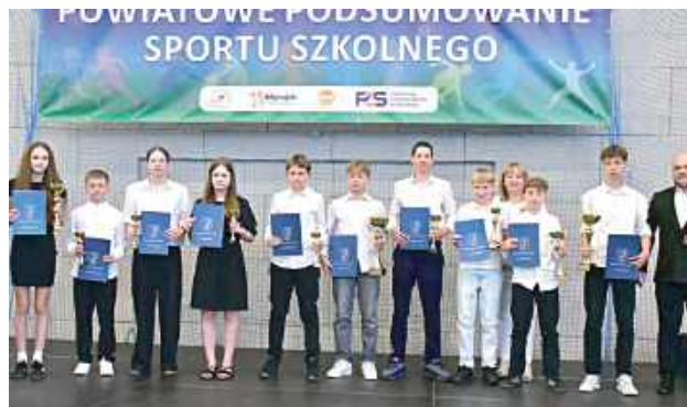
Młodzi sportowcy otrzymali nagrody