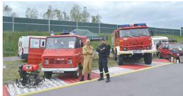
Na zlocie były oczywiście rodzime klasyki