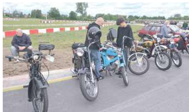
Można było podziwiać legendarne motory