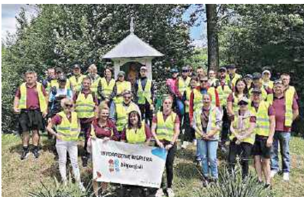
Uczestnicy rajdu pokonali trasę prowadzącą przez historyczne miejsca

Połączenie rekreacji z poznawaniem lokalnej historii ponownie okazało się strzałem w dziesiątkę. Trzecia edycja Rajdu Rowerowego