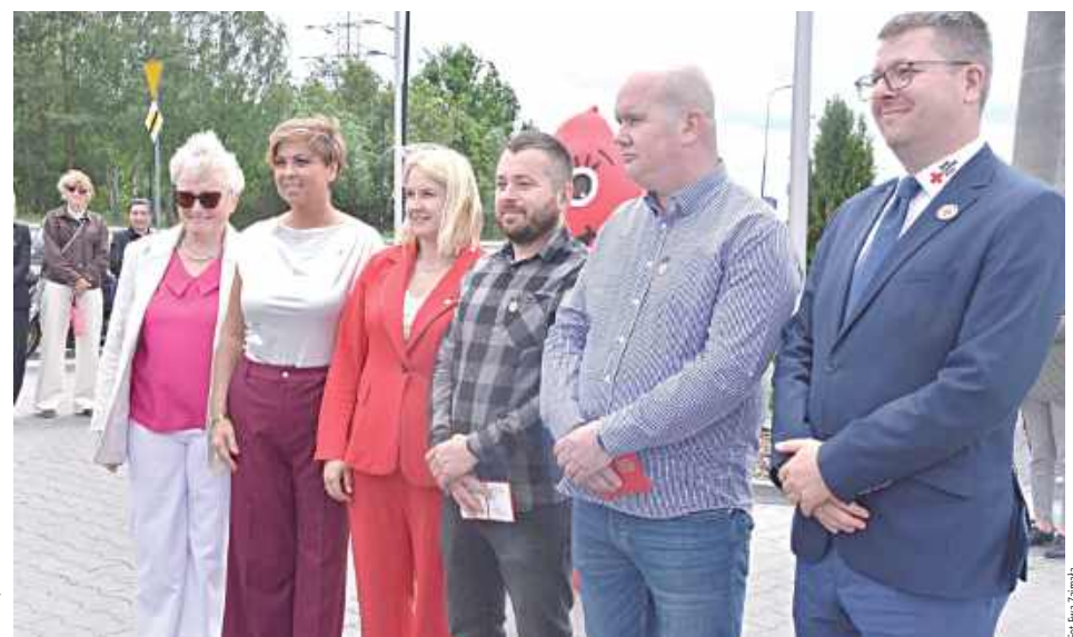
Odnaczeni Odznaką I stopnia „Zasłużony Honorowy Dawca Krwi”