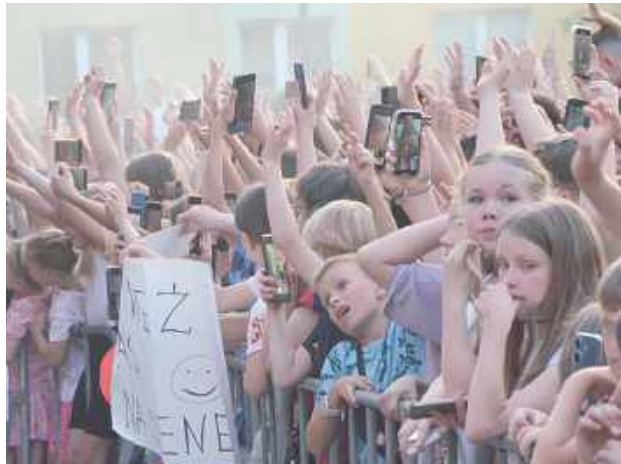
Edzio przyciągnął pod scenę tłumy młodych fanów