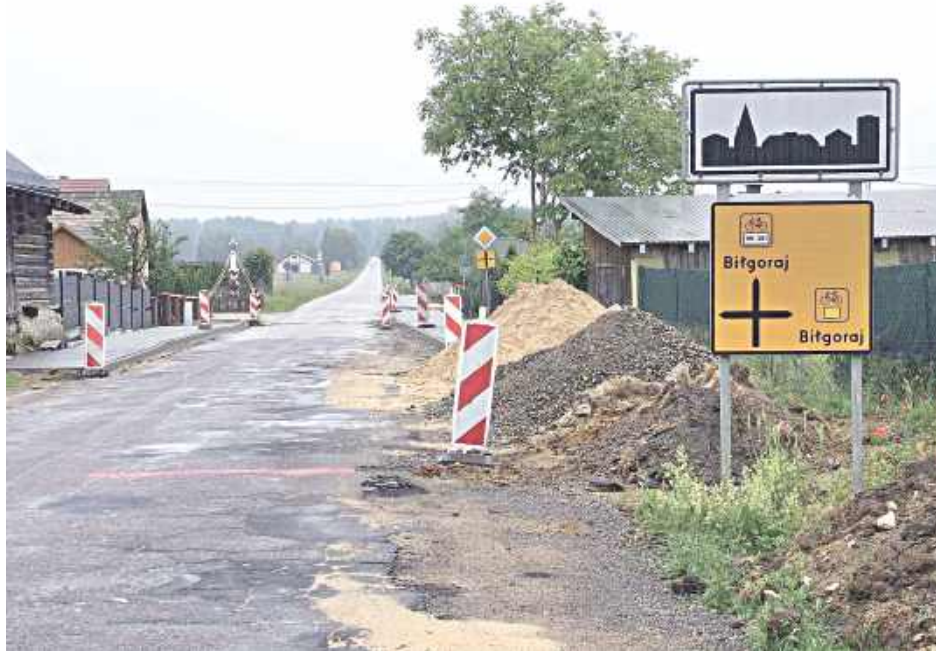
Kierowcy muszą liczyć się z utrudnieniami na drodze

Prace już się rozpoczęły i obejmują szeroki zakres robót wykraczających daleko poza samą wymianę nawierzchni. W ramach przedsięwzięcia powstanie nowoczesny system odwodnienia, który ma roz-