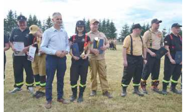
Zwycięskie drużyny z gminy Potok Górny