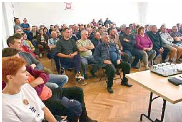
W spotkaniach udział wzięło kilkadziesiąt mieszkańców

Urzednicy mocno zaakcentowali jedną z najważniejszych zasad. Przy korzystaniu ze środków publicznych obowiązuje bezwzględny zakaz podwójnego finansowania tych samych działań z różnych źródeł.