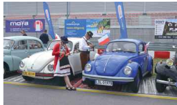
Do Biłgoraja zjechały ciekawe samochody