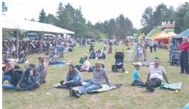
Na Exodus przyjechało wiele rodzin