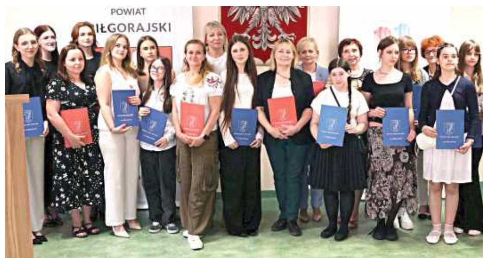
Wychowankowie i nauczyciele MDK