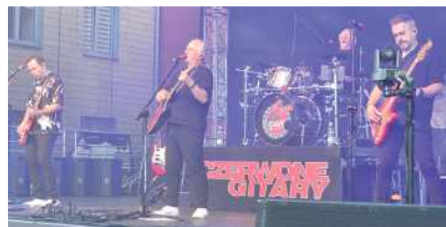
Czerwone Gitary dały czadu