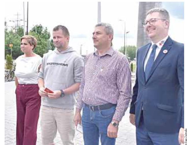
Odnaka II stopnia „Zasłużony Honorowy Dawca Krwi”