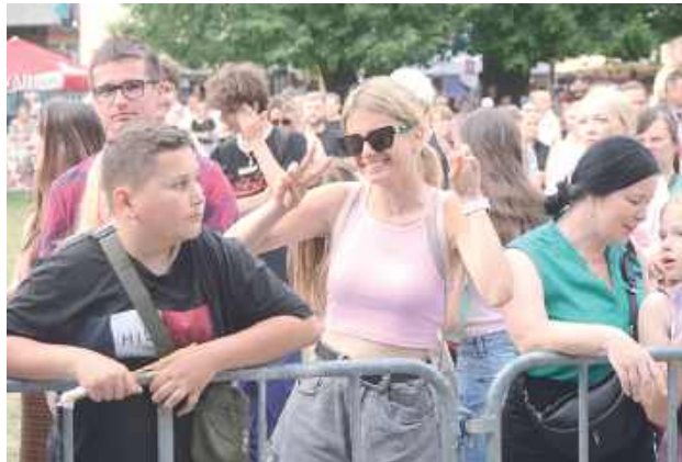
Pod sceną nie brakowało dobrej energii i głośnego śpiewu