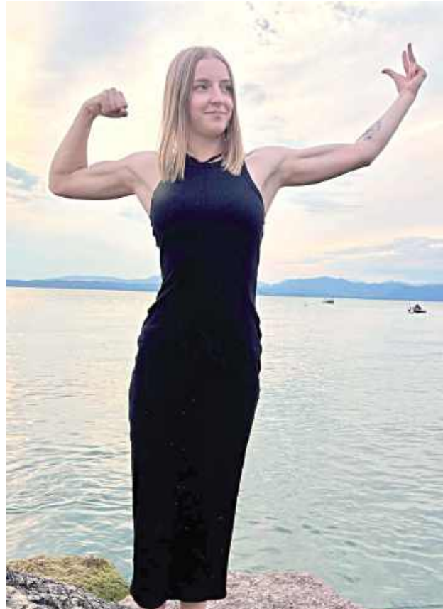
Sympatyczna sztangistka Znicza wyrasta na jedną z najlepszych zawodniczek w Polsce. Już nie tylko wśród junierek

stwach Polski U23 w Ciechanowie (maj/czerwiec 2026), zdobyła srebrny medal i tytuł wicemistrzyni Polski z wynikiem 130 kg w dwuboju (57 kg w rwaniu / 73 kg w podrzucie). Z medalem wróciła też z ubiegłorocznych Mistrzostw Polski Junierek w Nowym Tomysku. Tu zdobyła srebrny krążek wynikiem 114 kg w dwuboju (50 kg w rwaniu / 64 kg w podrzucie).