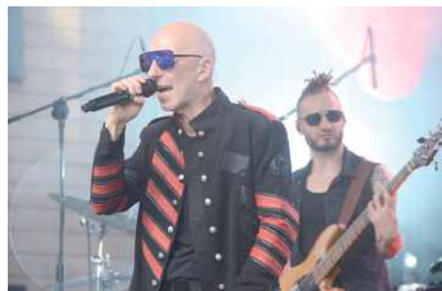
Zespół Tacy Sami przypomniał największe przeboje Lady Pank