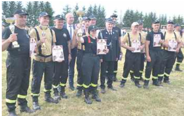
Zwycięskie drużyny z gminy Księżpol