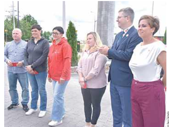
Odnaka III stopnia „Zasłużony Honorowy Dawca Krwi”