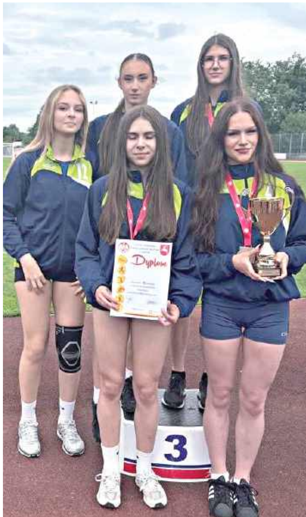
Sztafeta 4x100 metrów stanęła na najniższym stopniu podium

Złoty medal wywalczyła sztafeta 4 x 400 m, która po znakomitym biegu pewnie pokonała rywalki. Świetnie spisała się również sztafeta 4 x 100 m, zdobywając brązowy medal po