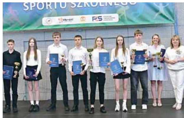
Oni nie mają sobie konkurencyjnych

Hala przy ZSBiO w Biłgoraju wypełniła się sportowymi emocjami i dumą. Podczas Powiatowego Podsumowania Sportu Szkolnego wyróżniono uczniów, nauczycieli i trenerów, którzy przez cały rok pracowali na sukcesy Ziemi Biłgorajskiej.