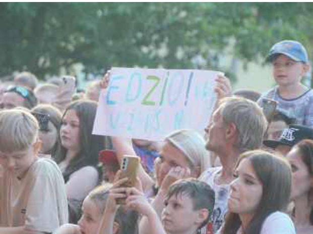
Raper spotkał się z gorącym przyjęciem ze strony publiczności