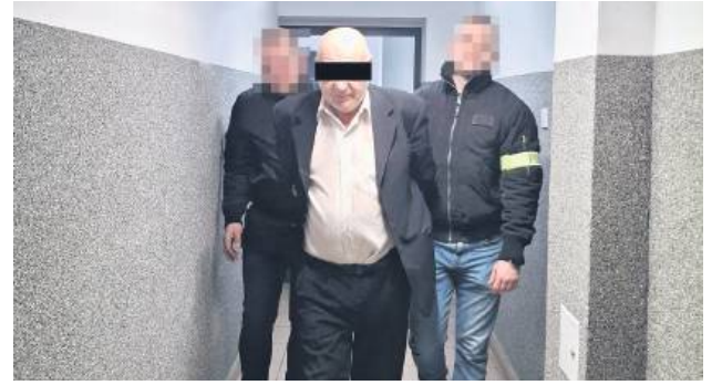
59-latkowi grozi do 7,5 roku pozbawienia wolności.