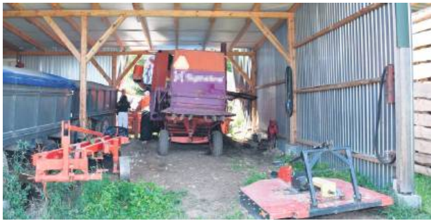
Wypadek w gm. Skierbieszów miał tragiczne skutki.

W naszym regionie, czyli na terenie działania placówek