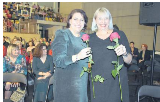
Pani otrzymały kwiaty i słodki upominek.

Tego dnia panie otrzymały róże i słodki upominek. ez