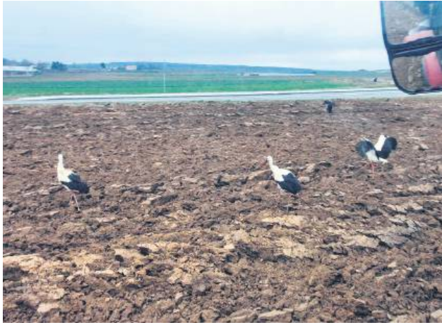
W przypadku nagłego zmniejszenia dochodów czy wystąpienia szczególnych zdarzeń losowych warto zgłosić się do KRUS.

Za prowadzone postępowanie egzekucyjne organ egzekucyjny pobiera od dłużnika wysokie opłaty. Sam fakt prze-