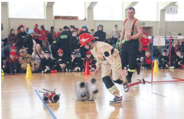
III Powiatowe Halowe Młodzieżowe Zawody Sportowo-Pożarnicze – Tomaszów Lubelski 2025.

Na starcie stanęło aż 55 drużyn Młodzieżowych Drużyn Pożarniczych (MDP) – 36