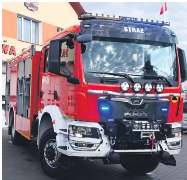
Nowy samochód ratowniczo-gaśniczy zastąpi wóz ratownictwa technicznego.

Komenda Powiatowa Państwowej Straży Pożarnej w Hrubieszowie otrzymała nowy, ciężki samochód ratowniczo-gaśniczy. Jest on przystosowany nie tylko do gaszenia pożarów, ale również do usuwania skutków nawałnic i powodzi. Zakup samochodu podyktowany był potrzebą dostosowania Krajowego Systemu Ratowniczo-Gaśniczego do zmian klimatycznych i cywilizacyjnych.