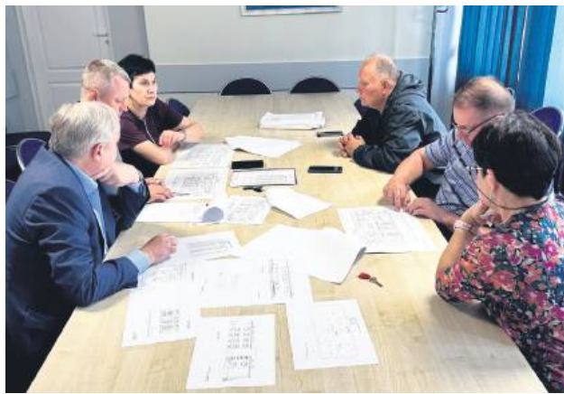
Jeśli wszystko pójdzie zgodnie z planem, to Zamojski Szpital Niepubliczny zostanie znacząco zmodernizowany.

Chodzi o niebagatelną kwotę – przeszło 9,1 miliona złotych. Za te pieniądze przebudowany zostanie budynek, w którym obecnie mieści się Apteka Słoneczna oraz Centrum Medyczne Audika.