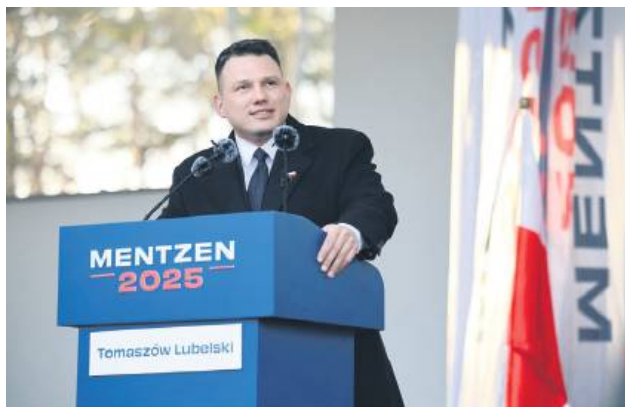
Sławomir Mentzen w Tomaszowie Lubelskim.

Jednym z głównych wątków w przemówieniach Sławomira Mentzena był stan polskiej armii i przygotowania do ewentualnej wojny. Kandydat Konfederacji podkreślał, że