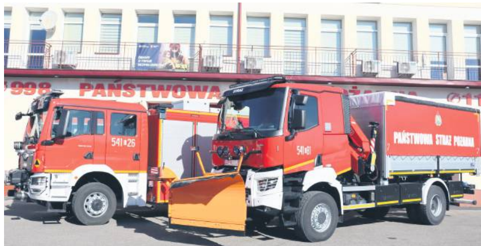
Nowe pojazdy w KP PSP Tomaszów Lubelski.

Komenda Powiatowa PSP w Tomaszowie Lubelskim została doposażona w dwa samochody. Pierwszy – ciężki samochód ratowniczo-gaśniczy na podwoziu MAN warty ponad 1 milion 377 tys. zł. Jest on wyposażony w moduł sprzętu do usuwania wiatrołomów oraz skutków rozlewisk powodziowych. Drugi pojazd to ciężki samochód kwatermistrzowski 4x4 na podwoziu Renault o zbli-