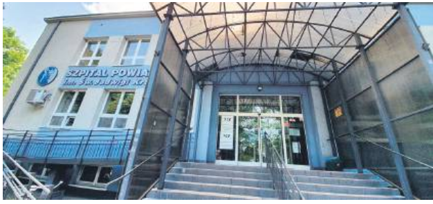
Wszyscy się zmobilizowali i szpitalowi przyznano certyfikat jakości. Podziękowania należą się całemu personelowi szpitala – począwszy od lekarzy, a skończywszy na paniach salowych.

– Nasz szpital przeszedł bardzo wnikliwą i dokładną kontrolę. Otrzymaliśmy 83 proc. pozytywnych ocen i przyznano nam akredytację. To naprawdę bardzo