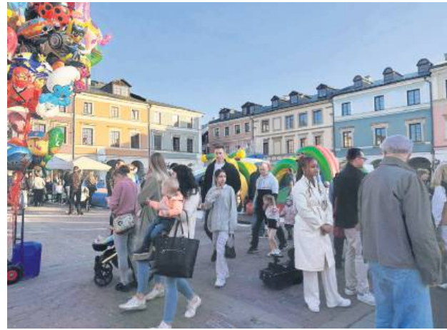
Pogoda dopisała organizatorom Festiwalu. Każdego dnia na rynku było mnóstwo osób.

W ramach Festiwalu Czekolady zorganizowano wiele