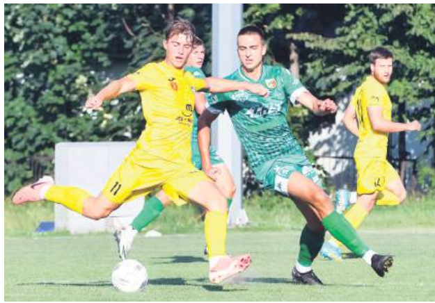
W rundzie jesiennej Stal Kraśnik straciła punkty tylko w dwóch zremisowanych meczach. Wynik bezbramkowy uzyskała na stadionie w Szczepieszynie, w meczu z Hetmanem Zamość.