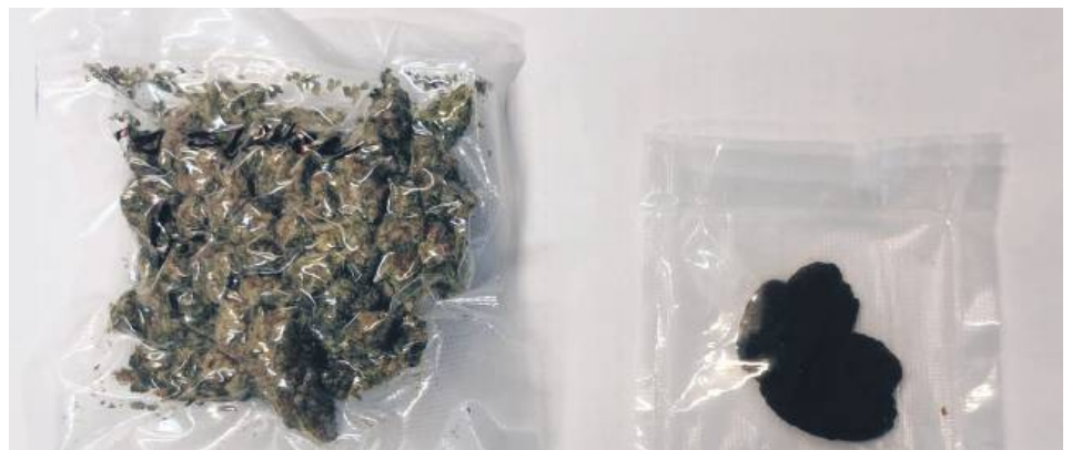
Nastolatka miała przy sobie haszysz i marihuanę.