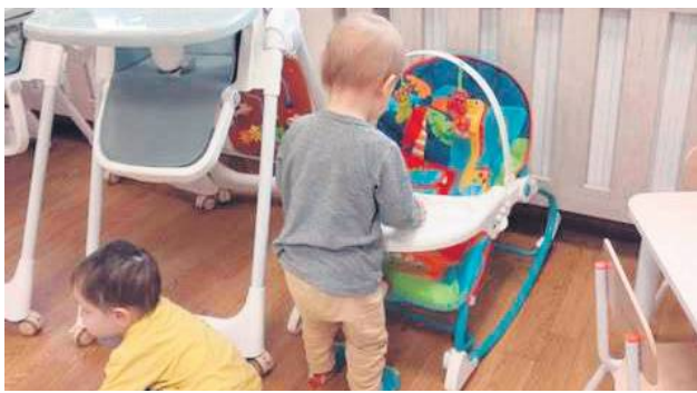
Gmina Sułów jako pierwsza w województwie utworzyła dwa punkty opieki w formie dziennego opiekuna w Sąsiadce.

Za pobyt u dziennych opiekunów – ze względu na dotację z pro-