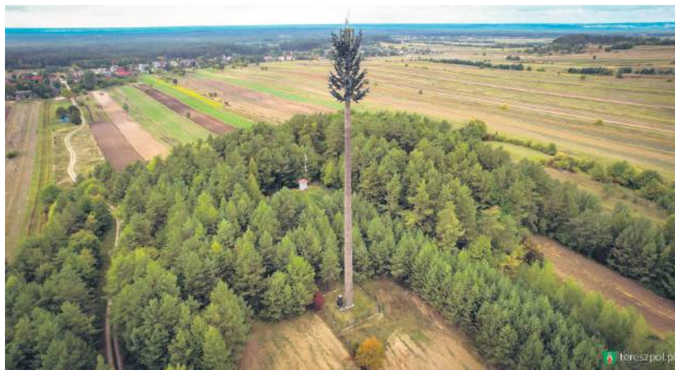
Wieża ta była pierwszą tego typu inwestycją w Polsce.

Wyróżnienie wręczył prezes PIIT, Andrzej Dulka, podkreślając kluczową rolę samorządów w budowie nowoczesnej i dostępnej infrastruktury cyfrowej w Polsce. Słowa uznania skierował w kierunku wójta gminy Tereszpól, podkreślając, że gmina została wyróżniona spośród niemal 2500 gmin za wyjątkowe podejście do współpracy oraz skuteczność w realizacji procesów administracyjnych. – Jacek Pawluk wykazał się wyjątkową determinacją i skutecznością w dążeniu do realizacji inwestycji kluczowej dla mieszkańców gminy. Dzięki jego zaangażowaniu oraz umiętności budowania porozumienia udało się uzyskać zgodę Nadleśniczego na budowę wieży na terenie parku. Aktywnie uczestniczył w całym procesie administracyjnym, dbając o jego sprawny przebieg, a także prowadził otwarty dialog z mieszkańcami, w tym z osobami sceptycznie nastawionymi do projektu. Swoją postawą nie tylko skutecznie przekonywał do zasadności inwestycji, ale także