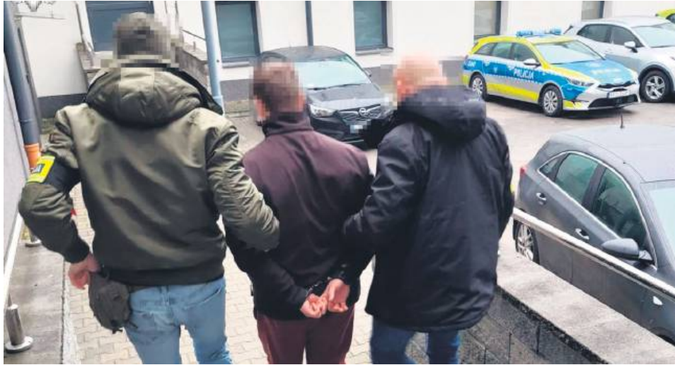
25-latek usłyszał zarzut narażenia innej osoby na bezpośrednie niebezpieczeństwo utraty życia lub ciężkiego uszczerbku na zdrowiu.