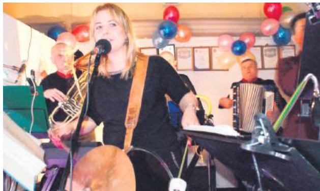
To była sentymalna podróż do lat 90.

Tłumy uczestników, świetna muzyka i klimat sprzed trzech dekad sprawiły, że wszyscy bawili się wesoło. Ostatkowa zabawa w stylu lat 90., zorganizowana w remizie OSP w Gruszce Dużej, okazała się strzałem w dziesiątkę. Impreza odbyła się 1 marca.