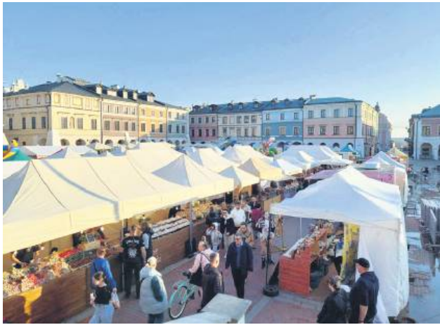
Przez trzy dni na zamojskim rynku stały stoiska, m.in. z wyrobami cukierniczymi.

W piątek 7 marca w Zamościu rozpoczął się CZEKO FEST – Festiwal Czekolady i Słodkości. Wydarzenie trwało cały weekend i przyciągnęło setki wielbicieli słodczy. Na rynku sprzedawcy oferowali wyjątkowe