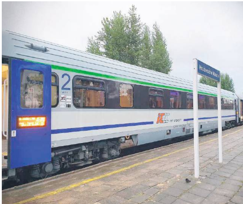
Cieszy przynajmniej to, że wbrew pogłoskom nie obniżono standardu wagonów, którymi podróżni z Hrubieszowa i Zamościa jeżdżą IC „Hetman” do Krakowa.