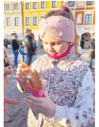
Sprzedawcy proponowali churrosy, praliny, dubajską czekoladę, owoce w czekoladzie, kołaczki i wiele innych słodkości.