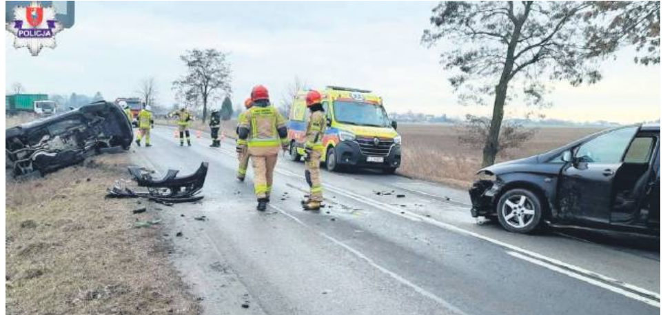
51-latka dostała mandat w wysokości 1500 złotych oraz 12 punktów karnych.