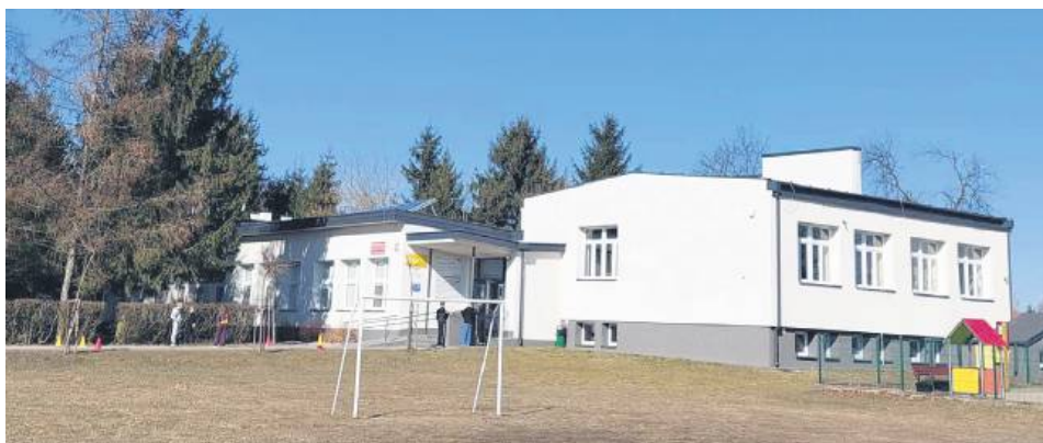
Przy korzystnej pogodzie uczniowie wychodzą na boisko czy plac zabaw, inaczej muszą ćwiczyć na szkolnym korytarzu.

Dodała, że ten temat jest w gronie rodziców często poruszany. Wszyscy słyszeli już, że w gminie Sitno przy jednej ze szkół w tym roku powstanie nowa sala gimnastyczna, ponieważ gmina dostała dofinansowanie. Zastanawiają się więc, czy nie można byłoby postarać się o środki na salę w Borowinie. Czy ta szkoła kiedy-