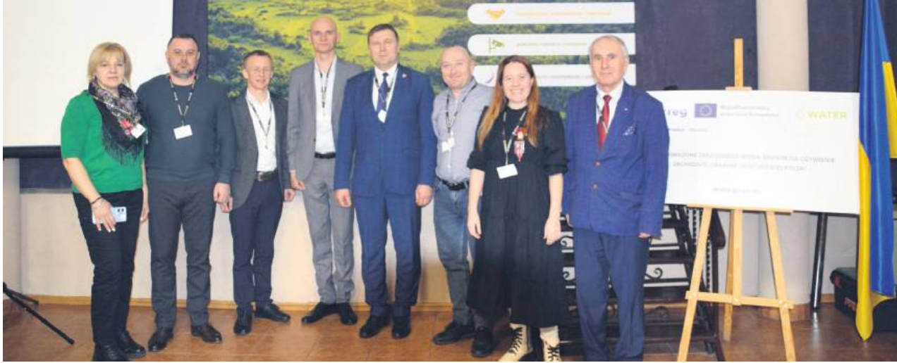
Konferencja odbyła się 26 lutego w Gminnym Ośrodku Kultury w Skierbieszowie.

Konferencja miała miejsce 26 lutego w Gminnym Ośrodku Kultury w Skierbieszowie. Udział w niej wzięli przedsta-