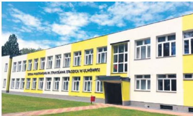
Na ostatniej bardzo burzliwej sesji radni większością głosów przegłosowali rozdzielenie Zespołu Szkół Publicznych w Ulhówku.

Radni gminy Ulhówek większością głosów podczas ostatniej sesji 25 lutego podjęli decyzję o rozdzieleniu Zespołu Szkół.