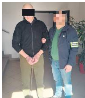
45-letni mieszkaniec powiatu tomaszowskiego spędzi najbliższe trzy miesiące w areszcie.

Policjanci z tomaszowskiej komendy 4 marca zostali wezwani na interwencję domową na terenie powiatu.