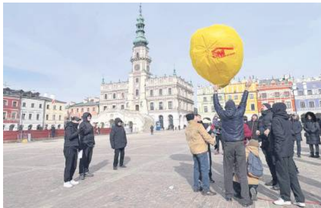
Tegoroczne zawody nie tylko pozwoliły na porównanie umiejętności modelarskich, ale także dostarczyły uczestnikom i widzom niezapomnianych wrażeń.