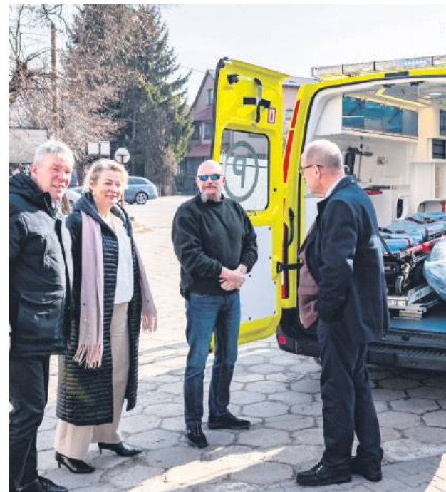
SPZOZ w Tomaszowie Lubelskim wzbogacił się o nowoczesny, fabrycznie nowy ambulans typu C wraz z wyposażeniem.

Dzięki nowemu ambulansowi ratownicy będą mogli jeszcze skuteczniej i szybciej