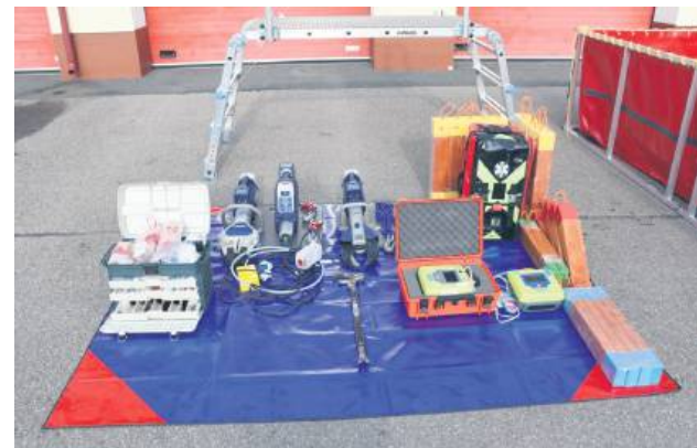
Nowy sprzęt ratowniczo-gaśniczy.