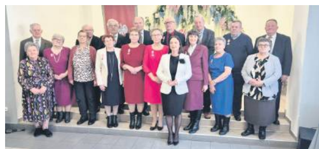
Podczas uroczystości padło wiele gratulacji oraz życzeń zdrowia i kolejnych rocznic spędzonych razem.