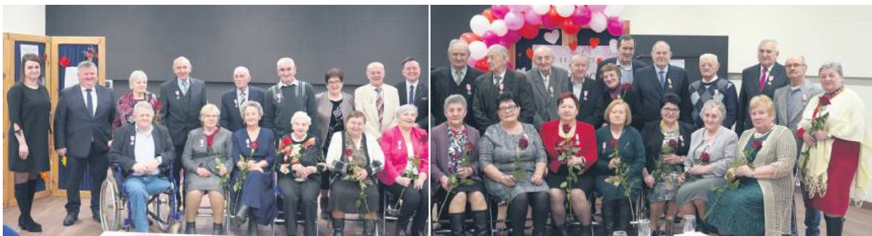
W tym roku złote gody w Gminie Sułów świętują 26 par małżeńskich.

W obecnych czasach coraz trudniej o takie rocznice jak ta. Dlatego złote gody warto uczcić odpowiednią uroczystością. Tak też zrobiono w gminie Sułów.