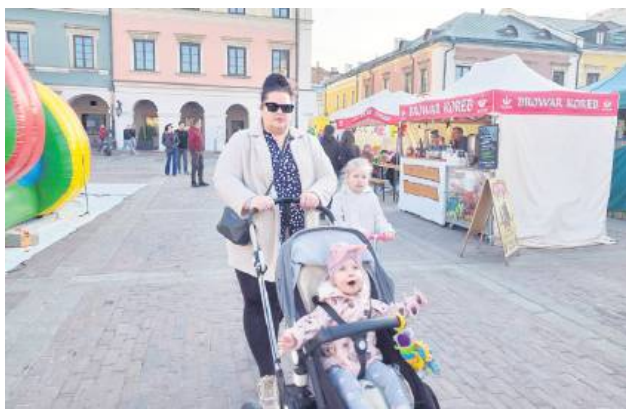
Na Festiwalu Czekolady atrakcji było pod dostatkiem zarówno dla dorosłych, jak i dla dzieci.