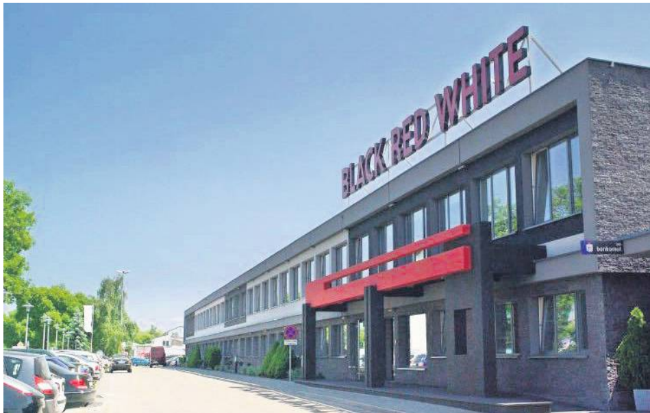
Spółka została przejęta przez zagranicznego giganta.

Grupa Black Red White posiada m.in. 82 oddziały własne (w tym 78 w Polsce), sieć ok. 300 partnerów handlowych (w Polsce) i zatrudnia ponad 5 000 osób. Eksportuje własne produkty do ponad 30 krajów na całym świecie. Grupa Black Red