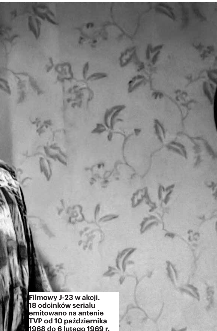
Filmowy J-23 w akcji. 18 odcinków serialu emitowano na antenie TVP od 10 października 1968 do 6 lutego 1969 r.

wistości dołączył do grupy niemieckich agentów za sprawą polskich służb specjalnych. Z czasem zaczął szpiegować na dwa fronty, co mogło się dla niego skończyć tragicznie - został zdemaskowany zarówno przez polskie, jak i przez niemieckie służby. Od 1942 r. do końca wojny siedział na zmianę w berlińskich i bawarskich więzieniach.