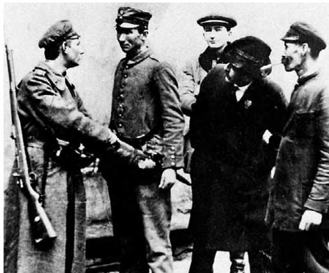
Miesiąc po zamachu, 10 listopada 1918 roku, Warszawa. Członkowie POW rozbierają niemieckiego żołnierza

Czy egzekucja na Schultzem warta była Virtuti?