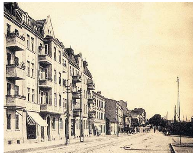
Ulica Chełmińska w Grudziądzu w połowie lat 20. Za kamienicami widać ogródki działkowe