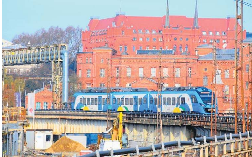
Pociągi mają odjeżdżać w stałych odstępach czasu - co godzinę lub co dwie godziny. To jedno z głównych założeń Horyzontalnego Rozkładu Jazdy

Planiści HRJ po raz pierwszy w Polsce opracowali spójne założenia w tym zakresie dla całego kraju na lata 2030-2040