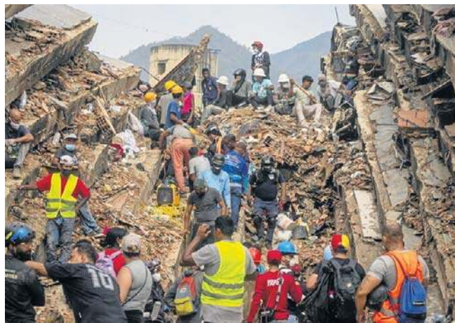
Podczas dwóch trzęsień ziemi wielopiętrowe budynki w stanie La Guaira „runęły jak kostki domina”

Oficjalny bilans ofiar śmiertelnych trzęsień ziemi z 24 czerwca przekroczył we wtorek 1,9 tys., a ponad 10,5 tys. osób jest rannych. Ekspertki oceniają, że liczba zabitych może znacznie wzrosnąć. ONZ szacowała liczbę zaginionych na ponad 50 tysięcy. PAP