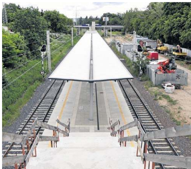
Na przystanku SKM wciąż trwają prace, mimo iż termin zakończenia dawno minął

- Wykonawca prowadzi również roboty związane z bu-