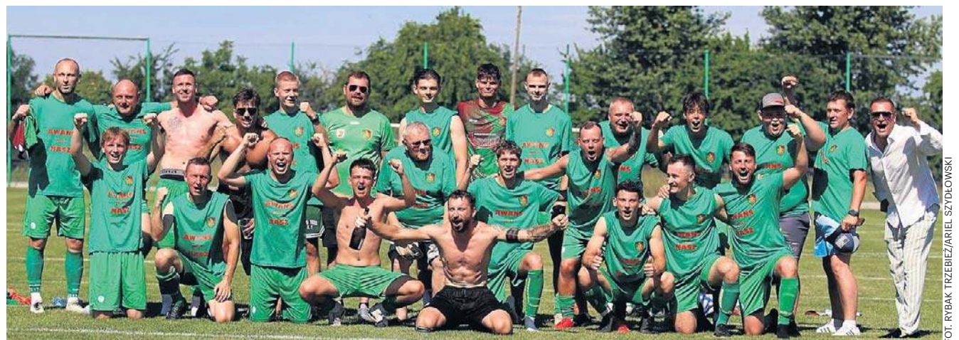
Drużyna Rybaka Trzebież awans świętowała podczas weekendu

AP Żaki Szczecin, Energetyk Gryfino, FASE Szczecin, GKS Kołbacz, Hutnik Szczecin, Iskra Banie, Jeziorak Szczecin, Mierzynianka Mierzyn, Morzycko