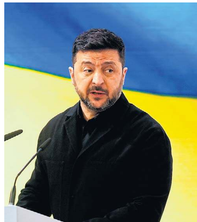
W niedzielę prezydent Zełenski wniósł do parlamentu projekt ustawy o budowie Panteonu Narodowego z imionami osób, które walczyły o wolną Ukrainę

– Bandera jako osoba, która ogłaszała w 1941 roku państwo ukraińskie i przez całe życie dążyła do uzyskania ukraińskiej niepodległości, bez wątpienia może być w panteonie. Ale listy nie ma. I obecnie są to jedynie