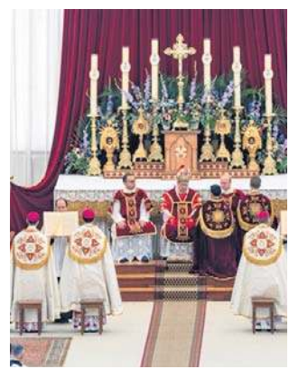
Święcenia czterech biskupów lefebrystów