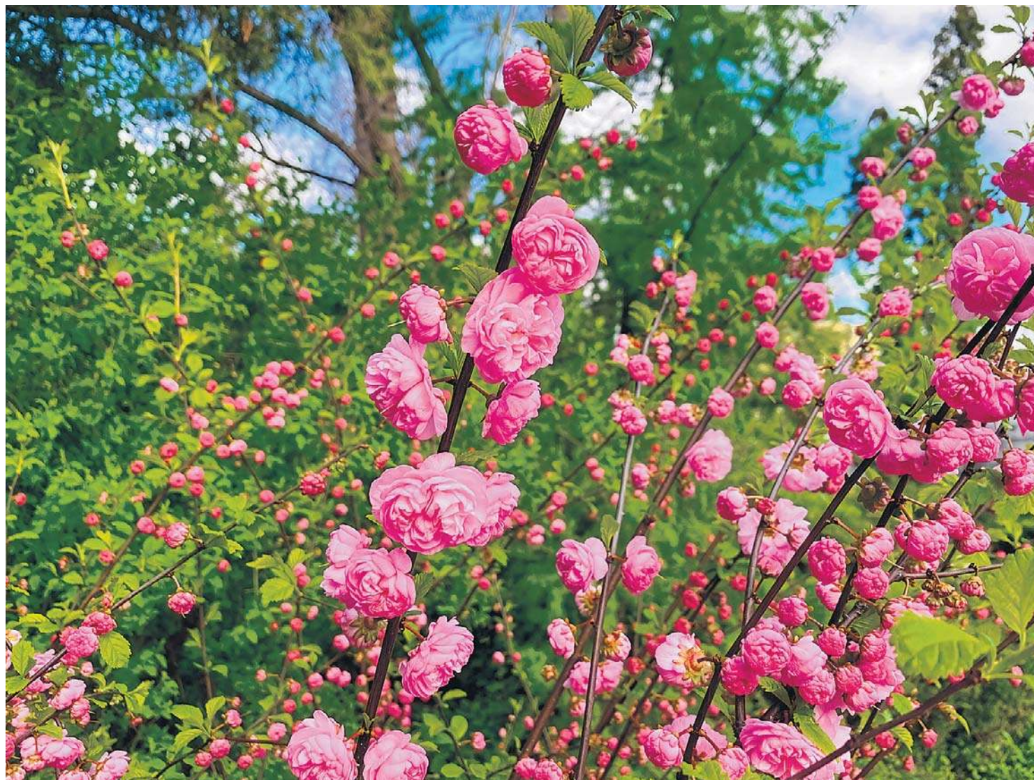
Migdałek trójklapowy swą nazwę zawdzięcza kształtowi liści. Są one eliptyczne, karbowane i mają trzy kłapy na wierzchołku. Jednak to nie liście są główną ozdobą tego krzewu lub małego drzewa, tylko małe, różowe kwiaty przypominające różyczki

Jeśli chcemy, żeby migdałek dobrze rósł, zapewnimy mu żyzną, próchniczą ziemię, najlepiej piaszczysto-gliniastą (ani zbyt ciężką, ani szybko przesychnającą). Miejsce pod uprawę warto zasilić kompostem, później również warto sięgać po ten nawóz (lub do-