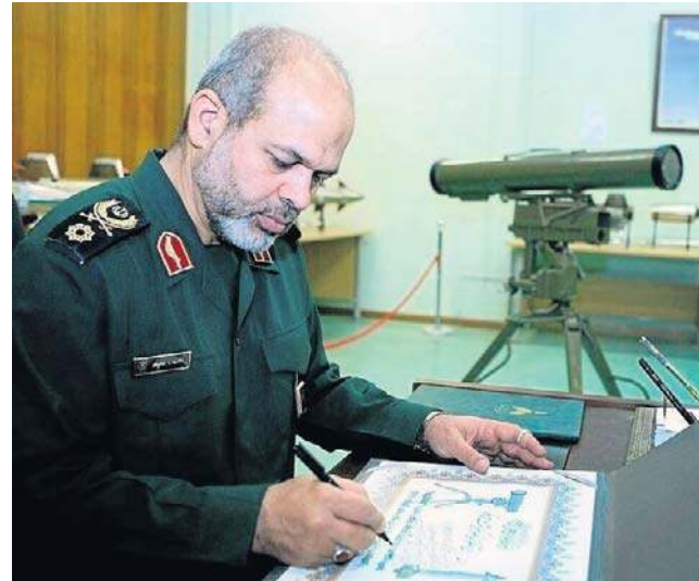
Generał Vahidi, dowódca Korpusu Strażników Rewolucji Islamskiej, rządzi dziś de facto Iranem

Media powiązane z IRGC ogłosiły również w sobotę, że Iran nie zgodził się na udział w kolejnej rundzie negocjacji ze Stanami Zjednoczonymi z powodu „nadmiernych” żądań USA.