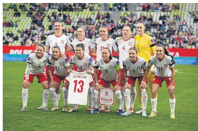
Polskie piłkarki coraz bliżej spadku do Dywizji B Ligi Narodów. W Dublinie nie dały rady reprezentacji Irlandii

Sztuki walki Chalidow zdemolowany przez Pawlaka na gali KSW 117