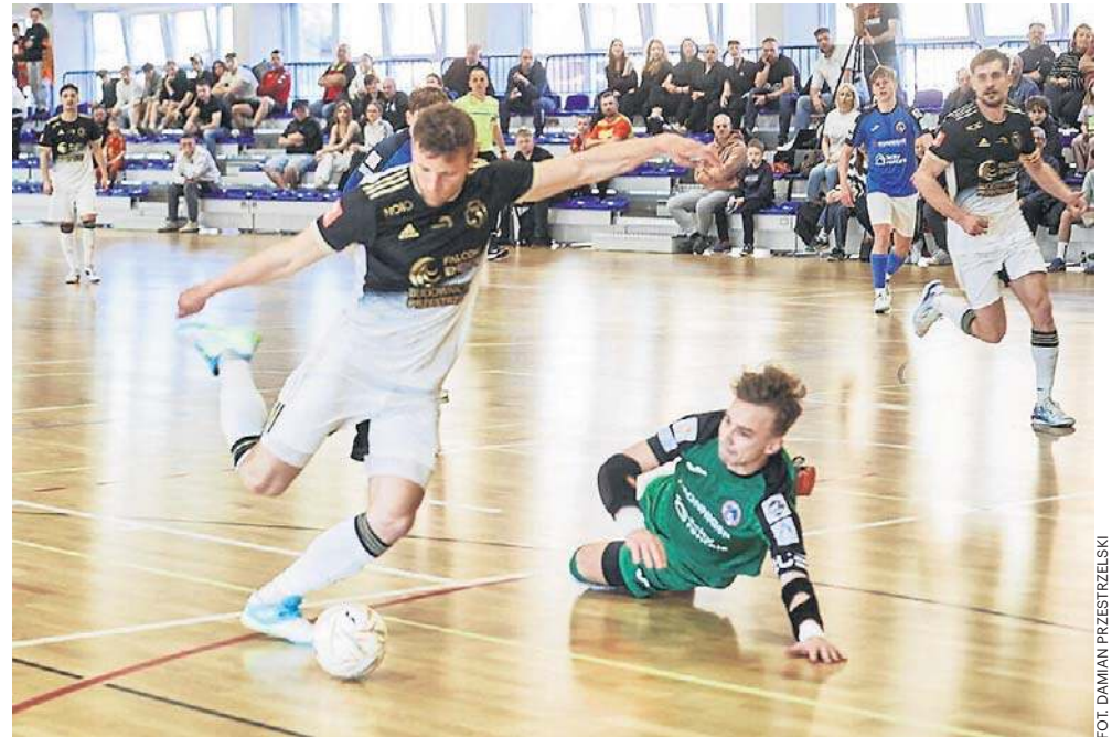
Jagiellonia Futsal na koniec sezonu zasadniczego wygrała 5:3 z Dragonem Bojano

Jeszcze przed przerwą Podlasianie złapali kontakt, po trafieniu Pedro Guaglianone, a po zmianie stron pokazali, że nieprzypadkowo są wiceliderem grupy północnej, zwyciężając ostatecznie 5:3.