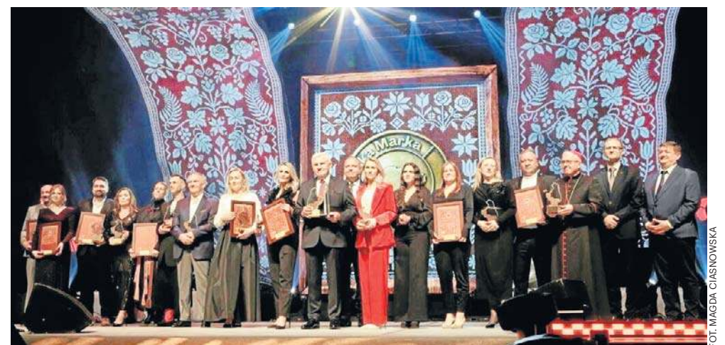
Uroczysta gala odbyła się w piątek w Operze i Filharmonii Podlaskiej