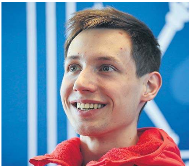
Kacper Tomasiak w minionym sezonie odniósł życiowe sukcesy. Na igrzyskach olimpijskich zdobył trzy medale

- W zasadzie nie zastanawiałem się jeszcze aż tak bardzo nad tym. Na pewno będzie łatwiej pod tym względem, że po prostu nie będzie aż tak dużo tych nowych doświadczeń, jakie były podczas debiutu w Pucharze Świata i w tym pierwszym sezonie. Już będę więcej wiedział, co i kiedy robić. A co do presji, to myślę, że dopiero