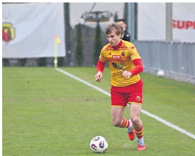
Jagiellonia II Białystok pokonała Broń Radom 2:1

W ostatnim meczu kolejne trzy punkty dopisała sobie do tabeli Jagiellonia II Białystok pokonując na wyjeździe Broń Radom 2:1.