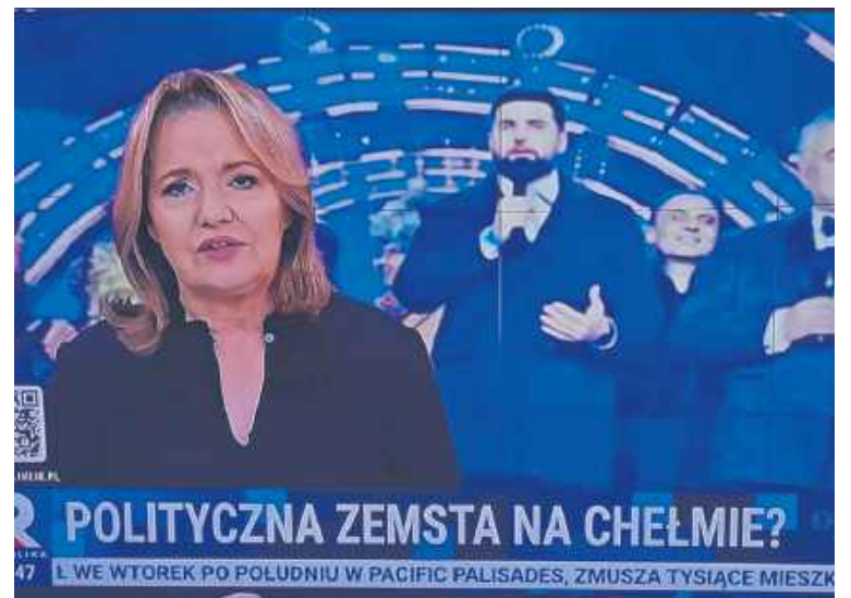
Część ogólnopolskich mediów mówi, że Chełm jest na wojnie z rządem, czemu prezydent zaprzecza, a związana z PiS TV Republika, z którą nasze miasto organizowało ostatniego sylwestra, donosi o „politycznej zemście na Chełmie”

Tak też się stało. 31 grudnia ub.r. miasto złożyło pozew przeciwko Skarbowi Państwa reprezentowanemu przez ministra kultury o unieważnienie decyzji o rozwiązaniu umowy. Miasto domaga