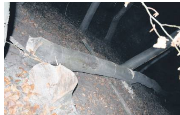
Do nieszczęśliwego wypadku doszło na terenie kompleksu leśnego w miejscowości Dzierżnia.

53-letni mieszkaniec gminy Krynice został przygnieciony przez drzewo. Stało się to podczas wycinki w lesie. Z obrażeniami ciała został przetransportowany do szpitala. Okazało się, że podczas pracy był nietrzeźwy.