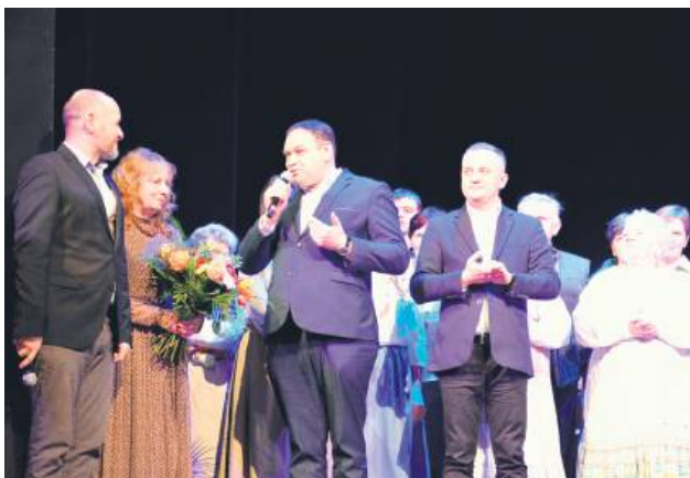
Wiele ciepłych słów płynęło z lubelskiej sceny w kierunku Tarnogrodu.

„Onegdaje Osterwy. Spotkania z Tradycją” to cykl mający na celu pielęgnowanie oraz