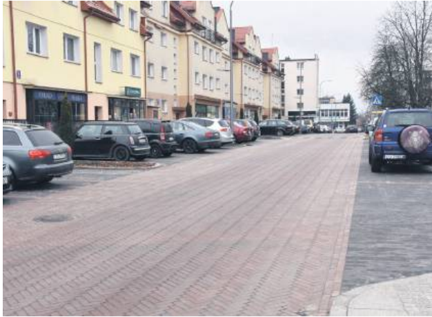
Jednym z pomysłów jest stworzenie strefy krótkoterminowego parkowania.

Podkreślają, że na Placu Wolności, będącym centralnym punktem miasta, od dłuższego czasu występuje deficyt miejsc parkingowych. Zwracają uwagę m.in. na długoterminowe parkowanie samochodów przez pracowników Urzędu Miasta i innych instytucji publicznych. Ich zdaniem mieszkańcy pobliskich bloków parkujący na Placu Wolności, mimo dostępnych miejsc za budynkami, korzystają z miejsc publicznych, co uniemożliwia klientom i interesantom znalezienie miejsca do krótkoterminowego postoju. Brak dostępnych miejsc parkingowych wpływa na zmniejszenie