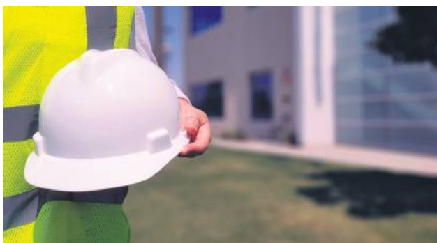
Cudzoziemiec, który pracuje w Polsce, podlega takim samym ubezpieczeniom społecznym jak inni obywatele.

Przez ostatni rok podwoiła się liczba ubezpieczonych w lubelskim ZUS Uzbeków