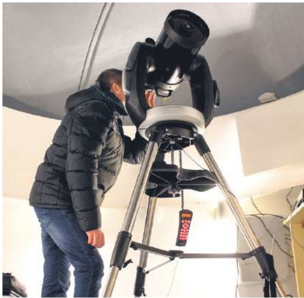
w Obserwatorium astronomicznym w Trzeszczanach są dwa teleskopy, jeden do obserwacji nocnych, a drugi tzw. słoneczny – umożliwiający obserwację w ciągu dnia.

Budowa obserwatorium (z adaptacją budynku po byłej młeczarni) w Trzeszczanach kosztowała prawie 270 tys. zł. W tych kosztach mieści się również zakup sprzętu i wyposażenia, z tym że 85 proc. całości wydatków sfinanso-