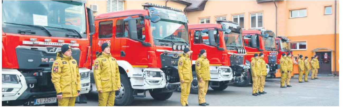
Podczas uroczystości w Zamościu przekazano 11 sztuk sprzętu.