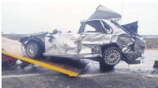
Każdego roku na polskich drogach dochodzi do setek wypadków spowodowanych przez pijanych kierowców.

W niedzielę 2 marca nad ranem na drodze krajowej nr 17 w miejscowości Jeziernia (gmina Tomaszów Lubelski) doszło do poważnego wypadku samochodowego. Jak wynika ze wstępnych ustaleń funkcjonariuszy, jedną z jego przyczyn było prowadzenie pojazdu przez pijanego kierowcę. W wyniku zdarzenia pasażerka została ciężko ranna. W poniedziałek rano rzeczniczka tomaszowskiej policji informowała, że kobieta walczy o życie.