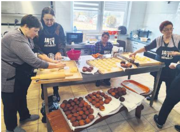
Panie usmażyły na głębokim tłuszczu 150 pączków! Później była ich degustacja.

– Tłusty czwartek to ostatni czwartek przed Wielkim Postem. To taki dzień, na który