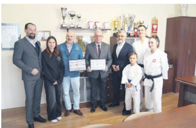
Zawodnicy Tomaszowskiej Akademii Sztuk Walki w ubiegłym tygodniu osobiście podziękowali władzom powiatu tomaszowskiego za wsparcie finansowe udzielone w 2024 roku. W tym także je dostaną.

Powiat tomaszowski w styczniu ogłosił otwarty konkurs ofert na realizację