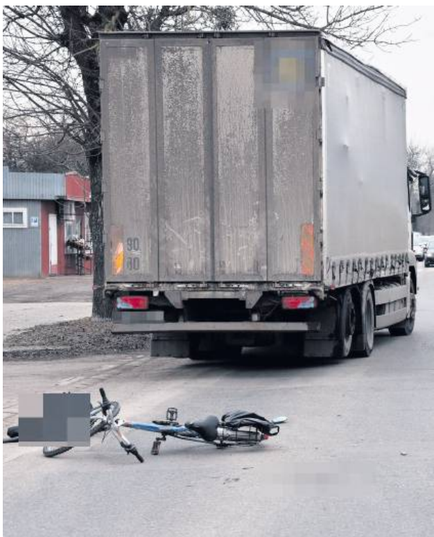
Mężczyzna nagle wykonał manewr skrętu w lewo tuż przed jadącym za nim pojazdem ciężarowym.

63-letni rowerzysta, jadąc przed pojazdem ciężarowym, nagle wykonał manewr skrętu w lewo. Kierowca manę próbował uniknąć zderzenia, jednak rowerzysta uderzył w bok pojazdu, przewracając się na ziemię.