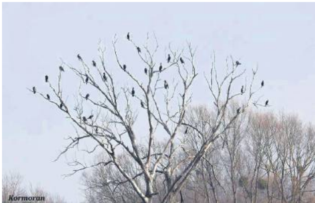
Zima była łagodniejsza, stąd w powiecie hrubieszowskim w tym roku zimowało więcej różnych gatunków ptactwa.