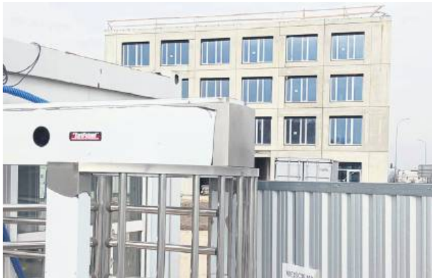
Miasto jest zadowolone z postępu prac.

– Fajnie, że biurowiec powstaje, ale biurowiec, ściany, to