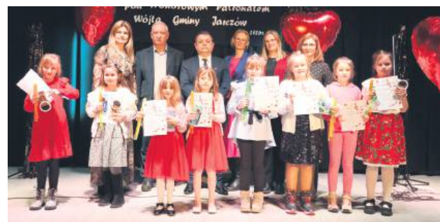
Konkurs „Od serca dla serca” w Jarczowie został rozstrzygnięty.