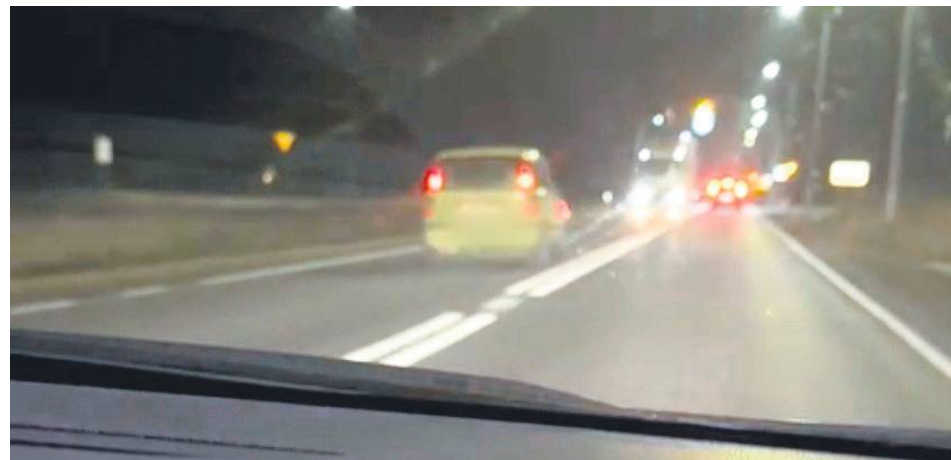
Tylko dzięki reakcji innego kierowcy nie doszło do wypadku.