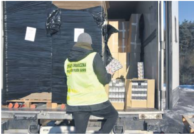
W naczepie znajdowało się ponad 7 milionów sztuk papierosów pochodzących z nielegalnej produkcji.

Funkcjonariusze Straży Granicznej, Służby Celno-Skarbowej oraz policjanci udaremnili przemyt ponad 7 mln sztuk papierosów bez polskich znaków akcyzy. Śledztwo w sprawie jest w toku, a służby nie wykluczają kolejnych zatrzymań.