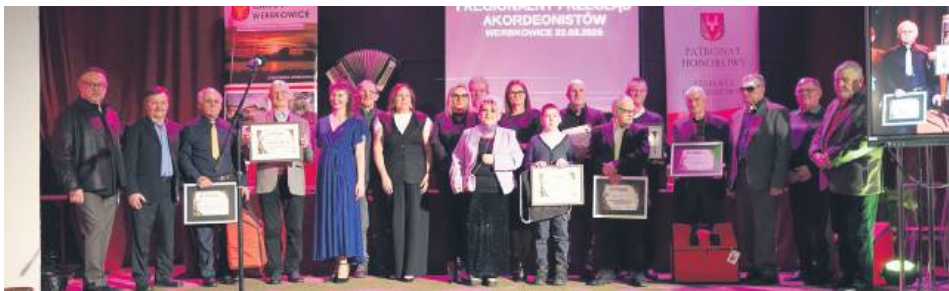
Uczestnicy Przeglądu Akordeonistów w Werbkowicach.

Do I Regionalnego Przeglądu Akordeonistów zgłosiło się 16 muzyków, jednak na festiwal do Werbkowic przyjechało 14 z nich. W przesłuchaniach pod-