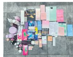
Za kradzież kosmetyków kobiecie grozi do 5 lat więzienia.

22 lutego policjant Wydziału Kryminalnego z biłgorajskiej komendy, w czasie wolnym od służby, zatrzymał kobietę, która okradła jedną z drogerii na terenie miasta. Funkcjonariusz zauważył, jak 31-latk przekładała kosmetyki z koszyka do prywatnej torby. Następnie podeszła do