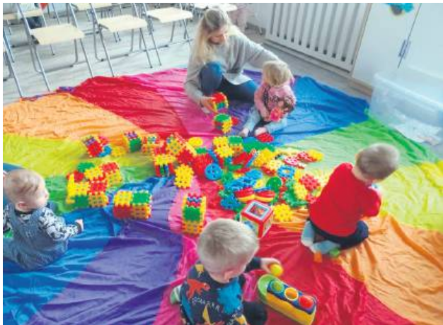
Może i dzietność w powiecie tomaszowskim jest niska, ale za to polepszają się warunki dla rozwoju dzieci i powstają nowe udogodnienia dla rodziców. Od września nowy żłobek w Grodyślavicach (gm. Rachanie) będzie miał już komplet maluszków.

W minionym roku największą liczbę urodzeń odnotowano w gminie Susiec (33) i Jarczów (28). W gminie Tyszowce urodziło się tylko 26 dzieci, w gm. Lubycza Królewska – 25, w gm.