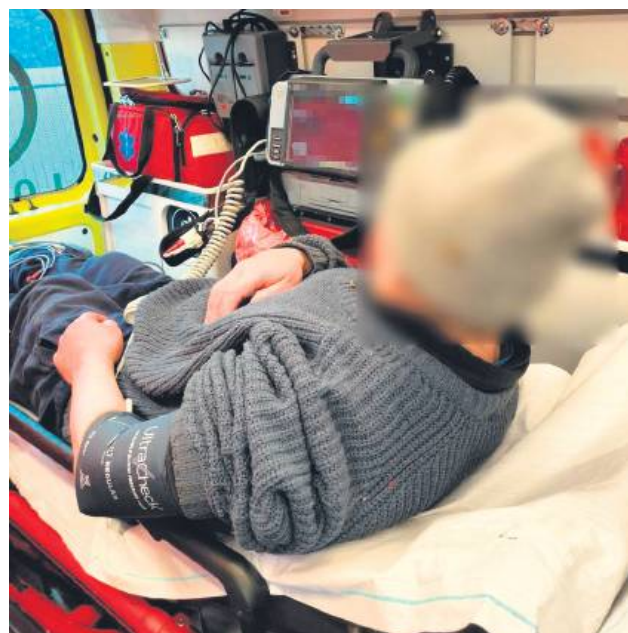
Wychłodzony mężczyzna trafił do szpitala.

Od razu po otrzymaniu informacji o zaginięciu na poszukiwania wyruszyli policjanci. Asp. sztab. Wiesław Buryło, na co dzień pełniący służbę na stanowisku kierownika biłgorajskiej komendy, będąc w tym dniu na urlopie, postanowił do nich dołączyć. Wspólnie z kolegą,