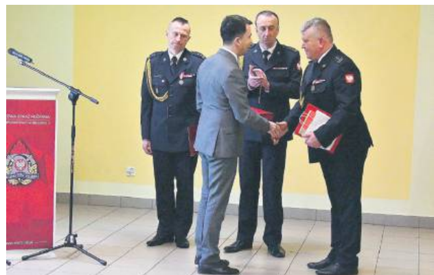
Samorządowy dziękowali za wzorową współpracę.