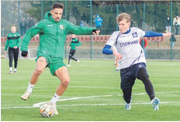
Gdyby KS Drzewce nie wycofał się z IV ligi, w której zakończył sezon 2023/2024 na szóstym miejscu, to w tym sezonie rywalizowałby w najwyższej w woj. lubelskim klasie rozgrywkowej z Hetmanem Zamość. W sobotę oba zespoły miały okazję spotkać się w Zamościu, by zagrać ze sobą w celach szkoleniowych.