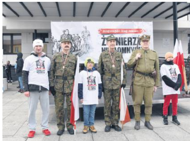
W biegu udział brali zarówno młodzi jak i starci.

o wolną Polskę, nie o partię polityczną, nie o ideologię, nie o system, tylko o Polskę. Walczyli o wartości, które przez tysiąc lat historii naszej ojczyzny formowały się przez wszystkie pokolenia. Walczyli za wartości, za które ginęły wcześniejsze pokolenia Polaków w wielu wojnach i wydarzeniach historycznych na przestrzeni wieków. Byli zabijani, a ich ciała chowano w grobach, których nikt nigdy nie miał znaleźć, ale komuniści zapomnieli, że każde ziarno rzucone do ziemi wydaje stokratny plon – mówił. Zaznaczył, że to głównie od młodych zależy, jak Polska będzie wyglądała w przyszłości. Życzył, aby wszystkie wartości, za które walczyli i ginęli żołnierze wyklęci, nie były zapomniane, a zawsze aktualne.