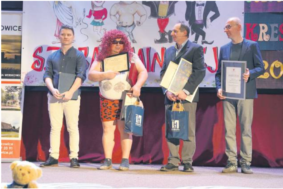
Kabareciarze z Szarej Eminencji otrzymali listy gratulacyjne od wójta gminy Werbkowice.

Okazem jubileuszu działalności kabaretu „Szara Eminencja” z Werbkowic pisaliśmy w czwartym tegorocznym numerze Kroniki Tygodnia. W lutym 2000 r. „Szara Eminencja” rozpoczęła działalność