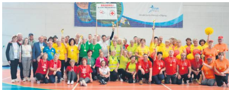
Najlepsza drużyna otrzymała puchar.