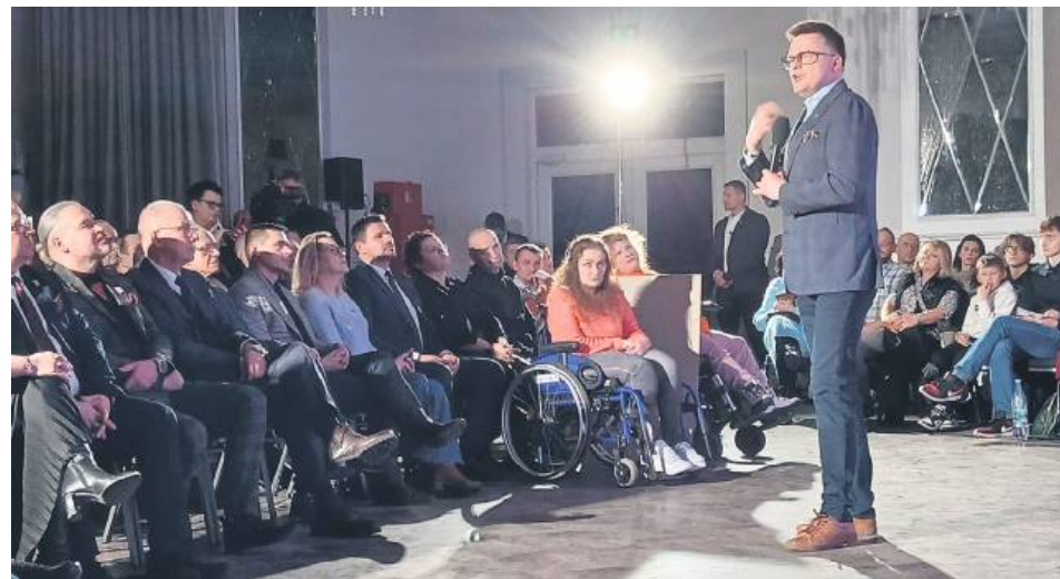
19 lutego podopieczni „Krok za krokiem” pojawili się na spotkaniu z Szymonem Hołownią.

S towarzyszenie Pomocy Dzieciom Niepełnosprawnym „Krok za krokiem” prowadzi na Zamojszczyźnie 10 placówek dla osób z niepełnosprawnościami oraz inne formy