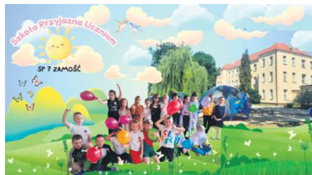
W tym roku powstanie zielona klasa oraz siłownia plenerowa.

F undamentami ogłoszonego przez Kuratorium Oświaty w Lublinie programu „Szkoła Przyjazna Uczniom” są dbałość o dobrostan uczniów, wspierająca atmosfera i nowoczesne