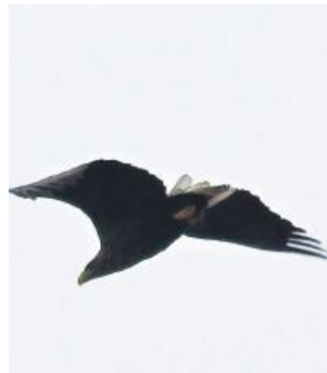
Orzeł bielik zamieszkuje głównie obszary przylegające do zbiorników wodnych oraz w pobliżu rzek.

Najwięcej ptaków wystąpiło na odsojnikach przy Cukrowni w Werbkowicach. Tam doliczono łącznie 1 559 ptaków. Na jednym ze zbiorników bytowało w tym czasie około 1 500 krzyżówek. Sporym zaskoczeniem był przeletujący klucz 46 żurawi. Na stawach w Nielewcu doliczono łącznie 240 ptaków, w tym 151 to krzyżówki, 49 łabędzi niemych, a także 1 zimorodek. Na czterech odcinkach rzeki Huczwy zaobserwowałem w sumie 1 273 ptaki, a konkretnie 445 krzyżówek, 59 kormoranów, 12 czapli białych, 232 kwiczoły i 122 bogatki. Najciekawszymi ptakami zaobserwowanymi nad Huczwą były jeden orzeł bielik, 1 drożdżak i 8 zimorodków – hrubieszowianin podaje precyzyjne