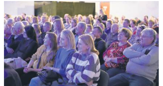
Sala widowiskowa w GOK w Werbkowicach wypełniona była do ostatniego miejsca.

Miasto Zamość informuje o realizowanym od 17.02.2025 r. do 31.12.2025 r. zadaniu