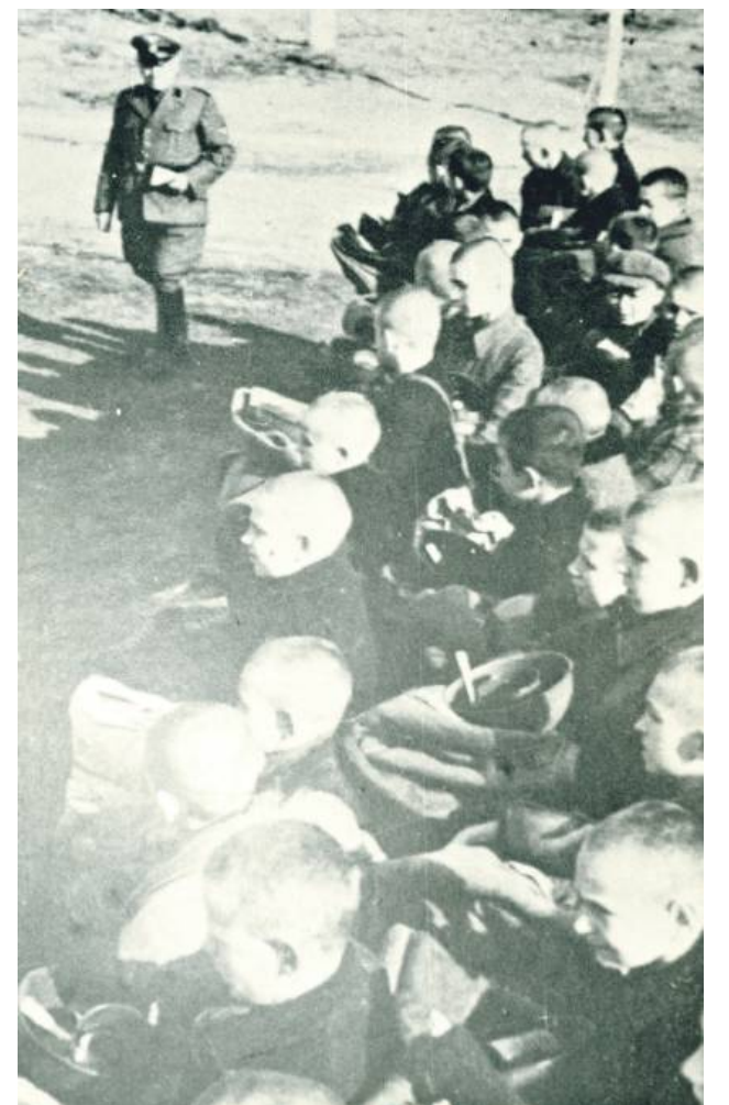
Dzieci Zamojszczyzny.