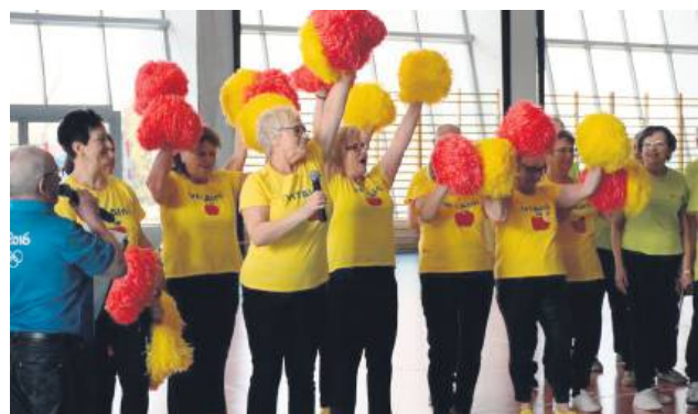
Seniorzy bawili się doskonale.

Seniorzy pokazali nie tylko świetną formę fizyczną, ale również ogromną wolę walki i fantastycznego ducha sportowej rywalizacji. Atmosfera zawodów była pełna pozytywnej energii, a uczestnicy imponowali zaangażowaniem i determinacją. W konkurencjach sportowych znalazł się m.in. rzut gazetą i woreczkiem, strzały do bramki czy wyścig przebiegaczy.