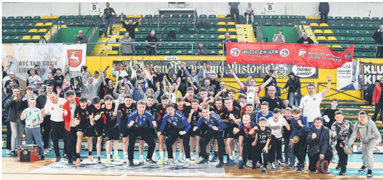
Młoda Padwa Zamość mogła liczyć na znakomity doping swoich kibiców!

MKS PADWA: Dragan, Krysiak, Kulik – Bielecki 6, Krasnopolski 6, Kania 5, Łyś 4, Smył 4, Sokółowski 3, Gawliczek 1, Porowski, Niedźwiedź, Szewczuk, Litwińczuk, Van Der Spek, Sendłak.