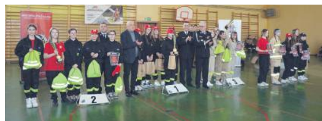
W zawodach wzięły udział 42 drużyny.