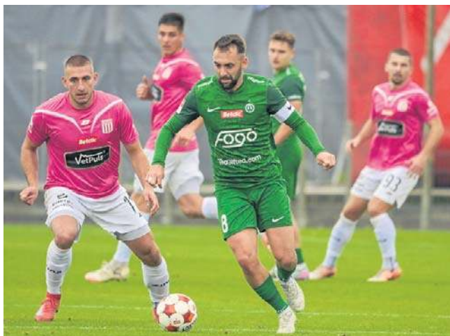
Jesienią Olimpia (różowe koszulki) przegrała Poznaniu. Teraz chce się zrewanżować Warcie

W Betclit 3. Lidze czas na 28. kolejkę. Prowadzący w rozgrywkach Zawisza Bydgoszcz pojedzie do Błękitnych Stargard bronić skromnej dwupunktowej przewagi nad Wikędem Luzino. Niebiesko-czarni udadzą na Pomorze Zachodnie w kiepskich humorach po odpadnięciu z Pucharu Polski Kujawsko-Pomorskiego Związku Piłki Nożnej. Bydgoszczanie przegrali po serii rzutów karnych 2:4 z czwartoligową Pogonią Mogilno. W regulaminowym czasie i po dogrywce było 0:0. Tym samym zawiszanie nie obronią trofeum. Mecz Błękitni - Zawisza w sobotę o godz. 13.