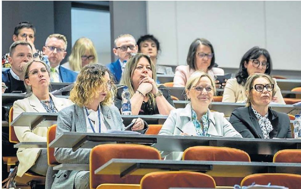
Konferencja z okazji 60-lecia Poradni Psychologiczno-Pedagogicznej nr 1 w Bydgoszczy

W 1974 r. poradnię przeniesiono na ul. Nakielską 11. Rok