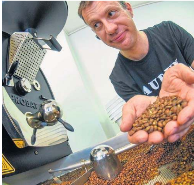
O Audunie pisaliśmy już, gdy w 2015 roku został mistrzem świata w wypalaniu kawy

Niedawno w San Salvador (stolica Salvadora w Ameryce Środkowej) odbył się prestiżowy konkurs Global Coffee Awards - World Championship Competition. Przesłano w su-