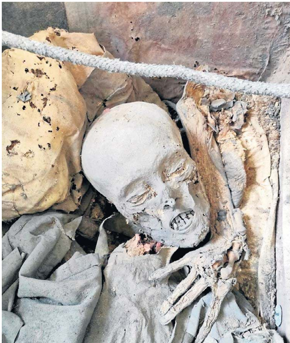
Poszukując materiału do analiz, naukowcy zidentyfikowali około 350 potencjalnych nekropolii piastowskich rozsianych po całej Polsce. Jedynie w ośmiu z nich odnaleziono szczątki ludzkie