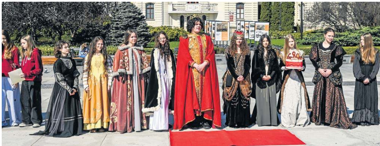
Gdy zaczynały się obchody urodzin Bydgoszczy tak uczniowie IV LO świętowali 680. rocznicę nadania praw miejskich Bydgoszczy i 716. rocznicę urodzin króla Kazimierza Wielkiego. Dziś ulicami od bydgoskiego ratusza pod pomnik przejdą młodzi Bydgoszczanie