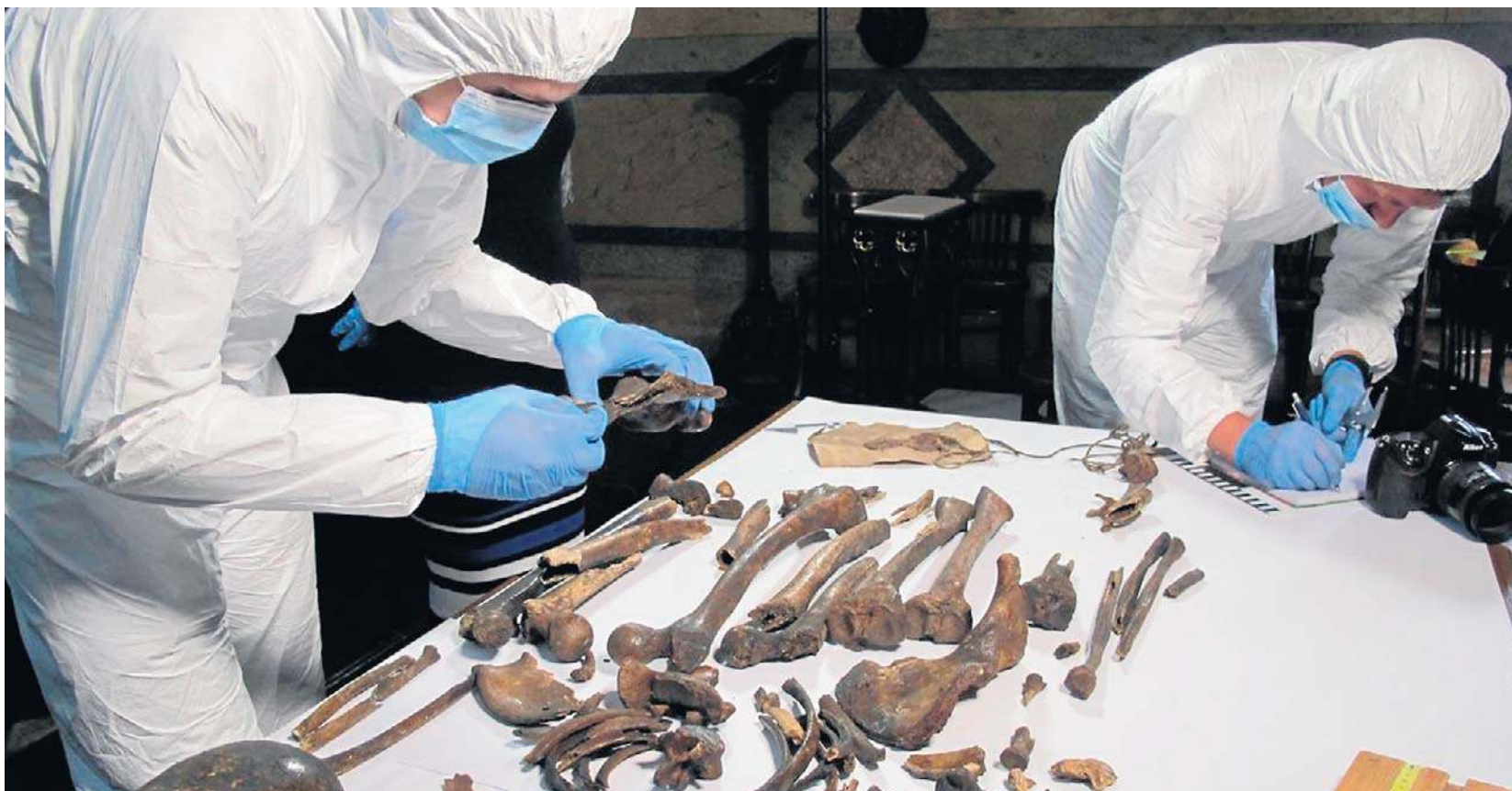
W sumie badaniami objęto 33 osoby. W przypadku dziesięciu udało się z dużym prawdopodobieństwem potwierdzić ich tożsamość jako Piastów

W kwietniu w prestiżowym czasopiśmie „Nature Communications” opublikowano wyniki badań genetycznych dynastii Piastów. To pierwsze tak szeroko zakrojone przedsięwzięcie, które zamiast rekonstrukcji opartych na domysłach dostarcza twarde dane dotyczące pochodzenia elit tworzących zręby państwa polskiego. Jednocześnie nie przynosi ono prostych odpowiedzi – raczej zmusza do zadania nowych pytań o to, co do tej pory uznawaliśmy za pewnik. Jedno z nich powraca najczę-