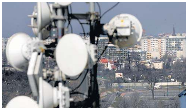
FOT. PAWEŁ RELIKOWSKI/ZDZIECIE ILLUSTRACYNE

Pełnomocnik rządu ds. cyberbezpieczeństwa Krzysztof Gawkowski apeluje o aktualizację systemów Cisco IMC i Cisco NFVIS. Przez wykrytą lukę w oprogramowaniu zagrożone są urzędy, szpitale, uczelnie i sektor energetyczny. Jak radzą sobie bydgoskie instytucje?