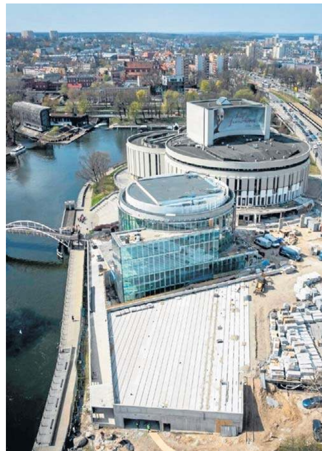
Trwa budowa IV kręgu Opery Nova. Jej zakończenie ma nastąpić do końca 2026 r. Wcześniej do użytku planuje się oddać podziemny, dwupoziomowy parking na 212 pojazdów; niestety widzowie XXXII Bydgoskiego Festiwalu Operowego (potrwa od 25 kwietnia do 10 maja) nie zaparkują jeszcze pod IV kręgiem