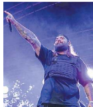
Latem 2023 Bedoes wystąpił na koncercie w rodzinnej Bydgoszczy

Jak więc wielką sprawą jest historia, która rozgrzała w ostatnich dniach internet, stację telewizyjną, rozgłośnie radiowe i pocziwe stare gazety. Historia, która ma swój początek w Bydgoszczy, ściślej na Bartodziejach, bo z tego osiedla wywodzi się raper Bedoes 2115. Nie będę udawać, że znam się na rapie. Trudno też uwierzyć, że starsza pani, taka jak ja, w ogóle