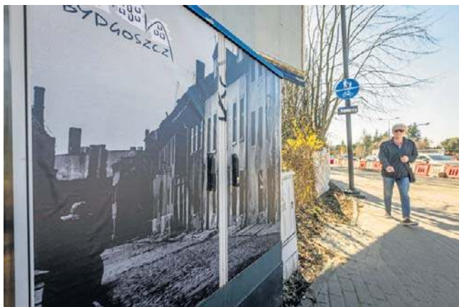
Zamiast szarej skrzynki, historyczne zdjęcie Bydgoszczy, co na pewno jest miłsze dla oka przechodnia