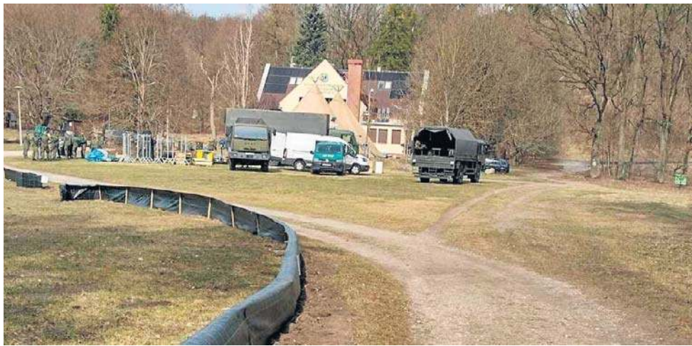
Przełajowe zawody pomiędzy Centrum Edukacji Ekologicznej i strefą ochronną żab

mObywateł wypalił dość szybko, choć niezbyt celnie. Za jego przyczyną doniesienie trafiło do Wojewódzkiego Inspektoratu Ochrony Środowiska w Bydgoszczy. Inspektorat uznał jednak, że podjęcie tematu nie leży w jego kompetencjach i sprawę skierował do Regionalnej Dyrekcji Ochrony Środowiska. Ale i tam doniesienie nie znalazło swojej szufladki (od sygnalistki domagano się dowodów na złamanie prawa). Urzędniczy ping-pong zakończył się w Urzędzie Miasta Bydgoszczy. A w imieniu samorządu odpowiedź petentce wypychał