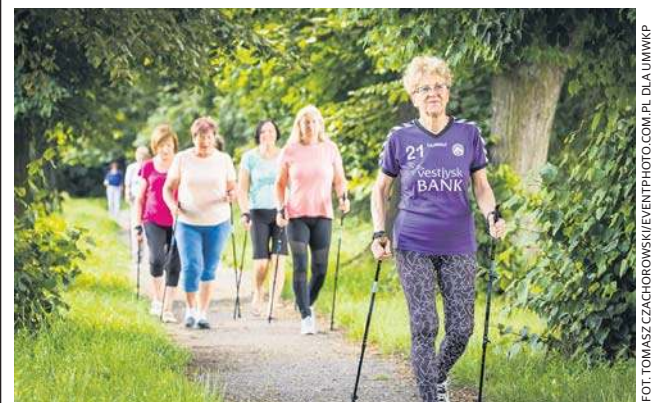
Zajęcia w klubie seniora Srebrna Energia Życia w Szubinie (powiat nakielski).

mieszkańców regionu przekazujemy z marszałkowskiego budżetu obywatelskiego łącznie 85 mln złotych. Granty są przyznawane za pośrednictwem lokalnych grup działania.