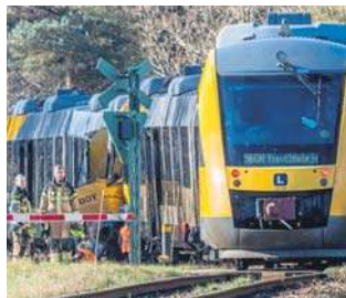
Do zderzenia dwóch podmiejskich pociągów doszło na północ od Kopenhagi

W Danii w połowie kwietnia doszło do kilkudniowego chaosu na kolei z powodu awarii trakcji, co wywołało debatę w mediach na temat stanu technicznego infrastruktury. PAP