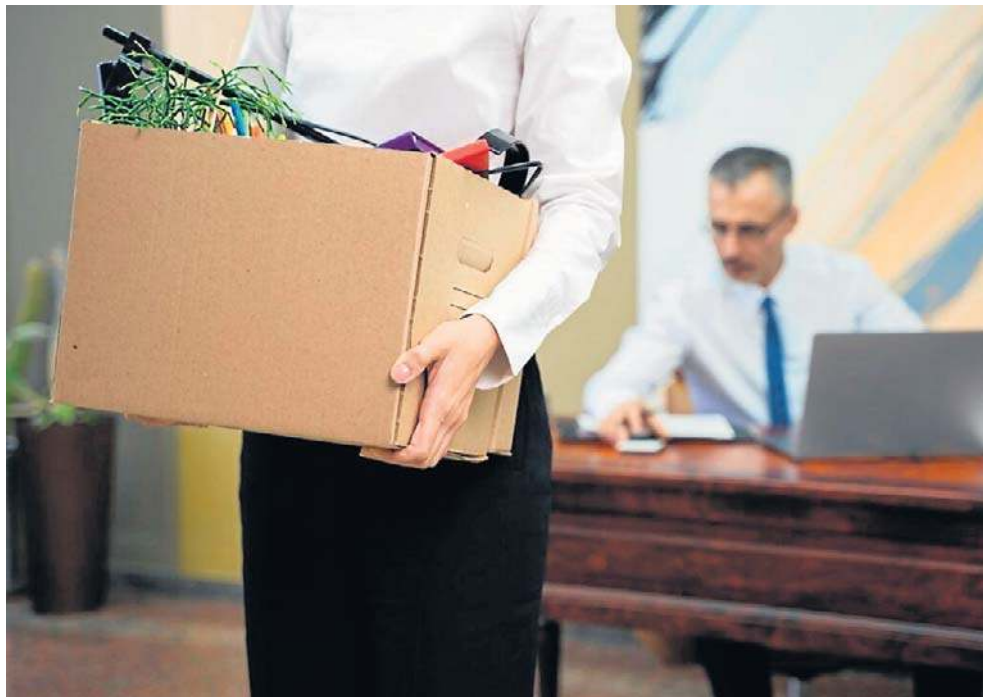
Utrata pracy to jedno z najbardziej stresujących doświadczeń życiowych i to niezależnie od tego, czy posadę tracimy po roku czy 20 latach

- Co mnie spotkało konkretnie? „Nie chwal się ślubem” - ostrzegli mnie koledzy z dłuższym stażem. A ja się pochwaliłam i pracę straciłam. Zamiast przedłużenia umowy, a liczyłam już na taką na czas nieokreślony, nastąpiło „nieprzedłużenie”.