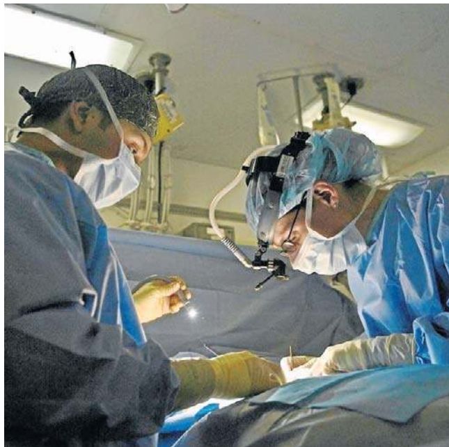
Szpitale są przygotowane na przerwy w zasilaniu energią elektryczną, ale nie wszędzie system działa bez zarzutu

- Przy przekazaniu obowiązków odchodzący wieloletni pracownik poinformował, że Szpi-