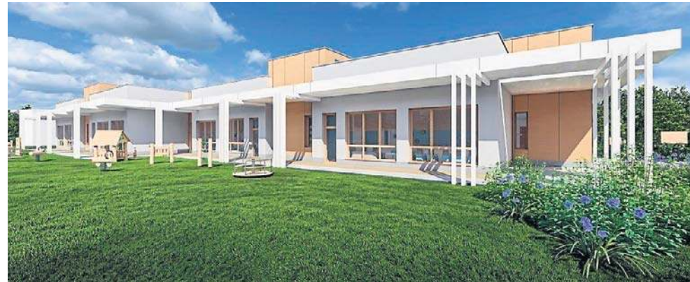
GRAFIKA UM LEGNICA

Legnica otrzymała na ten projekt dofinansowanie w wysokości ponad 10 mln zł - ponad 7 milionów złotych z Krajowego