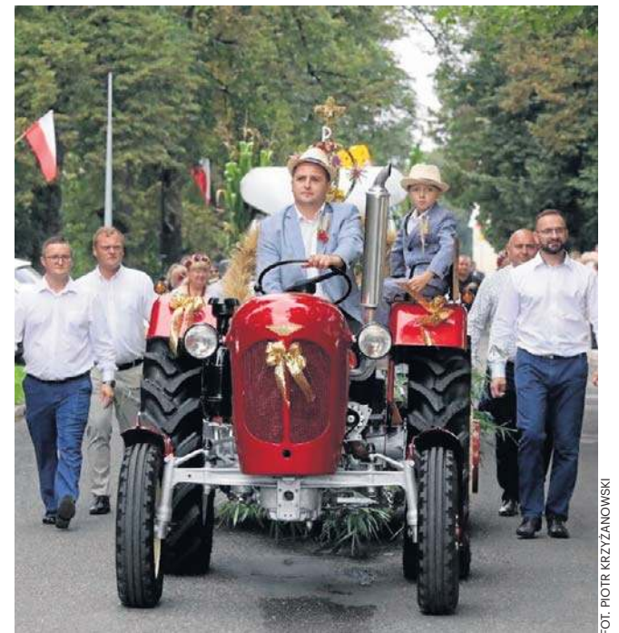
Wójt Legnickiego Pola i buskup legnicki zapraszają na dożynki

Uroczystość oficjalna uświetnią występy Łemkowskiego Zespołu Pieśni i Tańca „Kyczerza” oraz Zespołu Pieśni i Tańca „Kostrzanie”.