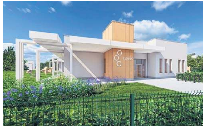
GRAFIKA UM LEGNICA

Do przetargu zgłoszili się: Budobratex I Inwestycje z Legnicy - z ofertą wynoszącą 11 mln 927 tys. zł Turpis NOVA z Wrocławia - 9 mln 478 tys. zł PB BAUMAR z Nowej Wsi - 9 mln 594 tys. zł ZUW URBEX z Lubina - 11 mln 240 tys. zł Przedsiębiorstwo Budowlano Usługowe „USBUD” z Legnicy - 12 mln 598 tys. zł