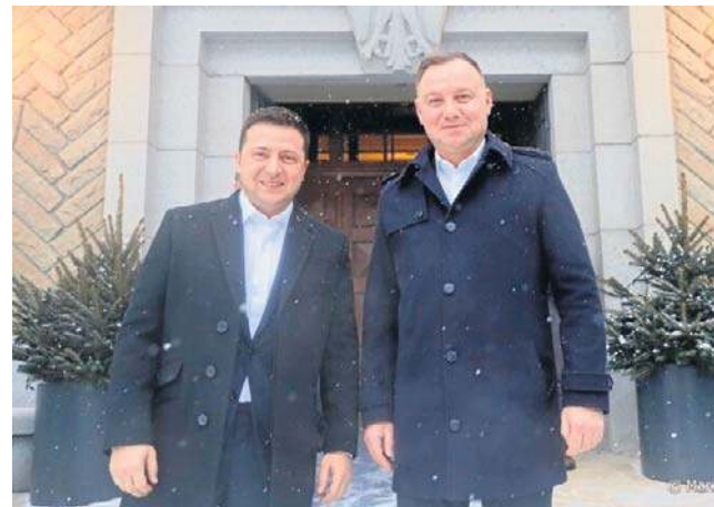
Styczeń 2022 r. Prezydenci Andrzej Duda i Wołodymyr Zełenski spotkali się w Zamku tuż przed inwazją Rosji

zydenta, Lecha Kaczyńskiego zaprasza Adam Małysz i jego rodzice” - pisaliśmy w „Dzienniku Zachodnim” na początku 2008 roku.