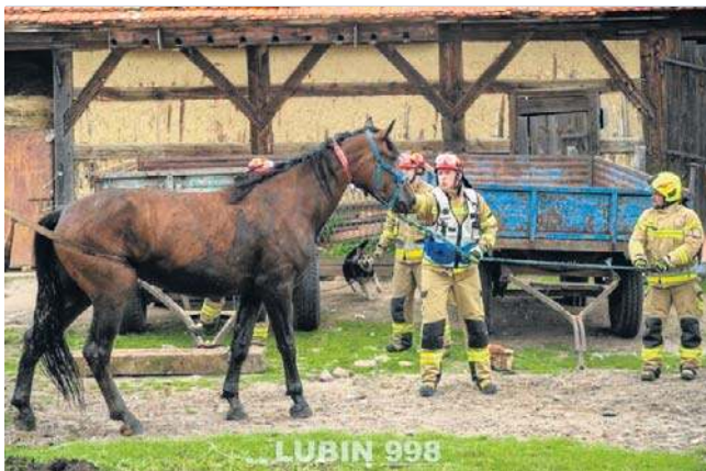
Akcja wyciągania konia ze zbiornika trwała kilkadziesiąt minut

do ciągnika z tzw. ładowaczem czołowym, czyli podnośnikiem rolniczym, należącym do właściciela konia. Gospodarz i jego małżonka cały czas pomagali strażakom w akcji.