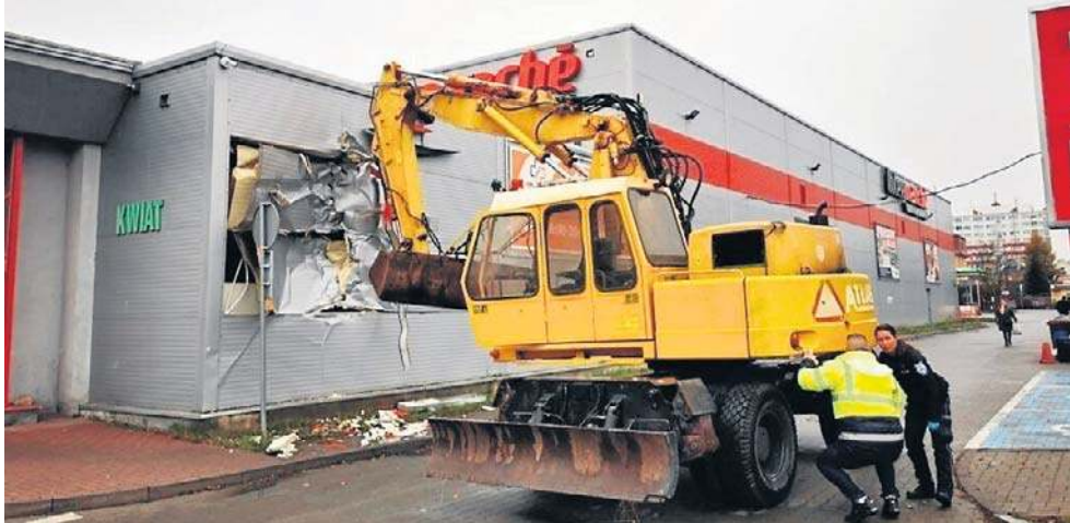
Próba obrabowania kantoru przy centrum handlowym się nie powiodła...