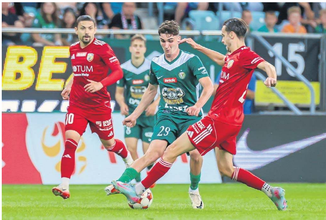
Miedzi nie brakowało ambicji, ale czerwona kartka i utrata zawodnika w drugiej połowie ustawiła mecz