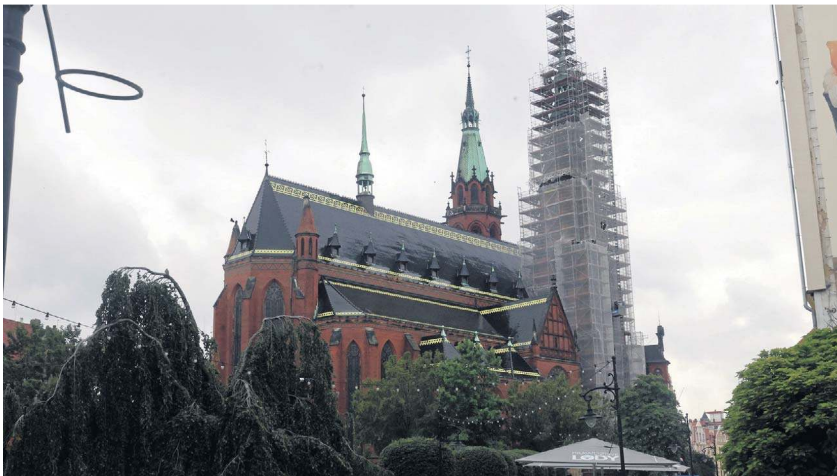
Informacja o wykryciu skarbu rozeszła się w ub. tygodniu, w tym tygodniu mamy poznać szczegóły sprawy