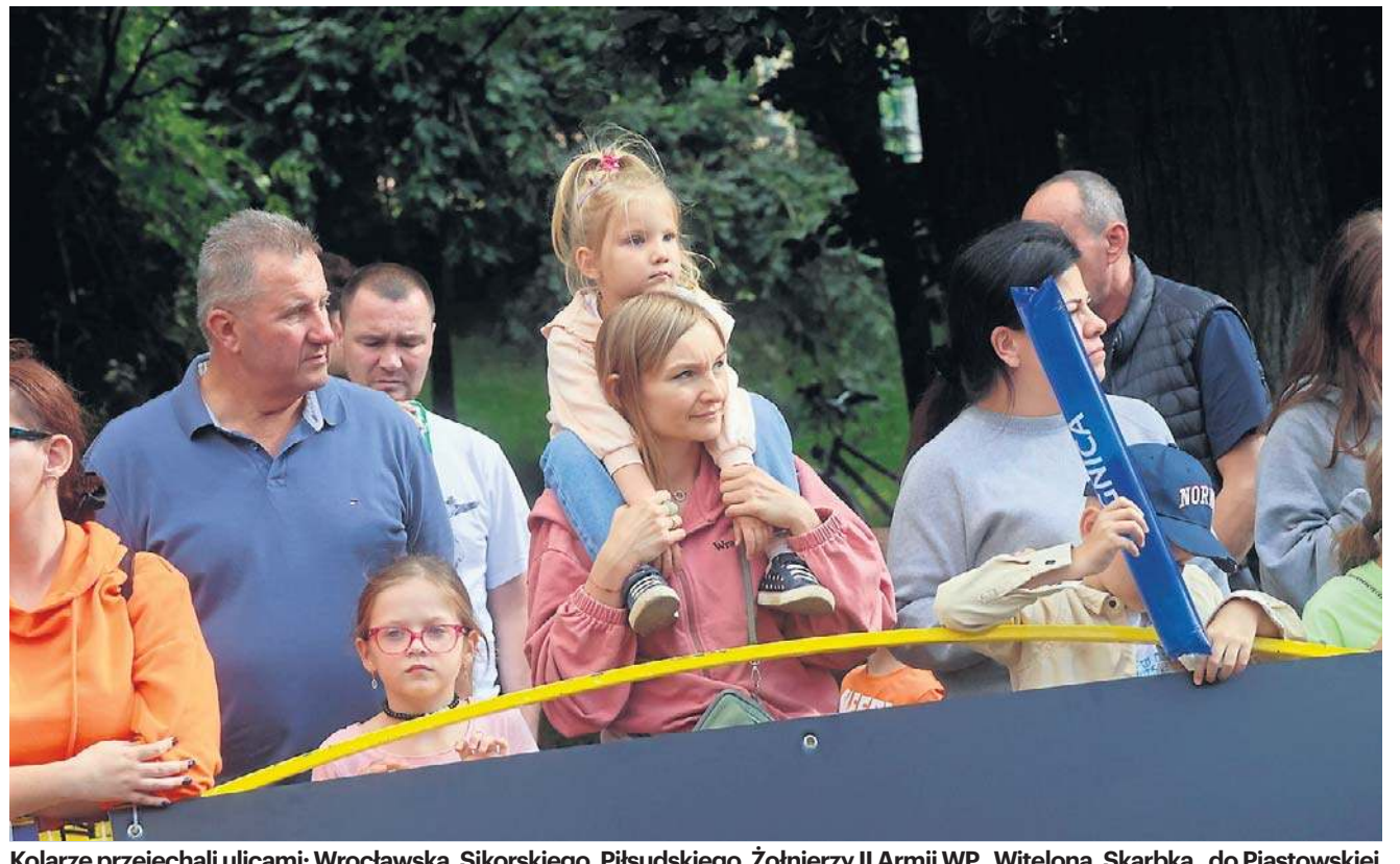
Kolarze przejechali ulicami: Wrocławską, Sikorskiego, Piłsudskiego, Żołnierzy II Armii WP., Witelona, Skarbka, do Piastowskiej