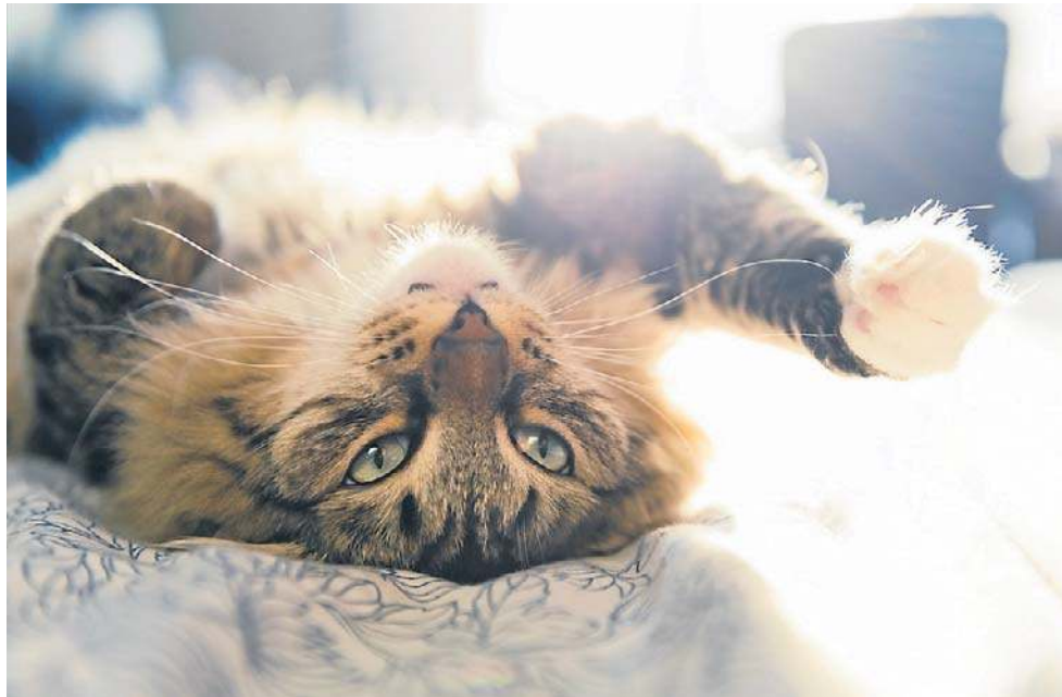
Koci „foch” jest nie do końca tym, za co jest powszechnie uważany

- Pamiętajmy, że zwierzęca komunikacja opiera się na zapachach, więc jeśli wyszliśmy dawno, nasza woń zdążyła się ulotnić z mieszkania. Dodatkowo podpowiada im to instynkt („jestem głodny, a mojego opiekuna dalej nie ma, zazwyczaj jak robię się głodny, już był” albo „chcę iść na dwór i zazwyczaj nie muszę czekać tak długo na spacer”) - jeśli coś zmienia się w rytmie dnia, zwierzaki mogą zacząć odczuwać niepokój. Głównym tego powodem jest brak spełnienia ich potrzeb, przez co pojawia