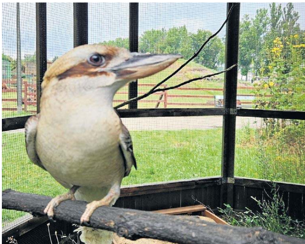
Rodzimym siedliskiem kubarów chichotliwych jest Australia