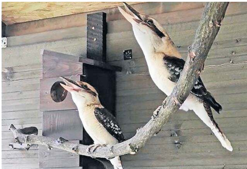
Dwa ptaki przyjechały do Lubina z poznańskiego zoo

To miejsce powstało w 2014 r., na terenie zrewitalizowanego parku miejskiego, którego historia sięga XIX w. Zoo w Lubinie zajmuje ponad 14 hektarów. Ogród można oglądać ko-