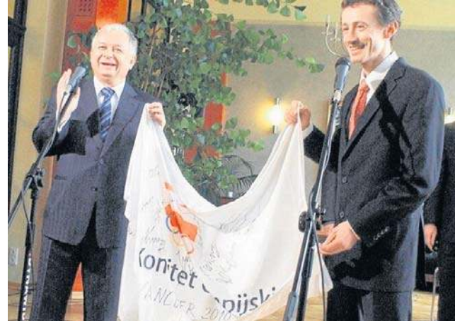
Luty 2010 r. Śp. prezydent Lech Kaczyński z Adamem Małyszem po jego powrocie z olimpiady w Vancouver