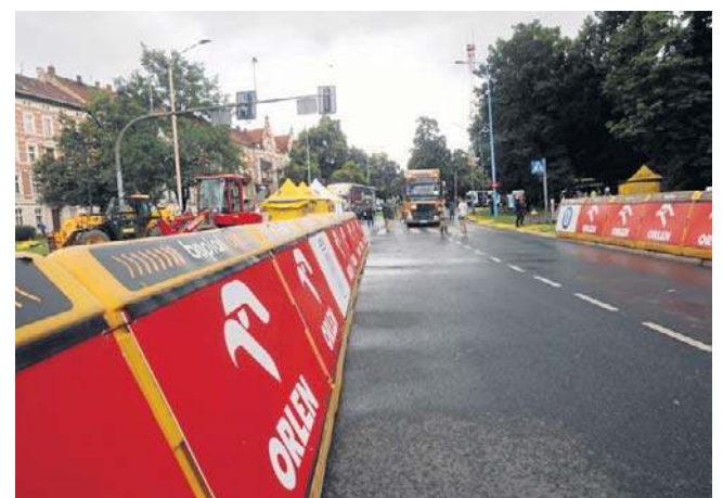
Wyścig to wielkie przedsięwzięcie logistyczne. W kolumnie jest 10 ciężarówek, pracuje ok. 2 tys. osób