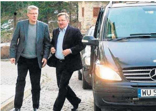
Maj 2014 r. Prezydent Bronisław Komorowski podczas przyjazdu do Zamku w Wiśle Czarnem

a na Wielkanoc zaprosił tu króla Belgów Alberta II z małżonką.