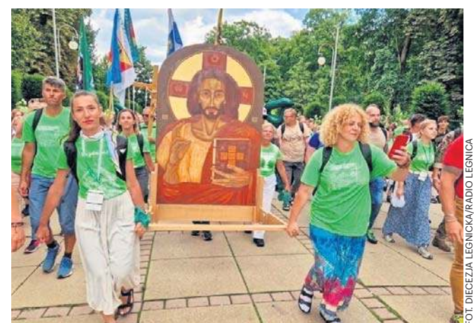
Pątnikom towarzyszyła ikona Chrystusa Pantokratora