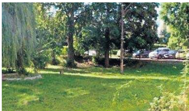
Jest szansa na utworzenie kolejnego ładnego miejsca

kami miejskimi. Teren oświetlą lampy solarne.