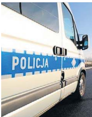
Podejrzani wpadli już dzień po zgłoszeniu kradzieży

- Usłyszeli zarzuty kradzieży z włamaniem, do czego oboje się przyznali. Tłumaczyli swoje zachowanie trudną sytuacją finansową. Chcieli zarobić, wpadli więc na pomysł szybkiego zysku. Za kradzież z włamaniem grozi im teraz nawet 10 lat więzienia - mówi asp. szt. Sylwia Serafin z Komendy Powiatowej Policji w Lubinie.