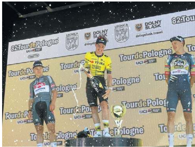
Tradycyjnie na podium polał się szampan, którym zwycięzca uczcił swój sukces