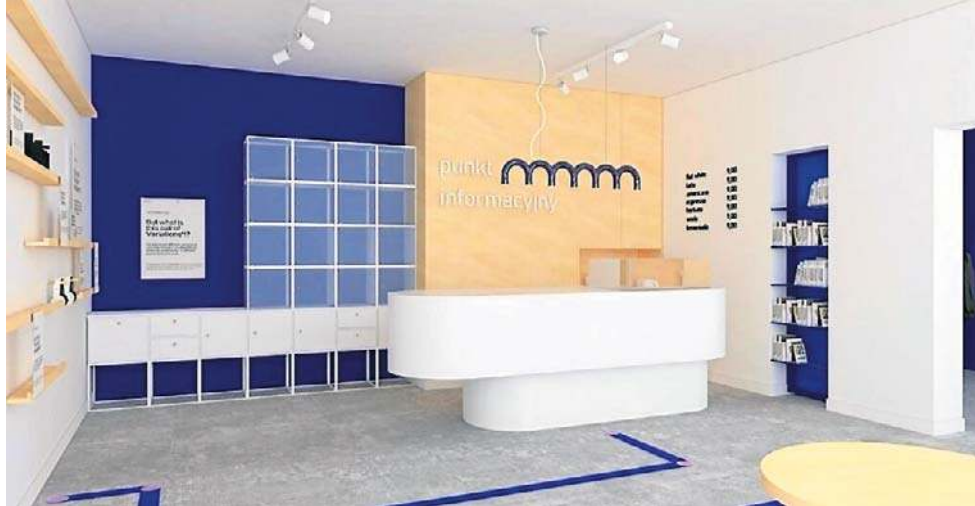
Wizualizacje przyszłego Punktu Informacji Turystycznej

Pierwotnie Punkt miał powstać w lokalu zajmowanym przez biuro poselskie Arkadiu-