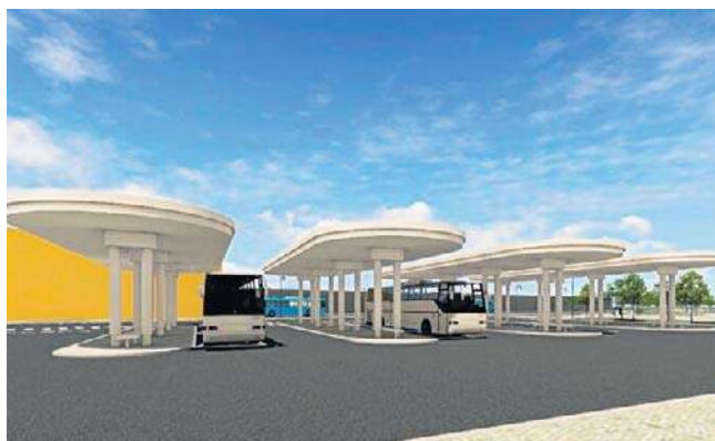
Architektura ma nawiązać do dawnej zabudowy

Inwestycja realizowana będzie w formule „zaprojektuj i wybuduj”. Pierwszy przetarg na wykonanie wykonawcy unieważniono, ponieważ zapropono-