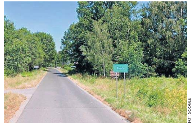
Świadkowie twierdzą, że dwaj mężczyźni, których zwłoki odkryto 7 sierpnia, byli ze sobą oni skłóceni

Zdjęcia publikujemy dzięki uprzejmości Tomasza Doroszuka z profilu Lubin 998 na Facebooku, który jako pierwszy napisał o tym zdarzeniu.