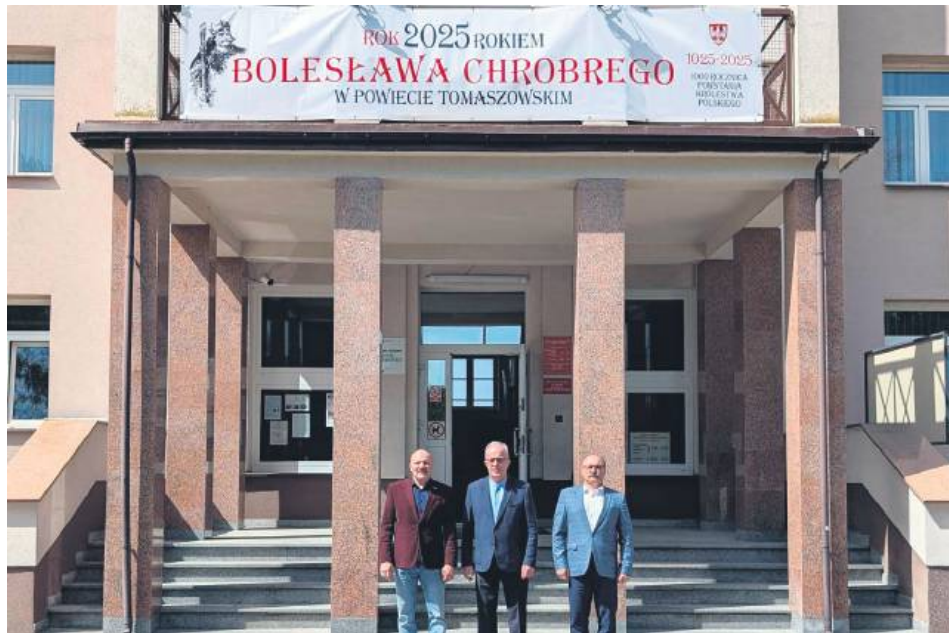
Rada Powiatu w Tomaszowie Lubelskim ogłosiła rok 2025 Rokiem Bolesława Chrobrego, oddając hołd jego historycznemu dziedzictwu.

Starostwo Powiatowe wspólnie z Muzeum Regionalnym imienia dra Janusza Petera w Tomaszowie Lubelskim za-