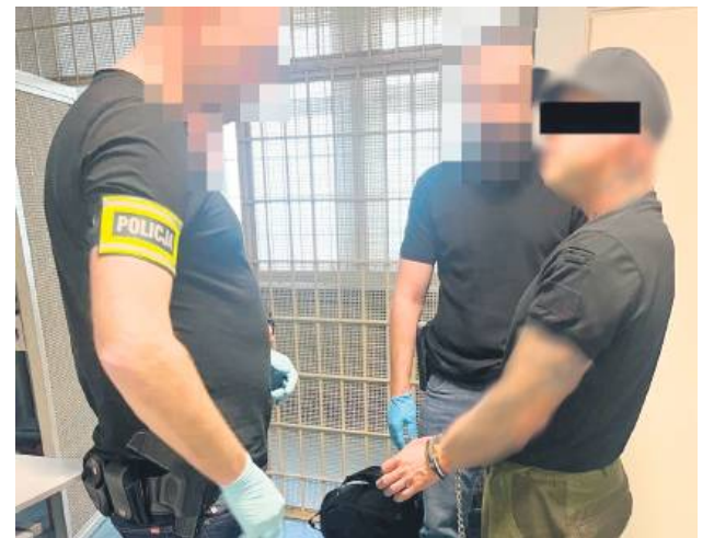
Jej mąż wpadł w ręce policjantów 21 kwietnia.

– Jak się okazało, sprawcy opuścili teren naszego kraju już na drugi dzień po dokonaniu rozboju, wyjechali do Niemiec, gdzie mieszkali. Zabrali ze sobą