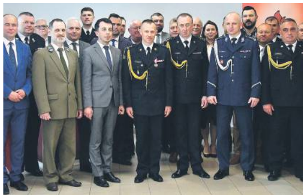
Powołanie komendanta PSP w Biłgoraju.

– Ten dzień jest dla mnie szczególnie i zawsze pozostanie w mojej pamięci. Zarządzanie strukturami komendy jako jednostki Państwowej Straży Pożarnej jest marzeniem każdego oficera i to marzenie zostało spełnione. Jestem pewien, że cel, który został przede mną postawiony, będę realizował w całym oddaniu i zaangażowaniu. Mam świadomość odpowiedzialności, jaką przyjmuję na siebie poprzez objęcie tego stanowiska – mówił.