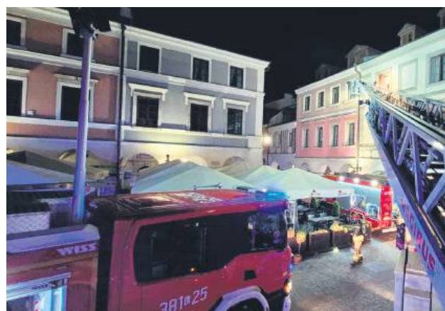
Na szczęście nikt z mieszkańców nie ucierpiał.

Pożarem objęte były dwa pomieszczenia na piętrze ka-