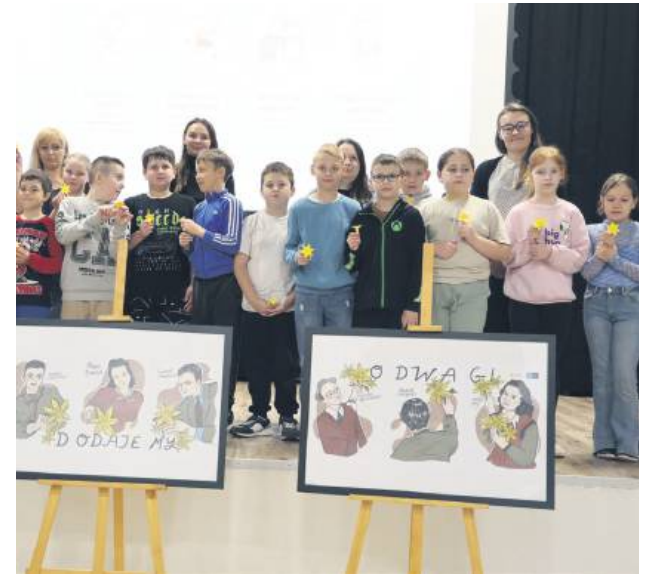
GOK w Bełczu wziął udział w ogólnopolskiej akcji społeczno-edukacyjnej Żonkile.