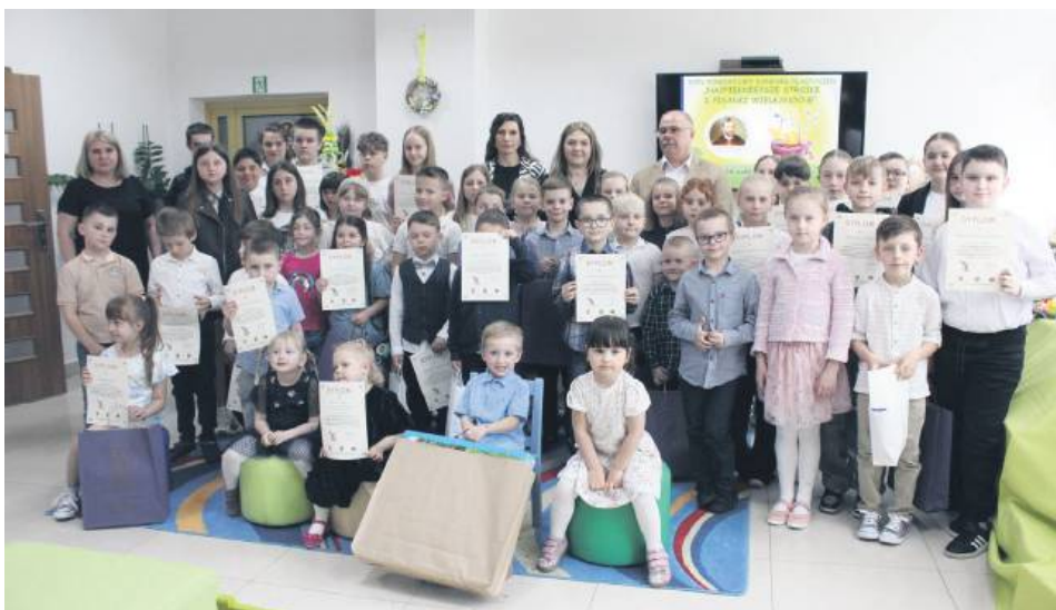
Laureaci Powiatowego Konkursu „Najpiękniejsze palmy i pisanki wielkanocne”.

Palmy i pisanki na powiatowy konkurs dzieci i młodzieży zrobili sporo przed świętami. Ich prace oceniła wewnętrzna komisja, która wyłoniła te najlepsze na eliminacje na wyższym szczeblu. W ten sposób z każdej gminy w powiecie tomaszowskim w finale znalazły się same wyjątkowe prace. Jurorzy musieli wybrać te najpiękniejsze z najpiękniejszych. Nagrody laureatom konkursu wręczono w ubiegłym tygodniu.