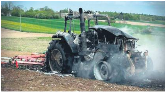
Prawdopodobną przyczyną pożaru ciągnika marki Case było zwarcie instalacji elektrycznej w maszynie.