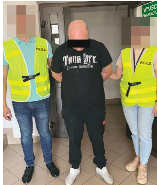
27-latek z gm. Krynice miał ponad 200 tabletek ecstasy.

Jak przekazuje młodszy aspirant Aneta Brzykcy, rzecznik prasowy Komendy Powiatowej Policji w Tomaszowie Lubelskim, funkcjonariusze z Zespołu Operacyjno-Rozpoznawczego oraz zajmujący się zwalczaniem przestępczości narkotykowej w minionym tygodniu ustalili, że 27-letni mieszkaniec gminy Krynice