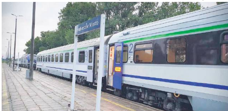
Od czerwca podróżni z Hrubieszowa wybierający się w podróż do Krakowa nie pojedą już w wagonach o standardzie InterCity, a w wagonach, które wycofano z eksploatacji w Holandii, gdzie zdecydowana większość tras kolejowych jest zelektryfikowana.

„Decyzja ta budzi tym większe zdziwienie, że zaledwie w październiku 2024 roku wiceminister infrastruktury Piotr Malepszak zapewniał o utrzymaniu tego połączenia w standardzie Intercity. Tymczasem okazuje się, że zamiast nowoczesnych wagonów pasażerowie mają być skazani na podróż używanymi szynobusami