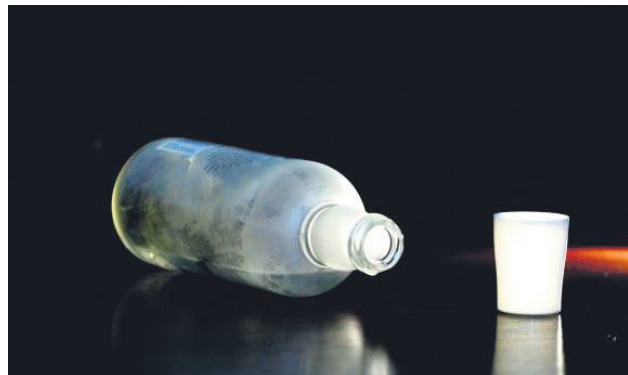
Choroba alkoholowa sama w sobie nie jest wystarczającym powodem do przyznania renty z tytułu niezdolności do pracy.

Choroba alkoholowa może prowadzić do powikłań, takich jak marskość wątroby czy zaburzenia psychiczne, które mogą być podstawą do przyznania renty. Jednak sama choroba