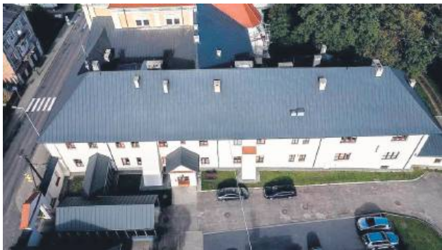
W szpitalu w Szczepieszynie leczą się m.in. mieszkańcy gm. Szczepieszyn, Zwierzyniec i Sułów.

Zanim doszło do zwołanej na 16 kwietnia sesji Rady Miejskiej w Szczepieszynie, podczas której omawiano sytuację miejscowego szpitala, kontaktowali się z nami pacjenci zaniepokojeni wizją likwidacji dwóch szpitalnych oddziałów. To byli mieszkańcy