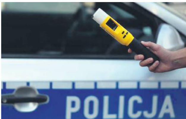
Kierowca dostawczaka miał w sobie 1 promil alkoholu oraz sądowy zakaz kierowania pojazdami, gdy w okolicach Garwolina zatrzymał go policjant z Hrubieszowa.

Policjant z hrubieszowskiej drogówki w okolicach Garwolina zatrzymał po obywatelsku pijanego kierowcę dostawczego citroena. Funkcjonariusz był wtedy na urlopie i razem z rodziną jechał swoim samochodem. Gdy dostrzegł, że citroen jedzie zygzakiem, a przy wyprzedzaniu omal nie zahaczył o barierki i inne auta, zadzwonił pod numer alarmowy, a potem zatrzymał pijanego kierowcę, który prowadził auto, mimo że miał sądowo odebrane prawo jazdy.