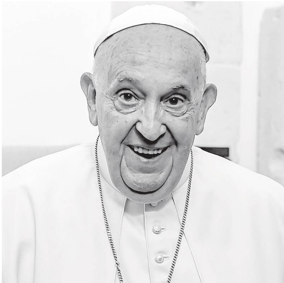
Papież Franciszek zmarł w wieku 88 lat. Do ostatnich dni wypełniał swoją posługę.

Pierwszy raz jako papież pokazał się w loggii bazyliki św. Piotra, tak jak ośmiu innych papieży (Pius XI, Pius XII, św. Jan XXIII, św. Paweł VI, bł. Jan Paweł I, św.