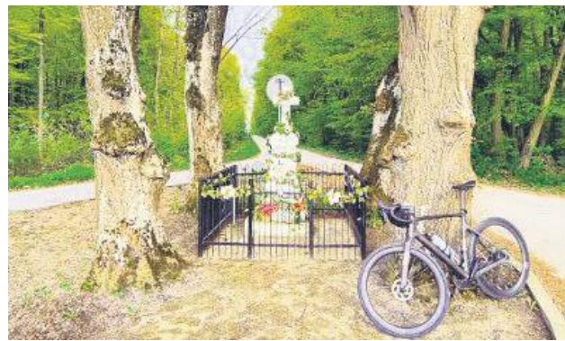
RoweroweMajowe będzie rajdem, na trasie którego uczestnicy zatrzymają się na majówkę przy kapliczce.