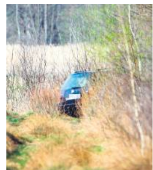
Samochód mężczyzny znajdował się w kompleksie leśnym.

postanowili pomóc w działaniach. Małżonkowie w kompleksie leśnym w okolicach Edwardowa, korzystając z drona, zauważyli samochód, który wyglądem odpowiadał pojazdowi zaginionego. Obok pojazdu na ziemi leżał 81-latek. O swoim odkryciu