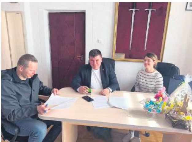
17 kwietnia podpisana została umowa na wydzierżawienie wieży widokowej.

O burzy wokół wieży widokowej pisaliśmy na łamach „Kroniki Tygodnia” kilka razy. Przypomnijmy. Obiekt na wzgórzu zamkowym w Szczepieszynie otwarto pod koniec 2023 r. Kilka miesięcy później ówczesny burmistrz Henryk Matej podpisał umowę na dzierżawę lokalu na parterze o powierzchni prawie 160 mkw. Najemczynie