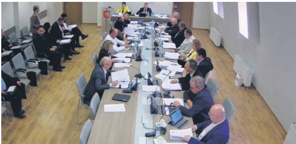
W ocenie radnych powiatu tomaszowskiego podpisanie umowy z Mercosurem może doprowadzić do upadku wielu rodzinnych gospodarstw rolnych w Polsce, które nie będą w stanie konkurować z tańszymi produktami importowanymi z krajów spoza UE.

Zdecydowane „nie” dla umowy o wolnym handlu pomiędzy Unią Europejską a krajami Ameryki Południowej. Podczas ostatniej sesji Rady Powiatu Tomaszowskiego radni jednogłośnie sprzeciwili się porozumieniu z Mercosurem. Według nich to zagrożenie nie tylko dla lokalnych gospodarstw, ale dla całego polskiego rolnictwa.