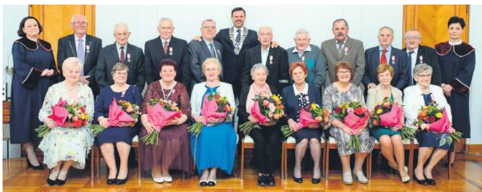
Były kwiaty, życzenia, lampka szampana oraz pamiątkowe zdjęcie.

więciu parom medale za Długoletnie Pożycie Małżeńskie,