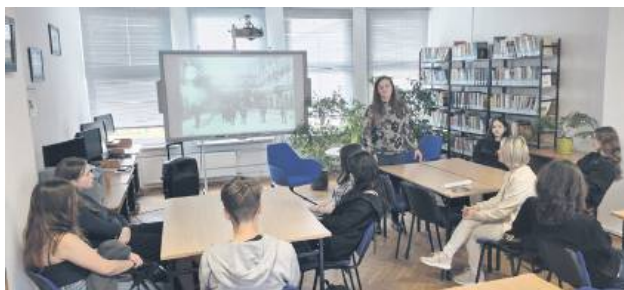
Młodzież uczciła rocznicę Powstania w Getcie Warszawskim.

dzieży z I Liceum im. Bartosza Głowackiego w Tomaszowie Lubelskim poprowadziła dr