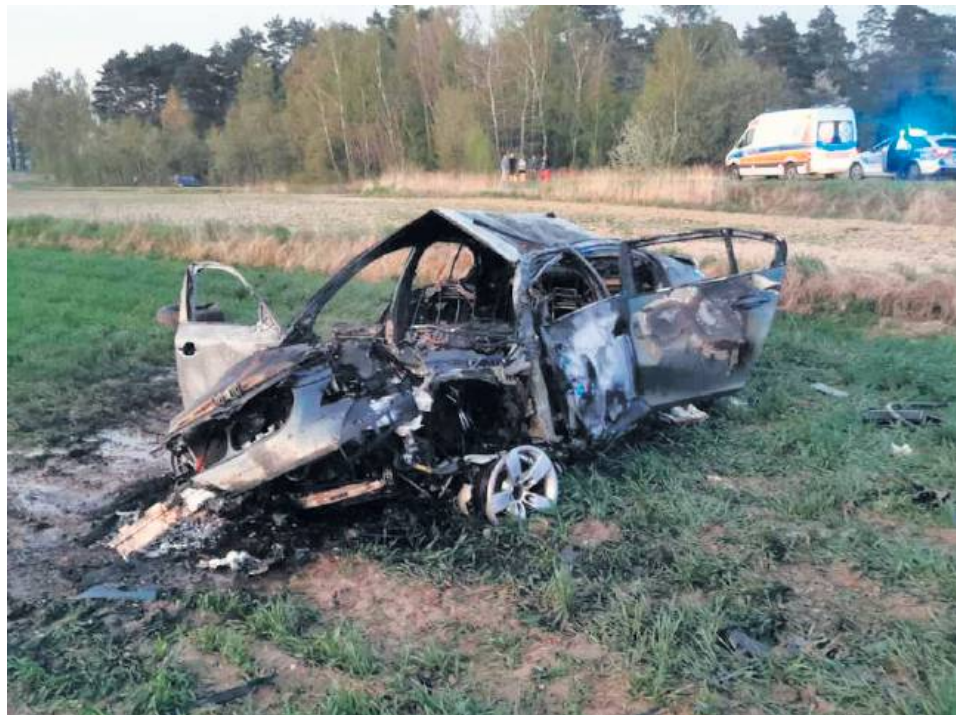
Pasażerka bmw pomogła wydostać się znajomym z płonącego auta.