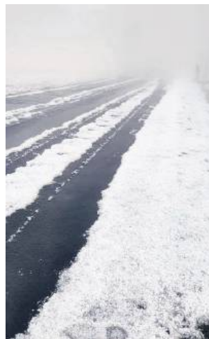
W moment zrobiło się biało.

Wystarczyło kilkanaście minut gradobicia, by zniszczyć uprawy rzepaku i porzeczki w okolicach Tarnogrodu. Rolnicy mówią o kataklizmie i szacują straty.