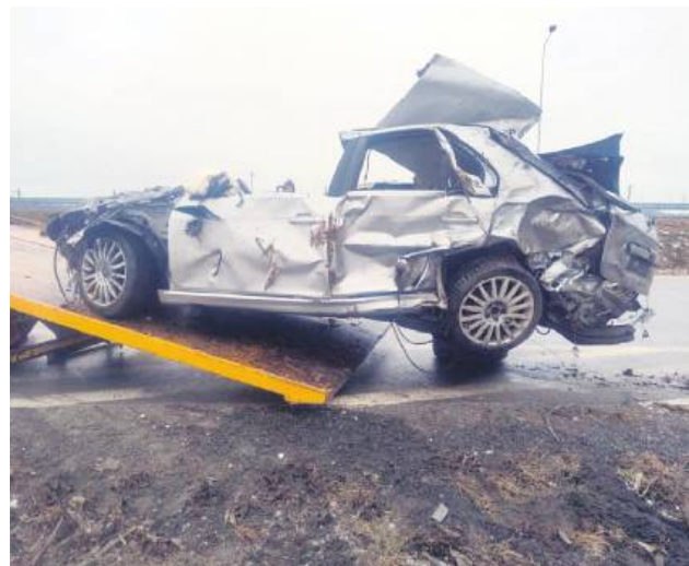
Po wypadku samochód był doszczętnie zniszczony.

trzy dni przebywała w śpiączce farmakologicznej.