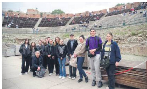
Uczniowie hrubieszowskiego „Staszica” zwiedzili m.in. Palermo, Syrakuzy, wulkan Etna, malowniczą Taorminę oraz historyczną Ortygię.

Grupa kilkunastu uczniów i nauczycieli z Liceum Ogólnokształcącego im. Stanisława Staszica w Hrubieszowie wzięła udział w edukacyjnej wyprawie na Sycylię. To największa wyspa na Morzu Śródziemnym, administracyjnie położona we Włoszech na południu tego kraju. Od Półwyspu Apenińskiego oddziela ją wąska