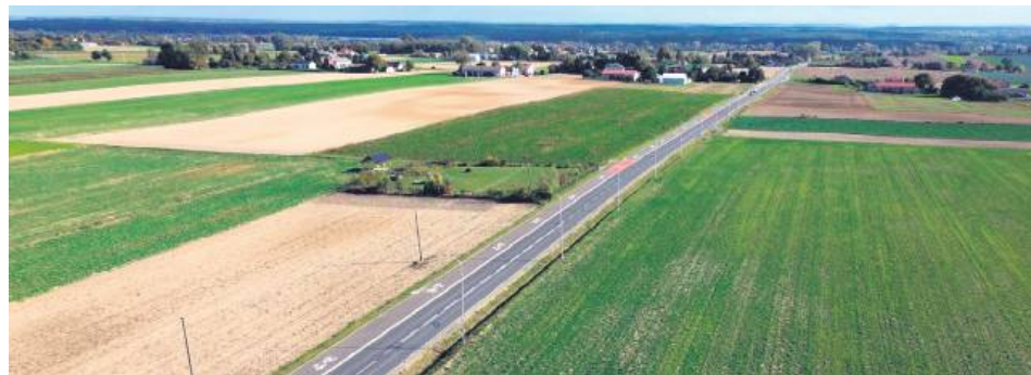
Nowa droga ma wyprowadzić z Tarnogrodu ruch na trasie wojewódzkiej z Lublina w stronę autostrady A4. Będzie przebiegać przez teren gminy Księżpól oraz miasta i gminy Tarnogród.

Długo wyczekiwana obwodnica Tarnogrodu powstanie już niebawem. Umowa na jej dofinansowanie została podpisana w 2023 roku, a coraz więcej formalności dopinanych jest na ostatni guzik. Pozostaje tylko czekać na wbitie pierwszej łopaty.