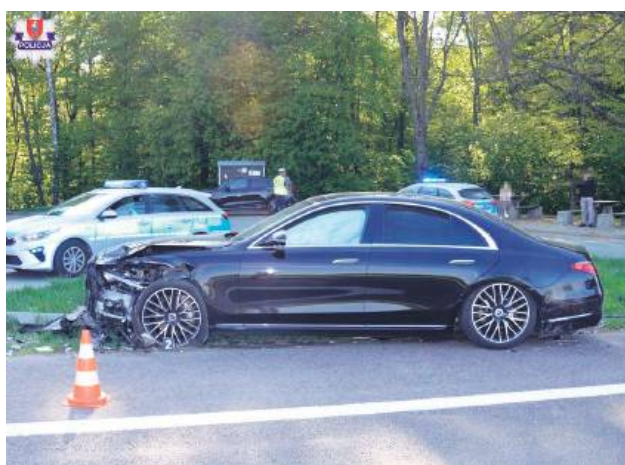
W wypadku uczestniczyły 4 pojazdy.