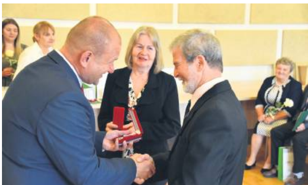
Pary odebrały medale przyznane przez prezydenta.

50-lecie pożycia małżeńskiego obchodziło aż trzydzieści par, które w obecności