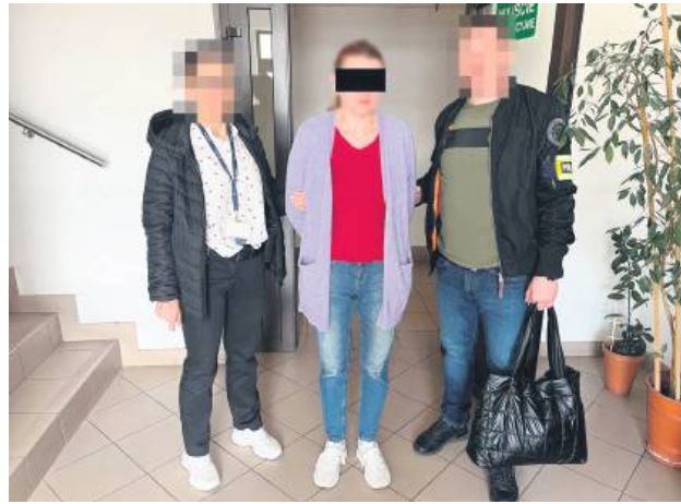
52-latka 16 kwietnia wróciła z Niemiec i została zatrzymana.

– Mieszkaniec powiatu, wracając do domu, zatrzymał się przed swoją posesją. Wtedy do jego samochodu podszedł mężczyzna w kominiarce, który otworzył drzwi od kierowcy i zażądał wydania pieniędzy. Kiedy pokrzywdzony odmówił, napastnik uderzył