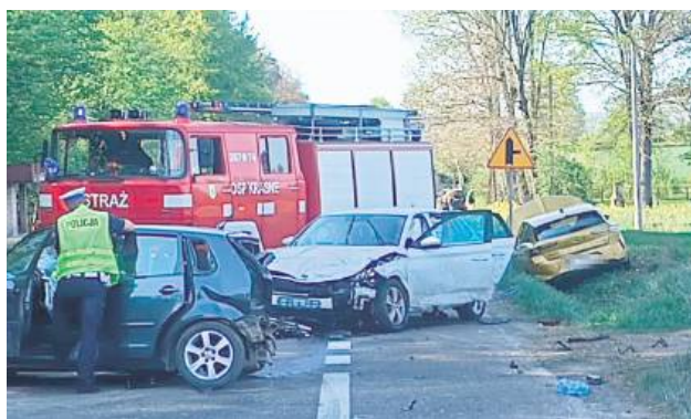
Dwóch kierowców trafiło do szpitala.

– Volkswagenem kierował 34-letni mieszkaniec gminy