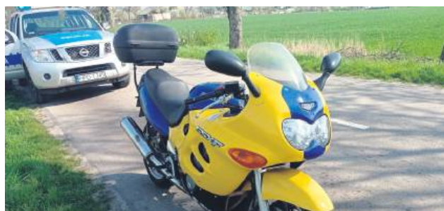
Kierowca tego pojazdu miał zakaz kierowania i był pijany.