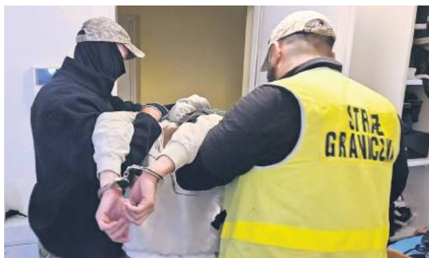
Sledztwo funkcjonariuszy NOSG znajdzie swój finał w sądzie.

Podstawą wszczęcia niniejszego postępowania przygotowawczego były materiały procesowe, pozyskane przez Nadbużański