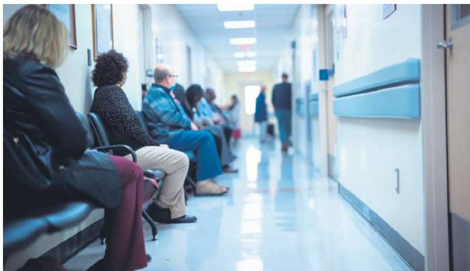
Średni czas oczekiwania na wizytę u specjalisty wynosi w województwie lubelskim od dwóch tygodni do ponad trzech miesięcy.

Lubelski NFZ porównał średni czas oczekiwania do 10 wybranych poradni specjalistycznych w naszym województwie za luty 2024 r. i 2025 r. (pacjenci w stanie stabilnym). W lutym br. średni czas oczekiwania wynosił od 14 do 32 dni w przypadku poradni: chirurgii ogólnej (14), położniczo-ginekologicznej (22) oraz dermatologicznej (32) oraz od 46 do 97 dni w przypadku poradni: neurologicznej (46), urazowo-ortopedycznej (48), urologicznej (49), diabetologicznej (53), oku-