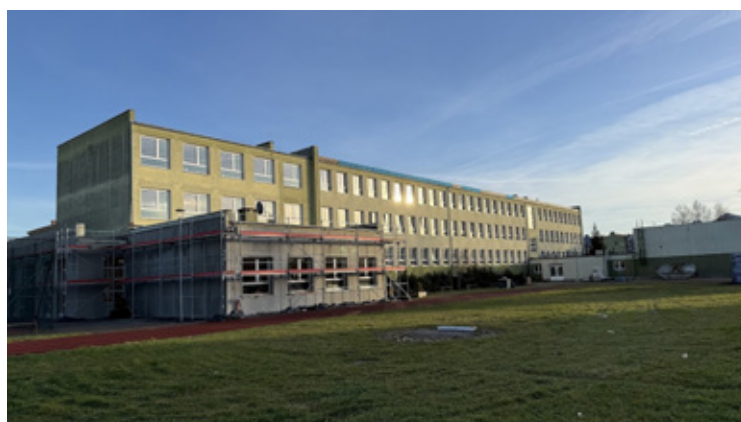
Jednym z najrozsleglejszych projektów była poprawa efektywności energetycznej Szkoły Podstawowej nr 5 oraz Szkoły Podstawowej nr 6. Prace o łącznej wartości 11 056 224,07 zł objęły wymianę stolarki okiennej, docieplenie ścian oraz modernizację oświetlenia i instalacji c.o. Na realizację tego zadania gmina pozyskała dofinansowanie zewnętrzne w wysokości 9 014 717,12 zł.