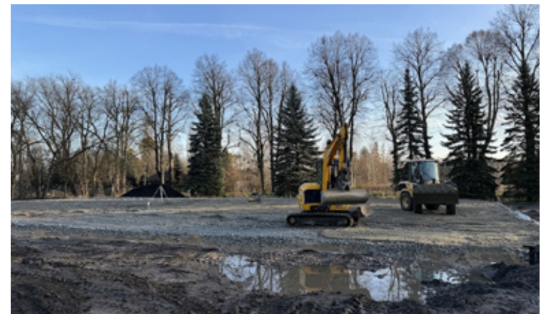
Trwają intensywne prace przy budowie boiska wielofunkcyjnego zlokalizowanego przy Zespole Szkolno-Przedszkolnym nr 2 w Brzegu Dolnym. Inwestycja została podzielona na dwa etapy, a jej finał zaplanowano na 15 czerwca 2026 roku. W tym roku wykonano pierwszy etap pracy tzn. roboty ziemne i warstwy stanowiące podbudowę pod nawierzchnię boiska robót ziemnych. W przyszłym roku rozpocznie się drugi etap, obejmujący montaż głównych elementów, oświetlenia, trybun oraz siłowni plenerowej. Całkowita wartość umowy wynosi 1 097 000,00 zł brutto. Projekt opiera się na montażu finansowym: po 30 procent kwoty pochodzi z Urzędu Marszałkowskiego Województwa Dolnośląskiego oraz Ministerstwa Sportu i Turystyki, natomiast pozostałe 40 procent zabezpieczyła Gmina Brzeg Dolny.

przyniosły sfinalizowanie szeregu zadań, które stanowią element składowy szeroko zakrojonego planu unowocześniania przestrzeni gminy. Wśród wielu zrealizowanych przedsięwzięć na szczególną uwagę zasługują następujące inwestycje: