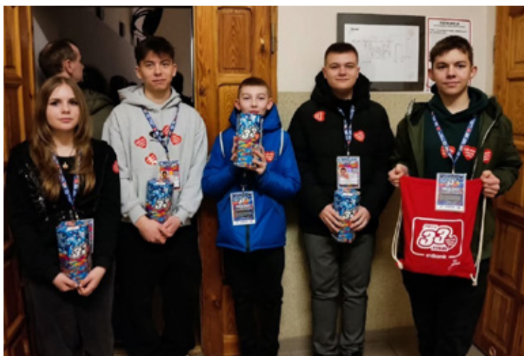
Tak było rok temu.

Wzorem lat ubiegłych, także w tym roku wolontariusze WOŚP pojawią się na ulicach miast i miejscowości powiatu, a puszki Orkiestry będzie można spotkać m.in. przy centrach handlowych, kościołach, na wydarzeniach sportowych i kulturalnych.