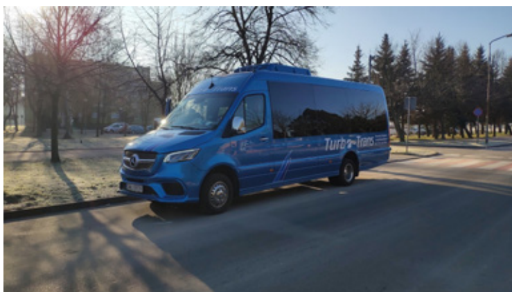
Przełomem w zakresie mobilności stało się uruchomienie od lutego 2025 roku pilotażowej komunikacji gminnej. Pięć linii autobusowych łączyło wszystkie sołectwa z najważniejszymi punktami w mieście. Gmina pozyskała na ten cel dofinansowanie w wysokości 186 450 zł.