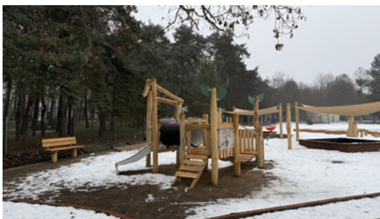
Z myślą o najmłodszych powstała nowa przestrzeń rekreacyjna przy Żłobku Miejskim nr 1. Koszt budowy placu zabaw wyniósł 324 901,50 zł, z czego 300 000 zł stanowiło dofinansowanie z Funduszu Pracy. Teren wyposażono w zestawy sprawnościowe i sensoryczne, huśtawki oraz karuzele.