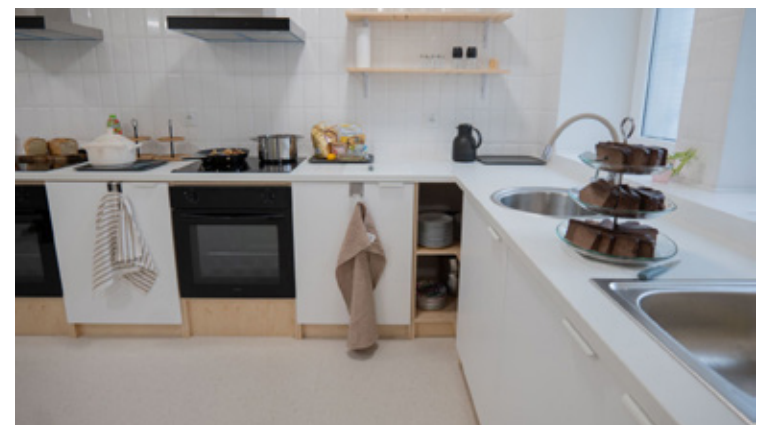
Multicentrum to nowoczesna przestrzeń edukacyjna działająca w duchu zero waste, która oferuje warsztaty oraz wydarzenia takie jak wieczory filmowe czy wymiany ubrań i roślin. W obiekcie działają trzy specjalistyczne pracownie: stolarnia umożliwiająca renowację mebli z odzysku, kuchnia służąca nauce gospodarności oraz miejsce do szycia i upcyklingu odzieży. Pierwsze zajęcia ruszają już jutro. Inwestycja o wartości 734 767,00 zł została wsparta kwotą 107 500 zł ze środków Unii Europejskiej.