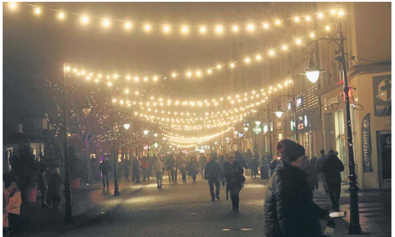
2000 paczek przekazali dzieciom MotoMikołaje w Legnicy i Chojnowie