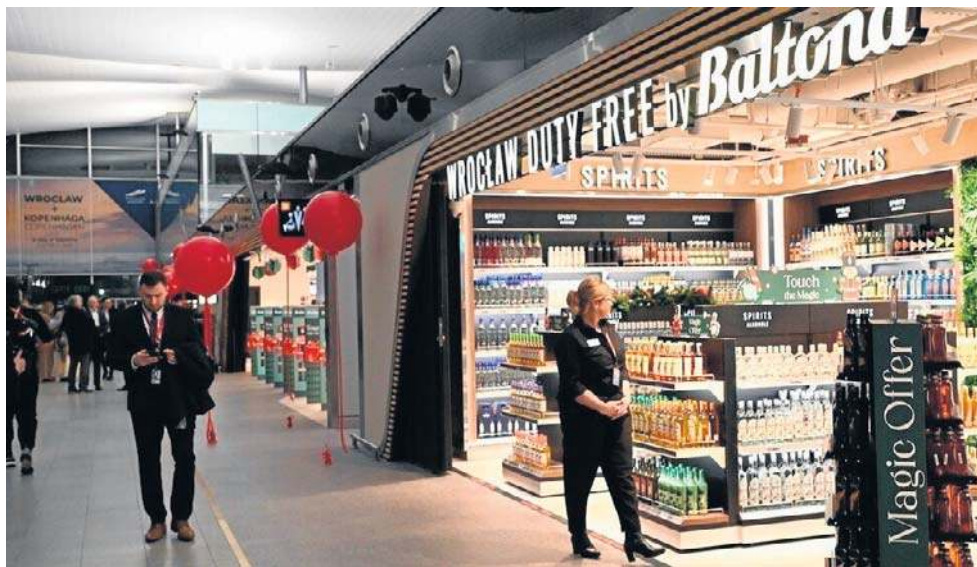
Najważniejsze etapy prac modernizacyjnych dotyczyły płyty lotniska. Natomiast w terminalu pojawiła się m.in. zupełnie nowa strefa duty free od Baltony