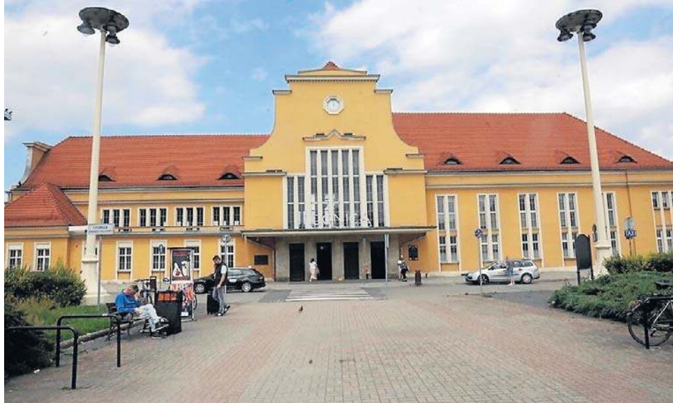
Od 14 grudnia przybędzie pociągów na linii Legnica- Wrocław

Wydłużone zostaną też kursy niektórych pociągów: dodatkowa para obsłuży Bolesławiec czy Lubań. Dodatkowy pociąg dotrze także z Wrocławia, przez Legnicę i Bolesławiec, do Zgorzelca.