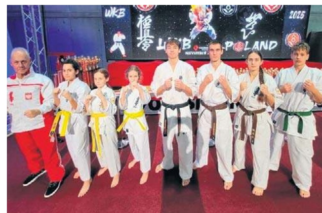
Nasza drużyna wróciła do Legnicy z medalami najważniejszych imprez