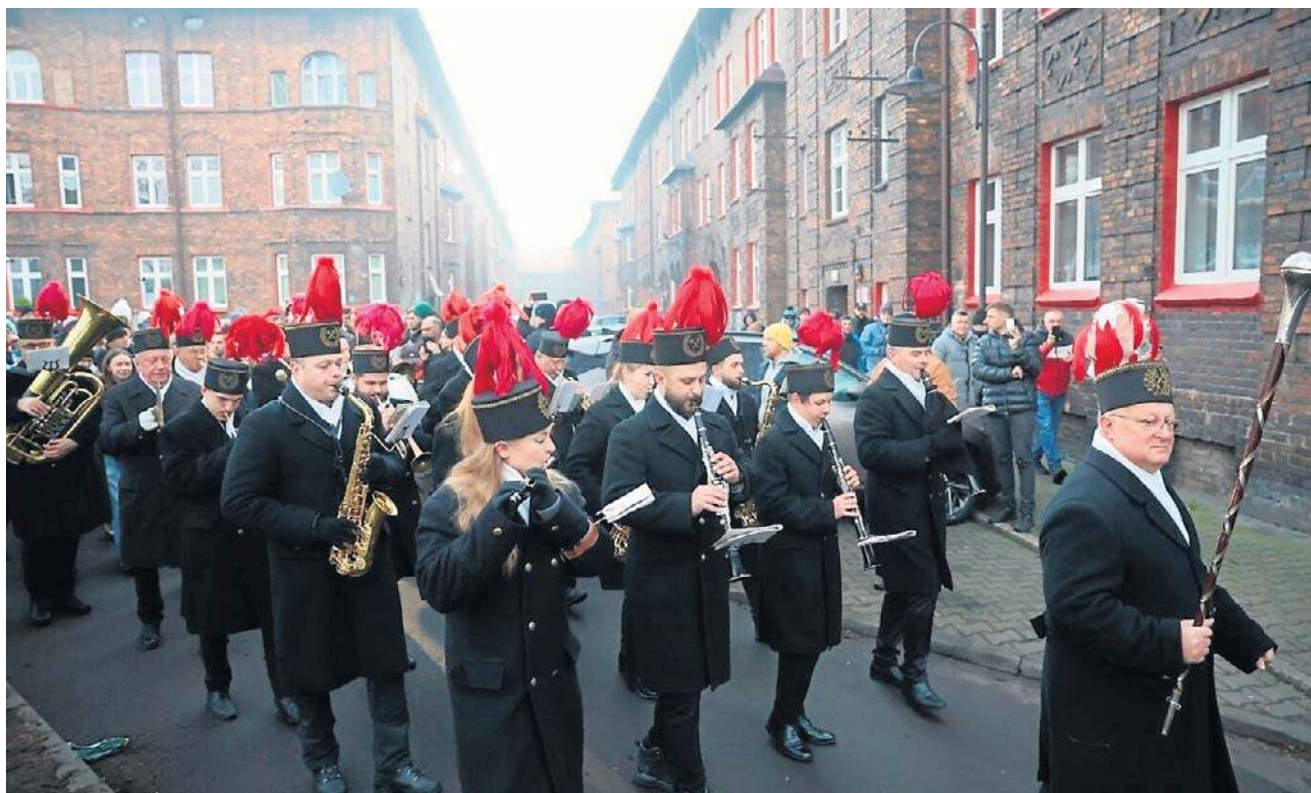
Barbórka 2025 na katowickim Nikiszowcu. To tradycja, że 4 grudnia o poranku orkiestry górnicze budzą o świcie mieszkańców górniczych osiedli. Na Nikiszu orkiestra KWK Wieczorek gra od 114 lat, nawet teraz, gdy nie ma już kopalni