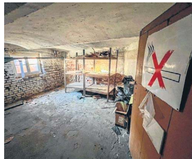
O tym, czy legnickie szczeliny i schrony nadają się jeszcze do użytku, zdecydują służby