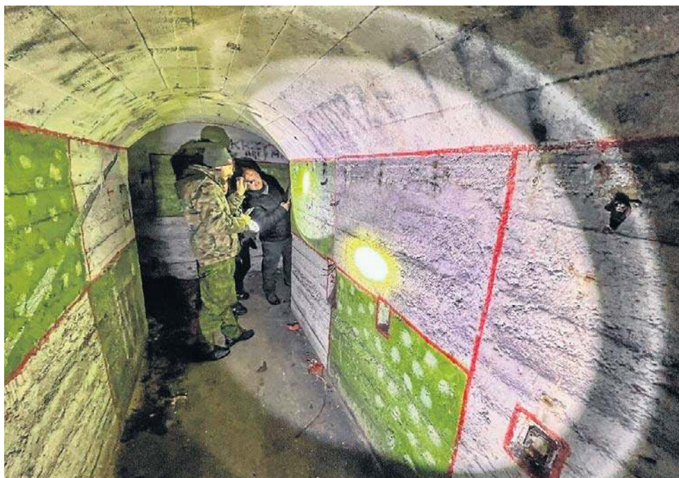
W środę, 3 grudnia, legnickie służby spenetrowały szczeliny i schrony

W środę przedstawiciele miasta przy współpracy z Państwową Strażą Pożarną, Powiatowym Inspektorem Nadzoru Budowlanego, przy udziale przedstawicieli Muzeum Między dokonywały przeglądu obiektów budowlanych, które