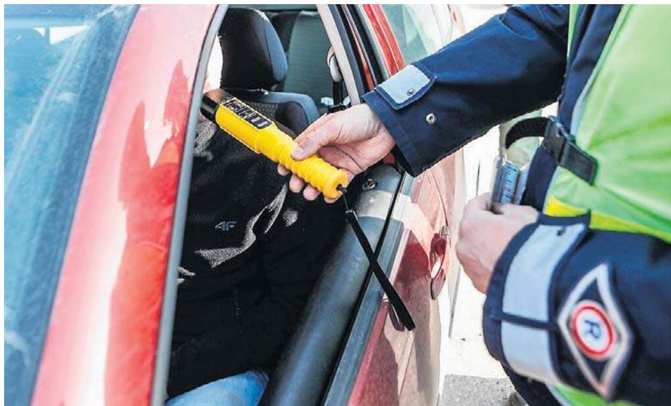
Podczas akcji 1 grudnia policjanci przetestowali 2300 kierowców