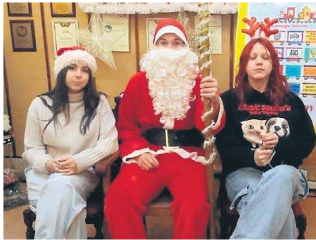
5 grudnia oficjalnie odpalono legnicką iluminacją świąteczną (po lewej i poniżej).