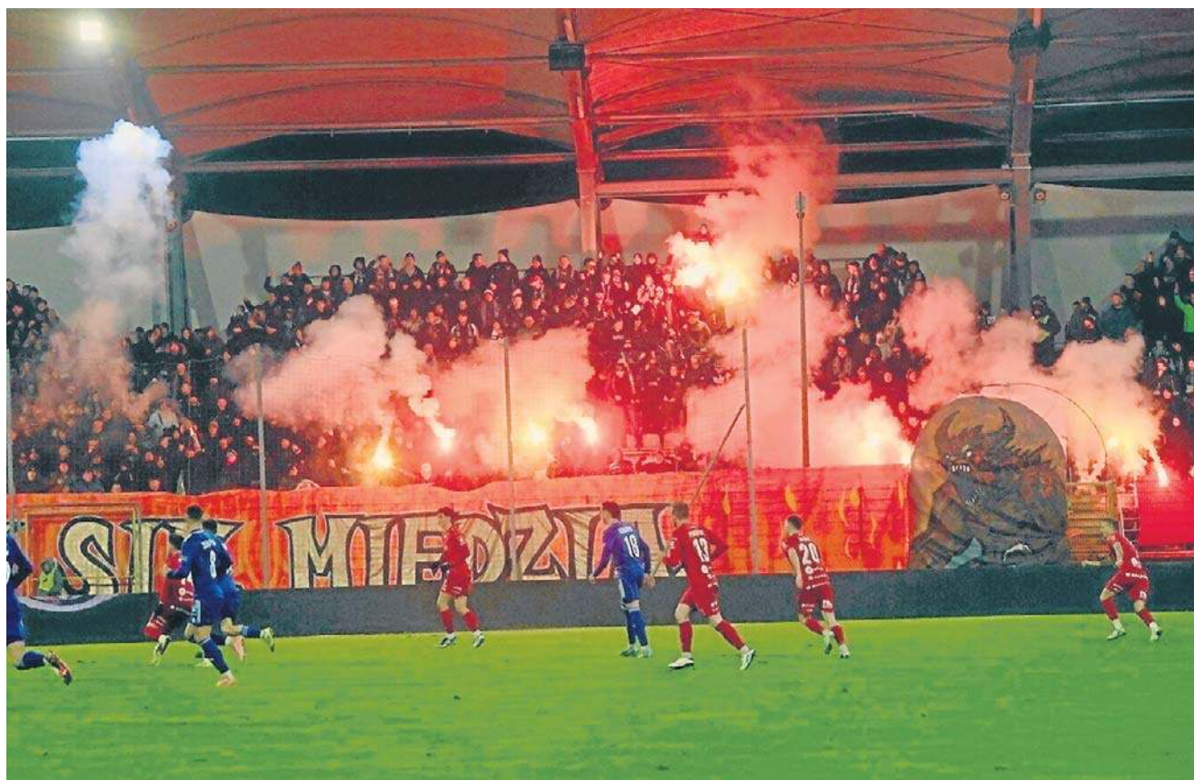
O ile piłkarze Miedzi nie zawiedli, to kibice owszem. Race i fajerwerki to bardzo zły sposób kibicowania

PIŁKA NOŻNA SZCZĘŚLIWA WYGRANA Z ODRĄ OPOLE NA SWOIM BOISKU