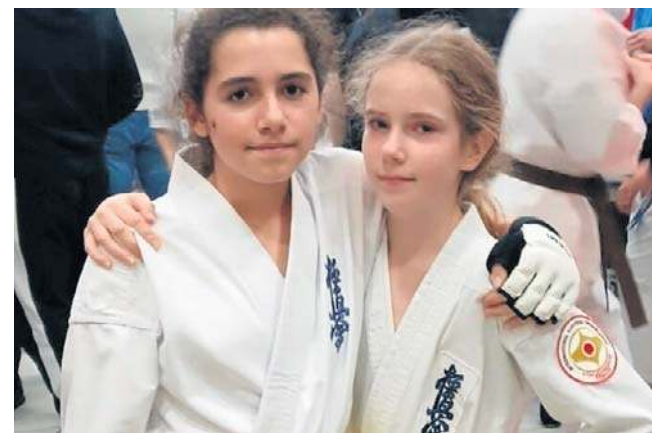
Legniczanki z sukcesem wystąpiły w Grodzisku Mazowieckim

Legnicki karatecy wrócili z potwierdzeniem, że należą do światowej czołówki.