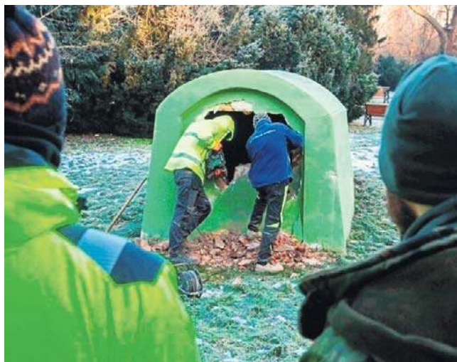
Żeby dostać się do szczeliny, trzeba było skruszyć mur, którym kiedyś zostało zabudowane wejście