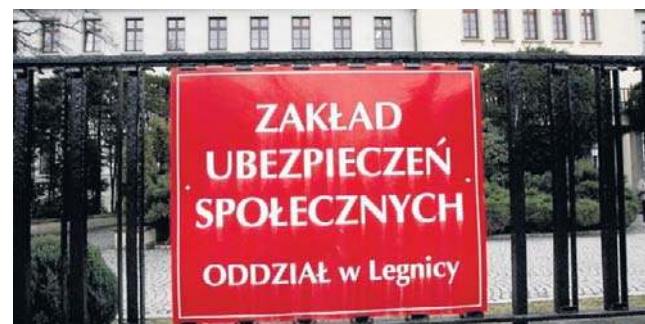
Nowe przepisy wejdą w życie 1 stycznia 2026 roku

- Naszym klientom, którzy swoje wnioski emerytalne złożyli w czerwcu wyliczymy nową kwotę. Zrobimy to z urzędu i po przeliczeniu wydamy nową decyzję. Co ważne, nowa kwota nie będzie mogła być niższa niż dotychczas wypłacana - opowiada Iwona Kowalska-Matis, rzeczniczka ZUS na Dolnym Śląsku. - Gdyby jednak nowa kwota okazała się niższa od dotychcza-