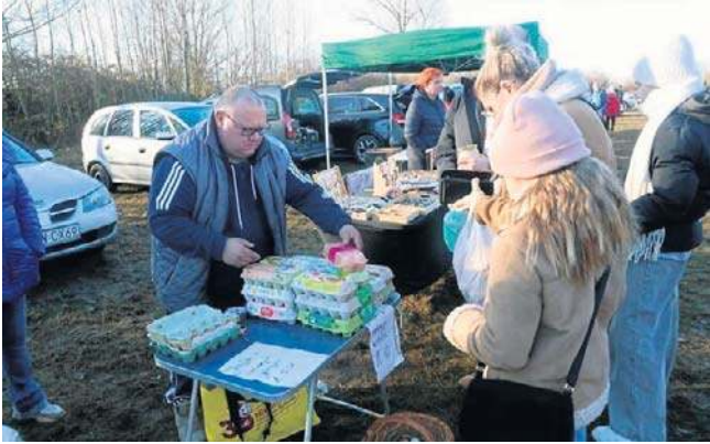
Targowisko Bartoszków to zdrowa żywność, lokalni dostawcy i rękodzieła