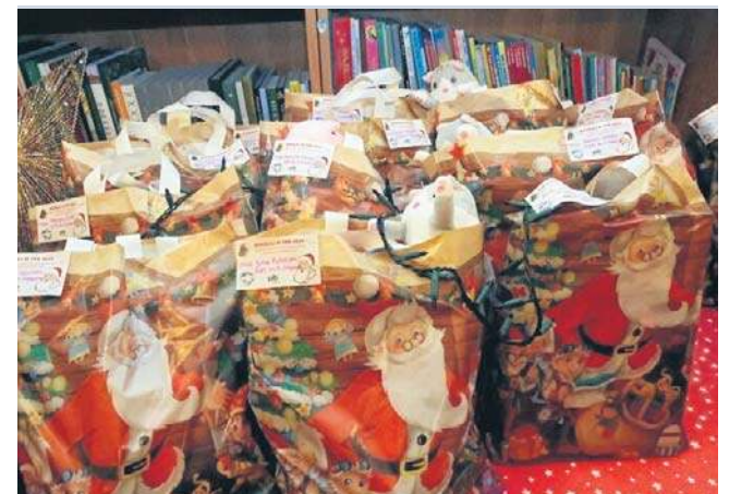
Tysiąc paczek rozdało najmłodszym Towarzystwo Przyjaciół Dzieci. Poniżej - mikołajki w Centrum Witelona