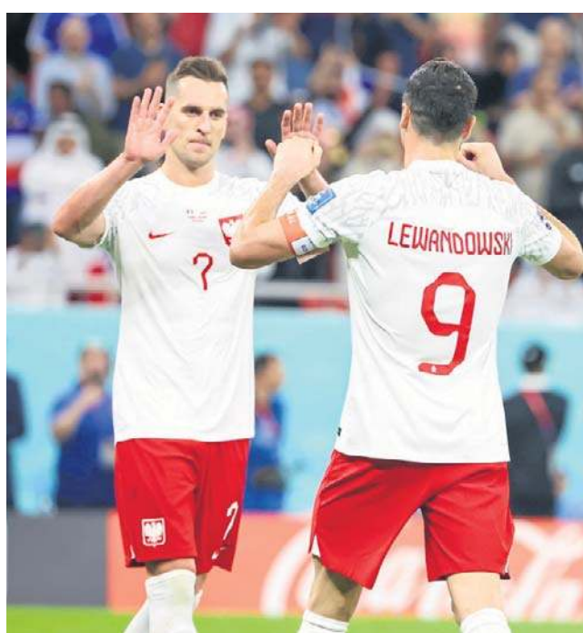
Arkadiusz Milik kontuzji, po której nie grał przez niemal dwa lata, doznał w meczu reprezentacji z Ukrainą

To był, niestety, następny mecz, w którym polski bramkarz nie był w stanie wszystkiego wyłapać. Wybronił dwa