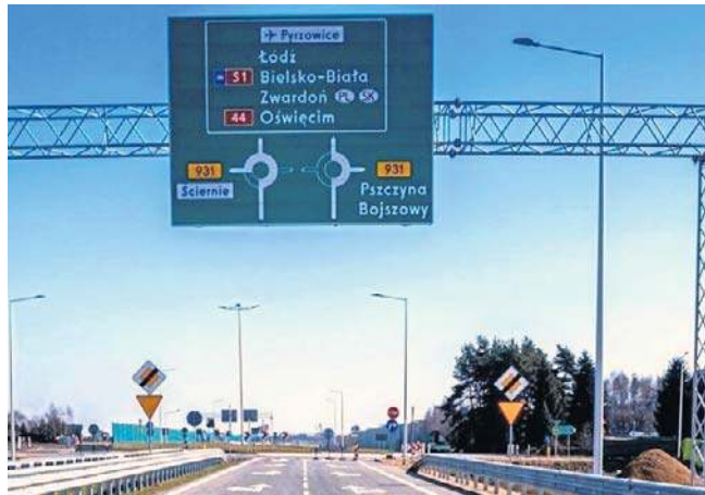
Dzisiaj po południu zostanie otwarty odcinek drogi S1 od węzła Oświęcim do Bierunia

Cały odcinek S1 wraz z drugą częścią obwodnicy Bierunia zostanie oddany pod koniec 2026 roku. ©