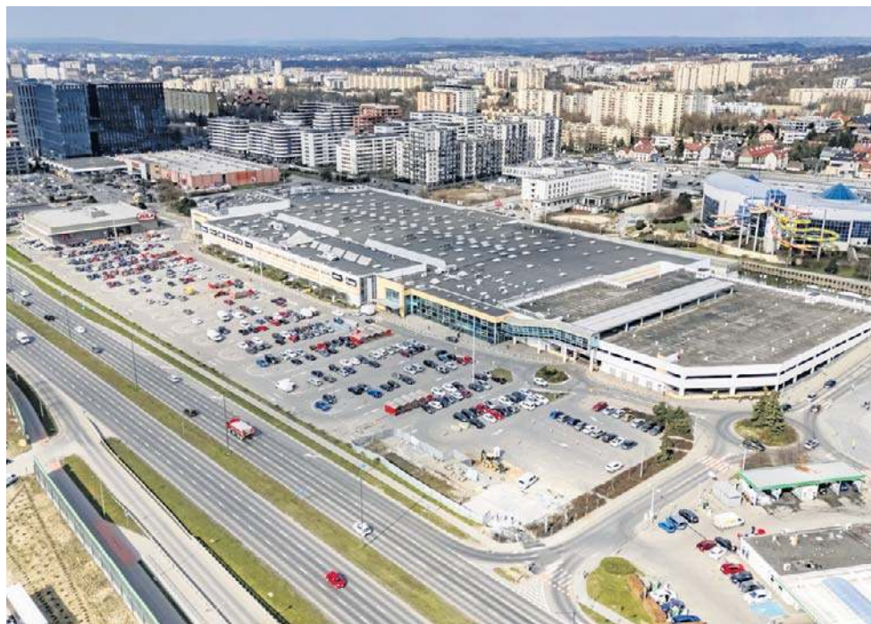
Krakowskie Centrum Handlowe Krokus istnieje już prawie 30 lat

„W imieniu mieszkańców wnosimy, aby w projekcie Planu Ogólnego Miasta Krakowa wyznaczony ten obszar jako strefę usługową/strefę