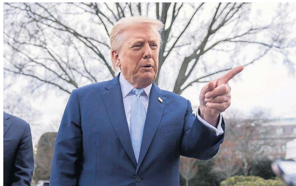
Oświadczenie Trumpa pojawiło się w sobotę wieczorem na platformie Truth Social. Ultimatum upływa tuż przed 1 w nocy czasu polskiego z poniedziałku na wtorek

Amerykański prezydent wielokrotnie wcześniej groził zniszczeniem irańskich elektrowni - w tym elektrowni jądrowej - twierdząc, że w ten sposób w ciągu godziny mógłby spowodować takie zniszczenia, że kraj nie byłby się w stanie z tego podnieść. Trump podkreślał jednak wówczas, że jest „miły” i tego nie robi.