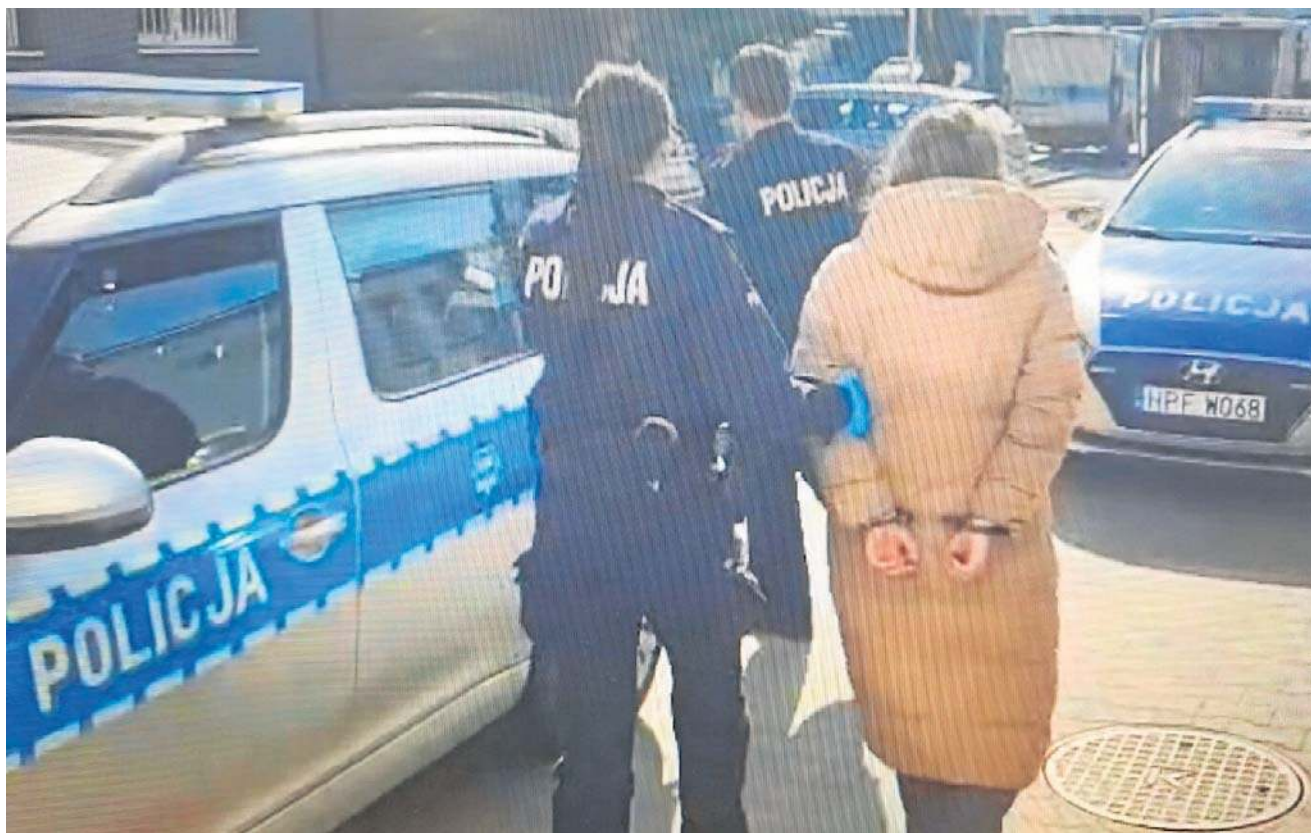
Matka, która wraz ze znajomym porwała 8-letniego syna z wioski pod Łodzią, została zatrzymana przez policję, ale szybko ją zwolniono. Babcia chłopca obawia się, że córka może ponownie spróbować porwania