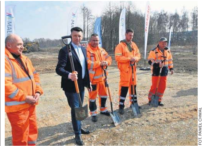
Pierwsza łopata wbita. Rusza budowa ważnej drogi pod Tarnowem. Starania o nią trwały kilkanaście lat

Już wcześniej, bo jesienią ub.r., zapadła decyzja o dofinansowaniu Zakładów Mechanicznych w Tarnowie kwotą blisko 310 mln zł na zwiększenie zdolności produkcyjnych. Na terenie firmy powstanie nowa hala o powierzchni 8 tysięcy metrów kwadratowych, przewidziano również zakupy sprzętu do produkcji. ©