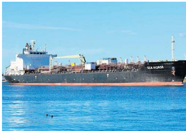
Tankowiec „Sea Horse” uważany za część „floty cieni”, które transportują rosyjską ropę i gaz

Wiceminister spraw zagranicznych Kuby Carlos Fernandez de Cossio powiedział, że „system polityczny Kuby nie podlega negocjacji ze Stanami Zjednoczonymi”.