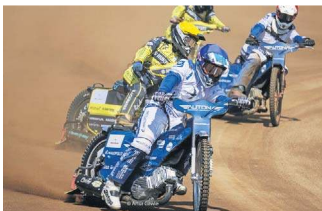
Rok temu Unia Tarnów występowała w 2. Ekstralidze

O tym, że żużel w Tarnowie ma problemy organizacyjne, wiadomo było od dawna. Już w poprzednim sezonie, jeszcze w 2. Ekstralidze, dosłownie w ostatniej chwili zebrano pieniądze na starty w rozgrywkach. Teraz też podjęto próbę, przystąpiono do procesu licencyjnego, ale tym razem ostatecznie nie udało się spełnić warunków, czyli spłacić długów. Na to zresztą zanosilo się od pewnego czasu. Żużlowa centralna czekała bardzo długo, 20 marca minął ostatni termin. Cud nie nastąpił.