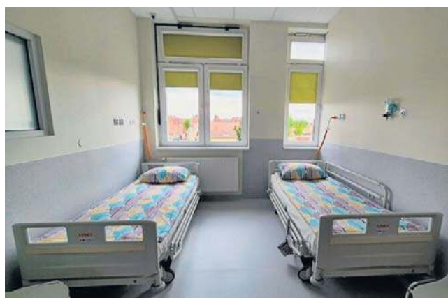
Na potrzeby hospicjum został zaadaptowany dawny oddział covidowy w malborskim szpitalu

Spółka długo zabiegała o możliwość prowadzenia hospi-