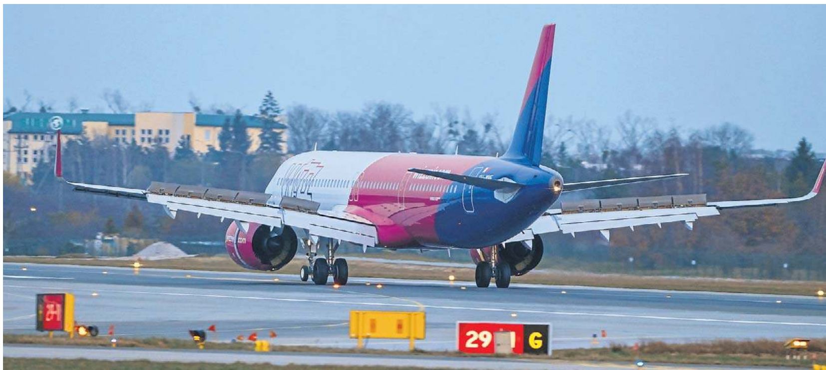
linie lotnicze mają zakontraktowane i zabezpieczone dostawy paliwa do samolotów w Gdańsku

Polski, narodowy przewoźnik także uspokaja pasażerów.