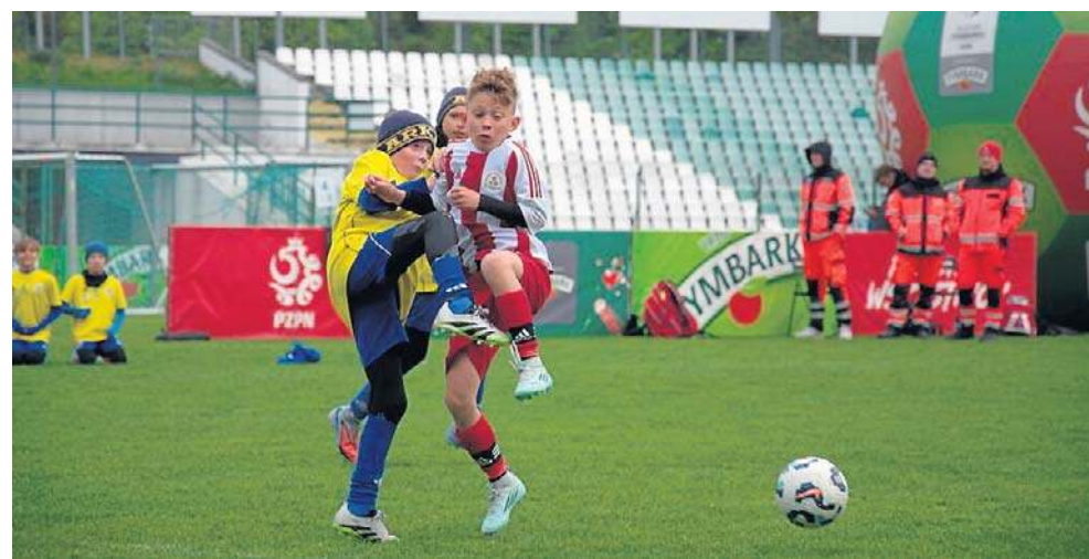
Chłopcy z Kowal spotkali się z rówieśnikami z Gdyni w finale turnieju kategorii U-10

Finały wojewódzki pokazały, jak ważne są dla młodych sportowców tego typu wyzwania. Każdy mocno przeżywał swój występ. Nie brakowało ro-