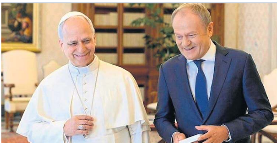
Premier Donald Tusk podczas wizyty u papieża Leona XIV

- Ja bym powiedział, że jeszcze gorsze jest drugie zdanie tego wpisu. Bo pierwsze to ignorancja, a drugie, gdzie jest mowa „o podważaniu integralności państwa”, to jak szantaż moralny. Mamy do czynienia z przejściem