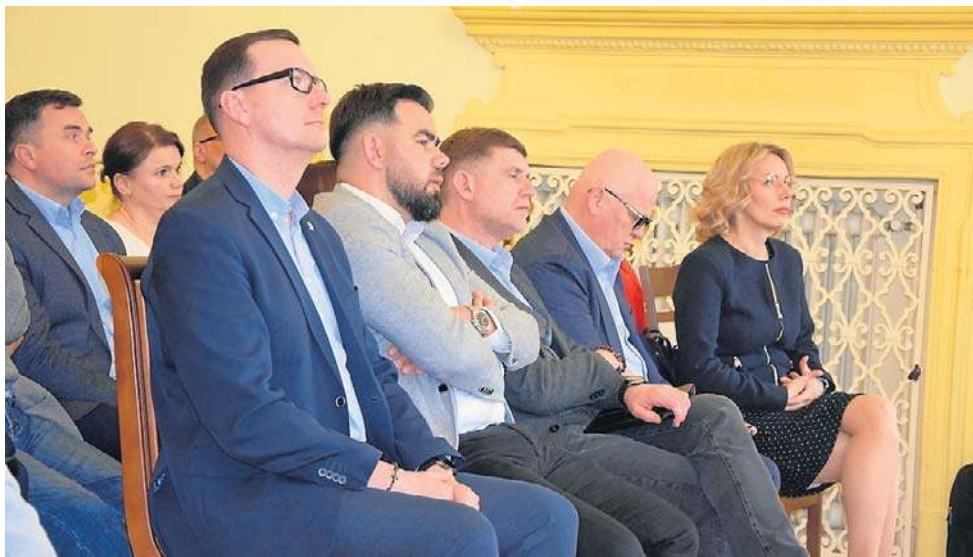
Local-content dla firm z regionu to słowo klucz do intratnych kontraktów

- W tym roku 650 mln zł Polskie Elektrownie Jądrowe muszą wydać na zamówienia związane z przygotowaniem terenu budowy pod inwestycję, więc to jest coś na co mogą liczyć lokalni przedsiębiorcy - mówi Grzegorz Maj, pełnomocnik Zarządu PEJ