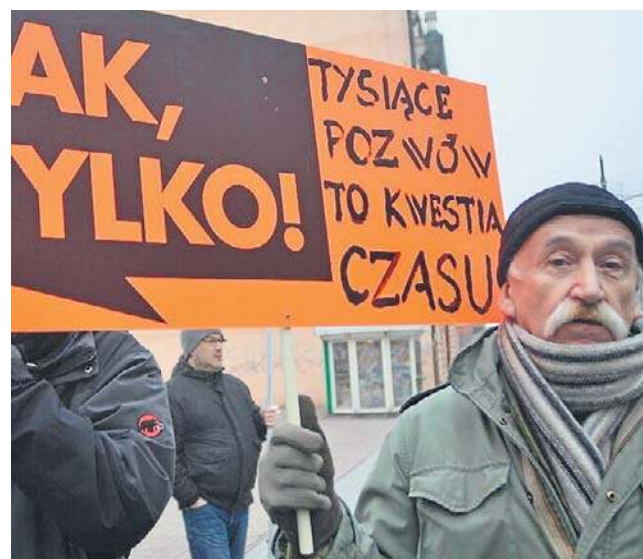
W polskich sądach toczy się obecnie kilkadziesiąt tysięcy spraw dotyczących kredytów frankowych

W pierwszym wyroku Trybunał potwierdził, że prawo UE nie stoi na przeszkodzie takiemu podejściu, zgodnie z którym bank może skutecznie dochodzić zwrotu kapitału także wtedy, gdy wystąpił z pozwem jeszcze przed prawomocnym zakończeniem sprawy o nieważ-