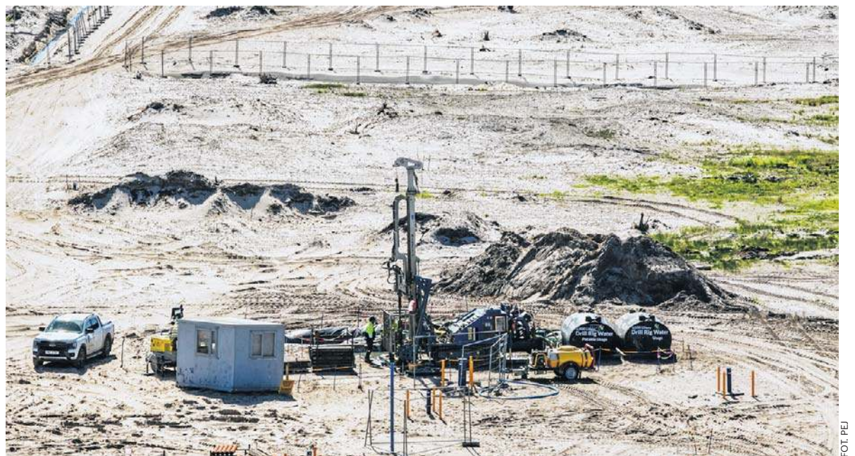
Budowa elektrowni jądrowej w Lubiatowie-Kopalinie rozbudza apetyty lokalnych przedsiębiorców