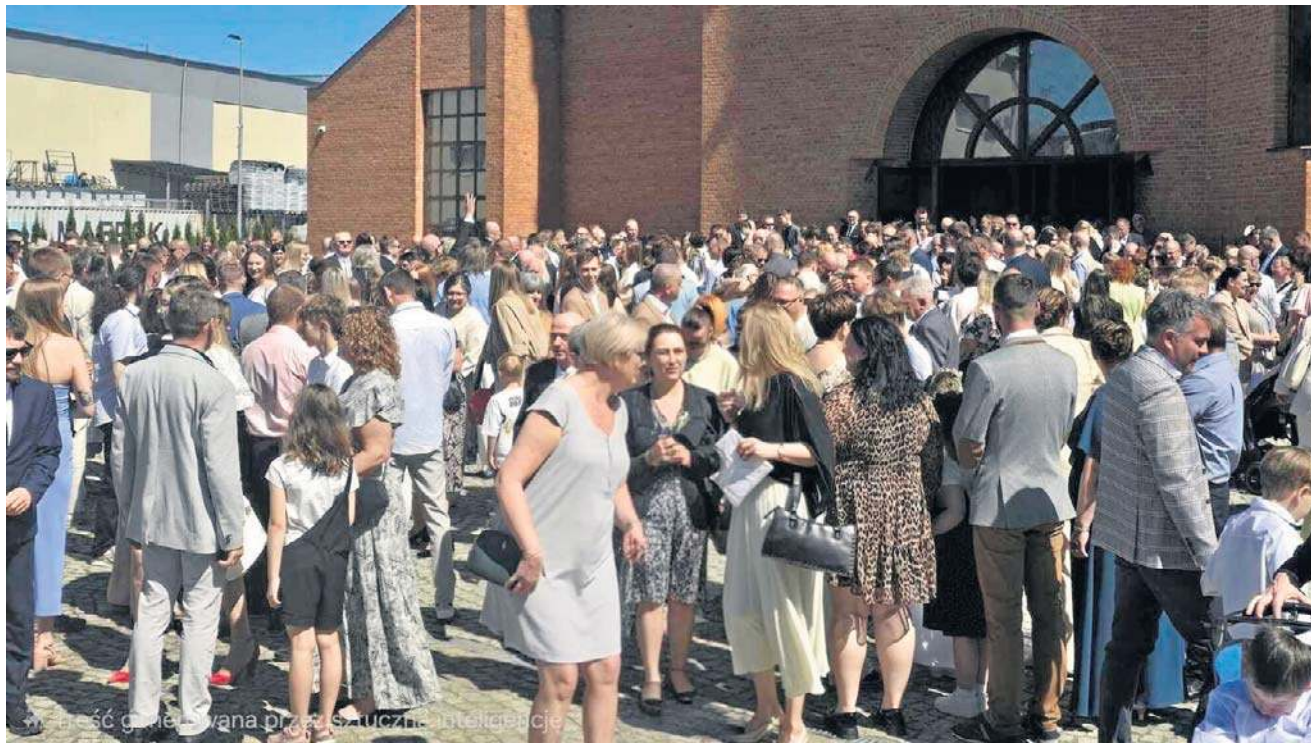
Na uroczystość najczęściej zaprasza się najbliższą rodzinę: babcie i dziadków, rodzeństwo rodziców z dziećmi oraz chrzestnych