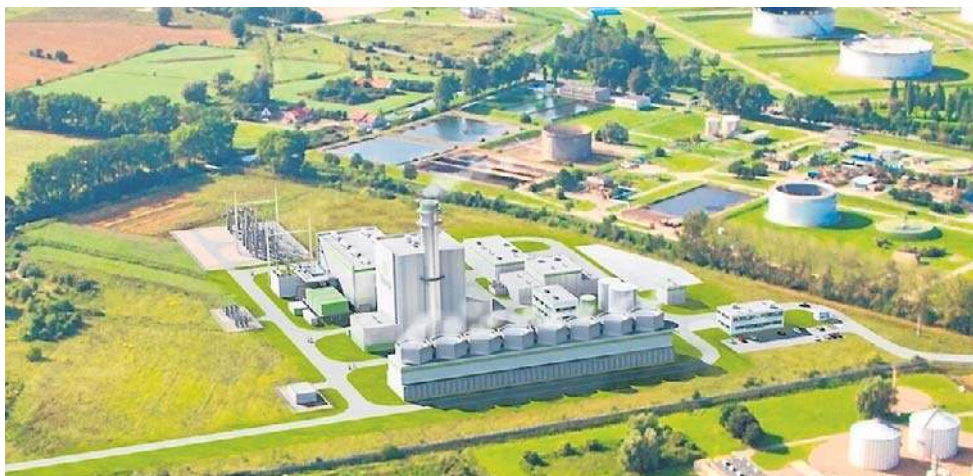
Wizualizacja nowej elektrowni gazowo-parowej w Gdańsku

Budowa CCGT Gdańsk to jedna z najważniejszych inwestycji w nowoczesne, niskoemisyjne źródła energii w Polsce. To projekt, który nie tylko wzmocni bezpieczeństwo energetyczne Pomorza, ale również