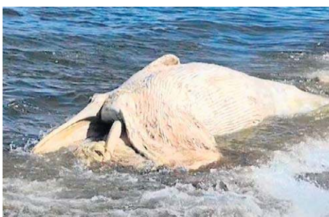
Martwy wieloryb, o długości ok. 5 metrów, mógł dryfować w Bałtyku od kilku tygodni

Wyjaśnił, że o dalszym losie truchła zdecydowały właściwe instytucje, w tym Stacja Morska w Helu, Urząd Morski w Gdyni oraz regionalne lub centralne organy ochrony środowiska. Sytuacja jest o tyle wyjątkowa, że martwe zwierzę leży zaled-