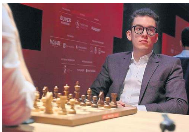
Jan-Krzysztof Duda gra w szachy od 5. roku życia. Tytuł arcymistrza otrzymał mając zaledwie 15 lat i 21 dni!

Po czterech dniach rywalizacji, Jan-Krzysztof Duda zajmował 6. miejsce. Jednak ostatniego dnia, arcymistrz z Wieliczki zanotował dwa remisy i aż cztery porażki.