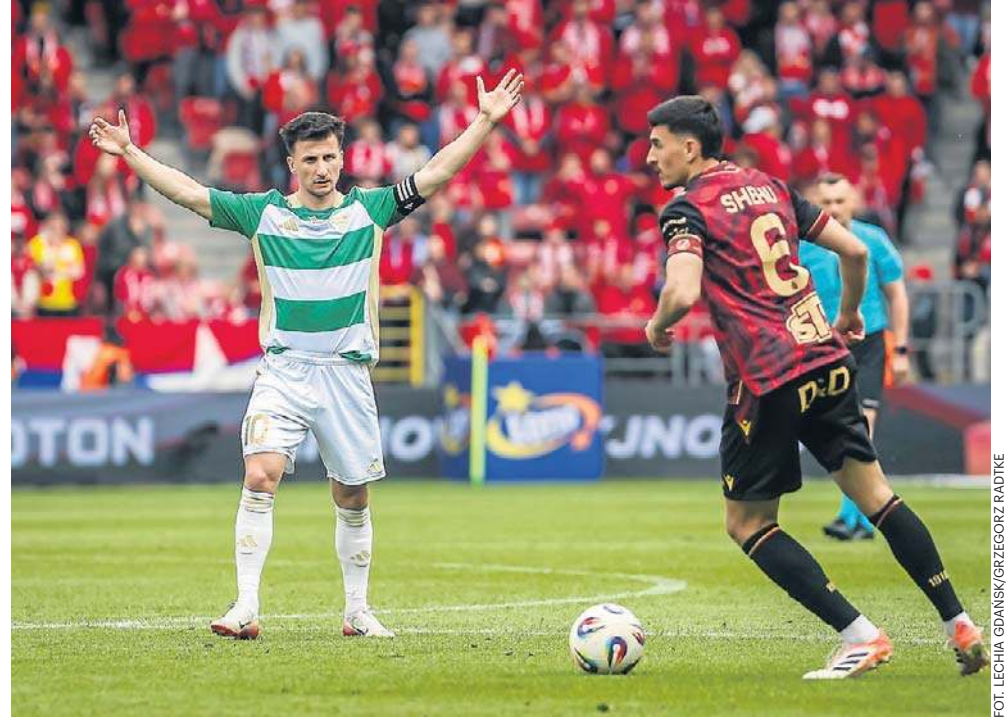
Lechia przegrała bardzo ważny mecz z Widzewem