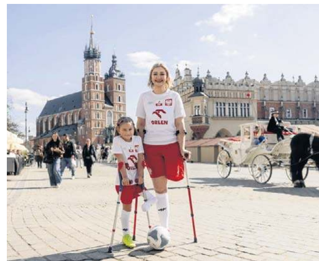
Kraków powalczy o organizację MŚ w ampfutbolu z Brazylią i Rwandą. Decyzja zapadnie w sierpniu

Zainteresowanie organizacją turnieju zgłosiła także Brazylia oraz Rwanda. Gospodarz mistrzostw zostanie wyłoniony w sierpniu. ©©