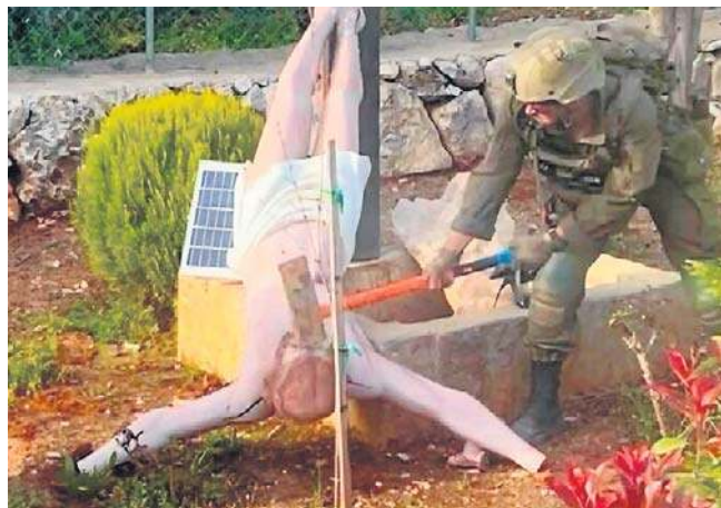
Na fotografii udostępnionej przez dziennikarzy widać żołnierza rozbijającego figurę Jezusa ciężkim młotem

Sprawę skomentował w poniedziałek na X szef MSZ Radosław Sikorski. „Dobrze, że minister Saar szybko przeprosił, było za co. Należy ukarać tego żołnierza, ale i wyciągnąć wnioski wobec sposobu, w jaki są formowani” - napisał Sikorski. PAP