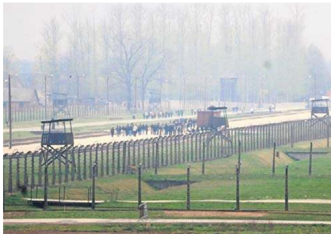
Widok z platformy widokowej przy byłym obozie w Brzezince. Platforma jest na wysokości 9 metrów

Przy wejściu na platformę trzeba pokonać 49 schodów. Nie ma windy. Jednak Tomasz Matula deklaruje, że wkrótce zostaną zakupione schodolazy, aby umożliwić wejście na platformę