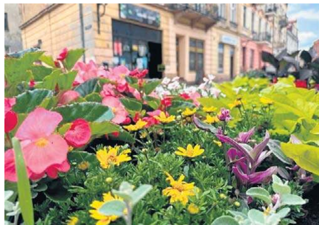
Wybrano takie odmiany kwiatów, które będą piękną ozdobą miasta

Nowe kwiaty będą pojawiały się w mieście stopniowo. Pierwsze zostaną posadzone przy Grobie Nieznanego Żołnierza. Większość z zamówionych sadzonek dotrze do miasta po „zimnych ogrodnikach”. ©©