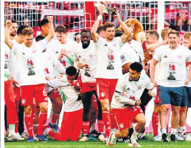
Bayern Monachium został mistrzem Niemiec już cztery kolejki przed końcem sezonu Bundesligi. I ma szansę na kolejne trofea - w Pucharze Niemiec i Lidze Mistrzów

Bayern ustanowił za to nowy rekord w liczbie zdobytych goli w jednym sezonie. Cztery kolejki przed końcem Bundesligi ekipa Kompany'ego może się pochwalić aż 109 trafieniami! Monachijczycy nadal walczą o zwycięstwo w Champions League: w półfinale zmierzą się z broniącym trofeum Paris Saint-Germain. A w przyszłym tygodniu zagrają z Bayerem Leverkusen w półfinale Pucharu Niemiec, zatem Bawarczyści zachowali szansę na trzy korony. ©©