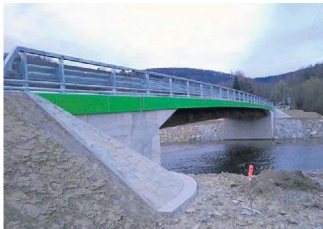
Budowa mostu w Szymbarku zakończona. Otwarcie przeprawy już w maju