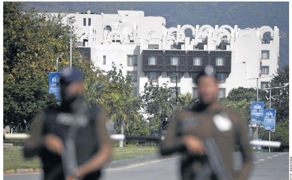
Widok hotelu Serena, w którym 20.04 odbyły się ostatnie rozmowy pokojowe między USA a Iranem. Czy dojdzie do kolejnego spotkania?

Oznajmił też, że usunięcie z Iranu materiałów nuklearnych nigdy nie było traktowane przez jego kraj jako opcja w negocjacjach i ostateczne stanowisko Teheranu jest takie, iż jego „osiągnięcia nuklearne” muszą pozostać na terytorium kraju.