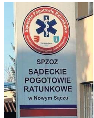
W mieście potrzebna jest nowa podstacja pogotowia