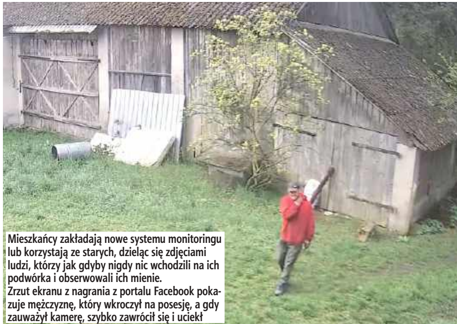
Mieszkańcy zakładają nowe systemu monitoringu lub korzystają ze starych, dzieląc się zdjęciami ludzi, którzy jak gdyby nigdy nic wchodzili na ich podwórka i obserwowali ich mienie. Zrzut ekranu z nagrania z portalu Facebook pokazuje mężczyznę, który wkroczył na posesję, a gdy zauważył kamerę, szybko zawrócił się i uciekł

- Pierwsze sygnały o podejrzanych sytuacjach w naszej okolicy zaczęły do mnie docierać około miesiąc temu, w tym również od bliskiej mi osoby, która zauważyła samochód obserwujący pobliskie domy. Jednak po niedawnej publikacji ostrzeżenia na lokalnej stronie informacyjnej na Facebooku liczba zgłoszeń znacznie wzrosła - tłumaczy radny gminny, który z obawy na zagrożenie pragnie zostać anonimowy. - Otrzymałem kilkanaście wiadomości prywatnych, a także