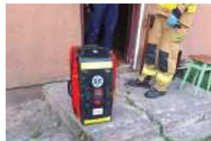
Na miejscu pracowało m.in. pogotowie ratunkowe

Zastęp z naszej jednostki został zadysponowany do siłowego otwarcia drzwi w jednym z domów. Po dotarciu na miejsce zdarzenia zastaliśmy zamknięte drzwi, za którymi mogła się znajdować osoba potrzebująca pomocy. Przy pomocy narzędzi wykonaliśmy dostęp do środka budynku, dalsze czynności pro-