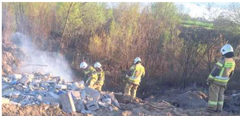
Do zdarzenia doszło w pobliżu miejscowości Gródek Szlachecki

Pożar nieużytków rolnych wybuchł 21 kwietnia na granicy powiatów parczewskiego i lubartowskiego.