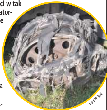
Kierujący nietypowo zachowywał się na drodze. Auto nie miało powietrza w jednym z kół

Mężczyzna został zatrzymany. Ponownie usłyszał zarzut kierowania pojazdem w stanie nietrzeźwości w tak zwanej recydywie, a Sąd Rejonowy w Rykach przychylił się do prokuratorского wniosku i w trybie