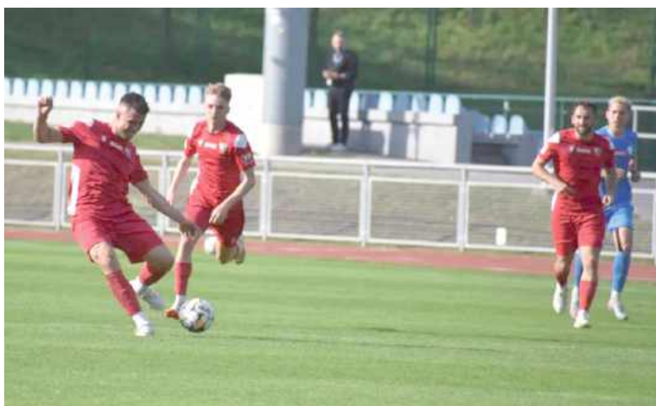
Piłkarze Wisły nie mieli zbyt wiele do powiedzenia w meczu z Polonią Bytom. Przegrali różnicą czterech goli

Po przerwie Wisła ruszyła do ataku, jednak brakowało skuteczności. Najbliższe szczęścia był ponownie Ju-