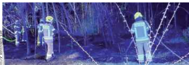
Zgłoszenie wpłynęło niedługo przed godz. 1 w nocy

- Po dotarciu na miejsce zdarzenia zastępy podały 2 prądy gaśnicze w natarciu na źródło pożaru. Po opanowaniu sytuacji pogorzeliśko zostało sprawdzone kamerą termowizyjną w celu likwidacji zarzewi pożaru - relacjonują