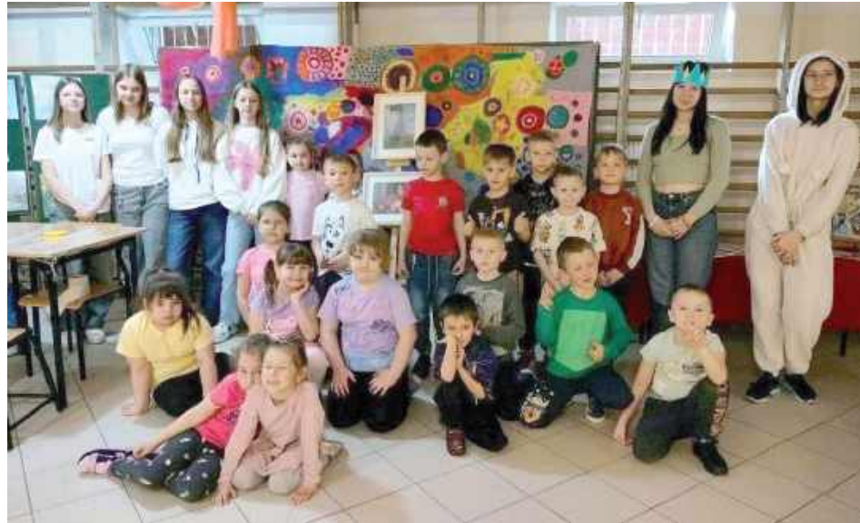
Celem projektu było inspirowanie uczniów do aktywności twórczej

Niedawno przypadała rocznica urodzin Leonardo da Vinci. Z tej okazji klasa VII a przygotowała „kawiarenkę artystyczną”, gdzie dziewczęta poprowadziły warsztaty artystyczne dla społeczności szkolnej. Celem projektu było inspirowanie uczniów do aktywności twórczej, rozwój zainteresowań oraz wrażliwości estetycznej - zarówno organi-