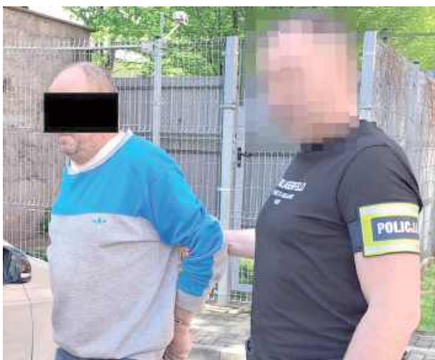
Mimo sądowego zakazu, będąc pod wpływem alkoholu, mieszkaniec gminy Puławy usiadł za kierownicę forda i doprowadził do zderzenia z innym autem

Do zdarzenia doszło w świąteczny poniedziałek 21 kwietnia w Niebrzegowie w Gminie Puławy. Mężczyzna jechał tamtędy Fordem. Jechał, choć nie powinien wsiadać za kierownicę, bo jak potem się okazało, nie dość, że był pod wpływem alkoholu,