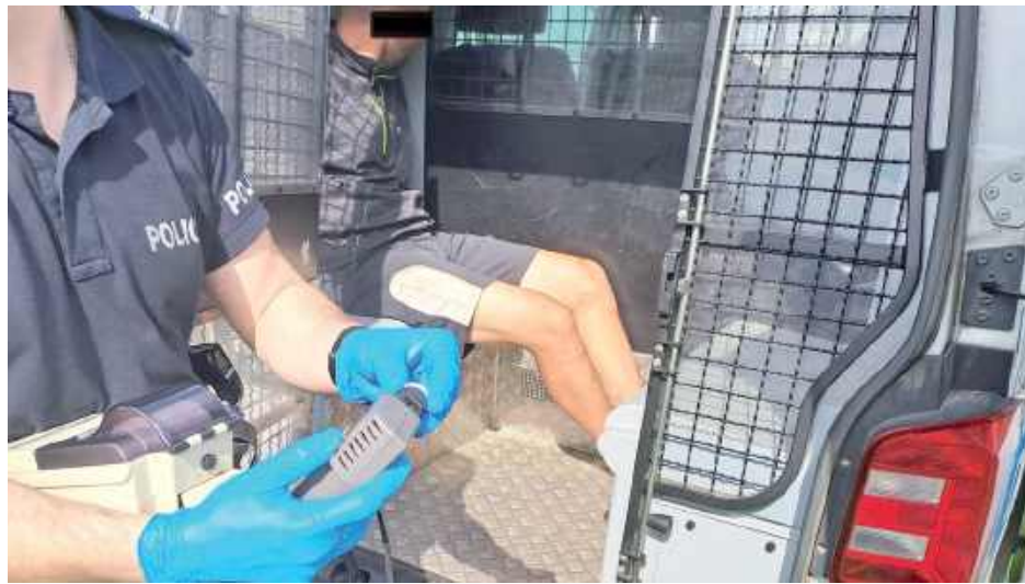
Mężczyzna usłyszał zarzut kierowania pojazdem w stanie nietrzeźwości w tak zwanej recydywie, a Sąd Rejonowy w Rykach przychylił się do prokuratorского wniosku i w trybie przyspieszonym aresztował go na 3 miesiące

Przypuszczenia zgłaszającej się potwierdziły. 36-letni mieszkaniec powiatu ryckiego nie dość, że kierował samochodem w stanie nietrzeźwości wynoszącym blisko 2,5 promila alkoholu w organizmie, to dodatkowo posiadał już dożywotni zakaz prowadzenia pojazdów za podobne przewinienie. Mężczyzna został zatrzymany. Po wytrzeźwieniu usłyszał zarzut kierowania pojazdem w stanie nietrzeźwości oraz złamania zakazu sądowego - informuje aspirant Łukasz Filipek, oficer prasowy KPP w Rykach.