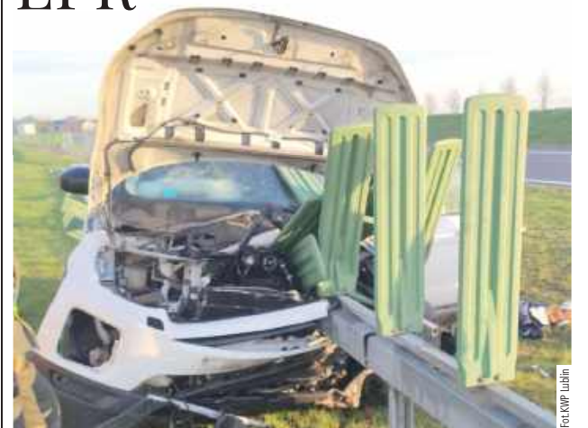
W wyniku wypadku kierujący autem 50-latek śmigłowcem został przetransportowany do jednego z lubelskich szpitali

Trwa ustalanie przyczyn wypadku, do którego doszło w Wielką Sobotę na ekspresowce koło Lublina przed godziną 5.30. Kierowca Range Rovera, jadąc od Warszawy, na wysokości Bogucina nagle zjechał z drogi i uderzył w rozdzielające jezdnie metalowe bariery, które wbiły się w jego samochód.