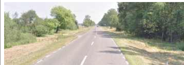
Chodzi o odcinek o długości 3 km