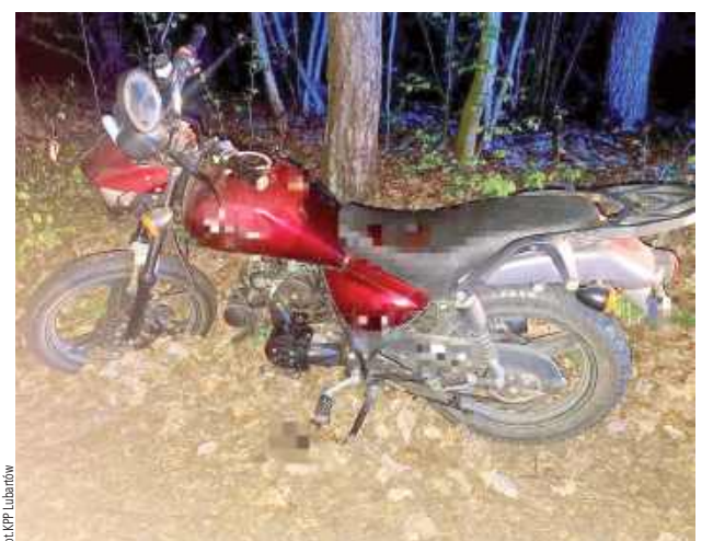
Mundurowi zatrzymali mężczyznę do dalszych czynności, a motorower został odholowany na policyjny parking

22-letni motocyklista kierował motorowerem Junak. W Wólce Mieczysławskiej zwrócili na niego uwagę policjanci, bo jechał bez kasku. Mężczyzna próbował zawrócić, ale mu się nie udało - upadł na jezdnię. Policjanci udzielili mu pierwszej pomocy, ale przy okazji wyczuli od niego woń alkoholu. Przebadali go alkomatem - okazało się, że miał w organizmie 2,5 promila alkoholu. Okazało się, że nie