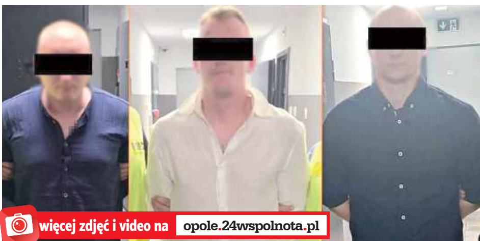
19-, 30- i 35-latek podejrzewani są o kradzież drogiej chemii i kosmetyki, m.in. perfum na łączną kwotę prawie 140 tys. zł

- Policjanci z opolskiego wydziału kryminalnego prowadzili intensywne czynności zmierz-