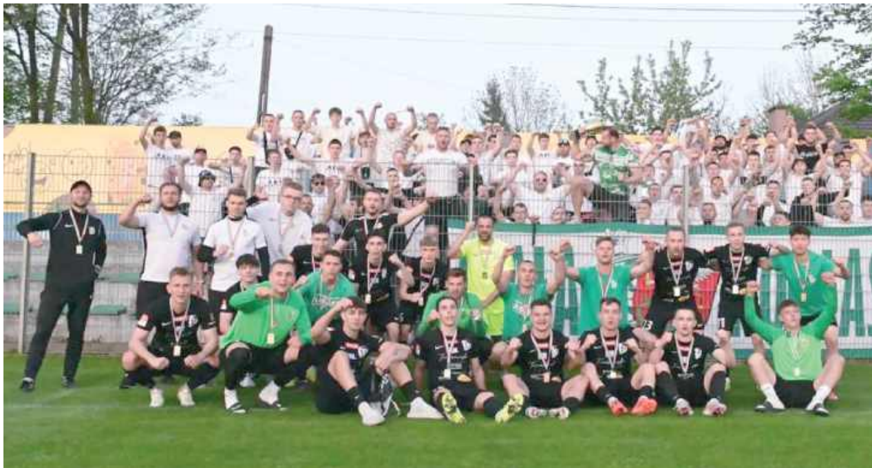
Podlasie ma puchar!

Emocje do ostatnich sekund, cztery gole, dogrywka i karne – finał Pucharu Polski na szczeblu okręgowym nie zawiódł. Po dramatycznym meczu Podlasie Biała Podlaska pokonało Orleńta Radzyń Podlaski i sięgnęło po upragniony puchar.