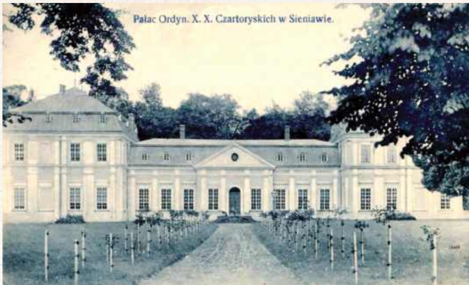
W sieniawskim Pałacu ślad po Szkatule się urywa. Niemieccy żołnierze roszabrowali odkryte w piwnicach skarby Czartoryskich. Historykom sztuki udało się wpaść na trop tylko niektórych z nich