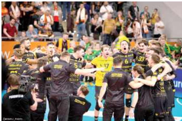
Siatkarze z Lublina awansowali do finału PlusLigi! Pierwszy raz w historii klubu

W pierwszym secie miejscowi szybko narzucili swoje tempo i prowadzili 7:2. To oznaczało, że lublinianie staną naprawdę przed niezwykle trudnym zadaniem, ale w kolejnej części partii w ogóle się go nie przestraszyli. Trzypunktowa seria dała im zniwelowanie do strat do wyniku 9:10, a chwilę później