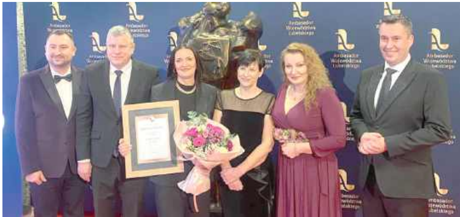
Jeszcze w lutym firma odbierała prestiżową nagrodę, teraz pisze w liście do kooperantów, że jest zmuszona do zgłoszenia upadłości

Bimiz to znany w całej Polsce producent i dostawca mrożonek. Firma funkcjonuje od wielu lat, współpracowało z nią wielu kontrahentów z naszego regionu. – Od lata ubiegłego roku czekamy na opłacenie faktur za owoce, które sprzedaliśmy. Ciężko jest dalej prowadzić gospodarstwo, bardzo dużo kosztują nawozy i opryski, a pieniądze dalej nie ma. Spółka opłacała wybiórczo, do dziś są nam winni około stu tysięcy złotych. Wiem, że nie jesteśmy jedynym gospodarstwem, któremu wiszą pieniądze. Nigdy tak nie było, to zawsze była dobra