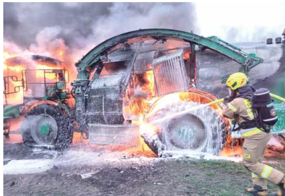
Pożar rębaka samojezdnego wybuchł w piątek, 25 kwietnia rano w miejscowości Mokre w gm. Rossosz. Na miejscu interweniował zastęp Ochotniczej Straży Pożarnej Rossosz, zastęp OSP Mokre, zastęp Jednostki Ratowniczo-Gaśniczej Biała Podlaska oraz policja.