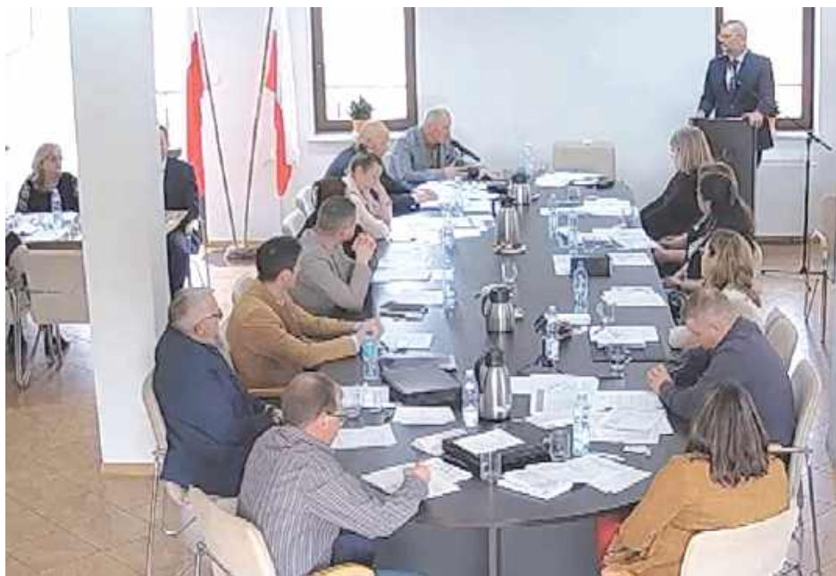
Radni oddali 10 głosów za, trzy przeciw, jedna osoba wstrzymała się od głosu

Na niedawnej sesji rajcy zgodzili się na przyznanie wójtowi podwyżki. Wynagrodzenie zasadnicze Hołowieńca zostało ustalone na 10 tysięcy złotych brutto, dodatek funkcyjny - na 3000 zł, a dodatek specjalny - na 3900 zł. Razem daje to 16900 zł brutto, czyli ok. 11,9 tys. zł netto.