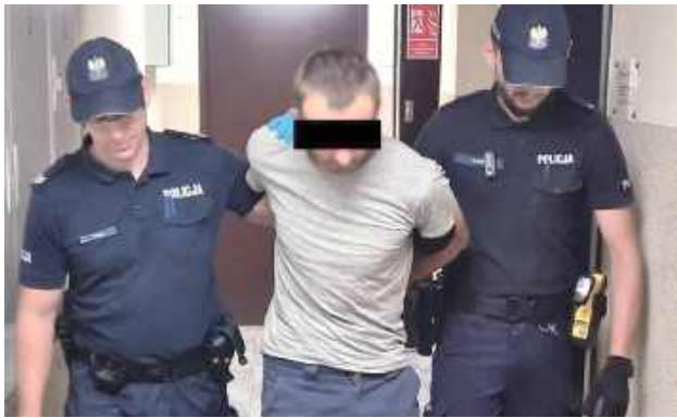
37-latek będąc pod działaniem alkoholu wyzywał swoją żonę, wyganiał z domu, poniżał i bił ją

- Kilka dni temu funkcjonariusze dowiedzieli się o kolej-