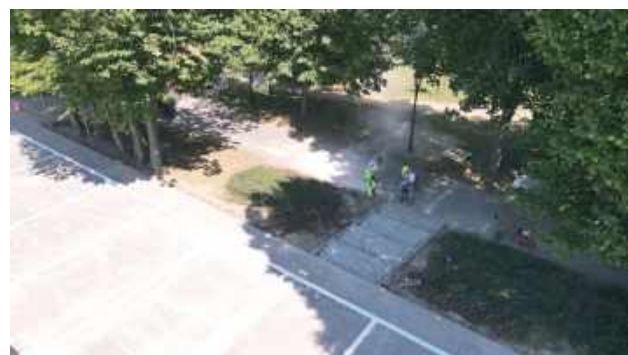
Wybudowano również schody prowadzące z parkingu na teren parku miejskiego

Uzupełnieniem tych prac było stworzenie nowego połą-