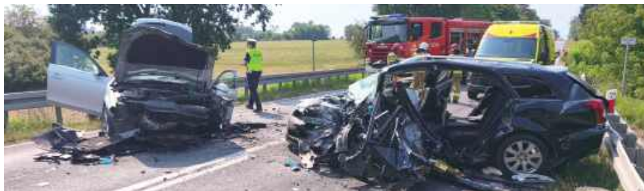
W wyniku czołowego zderzenia dwóch samochodów osobowych obrażeń doznały trzy osoby, w tym 11-letnia dziewczynka

Małoletnia wraz z drugą osobą to mieszkańcy powiatu ryckiego. Podróżowali samocho-