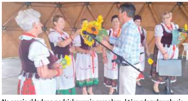
Na scenie składano podziękowania zespołom, które zdecydowały się na uczestnictwo w jubileuszu