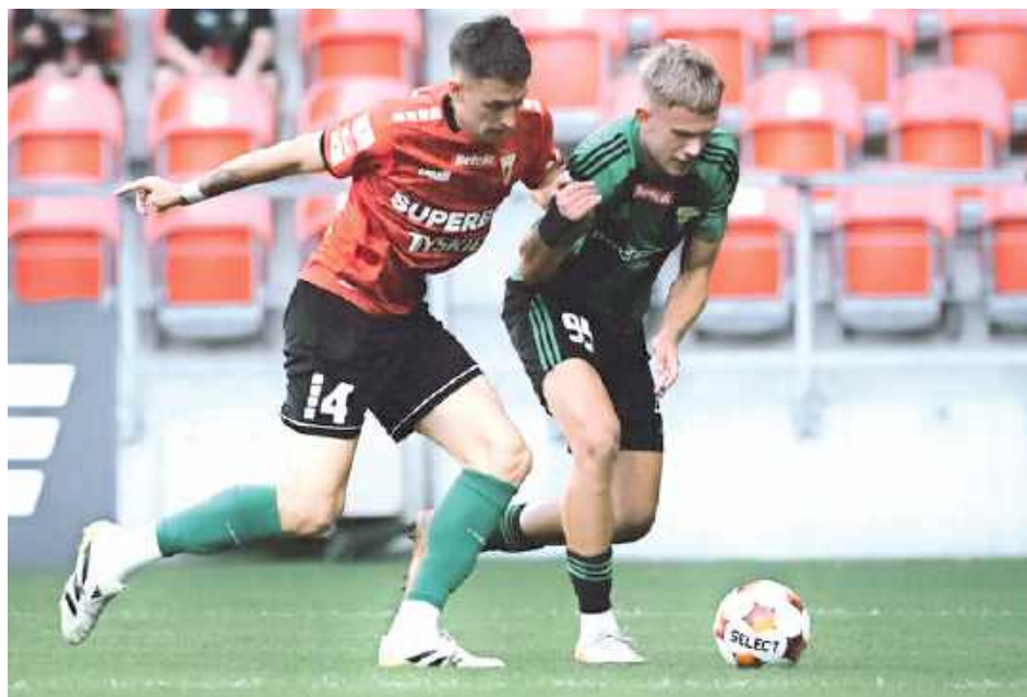
Łęczniane zdobyli jak dotąd sześć goli i stracili 10

Wynik 2:1 utrzymywał się niemalże do końca meczu, ale ostatecznie do Łęcznej pojechał punkt. W doliczonym czasie gry do wyrównania bardzo ładnym golem dopro-