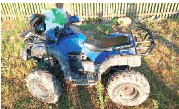
Badanie alkomatem wykazało, że kierowca miał w organizmie ponad 3 promile alkoholu

29-letni mieszkaniec powiatu ryckiego, jadąc w stanie nietrzeźwości, stracił panowanie nad pojazdem. Quad wywrócił się, a kierujący wypadł z siedzenia. Na miejsce wezwano policję i służby