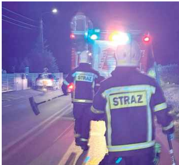
Do zderzenia doszło we wtorek, 12 sierpnia, około godziny 21

- Kierowca doznał niegroźnych obrażeń ciała i został przekazany pod opiekę zespołu ratownictwa medycznego. Po przebadaniu w szpitalu mężczyzna został zwolniony do domu - poinformował asp. szt. Marcin Józwiak z Komendy Powiatowej Policji w Łukowie. Kierowca był trzeźwy. Zwierzę przeżyło uderzenie i uciekło.