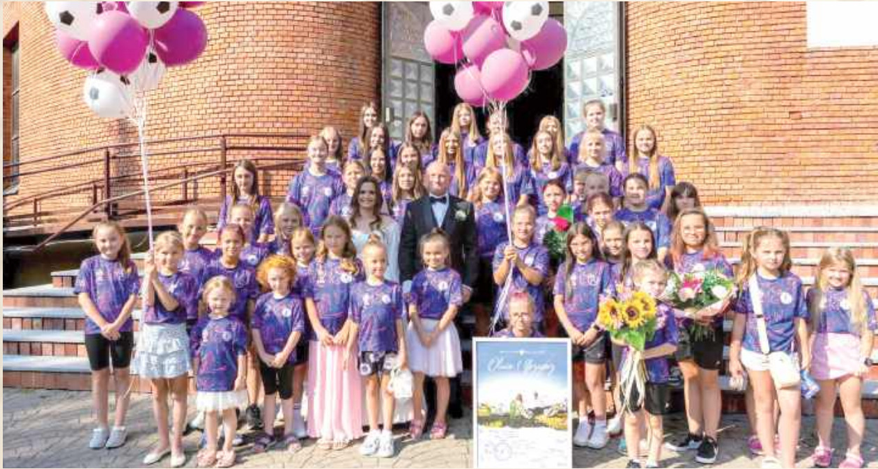
Podczas tego wyjątkowego dnia nie mogło zabraknąć „braci piłkarskiej”. Piłkarki ŻKS-u Izabella Puławy towarzyszyły swoim trenerom, ubrane w klubowe stroje, a podczas wyjścia nowożeńców z kościoła utworzyły szpaler, tworząc niepowtarzalną sportową oprawę ceremonii