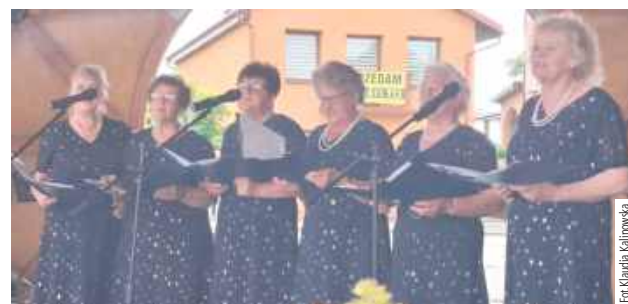
Zespół Senior z Ulana-Majoratu