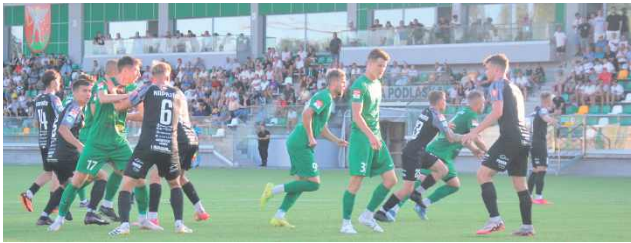
Białczanie prowadzili dwoma bramkami, a przegrali z beniaminkiem III ligi

Naprzód odpowiedział kilkoma groźnymi atakami – główka Jarosława Kosieradzkiego minęła słupek, a w 37. minucie Maciej Orzechowski w ostatniej chwili wybił piłkę na rzut rożny. Do przerwy jednak to Podlasie cieszyło się z prowadzenia – w doliczonym czasie gry Kosieradzki