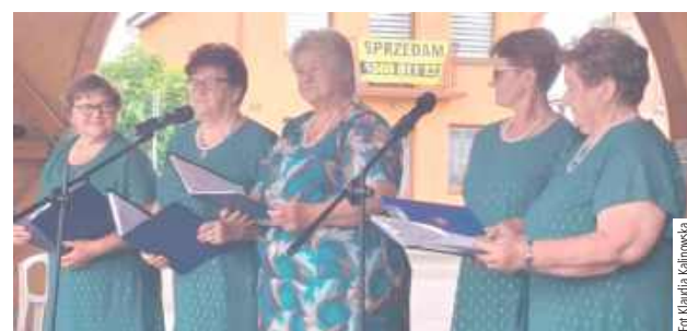
Zespół Melodia z Domaszewnicy

Organizatorzy zapewнили atrakcje dla dzieci, a także smakołyki przygotowane przez Spółdzielnię Socjalną Niedźwiadek oraz Stowarzyszenie Oświatowe Kaganek. Wydarzenie zakończyło się potańcówką na ludową nutę.