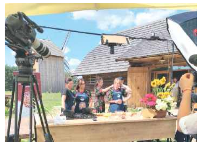
Zaprezentowane podczas nagrania potrawy są syjące i powstały z ogólnodostępnych produktów

Zgrzewaniec staropolski , znany również w skrócie jako „staropolski”, to tradycyjne danie mięsne, które charakteryzuje się połączeniem różnych rodzajów mięs (karkówka, schab, boczek wędzony) w jednym kotlecie.