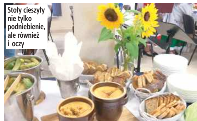
Stoły cieszyły nie tylko podniebienie, ale również i oczy