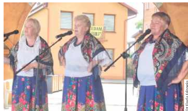
Zespół Chodów z Chodowa