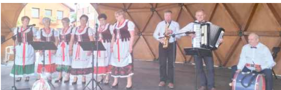
Zespół Jarzębina Czerwona ze Stanina