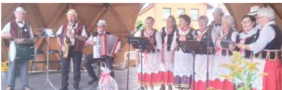
Zespół Świderzanki ze Świderek

Organizatorzy zapewнили atrakcje dla dzieci, a także smakołyki przygotowane przez Spółdzielnię Socjalną Niedźwiadek oraz Stowarzyszenie Oświatowe Kaganek. Wydarzenie zakończyło się potańcówką na ludową nutę.