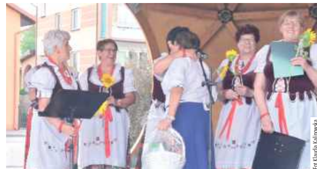
Każdy z zespołów złożył życzenia jubilatowi niedzielnego wydarzenia

17 sierpnia o godzinie 15.00 na Placu Niedźwiedzim w Adamowie rozpoczął się Dzień Folkloru. W tym roku wydarzenie to było szczególne ponieważ Zespół Ludowy Modry Len świętował jubileusz 15-lecia!