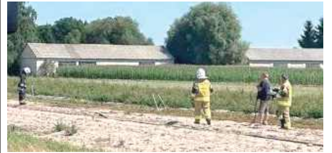
Pożar wybuchł 14 lipca zaraz po godzinie 11

14 lipca po godzinie 11 kilka jednostek straży pożarnej zostało zadysponowanych do pożaru ścierniska.