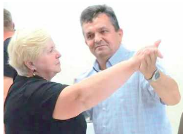
Tradycje kulinarne mogą inspirować i integrować