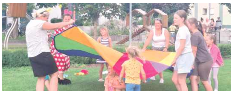
Organizatorzy przygotowali zabawy dla najmłodszych uczestników wydarzenia

17 sierpnia o godzinie 15.00 na Placu Niedźwiedzim w Adamowie rozpoczął się Dzień Folkloru. W tym roku wydarzenie to było szczególne ponieważ Zespół Ludowy Modry Len świętował jubileusz 15-lecia!