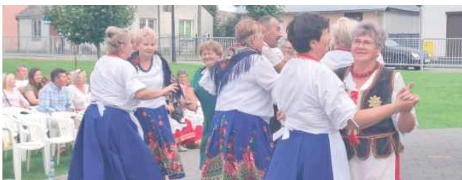
Wydarzenie zakończyło się ludową potańcówką!

Pogoda dopisała wydarzeniu, które było szczególnie udane. Na scenie zaprezentowały się Zespoły Ludowe z różnych miejscowości. Każdy z zespołów złożył życzenia jubilatowi niedzielnego wydarzenia.