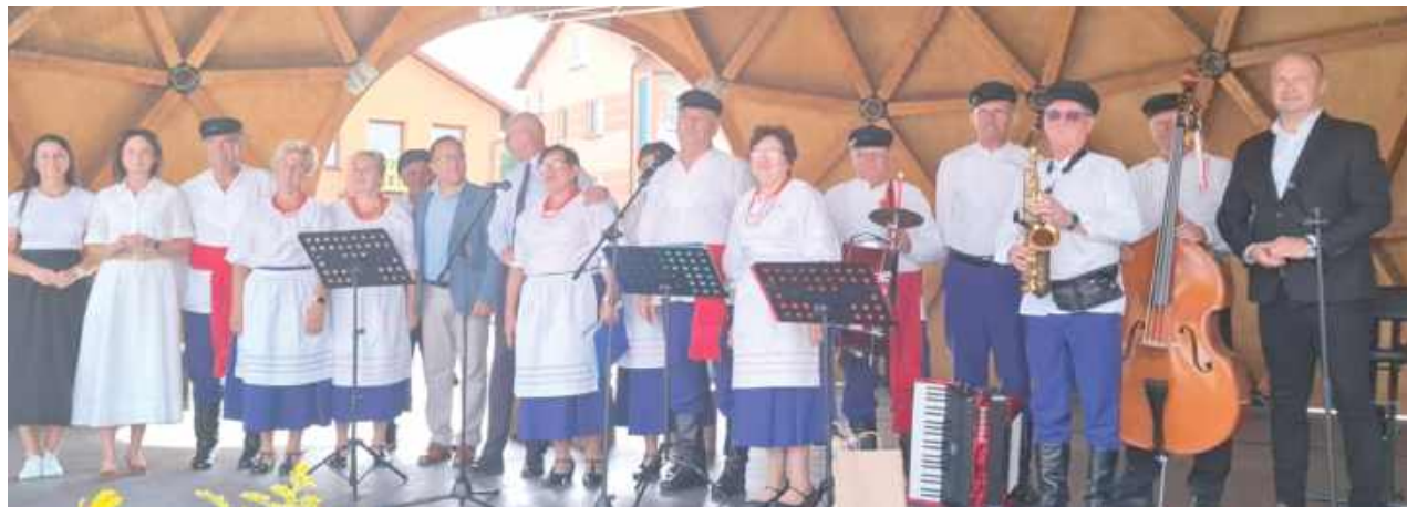
Zespół Ludowy Modry Len z Adamowa - jubileci niedzielnego wydarzenia!