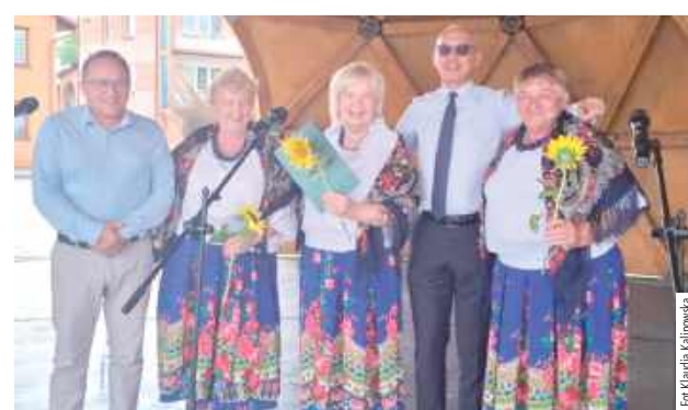
Niedzielne wydarzenie wywołało radość wśród zgromadzonych

Pogoda dopisała wydarzeniu, które było szczególnie udane. Na scenie zaprezentowały się Zespoły Ludowe z różnych miejscowości. Każdy z zespołów złożył życzenia jubilatowi niedzielnego wydarzenia.