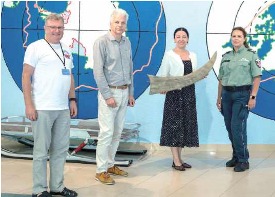
Eksponat trafił do Puław z Białej Podlaskiej. Przekazano go pracownikom muzeum w środę 13 sierpnia

Muzeum Badań Polarnych w Puławach przy ul. 4. Pułku