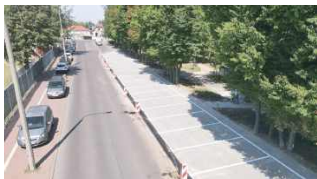
W ramach inwestycji rozebrano zniszczoną nawierzchnię asfaltową

W ramach inwestycji rozebrano zniszczoną nawierzchnię asfaltową oraz część chodnika wyłożoną kostką brukową. W ich miejsce ułożono nową powierzchnię z kostki brukowej,