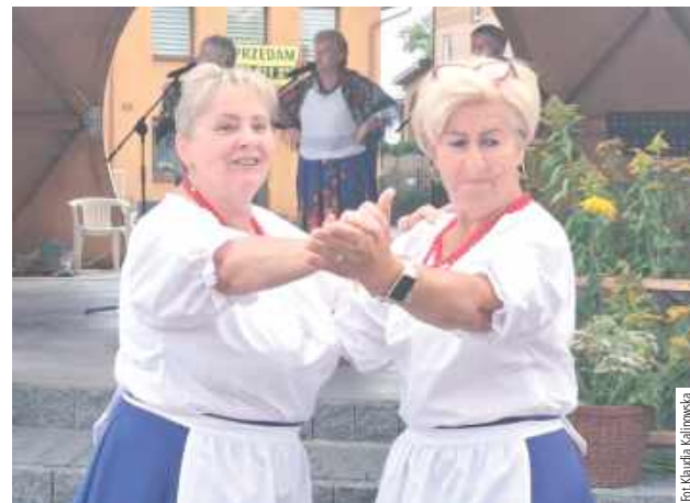
Muzyka sprawiła, że wiele osób ruszyło do tańca!