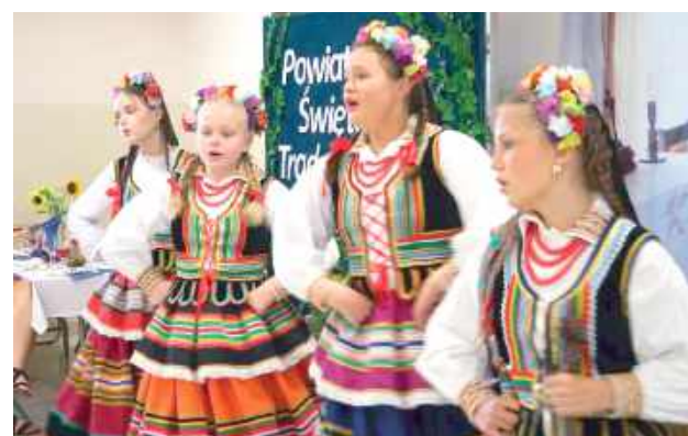
Wykreowali przestrzeń, w której można było smakować historię i jednocześnie cieszyć się teraźniejszością