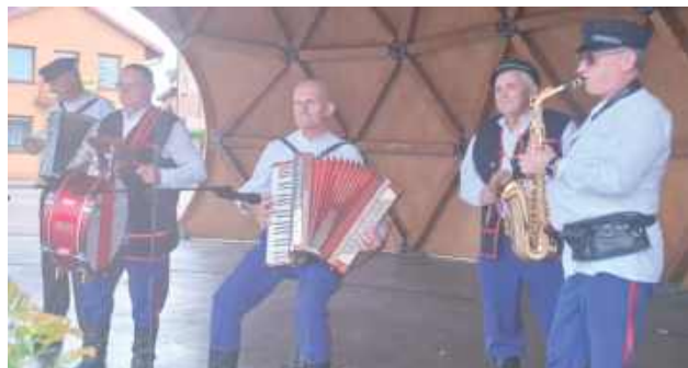
Na scenie mogliśmy zobaczyć wiele utalentowanych osób