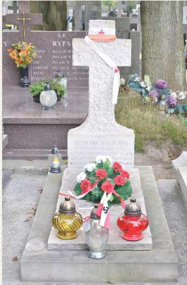
Została pochowana w ogródku domu przy ul. Polnej 36. Po wojnie jej zwłoki ekshumowano i przeniesiono na stary cmentarz na Służewie. Na nagrobku wyryto pierwszą zwrotkę jej piosenki „Hej, chłopcy, bagnet na broń”

W prasie konspiracyjnej nie było nut, więc jeśli śpiewali ją powstańcy, to układali muzykę na własną rękę. Chyba