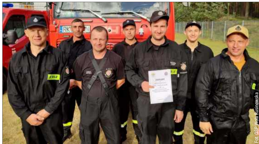
- Nasza jednostka wzięła udział w Gminnych Zawodach Sportowo-Pożarniczych, podczas których po zaciętej rywalizacji zajęliśmy III miejsce. To dla nas duże wyróżnienie i motywacja do dalszych treningów - skomentowali druhowie z Woli Rusinowskiej.

Drugie miejsce wśród drużyn męskich zajęła OSP Brzostowa Góra. Druhowie podkreślali po zawodach, że wynik jest efektem zaangażowania, determinacji i godzin spędzonych na treningach.