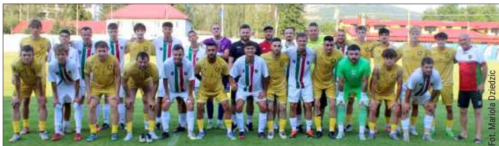
Zespół z Kolbuszowej (białe stroje) zagrał ciekawy sparing na Słowacji.