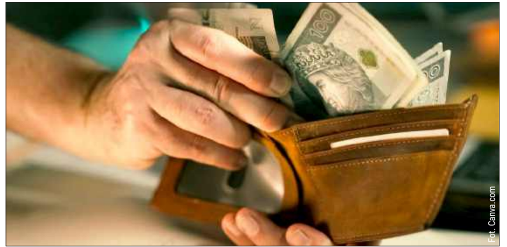
Znalazł szaszetkę z dokumentami i dużą kwotą pieniędzy. Oddał ją policjantom.

Sprawa zakończyła się więc szczęśliwie. Dokumenty i pieniądze wróciły do właściciela, a postawa znalazcy pokazuje, że zwykła uczciwość potrafi mieć bardzo konkretny wymiar.