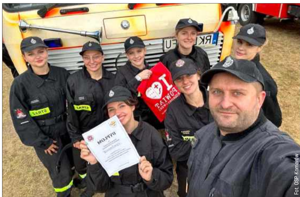
- Z ogromną radością informujemy, że nasza drużyna kobieca zdobyła 1. miejsce! Natomiast drużyna męska zakończyła rywalizację na 5. miejscu - napisali druhowie z Komorowa.

„Po zaciętej rywalizacji i pokazie prawdziwego strażackiego charakteru, wywalczyliśmy świetne drugie miejsce” - napisali strażacy z Brzostowej Góry.