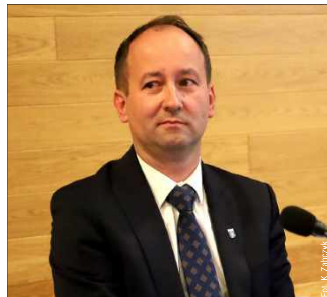
Oświadczenia majątkowe mają obowiązek składać także urzędnicy na stanowiskach kierowniczych, m.in. zastępcy wójtów, czy burmistrzów.

Wszystkie wykazane dochody wiceburmistrza zostały objęte małżeńską wspólnością majątkową. Łączna kwota jego zarobków brutto w 2025 roku zamknęła się w sumie 291 701,59 zł. bp