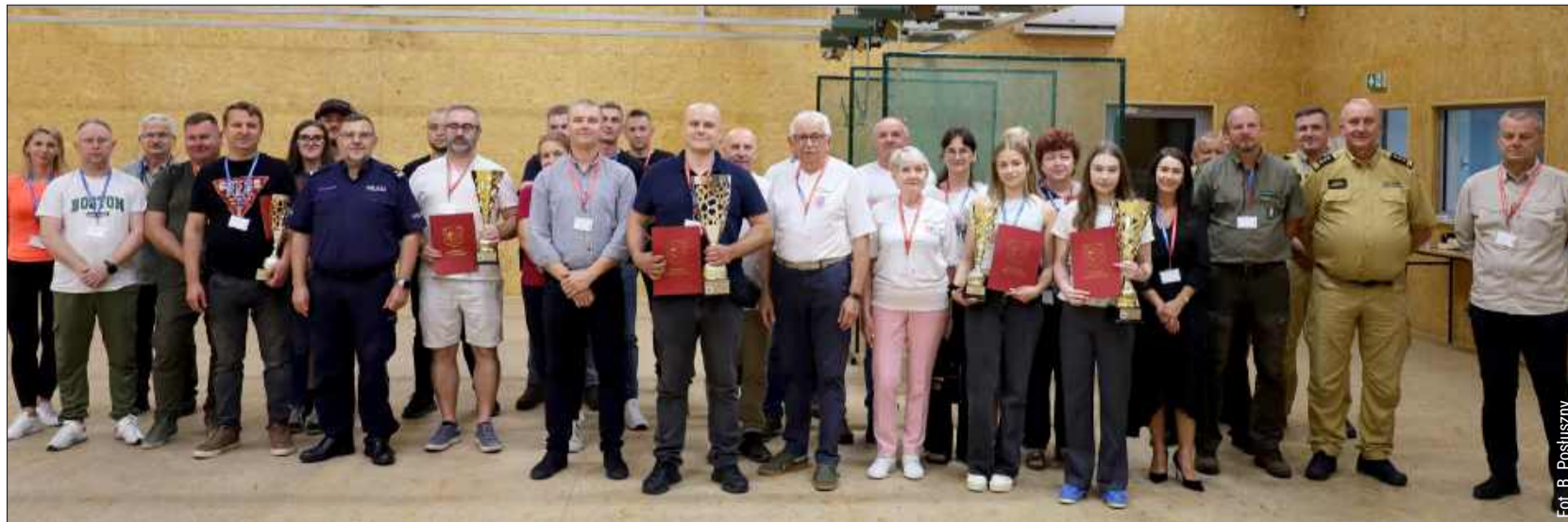
Za nami pierwsze zawody strzeleckie. Więcej zdjęć z tego wydarzenia znajdziecie na naszej stronie internetowej korsokolbuszowskie.pl.