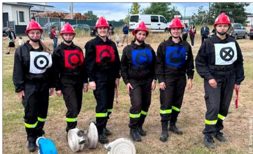
Druhny z Komorowa nie miały sobie równych w grupie „C”.