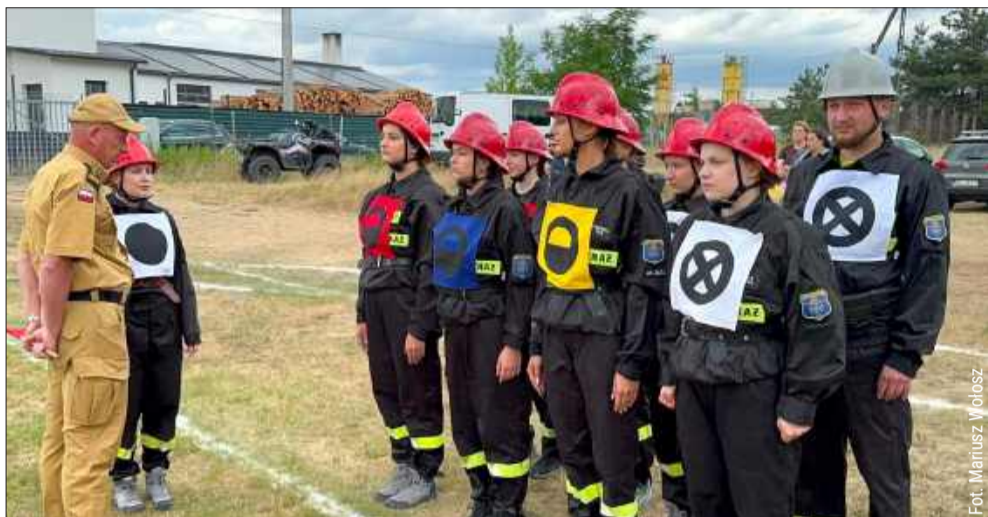
Druhny z Majdanu Królewskiego tuż przed rozpoczęciem ćwiczenia bojowego.