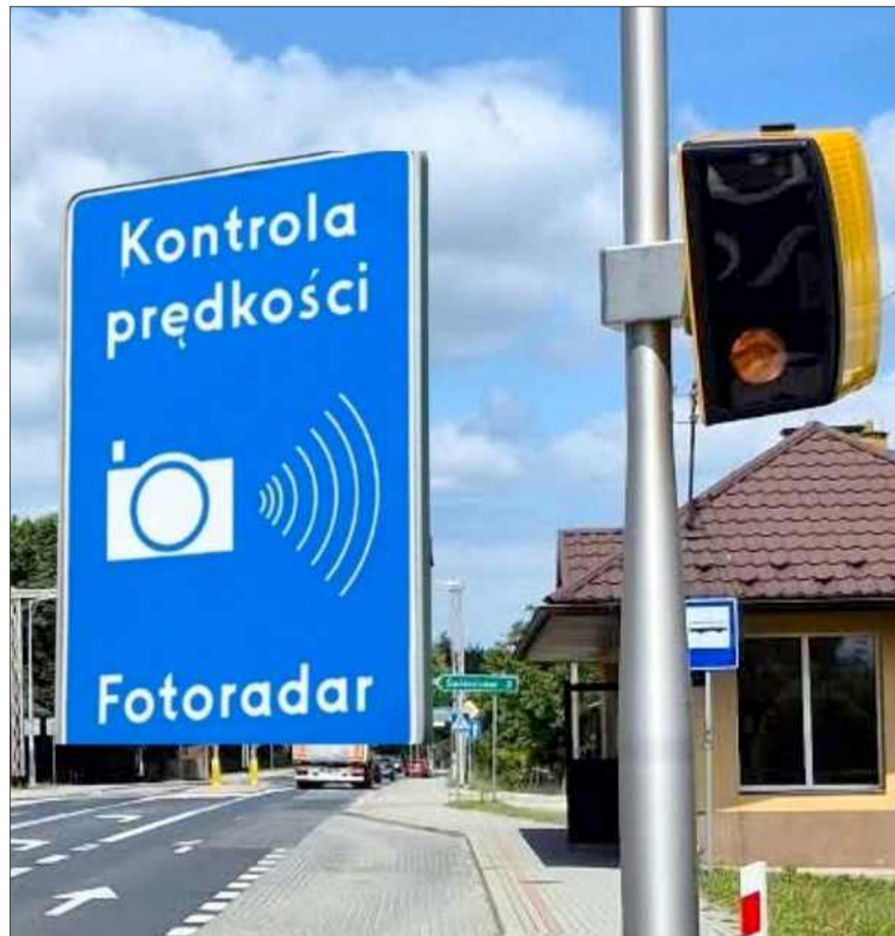
Koniec taryfy ulgowej na drodze krajowej nr 9. Nowe fotoradary już działają.