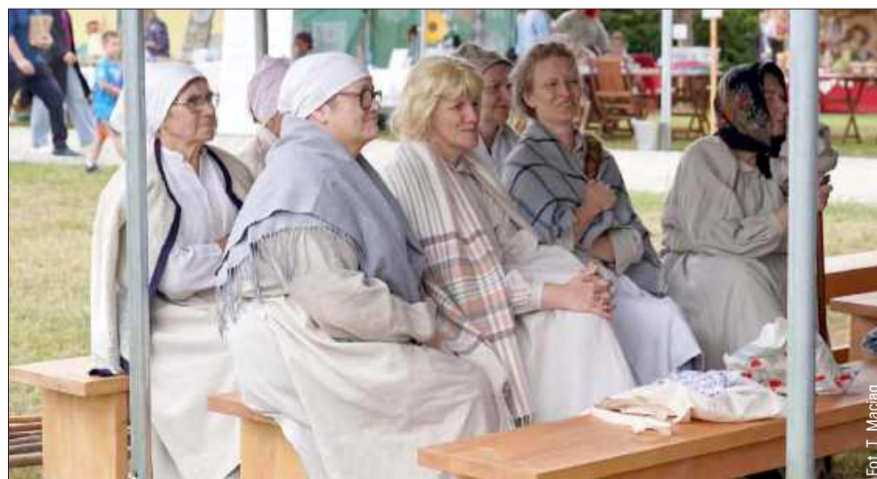
Wydarzenie było częścią VI Festiwalu Kultury Lasowiackiej.

Po przesłuchaniach konkursowych przyszedł czas na obrady jury, ogłoszenie wyników oraz wręczenie nagród. W programie wydarzenia znalazł się także koncert zespołu Something's Trio oraz potańcówka pod gwiazdami z kapelą Łola. tm