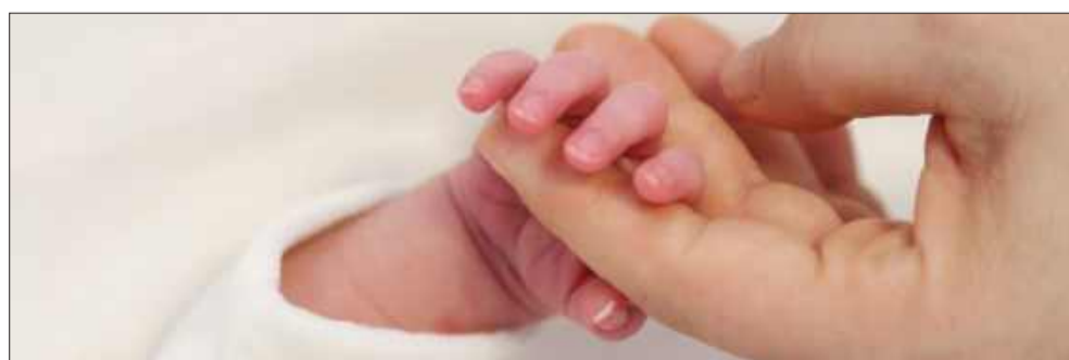
Ile dzieci urodziło się w powiecie kolbuszowskim w pierwszej połowie 2026 roku?