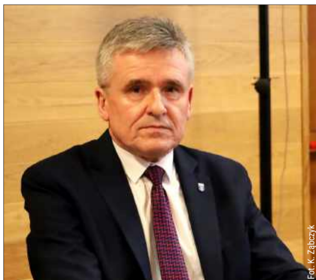
Sprawdziłmy najnowsze oświadczenie majątkowe burmistrza Kolbuszowej.

W rubrykach dotyczących posiadania domu, mieszkania czy gospodarstwa rolnego burmistrz wpisał „nie dotyczy”.