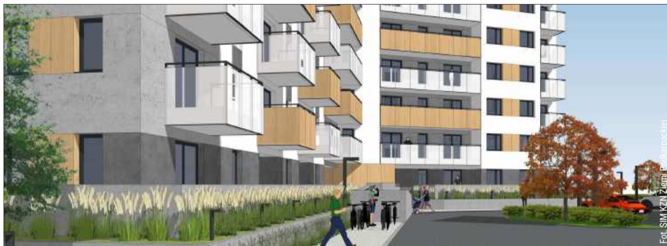
Więcej chętnych niż mieszkań w Kolbuszowej. SIM planuje kolejny etap inwestycji.

SIM, czyli Społeczna Inicjatywa Mieszkaniowa, to forma budownictwa społecznego. Nie