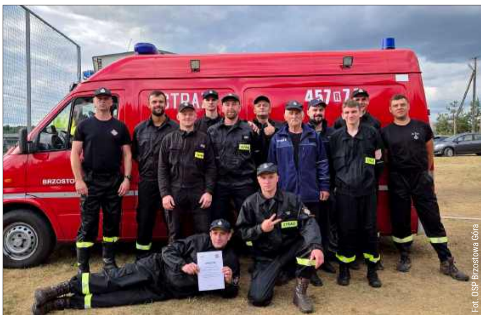
- Z ogromną dumą i radością informujemy, że po zaciętej rywalizacji i pokazie prawdziwego strażackiego charakteru, wywalczyliśmy świetne drugie miejsce! To dla nas wielkie wyróżnienie i najlepszy dowód na to, że zaangażowanie, determinacja i godziny spędzone na treningach przynoszą wspaniałe efekty - napisali z kolei druhowie z Brzostowej Góry.

Na stadionie w Majdanie Królewskim odbyły się gminne zawody sportowo-pożarnicze. Do rywalizacji stanęły jednostki OSP z terenu gminy. Wśród drużyn męskich najlepszym okazał się gospodarz z OSP Majdan Królewski, a wśród kobiet zwyciężyły druhny z OSP Komorów.