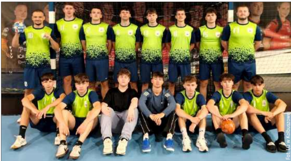
Licealiści z Kolbuszowej zagraли w Piotrkowie Trybunalskim.

Licealiści z Kolbuszowej walczyli w Ogólnopolskim Finale Licealiady w Piłce Ręcznej Chłopców. Turniej odbył się w dniach 14–16 czerwca w Piotrkowie Trybunalskim. Drużyna z Liceum Ogólnokształcącego w Kolbuszowej reprezentowała w nim całe województwo podkarpackie.