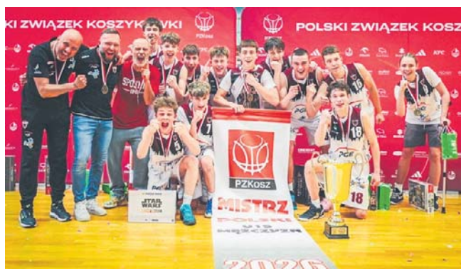
Drużyna PGE Spójni Stargard z medalami i pucharem po wygranym finale