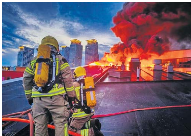
Wszyscy mieszkańcy zostali ewakuowani z budynku. Strażacy gasili ogień przez 10 godzin

- Ogień został prawdopodobnie wzniesiony od pozostawionego na balkonie grilla gazowego - podkreśla tamtejsza policja. PAP