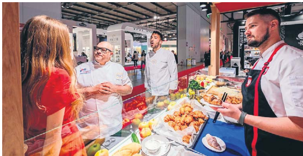
Polskie stoisko na międzynarodowych targach żywności

- Zainteresowanie jest bardzo duże i rok do roku rośnie. W 2025 r. w działaniach KOWR wzięło udział przeszło 500 przedsiębiorców. Przykładowo, na targach Foodex w Tokio prezentowało się aż 38 polskich firm - to liczba naprawdę znacząca, jeżeli weźmiemy pod uwagę odległość geograficzną, złożoność regulacyjną rynku japońskiego oraz wymagania sanitarne, które stawia ten kraj. Z kolei w Montrealu gościliśmy ostatnio 10 firm, ale warto zauważyć, że polski eksport rolno-spożywczy do Kanady opiewa na kwotę blisko 143 milionów euro rocznie. To istotna suma, choć w skali całego polskiego eksportu rolno-spożywczego, który osiągnął poziom 58,4 miliardów euro, wciąż widzimy bardzo duży potencjał wzrostowy. Strategia