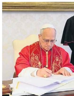
Papież podpisuje encyklikę „Magnifica humanitas”

Dokument otwierają następujące słowa: „Wspaniałe człowieczeństwo stworzone przez Boga staje dziś wobec decydującego wyboru: wzniesić nową wieżę Babel albo budować mia-