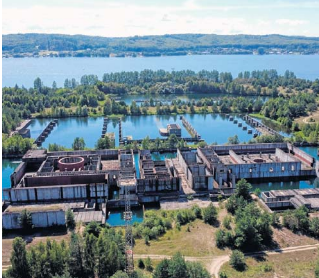
W 1990 r. rząd przesunął inwestycję „Elektrownia Jądrowa Żarnowiec w budowie” w stan likwidacji

Do 1986 r. ukończono prace nad większością obiektów pomocniczych elektrowni, takich jak hale magazynowe, kotłownia technologiczna, hydrofornia, oczyszczalnia ścieków, sto-