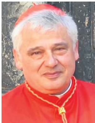
Kard. Krajewski: - Strasznie uchodźcami to sprawa czysto polityczna, nie ma się czego bać

Pamiętam ten początkowy entuzjazm i podziw, który wywo-