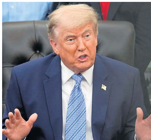
Trump zapowiedział w niedzielę, że amerykańska blokada irańskich portów będzie utrzymana do zawarcia porozumienia z Teheranem

Na temat porozumienia wypowiedział się również prezydent Donald Trump. Porozumienie z Iranem nie zostało jeszcze