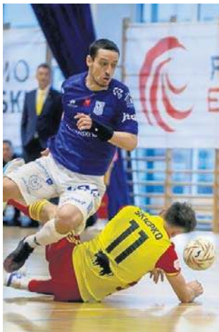
FOT. WOJCIECH WOJTKIEWICZ

W derbach Białegostoku do przerwy Futbolo prowadziło 2:1, ale potem nastąpił szturm BAF Bonito. Goście strzelali piękne gole i wygrali 6:4. ©©