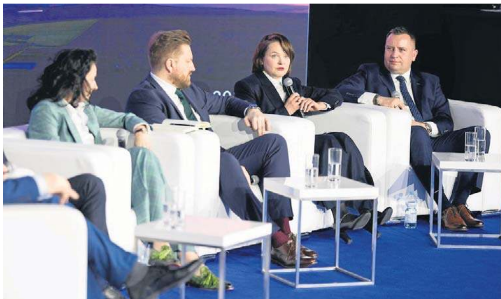
Trzeba obniżyć koszty i dostosować kontrakty do krajowych wykonawców

- Jeśli chodzi o onshore, nasza aktualna strategia, która została przyjęta w styczniu zeszłego roku, mówi o blisko 13 GW mocy zainstalowanej w OZE - przypomniał jednocześnie.