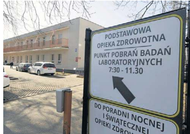
Zakład Pielęgnacyjno-Opiekuńczy działał przy ul. Wołodyjowskiego 2/1. Obecnie są tu szpitalne poradnie

W pierwszej kolejności na terenie Śniadecji powstanie nowy, czterokondygnacyjny budynek, do którego mają przenieść się