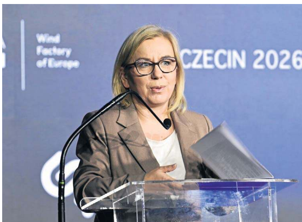
Paulina Hennig-Kloska, minister klimatu i środowiska, podkreśliła, że w ubiegłym roku Polska wyprodukowała ponad 31 proc. energii z OZE

Dodała, że rozwój tego typu inwestycji otwiera także przestrzeń do budowy własnych kompetencji technologicznych. Jako przykład wskazała powstający w Polsce, w Żarnowcu, jeden z największych magazynów energii w Europie. Podkreśliła, że takie podejście wzmacnia bezpieczeństwo energetyczne i pozwala budować bardziej niezależny, oparty na krajowych zasobach system energetyczny.