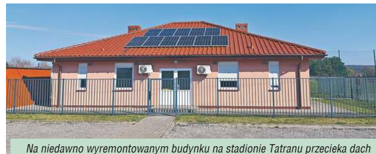
Na niedawno wyremontowanym budynku na stadionie Tatrano przecieka dach

Probleem z dachem wystąpił jednak nie tylko w Domu Kultury. Ostatnio okazało