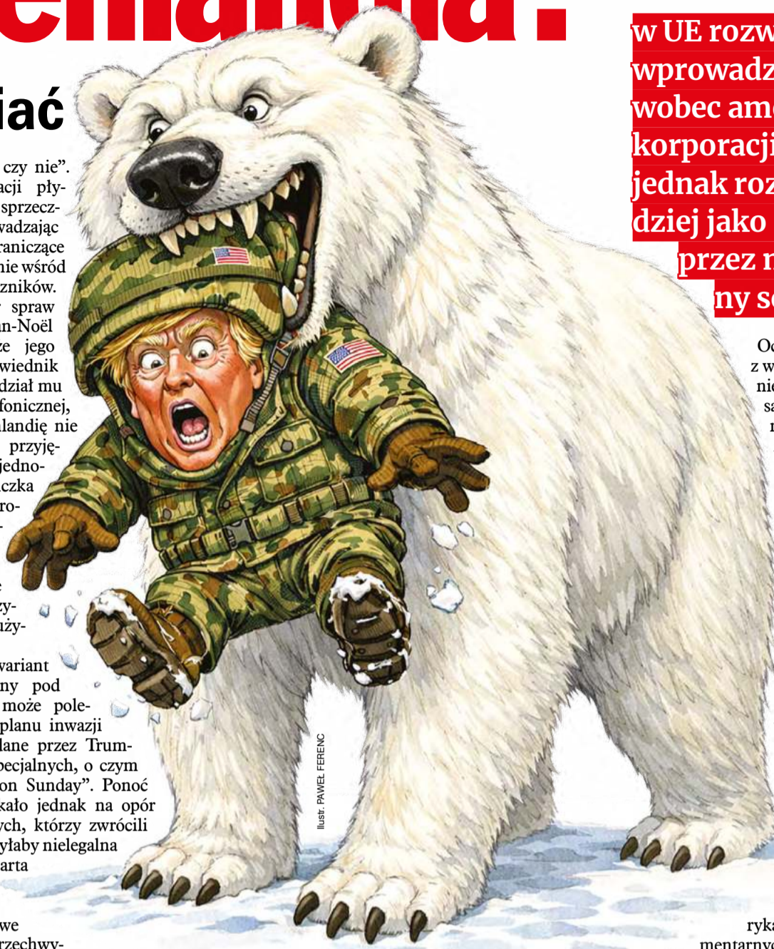
ILLUSTRACJA: PAVEL FERENC

Przeciwni interwencji są także niektórzy amerykańscy politycy. Senator John Neely Kennedy z Partii Republikańskiej nazwał ewentualne zbrojne wtargnięcie na teren Grenlandii niebezpiecznym idiotyzmem. Demokratyczny senator Ruben Gallego wniósł do projektu ustawy o wydatkach na obronę poprawkę zakazującą wykorzystania tych funduszy na wojenne działania wobec Grenlandii. Wskazuje przy tym – i nie on jeden – że awanturą wokół Grenlandii Trump stara się odwrócić uwagę Amerykanów od problemów życia codziennego takich jak inflacja, rosnące ceny produktów i mieszkań.