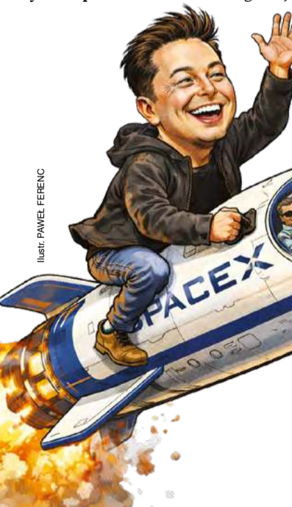
ILUSTRACJA: PRAWEL FERENC

I w końcu nowe pole ucieczki przed nawisem kapitału portfelowego: inwestycje w sztuczną inteligencję, AI. Założyciel OpenAI Sam Altman ogłosił,