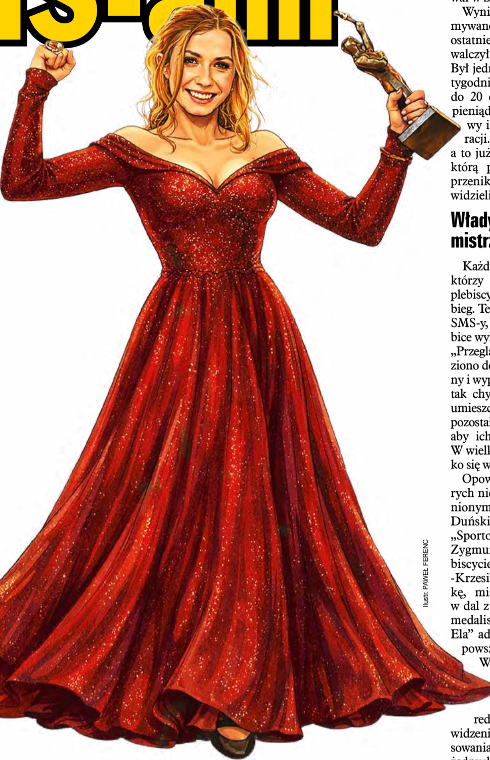
ILUSTR. PAWEŁ FERENC

Profbud – jak zapowiedział prezes – nadal nagradzać będzie sportowców kluczami do mieszkań i zapewne dlatego otrzymał na scenie Czempiona. Skojarzyło mi się, że za poprzedniego ustroju klucze do własnego mieszkania wybitni sportowcy otrzymywali z rąk sekretarzy Komitetu Centralnego Polskiej Zjednoczonej Partii Robotniczej, ale jakoś