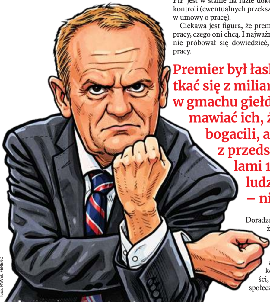
Ilustracja: PAVEL FERENC

Słowa, które cytuję, poseł Morawiecki pisał pod koniec grudnia zeszłego roku. Jeszcze przed napadem wojsk USA na Wenezuelę, powszechnie teraz krytykowanym na świecie. A także przed złożoną na początku roku deklaracją prezesa Kaczyńskiego, że kandydatem jego prawicy na przyszłego premiera powinien być