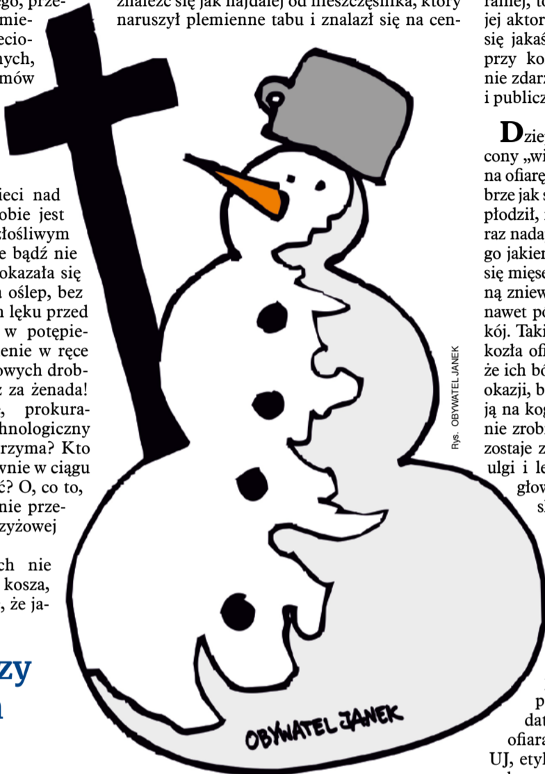
Rys. OBYWATEL JANEK

W panice moralnej fakty nie mają nic do rzeczy. To wyścig napędzany jedną emocją – lękiem. Lękiem przykrywanym moralną legendą o świętym oburzeniu. Wyścig nie jest do żadnej mety – chodzi tylko o to, by jak najszybciej znaleźć się jak najdalej od nieszczęślika, który naruszył plemienną tabu i znalazł się na cen-