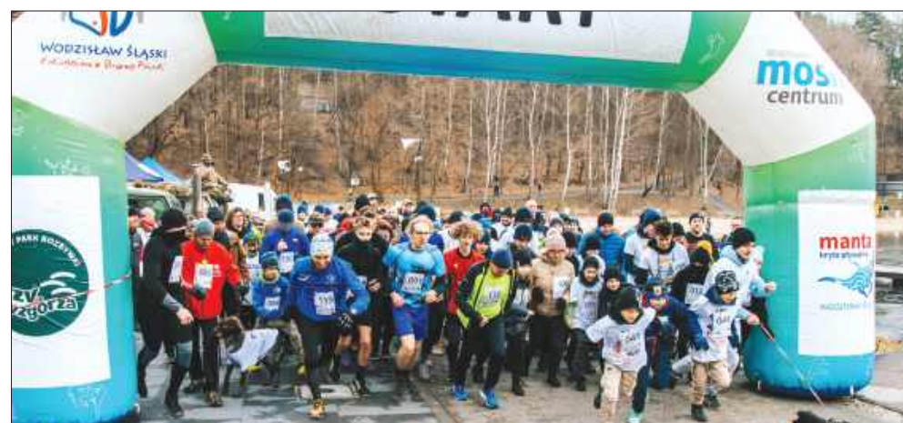
■ Start biegu „Tropem Wilczym” 2 marca