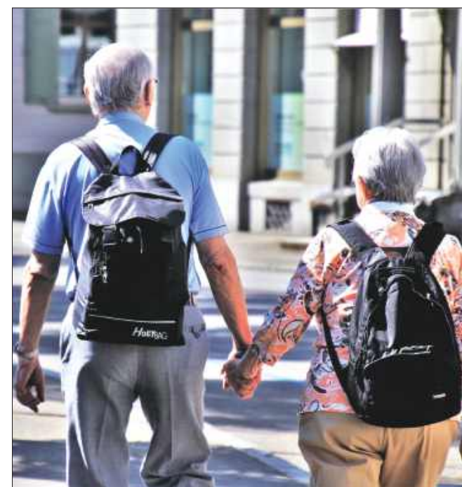
■ W sprawie waloryzacji nie trzeba składać żadnego wniosków, ponieważ odbywa się ona z urzędu dla wszystkich uprawnionych - przekazuje ZUS Pixabay/ zdjęcie poglądowe

– W sprawie waloryzacji nie trzeba składać żadnego wniosków, ponieważ odbywa się ona z urzędu dla wszystkich uprawnionych – podkreśla rzeczniczka. Informację dotyczącą wysokości waloryzacji będzie można sprawdzić na swoim koncie na Platformie Usług Elektronicznych ZUS. Każdy emeryt i rencista otrzyma również decyzję o nowej wysokości swojego świadczenia. W dokumencie