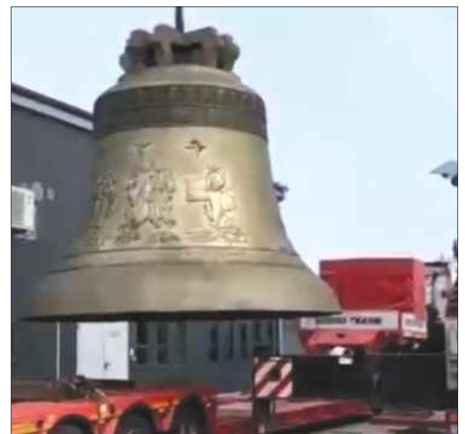
■ Rozładunek dzwonu Vox Patris foto: Rduch Bells & Clocks FOTO: RDUCH BELLS & CLOCKS

źródło: Starostwo Powiatowe w Wodzisławiu Śląskim, oprac. ż