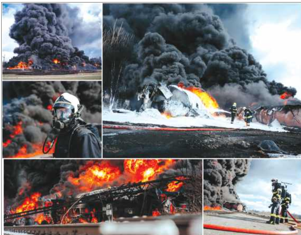
■ Na razie nie ma informacji, by toksyczny dym zagrażał mieszkańcom regionu.

CZECHY Potężny pożar wybuchł w wyniku wykolejenia się kilku wagonów towarowych i cysterń przewożących benzen. Do zdarzenia doszło w miejscowości Hustopeče, około 70 km od naszego regionu.