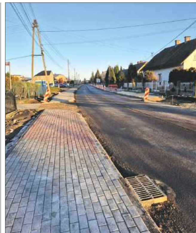
■ 4 i 5 marca można spodziewać się utrudnień na ul. 1 Maja w Gołkowicach. Zdjęcie ilustracyjne

Rocznik 2012: 1. Forteca Świerklany, 2. Górnik Radlin, 3. Płomień Połomia, 4. Orzeł Jankowice, 5. KS Kokoszyce, 6. Polonia Marklowice