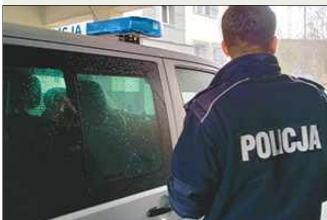
■ Jak wynika z ustaleń policjantów, to dziadek robił zakupy z wnukiem.

Jeśli masz wątpliwości, skontaktuj się z Funduszem przez bezpłatną i całodobową infolinię 800 190 590 lub powiadom najbliższą jednostkę policji. (sqx)