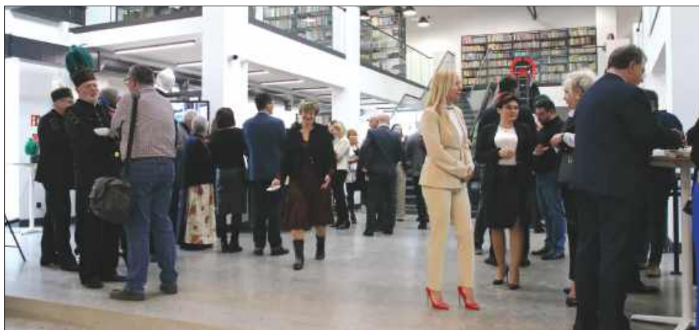
■ Uroczyste otwarcie nowej biblioteki w zrewitalizowanym budynku maszyny wyciągowej szybu „Jan” odbyło się w poniedziałek 3 marca