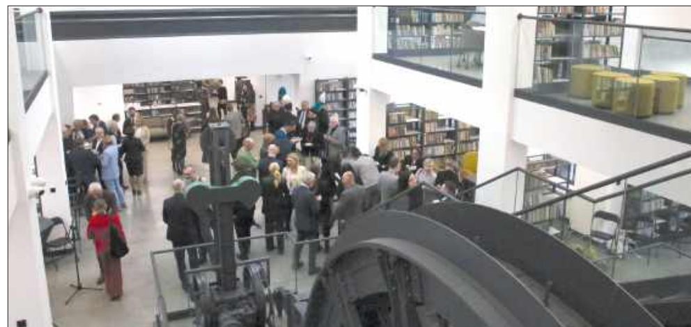
■ Ze starego wyposażenia budynku pozostała maszyna wyciągowa oraz suwnica