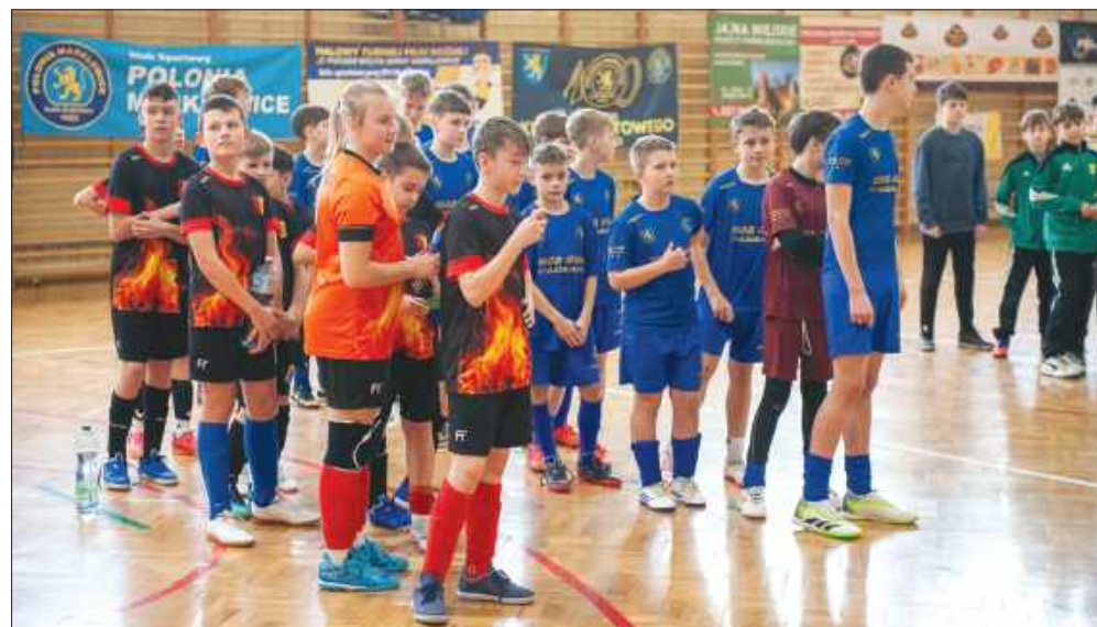
■ Halowy turniej piłkarski o Puchar Wójta Gminy Marklowice odbył się od 28 lutego do 2 marca.