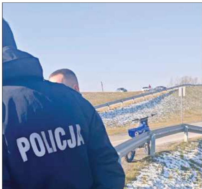
■ Policjanci skierują sprawę do sądu rodzinnego i nieletnich.

BLUSZCZÓW Nastolatek bez uprawnień, motocykl bez ubezpieczenia, niedopuszczony do ruchu. Sprawa skończy się w sądzie. Jednak odpowiadać będzie nie tylko 17-latek. Policjanci sprawdzą także inny wątek.