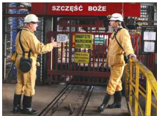
■ Strata sektora górniczego według ARP to ponad 11 mld zł. ZDJĘCIE ILUSTRACYJNE

Przychody sektora górnictwa węgla kamiennego wyniosły 41 mld zł i były o 26% niższe niż w 2023 r., gdy wyniosły 55,74 mld zł. Przychody ze sprzedaży węgla wyniosły 25,43 mld zł w 2024 r. wobec 37,9 mld zł w 2023 r.