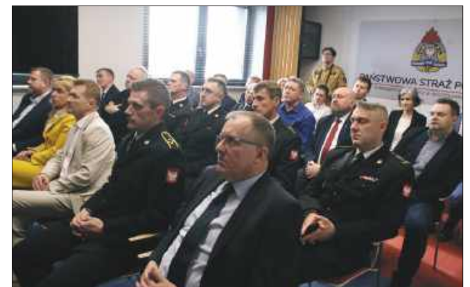
■ Po uroczystości mianowania dowódcy oraz awansów odbyła się także narada podsumowująca zeszły rok w działalności PSP