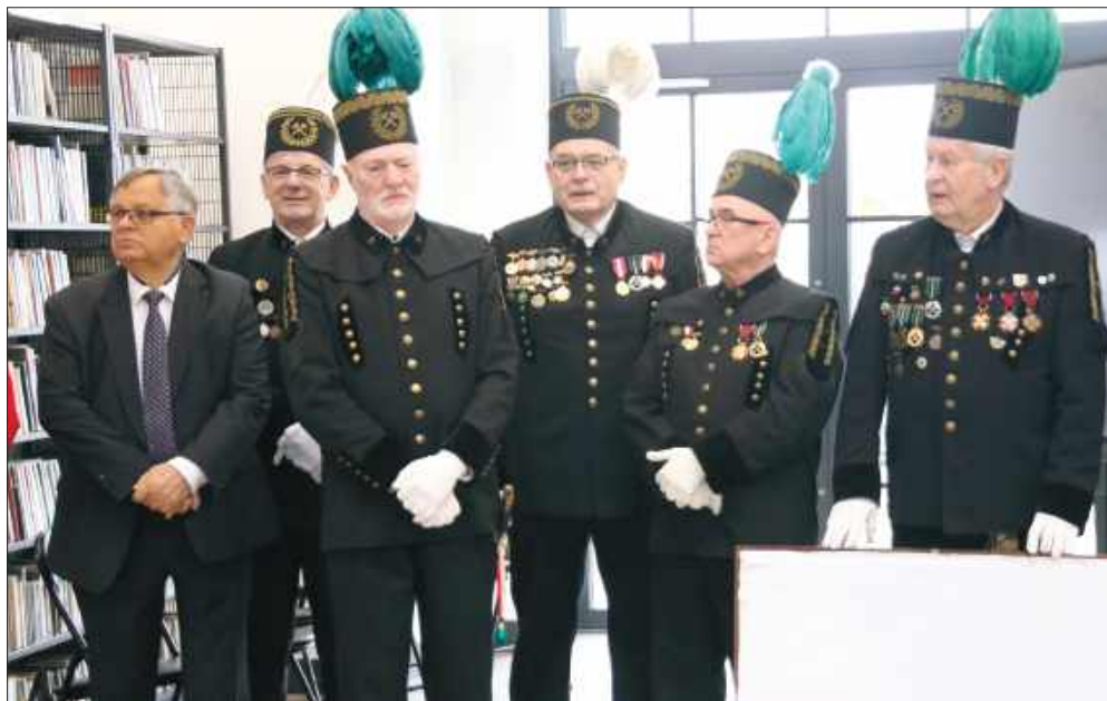
■ W uroczystości udział wzięli byli pracownicy i dyrekcja KWK Anna