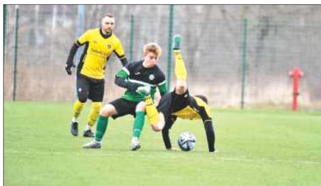
■ LKS Tworków melduje się w finale PP podokręgu Racibórz

– Przez pierwsze dwadzieścia minut mogło się wydawać, że jesteśmy lepszym zespołem – udało nam się nawet zdobyć bramkę. Niestety, z czasem mecz zaczął się odwracać na korzyść Tworkowa. Rywale szybko