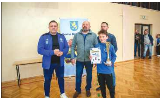
■ Młodzi piłkarze otrzymali puchary i dyplomy za najlepsze miejsca

W sobotę walczyły drużyny z rocznika 2014. W szranki stanęło 9 ekip. W tej