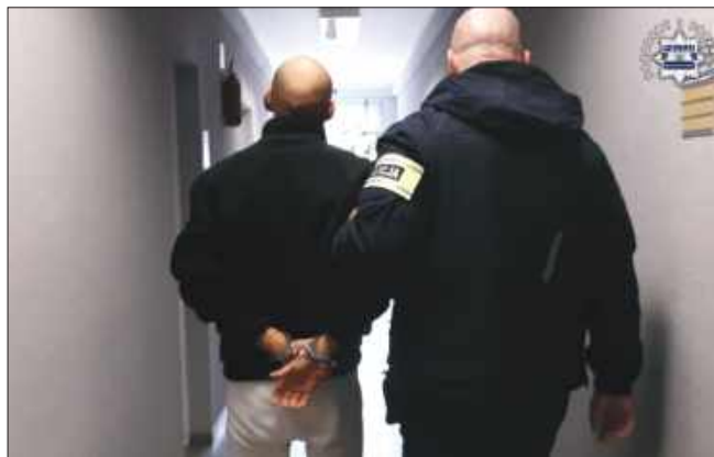
■ 29-latek kierował pojazdem pomimo orzeczonego sądowego zakazu prowadzenia.

Swoją serię rozpoczął w Skoczowie, gdzie około 13:10 wszedł do sklepu jubilerskiego przy ulicy Bielskiej. Tam poprosił sprzedawcę o zaprezentowanie naszyjników oraz pierścionków. Kiedy wskazana biżuteria znalazła się