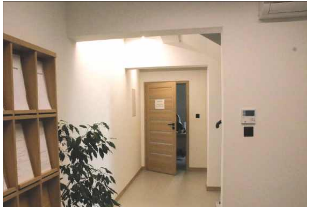
■ Jeden z serwerów OPS został zaszyfrowany przez hakerów, co mogło spowodować wyciek danych osobowych. Zdarzenie miało miejsce po przenosinach OPS do nowego lokum przy ul. Ks. Skwary w zrewitalizowanym budynku maszyny wyciągowej.

wnim danymi. Niezwłocznie po ujawnieniu tego faktu poinformowane zostały odpowiednie służby, czyli CSIRT – NASK (Krajowy Zespół Reagowania na Incydynty Bezpieczeństwa Komputerowego, prowadzony przez Naukową i Akademicką Sieć Komputerową – Państwowy Instytut Badawczy z siedzibą w Warszawie – red.) oraz Policja – Centralne Biuro Zwalczania Cyberprzestępczości. Prowadzimy dalsze działania według wytycznych tych służb. Nie pozostawiamy żadnego luzu i wszystkie nasze działania są z nimi konsultowane. Działamy w dwóch płaszczyznach: pewności i potencjalnego zagrożenia. To, co wiemy na pewno, to fakt zaszyfrowania serwera. Potencjalnym zagrożeniem jest możliwy wyciek danych, bo nie wiemy czy do niego doszło. W związku z tą procedurą powiadomiony został Urząd