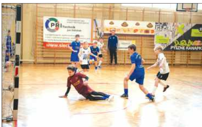
■ W turnieju udział wzięło prawie 280 zawodników

kategorii wiekowej najlepszy był zespół RAP Rybnik, przed KS Kokoszyce i Wichrem Wilchwy. Z Wichrem Polonia przegrała mecz o 3 lokatę po zażartej walce 2:3.