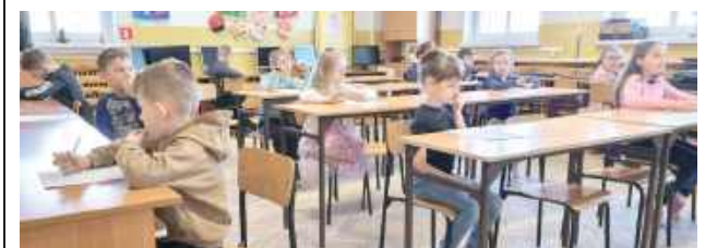
W konkursie uczestniczyły dzieciaki z klas I - III

W Szkole Podstawowej w Kamieniu w piątek, 21 marca uczniowie nie tylko hucznie powitali wiosnę, ale odebrali też nagrody za udział w bardzo ważnym konkursie.