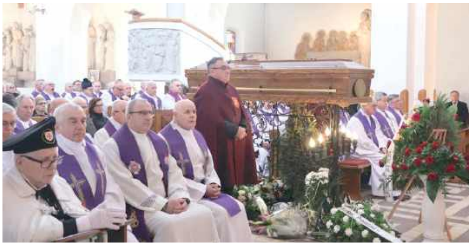
Podczas uroczystości pogrzebowych w parafii pw. Przemienienia Pańskiego w Wisznicach

Był wyjątkowym kapłanem z powołania. Przez 66 lat swojej posługi duchownego, w kilku miejscowościach jako proboszcz, przeprowadził gruntowne remonty kościołów, pomagał wielu ludziom, wykonanymi przez siebie różańcami obdarował dziesiątki księży i wiernych.