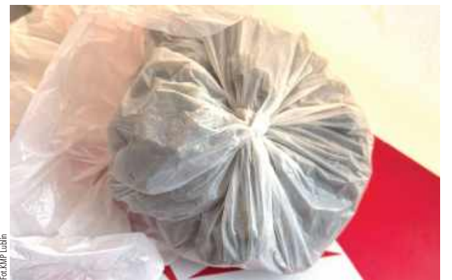
Policjanci sprawdzą też, czy nastolatka nie zajmowała się wprowadzeniem do obrotu narkotyków

- Podczas przeszukania w policjanci odnaleźli ponad 600 gramów narkotyków w postaci marihuany i mefedronu. Dodatkowo funkcjonariusze odnaleźli wagi elektroniczne oraz 25 litrów alkoholu bez akcyzy