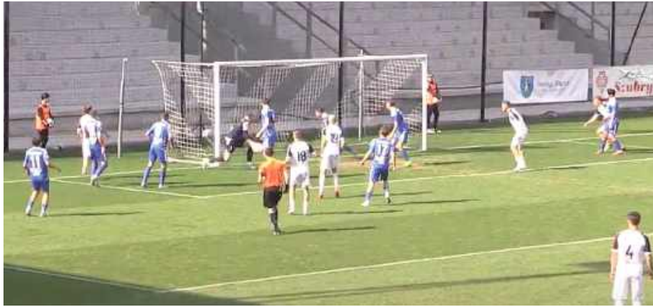
W taki sposób padł pierwszy gol w meczu z Sandecją. Lewart nie zdołał się podnieść

Nie było niespodzianki w Nowym Sączu. Lewart Lubartów przegrał z Sandecją 0:3. Mecz był jednostronnym widowiskiem, a sytuacja drużyny gości skomplikowała się jeszcze bardziej po dwóch czerwonych kartkach.