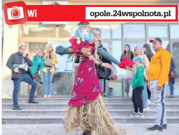
Marzanna gotowa do drogi...

Topienie Marzanny to jeden z najstarszych i najbardziej charakterystycznych polskich zwyczajów, który przetrwał do dziś, choć w nieco zmienionej formie. Opolskie Centrum Kultury od kilku już lat kultywuje tę tradycję.