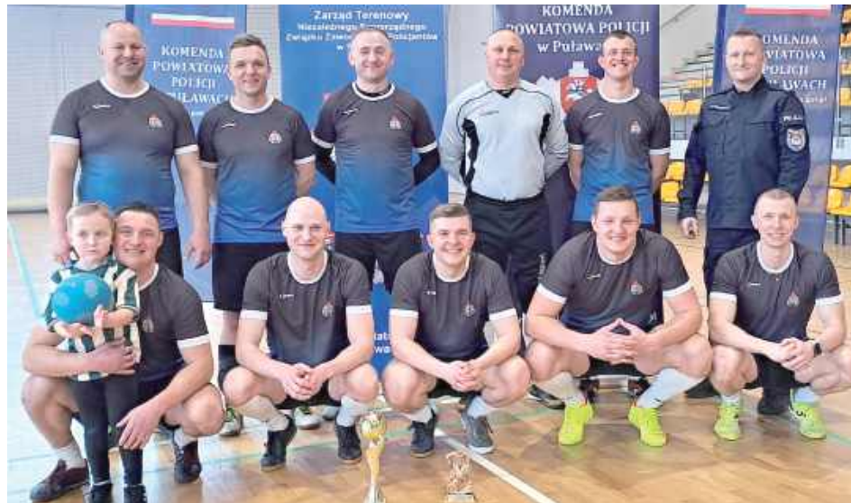
Turniej wygrała reprezentacja Komendy Powiatowej Państwowej Straży Pożarnej w Puławach

Osiem drużyn z całego województwa wzięło udział w II Halowym Turnieju Piłki Nożnej o Puchar Komendanta Powiatowego Policji w Puławach. Najlepsi okazali się reprezentanci miejscowej Komendy Powiatowej Państwowej Straży Pożarnej.