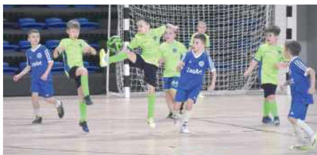
W turnieju zorganizowanym przez Akademię Piłkarską „Drużyna Marzeń” przystąpiło wiele drużyn z woj. lubelskiego