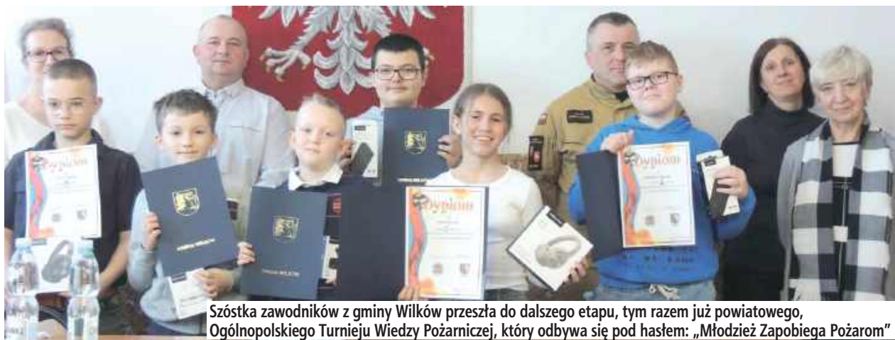
Szóstka zawodników z gminy Wilków przeszła do dalszego etapu, tym razem już powiatowego, Ogólnopolskiego Turnieju Wiedzy Pożarniczej, który odbywa się pod hasłem: „Młodzież Zapobiega Pożarom”

Szóstka uczestników będzie reprezentować gminę Wilków w powiecie.