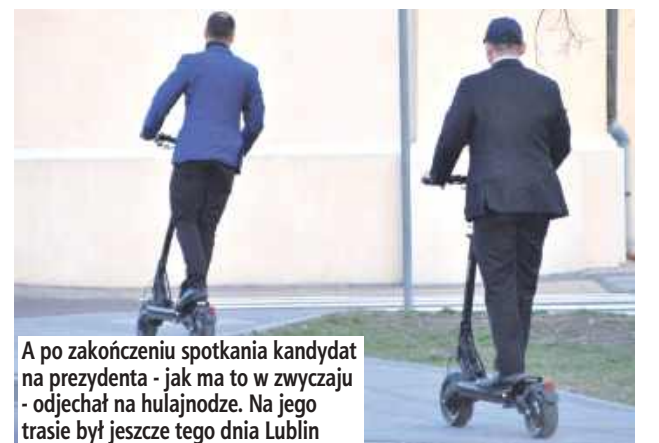
A po zakończeniu spotkania kandydat na prezydenta - jak ma to w zwyczaju - odjechał na hulajnodze. Na jego trasie był jeszcze tego dnia Lublin