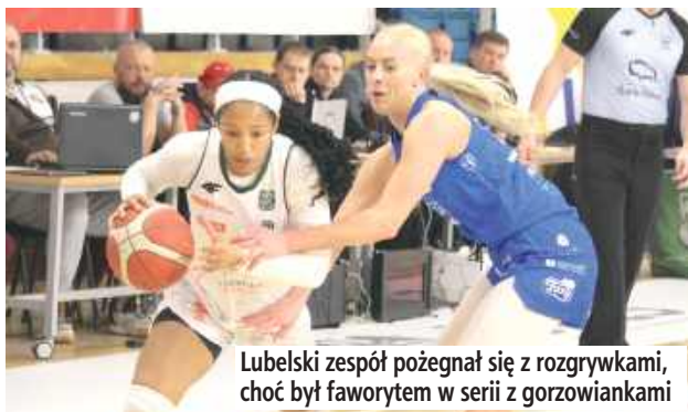
Lubelski zespół pożegnał się z rozgrywkami, choć był faworytem w serii z gorzowiankami

Po sezonie zasadniczym drużyna z Lublina zajmowała trzecie miejsce w tabeli, natomiast