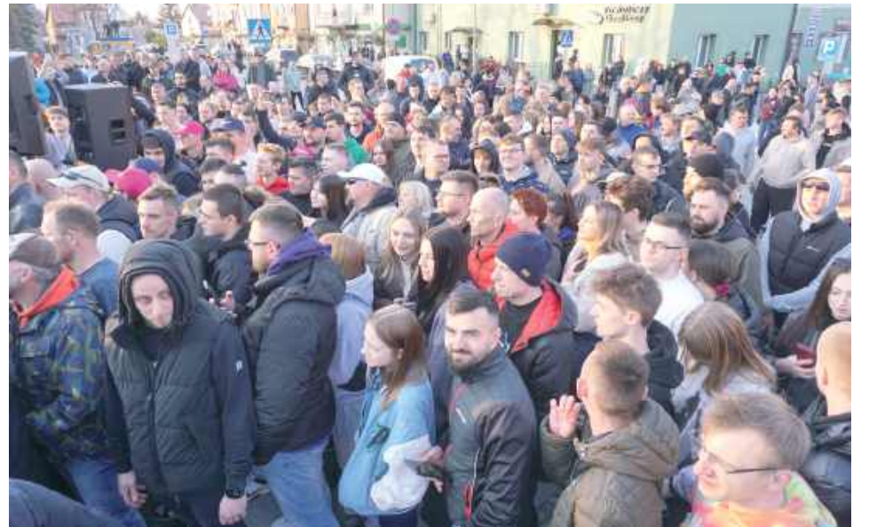
Plac Świętego Jana Pawła II zapelnili mieszkańcy powiatu opolskiego i nie tylko. I każdy chciał mieć zdjęcie z politykiem, a na to było tylko 20 minut...