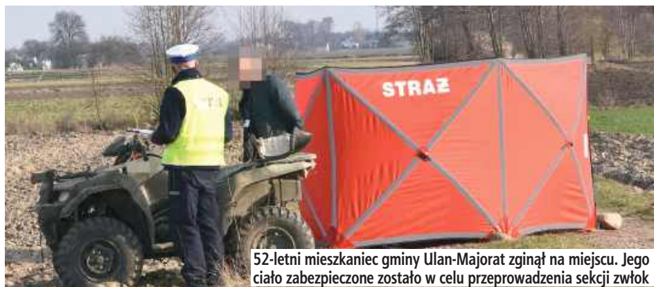
52-letni mieszkaniec gminy Ulan-Majorat zginął na miejscu. Jego ciało zabezpieczone zostało w celu przeprowadzenia sekcji zwłok

- Ze wstępnych ustaleń radzyńskich policjantów wynika, że kierujący quadem marki Suzuki na drodze gruntowej z nieznanymi jak dotąd przyczynami stracił panowanie