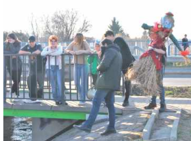
... i wpadła do rzeki!

Do Opola Lubelskiego kilka lat temu zwyczaj topienia Marzanny powrócił dzięki Opolskiemu Centrum Kultury. Kolędy z zimową kukłą na czele