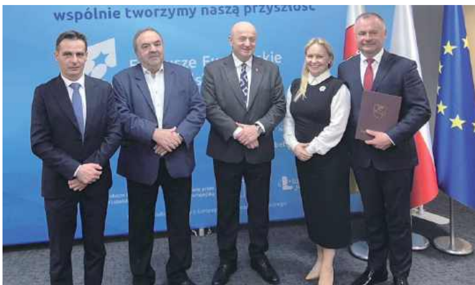
20 marca marszałek województwa lubelskiego Jarosław Stawiarski wręczył członkom Zarządu Powiatu w Opolu Lubelskim umowę o dofinansowanie na realizację projektu „Dostępność usług społecznych w Chodlu”. Opiewa ona na prawie 5,7 mln zł

Jak podkreślają władze powiatu to ważna dla wszystkich inwestycja.