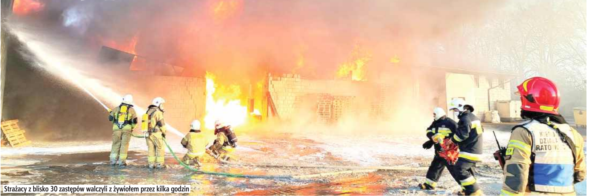
Strażacy z blisko 30 zastępów walczyli z żywiołem przez kilka godzin