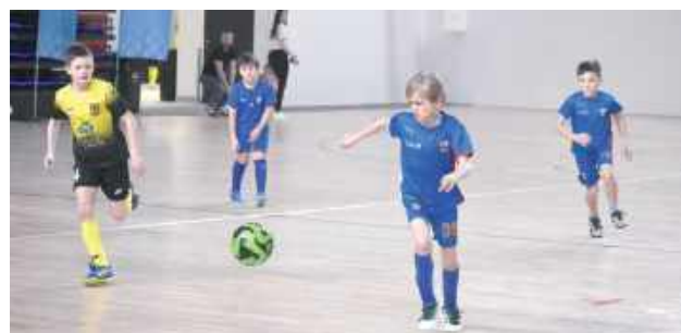
Młodzi piłkarze pokazali, że mają ogromny talent, który może przynieść im sukcesy

W nowej hali widowiskowo-sportowej przy ul. Lubelskiej w Puławach odbył się turniej piłkarski, który zgromadził wiele drużyn oraz zawodników z kilku roczników.