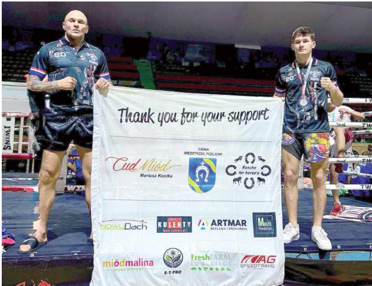
Przedstawiciele Red Lion Club z Międzyrzeca dziękują partnerom, którzy wsparli wyjazd na Mistrzostwa Świata

Mistrzostwa Świata W.M.F. to jedno z najważniejszych wydarzeń w świecie tajskiego boks, który ma swoje korzenie właśnie w Tajlandii. Polską reprezentację