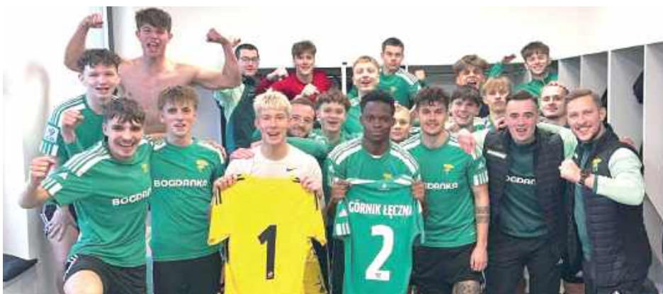
Łącznienie wywieźli trzy punkty z boiska w Opolu Lubelskim

- Cieszymy się z trzech punktów. Tydzień temu musieliśmy