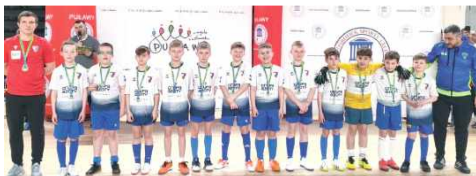
Na każdego zawodnika czekał medal

Organizatorem wydarzenia była Akademia Piłkarska „Drużyna Marzeń”. Do rywalizacji przystąpiły drużyny z roczników 2014, 2016, 2017 i 2018, które były podzielone na dwie kategorie. Pojawiły się grupy