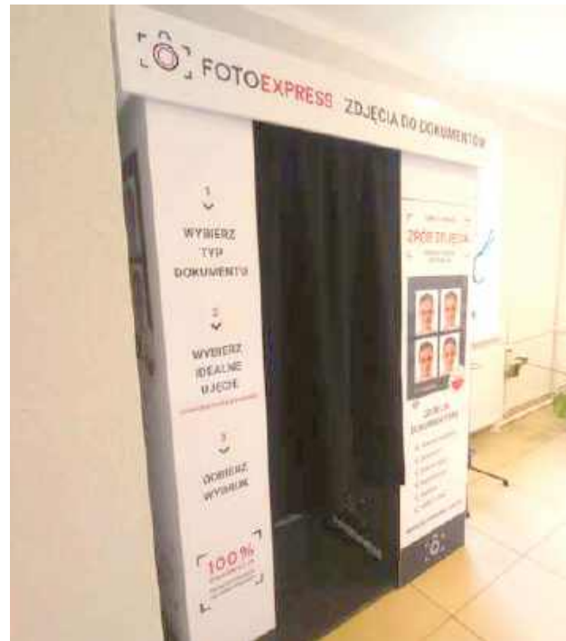
W fotobudce zrobimy zdjęcia do dokumentów bez konieczności wyjazdu do fotografa