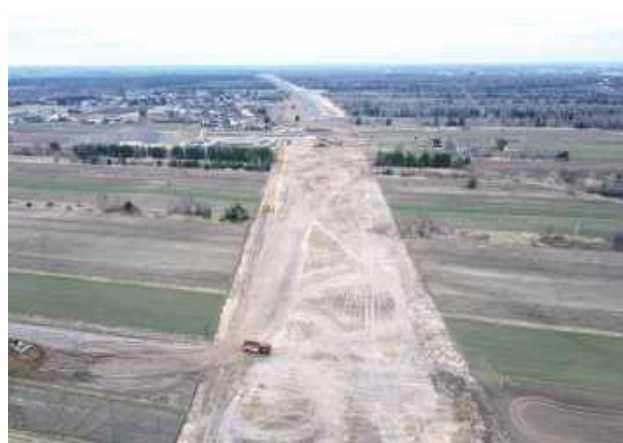
Budowa S19 Lubartów - Lublin. Marzec 2025 r.

W ramach inwestycji zostanie wybudowany 23-kilometrowy