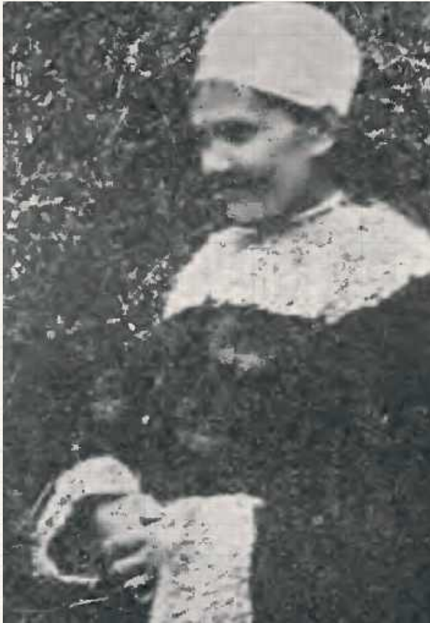
Kobieta z okolic Lubartowa w jupie. Był to kozuch barani pokryty granatowym sukmem. Kołnier i podłapki z białego lub siwego baranka. Na pazuchach i koło kieszeni szmuklerskie ozdoby kolorowe. Plecy przybrane w formie łuków, spódnica jupy mocno namarszczona. Na głowie zaś widzimy nakrycie typu „czub” z towarzyszącym mu uczesaniem

3. Brzeg wąski, okrągły, z czarnego baranka, wierzch