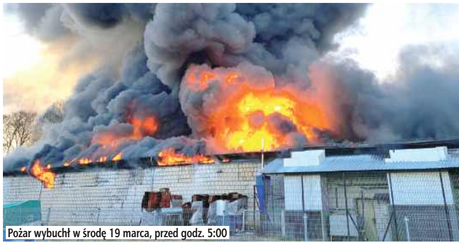
Pożar wybuchł w środę 19 marca, przed godz. 5:00

Blisko 110 strażaków i 26 zastępów PSP i OSP walczyło z pożarem, który 19 marca nad ranem wybuchł w zakładzie przetwórstwa parafiny DW OIL w Maniach w gminie Międzyrzec Podlaski. Ogień pojawił się tuż przed godziną 5:00 w hali magazynowej wypełnionej parafiną wykorzystywaną do produkcji zniszczonej.