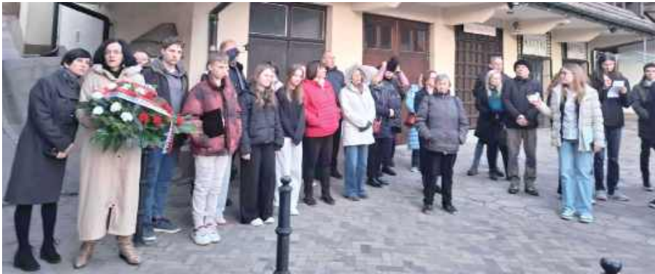
W wydarzeniu uczestniczyli przedstawiciele lokalnych władz, mieszkańcy, zaproszeni goście i uczniowie z Kazimierza Dolnego

KAZIMIERZ DOLNY: Przez setki lat Żydzi stanowili ponad połowę społeczności Kazimierza Dolnego. Tworzyli piękną, wielokulturową wspólnotę, aż przyszedł marzec 1942 roku... Mieszkańcy miasteczka pamiętają o tragedii swoich sąsiadów.