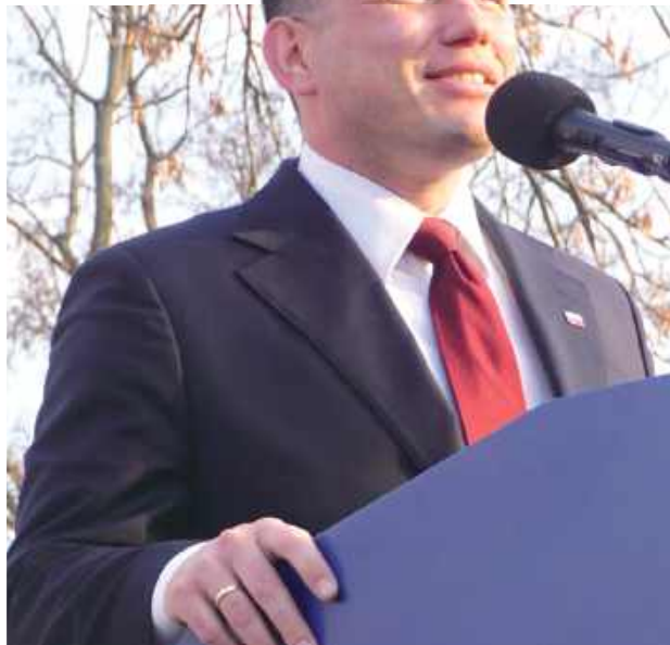
Sławomir Mentzen (Konfederacja) w sobotę, 22 marca odwiedził Opole Lubelskie

- Wszyscy doskonale wiemy, po co tu jesteśmy. To pierwszy taki duży wiec polityczny z udziałem ludzi tak młodych