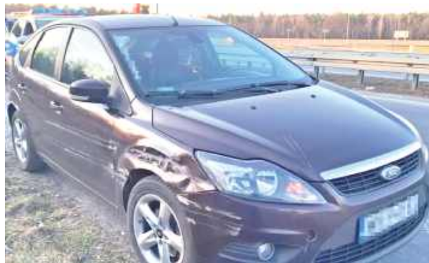
Kierowca forda jechał ekspresówką mając niemal 3 promile alkoholu. Jego poczynania zauważył inny kierowca, zajechał mu drogę, czym doprowadził do zatrzymania pojazdu i zabrał mu kluczyki. Potem mieszkańcem Warszawy zajęła się już policja

Kolejny nietrzeźwy kierujący został zatrzymany w miniony czwartek (20 marca) w okolicy Żyrzyna (pow. puławski) dzięki obywatelskiej postawie innego podróżującego ekspresówką S17. Jadąc za osobowym fordem zauważył, że auto wyraźnie nie trzyma toru jazdy. Mając podejrzenie, że kierujący może być „na podwójnym gazie”, postanowił działać.