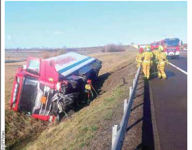
Kierowca Scani zjechał z drogi do rowu. Na szczęście nic mu się nie stało, doznał tylko niegroźnych potłuczeń

W poniedziałek rano (17 marca) na drodze ekspresowej S12 ciężarówka marki Scania wypadła z drogi. Interweniowały służby ratunkowe i policja. Na szczęście kierowca doznał tylko potłuczeń.