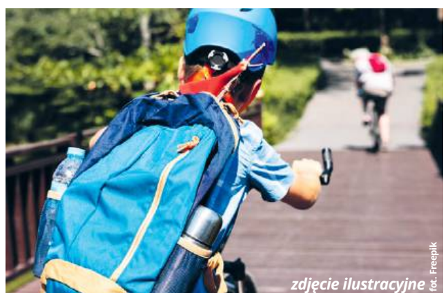
zdjęcie ilustracyjne

„Wzmógłony ruch pojazdów panuje na drodze w godzinach porannych i popołudniowych, kiedy dzieci idą i wracają ze szkoły. Niestety - wielu kierowców nie dostosowuje prędkości do obowiązującego ograniczenia na terenie zabudowanym, a także do warunków i sytuacji na