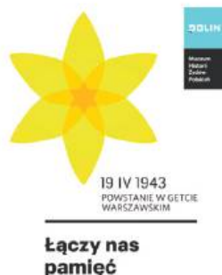
Łączy nas pamięć

Każdego roku, w rocznicę tych wydarzeń, Muzeum Historii Żydów Polskich POLIN organizuje akcję społeczno-edukacyjną Żonkile. Kwiaty