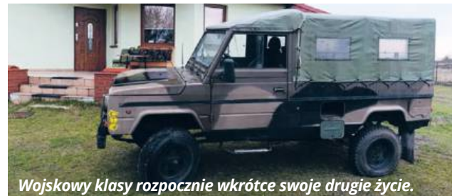
Wojskowy klasy rozpocznie wkrótce swoje drugie życie.

- Historię interesuję się od zawsze, od kiedy tylko pamiętam. I zawsze też miałem takie skryte marzenie, żeby zakupić jakiś wojskowy pojazd. Wybór padł najpierw na amerykańskiego willysa, ale po pewnym czasie pomyślałem, że byłby jednak