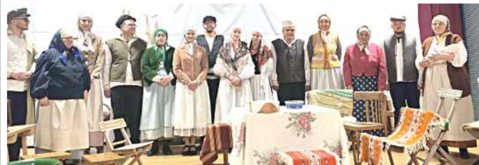
Grupa teatralna działająca przy GOK w Goraju

GORAJ: W niedzielę, 7 czerwca na deskach Gminnego Ośrodka Kultury w Goraju odbyła się premiera spektaklu „Swaty” w wykonaniu grupy teatralnej GOK.