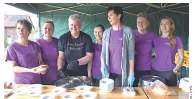
Stowarzyszenie „Babeczki” z gminy Tereszpol zadbało o posiłek do druhów