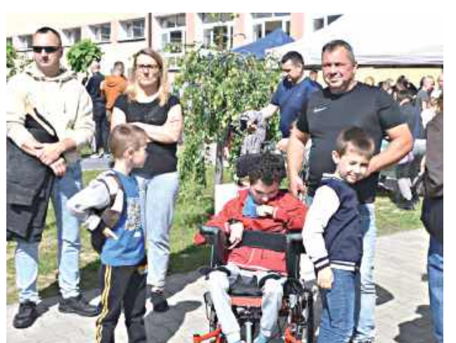
Tłumy odwiedziły szkolny plac Trójki, gdzie odbywała się impreza