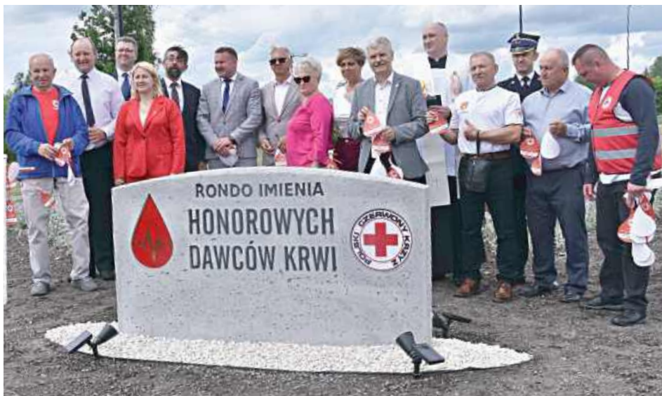
Na rondzie stanęła pamiątkowa tablica