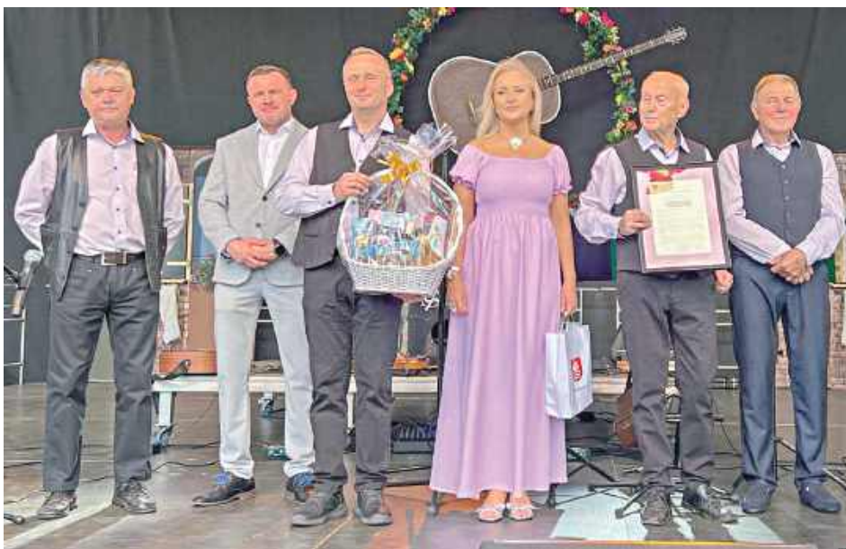
Kapela Wygibusy gra już 35 lat!