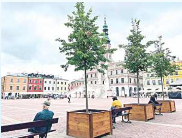
Sześć lip w wielkich donicach już stoi na Rynku Wielkim w Zamościu

– Kiedy planowaliśmy ustawienie tych pierwszych sześciu drzew w zeszłym roku, pytałem mieszkańców, jakie