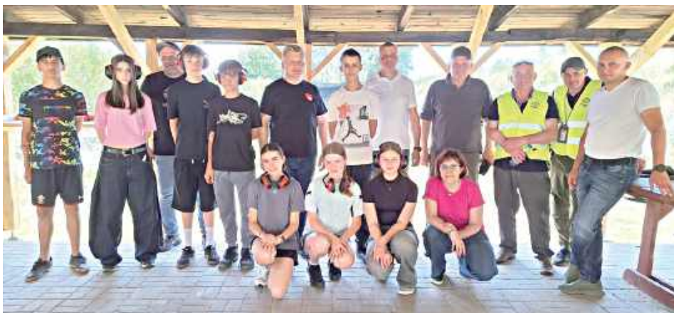
Młodzież ćwiczyła umiejętności strzeleckie

gm. Biszcza: Na Gminnej Strzelnicy w Biszczy uczniowie klas ósmych z lokalnych szkół spróbowali swoich sił w strzelectwie sportowym. Zajęcia stały się okazją nie tylko do nauki zasad bezpieczeństwa i podstaw obsługi sprzętu, ale też do sprawdzenia koncentracji, odpowiedzialności i pracy pod presją w zupełnie nowych warunkach.