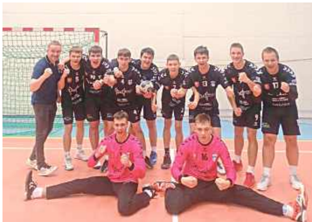
MKS Biłgoraj ma na kim opierać przyszłość piłki ręcznej

- To rezultat wielu miesięcy intensywnych treningów, zaangażowania i konsekwentnej pracy całego zespołu. Nasi