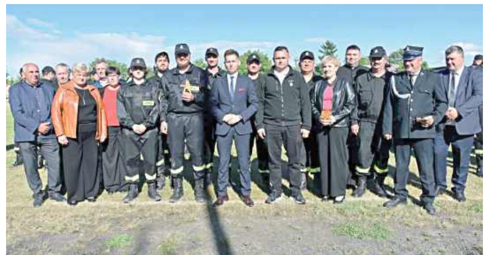
Organizatorem tegorocznych zawodów strażackich był Turobin