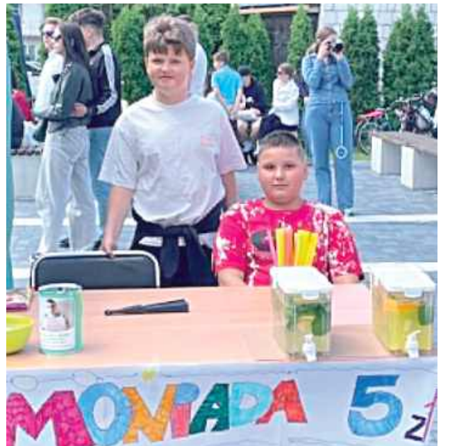
Koleżki Adasia sprzedawały lemoniadę