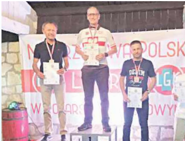
Lekarz z Nielisza na najwyższym stopniu podium na mistrzostwach Polski rozegranych w Bychawie

22 Mistrzostwa Polski Lekarzy w Kolarstwie Szosowym odbyły się w Bychawie. Lekarz z Nielisza po pięciu startach w zawodach rangi ogólnopolskiej wreszcie sięgnął po zwycięstwo w swojej kategorii wiekowej (55-65 lat).