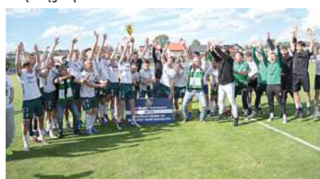
Absolutnie zasłużona wielka radość w Łukowej. Gratulacje!

na pożegnanie sezonu pojechał do podzamkowej Zawady, na mecz z Gryfem Gmina Zamość. Rozpędzeni gospodarze pewnie wygrali 5:1 i rzutem na taśmę kończą rozgrywki tuż za po-