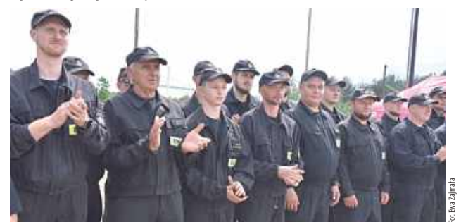
W zmaganiach wzięło udział blisko 300 strażaków