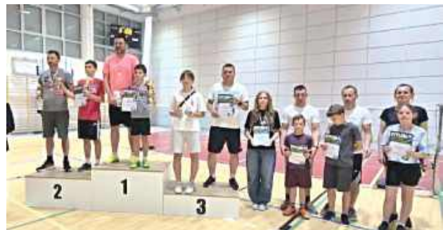
Rodzinny Turniej Badmintonu o Puchar Wójta Gminy Potok Górny zgromadził uczestników, którzy przez ponad pięć godzin rywalizowali w kilku kategoriach wiekowych i turniejowych

Ponad pięć godzin sportowych zmagani, wiele emocji i atmosfera pełna wzajemnego dopingowania – tak wyglądał Rodzinny Turniej Badmintonu o Puchar Wójta Gminy Potok Górny. W wydarzeniu udział wzięli mieszkańcy w różnym wieku, a rywalizacja na kortach połączyła sportowe ambicje z rodzinną integracją.