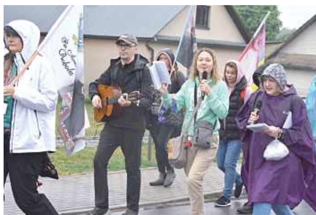
Pogoda nie odstraszyła pątników. Szli do Radecknicy ze śpiewem na ustach i modlitwą w sercu

GM. TERESZPOL: W piątek, 12 czerwca, wczesnym rankiem pielgrzymi z parafii pw. Matki Bożej Częstochowskiej w Tereszpolu-Zaorendzie wyruszyli na pieszą pielgrzymkę do Sanktuarium św. Antoniego w Radecknicy. Do pokonania mieli trasę liczącą 27 kilometrów.