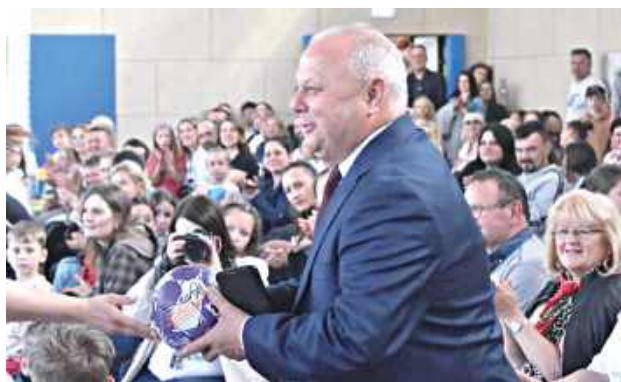
Dyrektor szkoły wylicytował piłkę za niemałe pieniądze