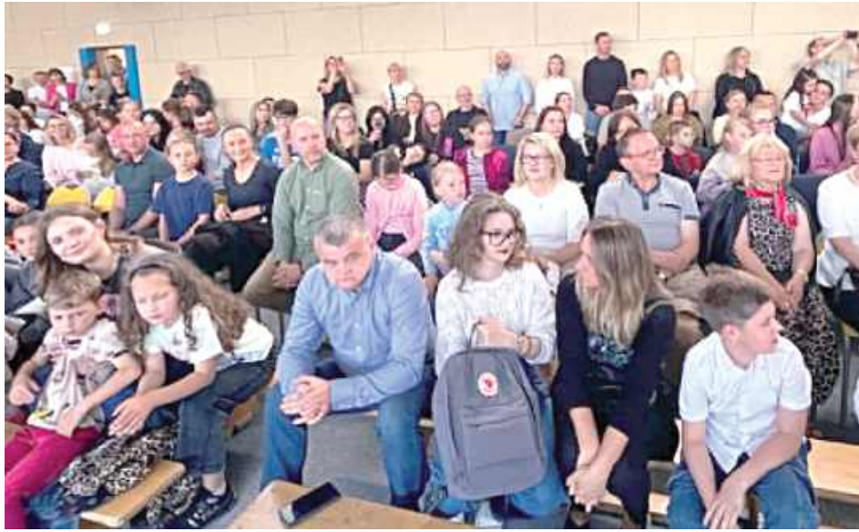
Społeczność „Trójki” i przybyli goście pokazali ogromne serca

Następnego dnia chłopiec z rodzicami miał zaplanowany lot do Dubaju na badania związane z dalszym leczeniem. To kolejny ważny etap w walce z dystrofią mięśniową Duchenne'a i jednocześnie moment, z którym rodzina wiąże ogromne nadzieje. Na koncie zbiórki znajduje się już około 6,5 mln zł. To wciąż mniej niż potrzeba do sfinansowania terapii, jednak, jak podkreślają bliscy, pojawiło się ogromne światło w tunelu i realna nadzieja, że uda się doprowadzić tę walkę do szczęśliwego finału.