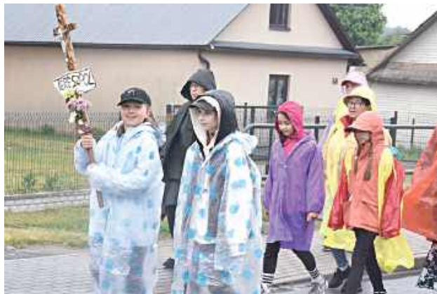
Do św. Antoniego pielgrzymowali również najmłodsi