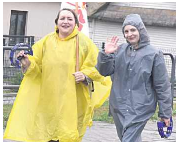
Pielgrzymi pokonali 27 km