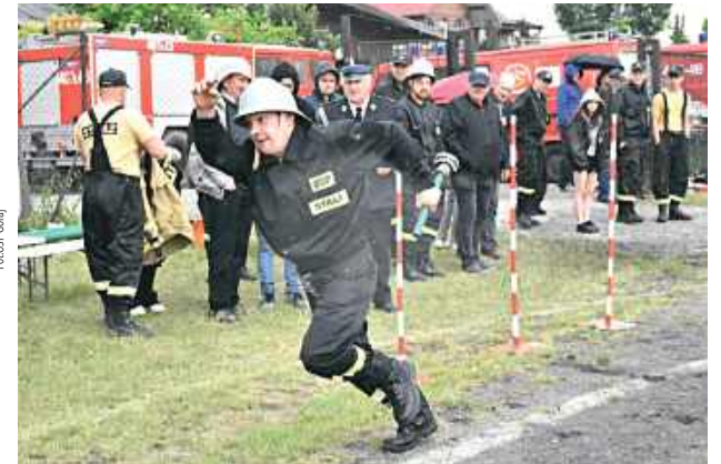
W Turobinie rywalizowali strażacy z trzech gmin