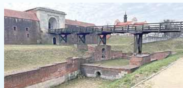
Przebudowa drewnianego mostu przy Nowej Bramie Lubelskiej potrwa pół roku

Firma spod Krasnobrodu, jedna z pięciu, które przystąpiły do przetargu, zajmie się przebudową drewnianego mostu przy Nowej Bramie Lubelskiej. Umowa zostanie podpisana niebawem, a wykonawca będzie miał wywiązać się ze zlecenia w ciągu sześciu miesięcy.