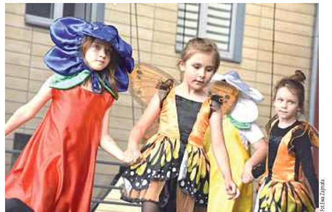
Najmłodszy artyści rozpoczęli koncert