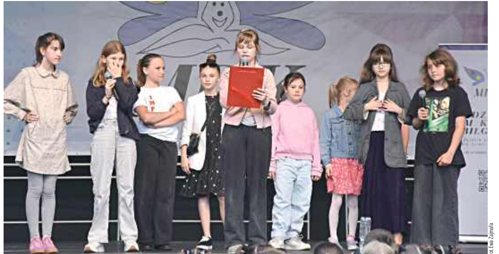
Grupa Teatralna Ambaras zaprezentowała krótkie scenki teatralne

Nie zabrakło także elementów folklorystycznych. Zespół Tańca Ludowego Sitareczka zaprezentował tradycyjne układy taneczne, przypominając o bogactwie polskiej kultury ludowej. Uzupełnieniem tej części był występ Grupy Folklorystycznej Pokolenia, działającej przy Biłgorajskim Centrum Kultury. Muzyczną stronę wydarzenia wzbogacili wokaliści Studia Wokalnego Canto, któ-