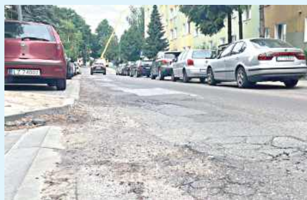
Na pięciu zamojskich ulicach ma zniknąć taki smutny widok dla kierowców

Asfaltowe łaty pojawiają się na pięciu popularnych ulicach Zamościa. Zarząd Dróg Grodzkich wybrał już firmy, które zajmą się naprawą nawierzchni m.in. na ul. Królowej Jadwigi i drodze za Hetmanem. Dzięki dużej konkurencji w przetargu miasto zaoszczędzi blisko 100 tysięcy złotych, które zostaną przeznaczone na kolejne naprawy.