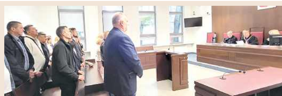
Sala rozpraw była w czwartek wypełniona do ostatniego miejsca. W sądzie stawili się bowiem zwolennicy burmistrza w sile około 20 osób. Wniosek o możliwość uczestnictwa w procesie zgłosiły cztery organizacje, w tym dwie ochotnicze straże pożarne. Dwie z tych organizacji dostały zgodę sądu i zabrały głos

Dostarczono listę podpisów mieszkańców, którzy podpisali się