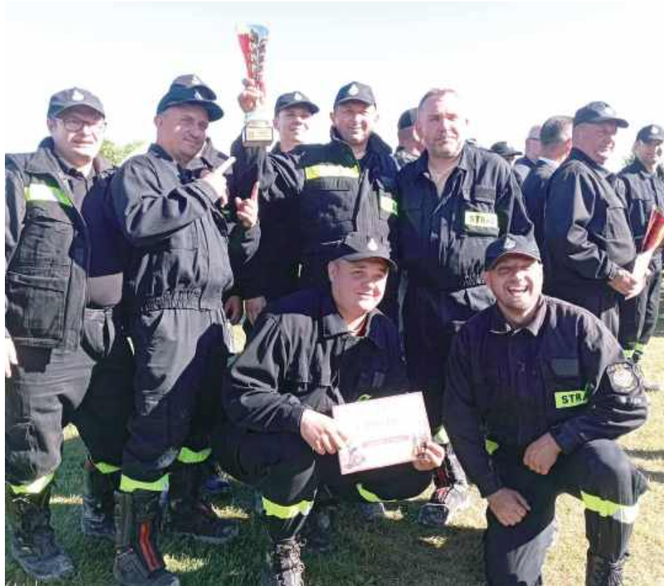
Najlepsza w gminie Goraj okazała się jednostka OSP Goraj