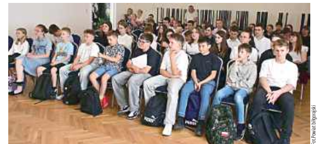
Do rywalizacji przystąpiło 60 uczniów

Łukowa: We wtorek, 9 czerwca, Gminny Ośrodek Kultury w Łukowej stał się centrum wiedzy historycznej regionu. Odbyła się tam XXVIII edycja Powiatowego Konkursu o Armii Krajowej i Batalionach Chłopskich na Ziemi Biłgorajskiej.