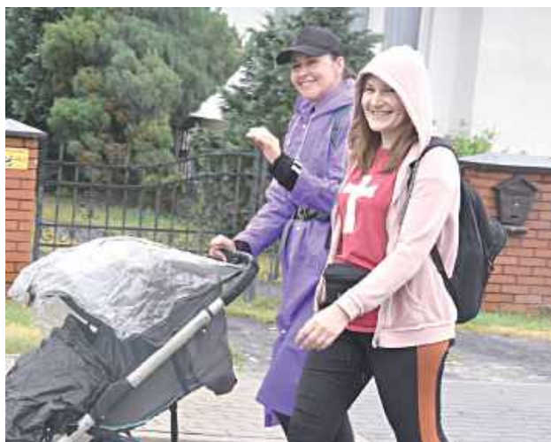
Uśmiech towarzyszył pielgrzymom na każdym kroku