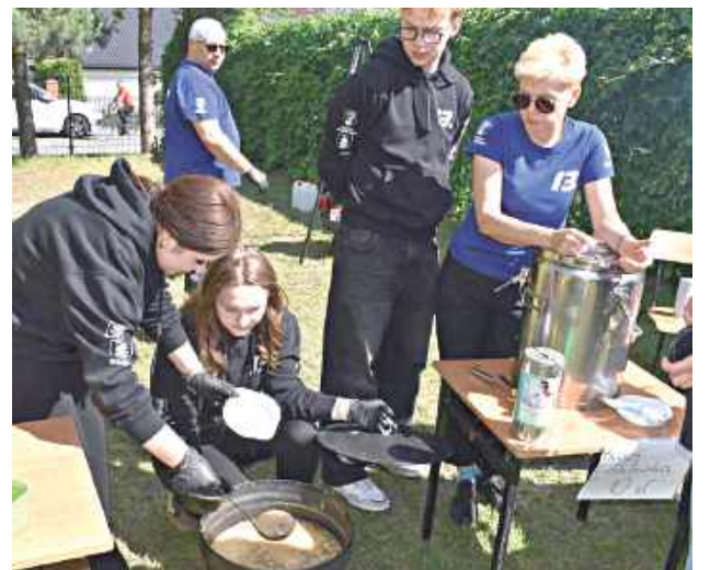
Harczerze przygotowali pyszną grochówkę