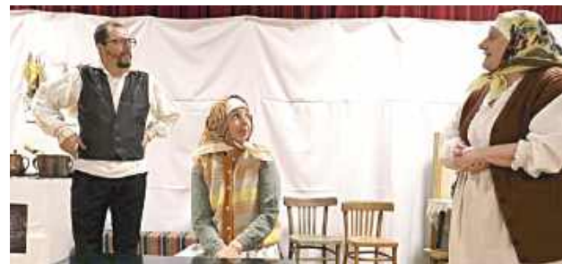
„Swaty” łączyły humor, tradycję i autentyczność ludowego przekazu