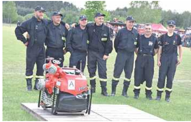
Druhowie walczyli o awans do zawodów powiatowych