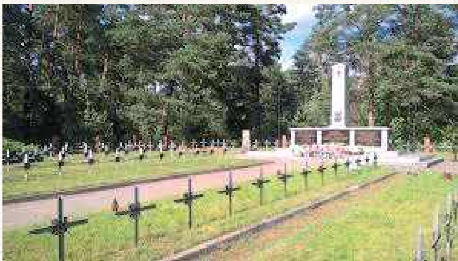
Największy partyzancki cmentarz w Europie znajduje się w Osuchach