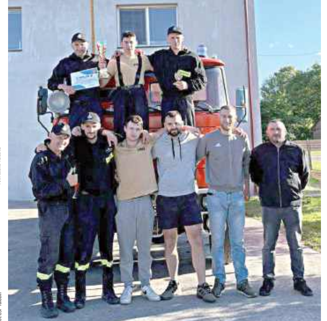
Dla OSP Gródkki z gminy Turobin było to piąte zwycięstwo z rzędu!