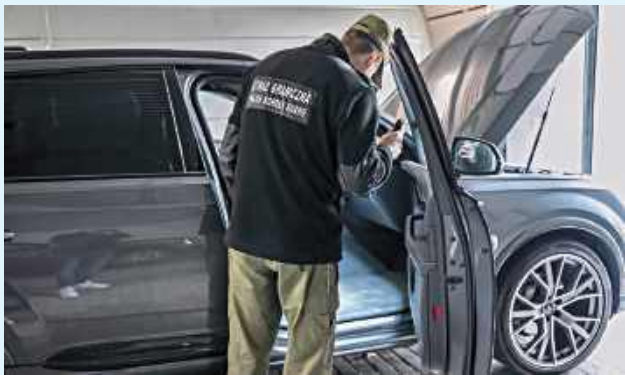
Funkcjonariusze zabezpieczyli gotówkę w wysokości ponad 32 tys. złotych oraz 2450 euro, a także pojazdy o łącznej wartości około 773 tys. złotych

– Śledztwo prowadzone przez funkcjonariuszy z Nadbużańskiego Oddziału Straży Granicznej wykazało, że w skład