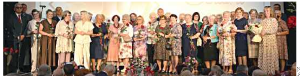
Pamiątkowe zdjęcie podczas jubileuszu

Tarnogród: W poniedziałek 8 czerwca w Tarnogrodzkim Ośrodku Kultury odbyła się niezwykła uroczystość, która na długo pozostanie w pamięci uczestników. Tarnogrodzki Klub Seniora świętował swoje Złote Gody, gromadząc licznych gości i przyjaciół.