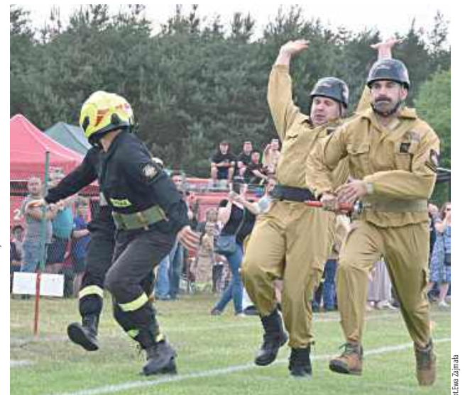
Rywalizacja była zacięta