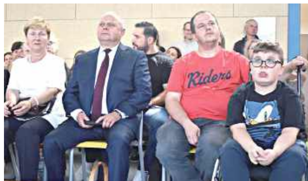
Adaś, jego tata, dyrekcja szkoły i tłumy mieszkańców wzięły udział w charytatywnym festynie