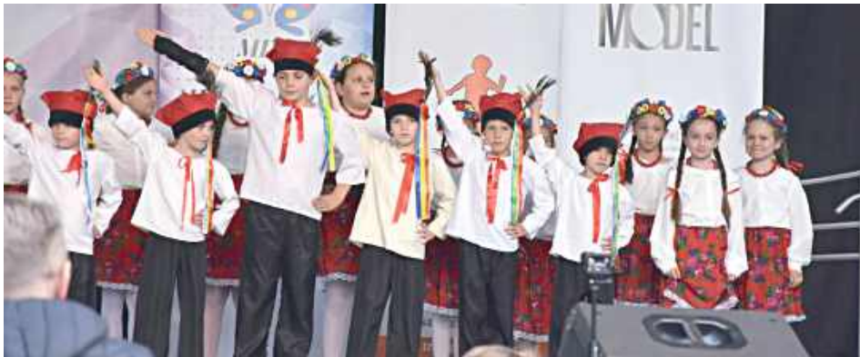
Sitareczka przeniosła w klimat muzyki ludowej

W środę 10 czerwca na scenie letniej Biłgorajskiego Centrum Kultury odbył się koncert pod nazwą „Kalejdoskop rytmu, słowa i tradycji”. Wydarzenie przyciągnęło licznych mieszkańców oraz gości, oferując barwną i różnorodną podróż przez świat tańca, muzyki i teatru.