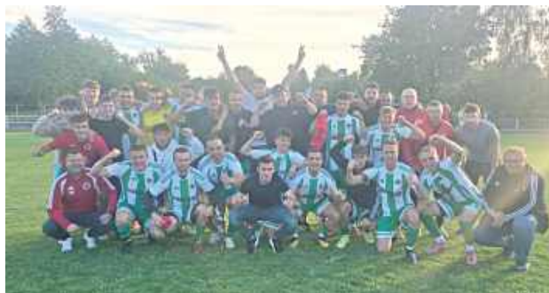
Olimpiakos Tarnogród może odetchnąć po ostatnim meczu. Pewna wygrana w Hrubieszowie zapewniła utrzymanie w klasie okręgowej

W skrajnie różnych nastrojach kończy się sezon w piłkarskiej klasie okręgowej. Już wcześniej awans do IV ligi zapewniła sobie Victoria Łukowa. Po ostatniej kolejce wyjaśniło się, że ligowy status zachował Olimpiakos Tarnogród, a bliski degradacji do A klasy jest Grom Różaniec.