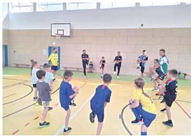
Przy biłgorajskim klubie przez cały czas działa też Akademia Mini Szcypiorniaka

Juniorzy młodszy zakończyli rozgrywki na 5. miejscu w lidze, a warto podkreślić, że był to ich pierwszy sezon w tej kategorii wiekowej oraz