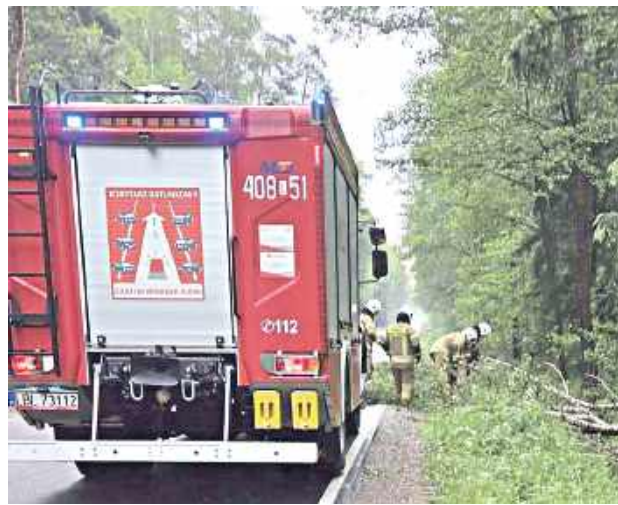
Silny wiatr przewrócił drzewo, które zablokowało przejazd drogą

Pierwsza interwencja, tuż po 21, miała miejsce w Tokarach. Silny wiatr przewrócił drzewo, które zablokowało przejazd drogą. Na miejsce skierowano dwa zastępy Ochotniczej Straży Pożarnej, które