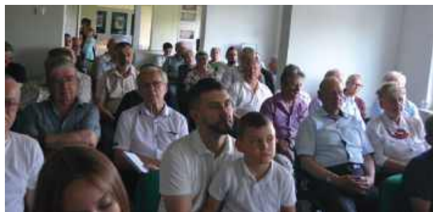
Na tym spotkaniu pojawili się przyjaciele, członkowie rodziny oraz wielbicieli muzyki ludowej sławnego muzyka