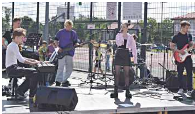
Na scenie wystąpili lokalni artyści