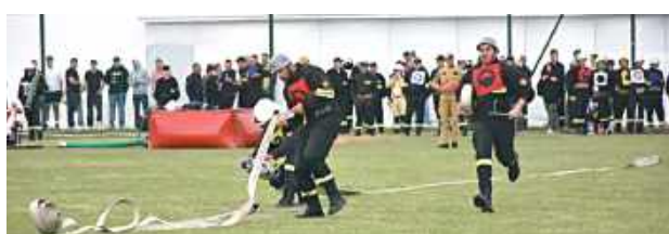
To była zacięta rywalizacja