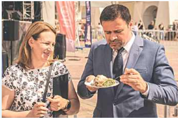
Przysmaków z Roztocza osobiście próbowali i oceniali m.in. prezydent Zamościa

w Polanach Chłód hetmański – KGW w Wielączy Rabarbar pod pierzynką – KGW w Szopiniku