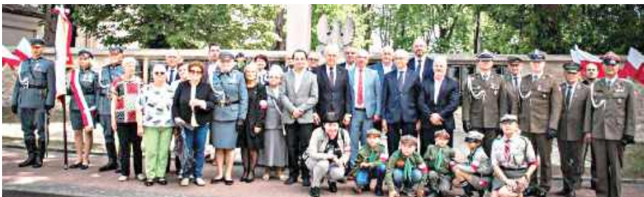
Mieszkańcy Józefowa pamiętają o tragicznej historii

W wyniku zwycięskiej akcji przez ponad trzy tygodnie w mieście nie było przedstawicieli władz okupacyjnych. Wydarzenie to przeszło do historii