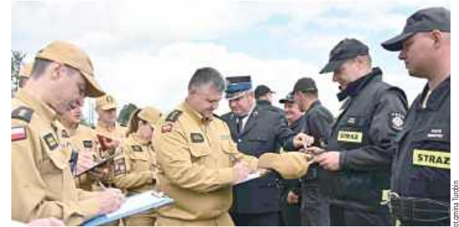
Zawody były okazją nie tylko do sprawdzenia poziomu wyszkolenia jednostek, ale również do integracji środowiska strażackiego i mieszkańców