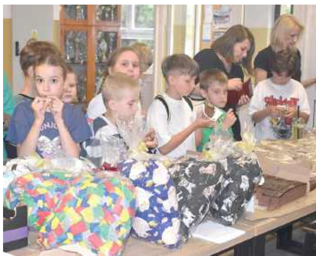
Wydarzeniu towarzyszył charytatywny kiermasz słodkości