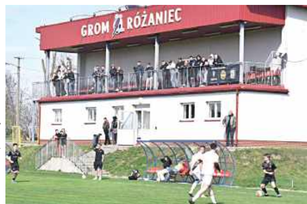
Kibice w Różańcu na przynajmniej jeden sezon żegnają się z piłkarską klasą okręgową

Ostatni zespół z powiatu biłgorajskiego - Błękitni Obsza,