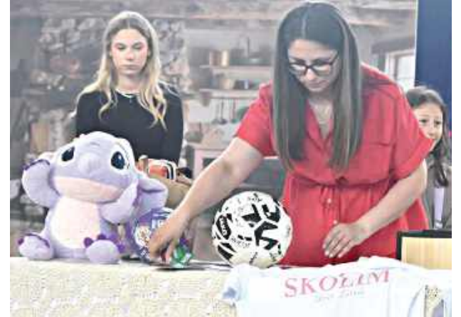
Przygotowane licytacje cieszyły się ogromnym zainteresowaniem