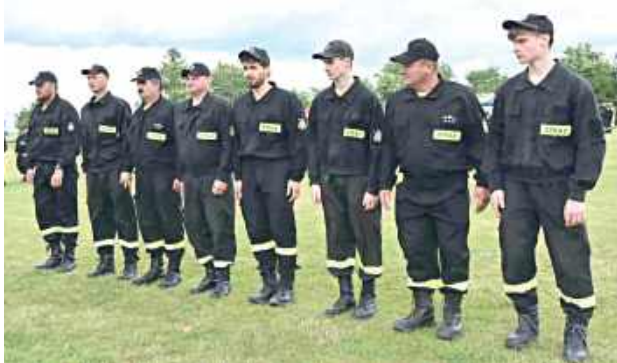
Zawody OSP w Turobinie