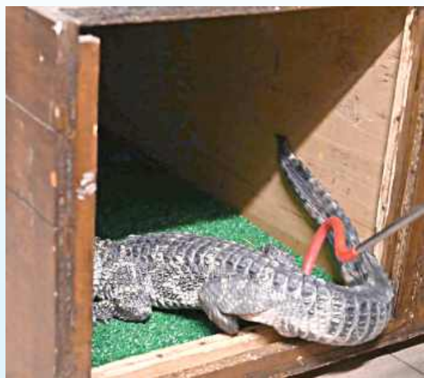
Spółeczność II LO w Zamościu objęła właśnie patronatem dwa unikalne aligatory chińskie

Uczniowie II Liceum Ogólnokształcącego im. Marii Konopnickiej w Zamościu potrafią zaskoczyć. Szkolna społeczność objęła właśnie honorowy patronat nad nowymi mieszkańkami zamojskiego ZOO. To siostry Bara i Monty, czyli dwa aligatory chińskie.