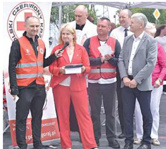
Podczas wydarzenia wielokrotnie podkreślano, że krwiodawcy to cisi bohaterowie

W marcu br. radni Rady Miasta Biłgoraja podjęli jednogłośnie decyzję o nadaniu rondy przy skrzyżowaniu Alei Jana Pawła II z obwodnicą północną nazwy Rondo Honorowych Dawców Krwi PCK.