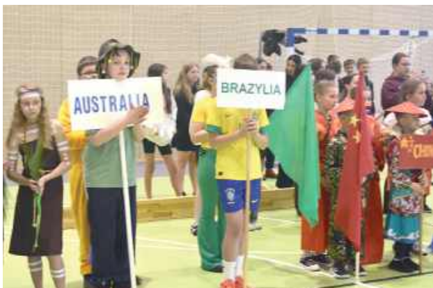
Na obiektach Szkoły Podstawowej nr 1 im. bł. ks. prymasa Stefana Kardynała Wyszyńskiego w Biłgoraju odbyła się już 31. edycja Szkolnych Igrzysk Sportowych