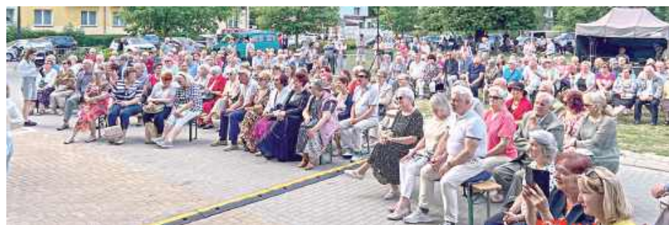
Nie zawiodła publiczność, która jak zwykle chętnie przychodzi na koncerty

W niedzielne popołudnie, 7 czerwca, na scenie letniej Biłgorajskiego Centrum Kultury jubileusz 35-lecia świętowała Biłgorajska Kapela Podwórkowa Wygibusy.