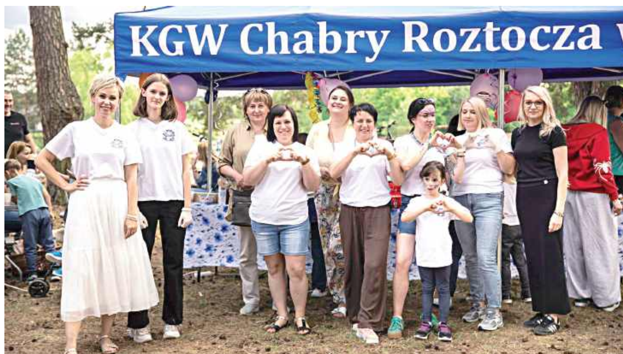
W sobotę, 6 czerwca, Borowina tętniła życiem za sprawą wydarzenia Chabry Dzieciom zorganizowanego przez KGW Chabry Roztocza

Już od pierwszych godzin było jasne, że organizatorzy zadbali o każdy szczegół. Dużym zainteresowaniem cieszyły