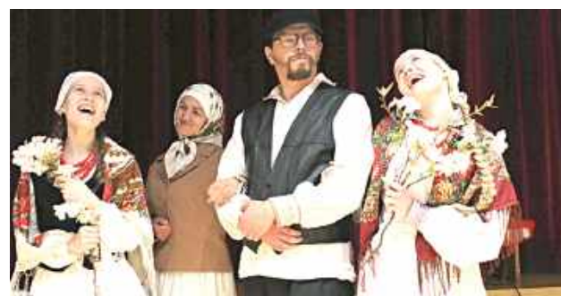
Widowisko przeniosło widzów w klimat dawnej wsi