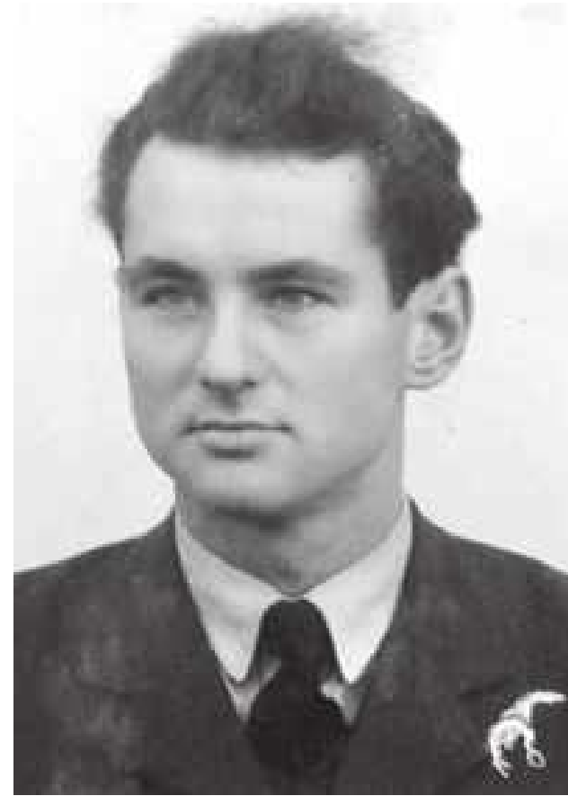
Stefan Knapp – biłgorajczyk, więzień syberyjskiego obozu pracy, żołnierz, lotnik, artysta malarz, rzeźbiarz, emalier, niezwykle wrażliwy człowiek. Uznawany za największego oryginała w dziejach polskiej sztuki. Zasłynął w świecie dzięki ogromnym rozmiarom niezwyklej, emalowanymi realizacjom na fasadach budynków

W tym tygodniu radni miejscy podejmą decyzję, czy ustanowić w Biłgoraju Rok Stefana Knappa. Miałby on trwać od lipca 2026 roku do lipca 2027 roku. Patronem byłby urodzony w Biłgoraju wybitny polski artysta – malarz i rzeźbiarz, którego dorobek stanowi niezwykle ważną część polskiego i światowego dziedzictwa kulturowego.