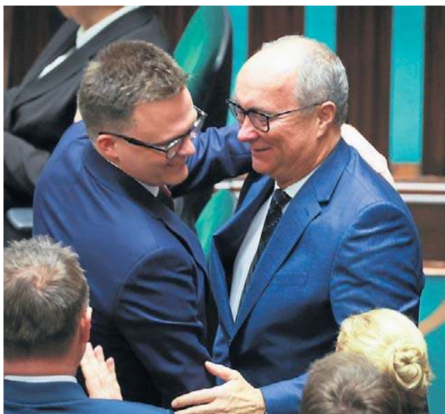
Zmianę marszałka Sejmu w połowie kadencji zapisano w umowie koalicyjnej KO, Polski 2050 i Lewicy

Dyscypliny w tej sprawie nie przewiduje też przewodniczący klubu Polska 2050 Paweł Śliz. Jak podkreślił, „umów należy dotrzymywać”. - Czy głosując, będę się cieszył? Nie do końca, bo ja uważam, że marszałek Hołownia wprowadził zupełnie nową jakość pracy tego Sejmu. Nie tylko pod względem otwarcia na obywatela, nie tylko pod względem liczby ludzi, któ-