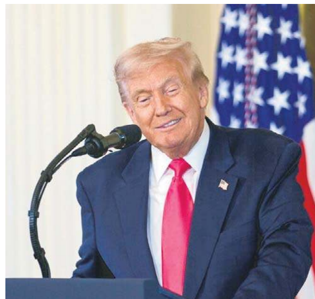
Donald Trump od kilku tygodni grozi władzom Wenezueli

Doradcy Trumpa zwrócili się już do Ministerstwa Sprawiedliwości o dodatkowe wskazówki: jak obejść długoterminie amerykańskie zakazy prawne dotyczące fizycznej likwidacji zagranicznych przy-