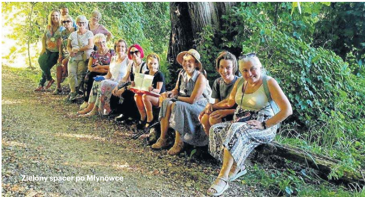
Zielony spacer po Młynówce

Z czasem projekt zaczął się rozrastać. Do ekowędrówek dołączyły „zielone spacerki” po Krakowie, realizowane we współpracy z Krakowskim Centrum Edukacji Klimatycznej. To propozycje, które pokazują miasto z zupełnie innej perspektywy - ekologicznej i uważnej.