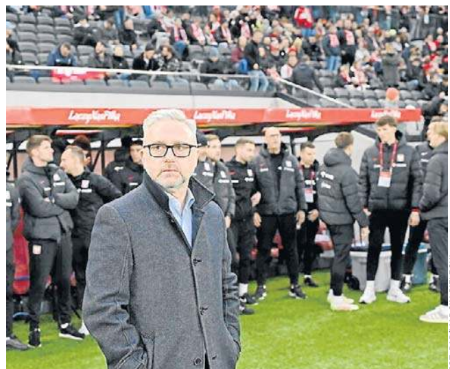
Jerzy Brzęczek „zdążył” już w eliminacjach MME zagrać i wygrać pięć meczów, tracąc raptem jedną bramkę...

- To bolesny wynik, bo szczerze mówiąc, nie sądziłem, że przegramy. Graliśmy dobrze, mając szansę na podwyższenie prowadzenia. Musimy pogodzić się z wynikiem, a chłopaki i tak zagrali dobrze - stwierdził kontrowersyjny szkoleniowiec rywali, który namawia swoich zawodników do trenowania... z opaską na jednym oku, zakazując im jednocześnie korzystania ze „smartfonów”. ©©