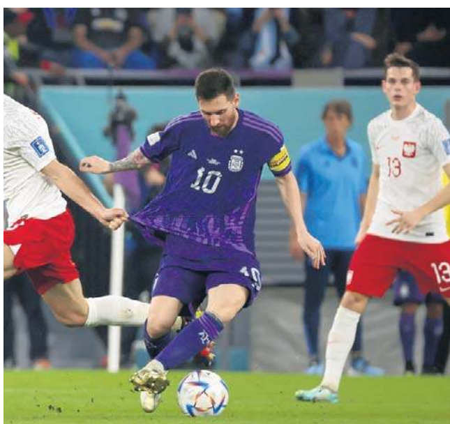
Dla tego giganta futbolu będzie to już szósty mundial w karierze... Leo Messi wywołał w Angoli szaleństwo

Dzeko mógł żałować, że VAR brakowało na mundialu 2014, bo może inaczej potoczyłaby się jego reprezentacyjna kariera. Dla kibiców i tak jest legendą, choć nie zagrał ani razu w finałach Euro, jak Marko Arnautović z Austrią. Panowie Dzeko i Arnautović minęli się w Interze, gdzie ten drugi wrócił na 2 sezony w 2023 roku. Po Euro 2024 urodzony w Wiedniu napastnik z serbskimi korzeniami, myślał o zakończeniu pięknej przygody z reprezentacją, ale został. - Marzę o starcie na mundialu, tego mi brakuje najbardziej - zapowiadał Arnautović, który uzyskał 8 goli w tegorocznych eliminacjach, w tym dublet z Cyprem w Limassol. Po wygranej 2:0 Austriacy czekali