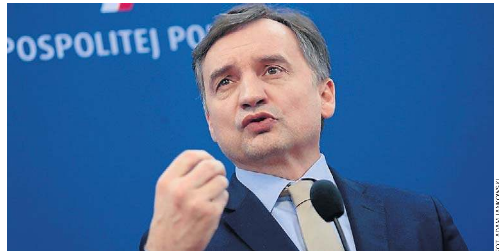
Nic nie wskazuje na to, że prokuratorzy będą chcieli przesłuchać Zbigniewa Ziobro za granicą, na Węgrzech

Prok. Przemysław Nowak wyjaśnił, że konieczność zastosowania aresztu wobec Ziobry wynika „z zachodzącej w sprawie uzasadnionej obawy ucieczki lub ukrycia się, obawy bezprawnego utrudnienia postępowania, a nadto z realnej