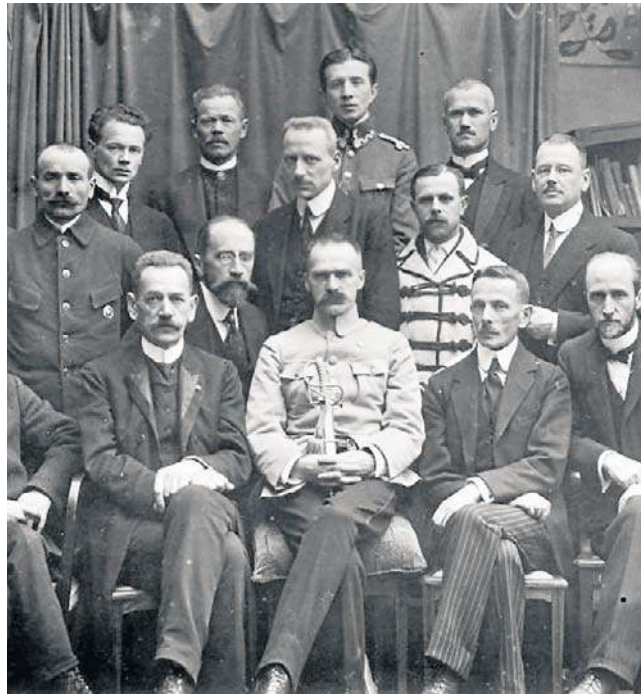
Rząd Jędrzeja Moraczewskiego. Premier siedzi z prawej strony Józefa Piłsudskiego

Nowa władza zaczęła od ogłoszenia swojego programu w formie manifestu zatytułowanego: „Do Narodu Polskiego”. Czytamy w nim m.in.: „Wyszliliśmy z ludu. Robotnicy i chłopci polscy oddali nam w ręce władzę nad wyjarzmionymi już częściami Polski (...) Jesteśmy Rządem tymczasowym, powstałym w chwili nagłej potrzeby”. Rząd składał się z członków następujących partii politycznych: Polskiej Partii Socjalno-Demokratycznej, Polskiego Stronnictwa Ludowego - Lewica, Stronnictwa Niezawisłości Narodowej, Polskiej Partii Socjalistycznej, Polskiego Stronnictwa Ludowego „Piast”, Zjednoczenia Ludowego oraz Polskiego Stronnictwa Ludowego „Wyzwolenie”.