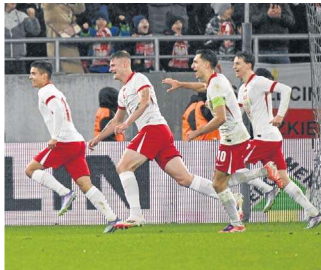
Radość naszych piłkarzy po strzeleniu gola Włochom

Otóż, według znanego portalu o tematyce piłkarskiej „Transfermarkt”, łączna wartość rynkowa naszej kadry to ok. 33 650 000 euro, podczas gdy „Gli