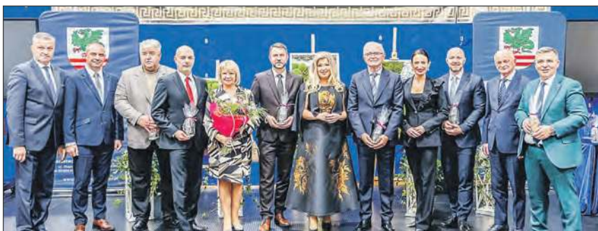
☛ Uroczystość otwarcia hali sportowej odbyła się w środę, 29 października i była połączona z Powiatowym Dniem Edukacji

W Zespole Szkół Ponadpodstawowych w Żelechowie uroczystość otwartą nową halą sportowo-widowiskową. To największa inwestycja budowlana powiatu garwolińskiego ostatnich lat