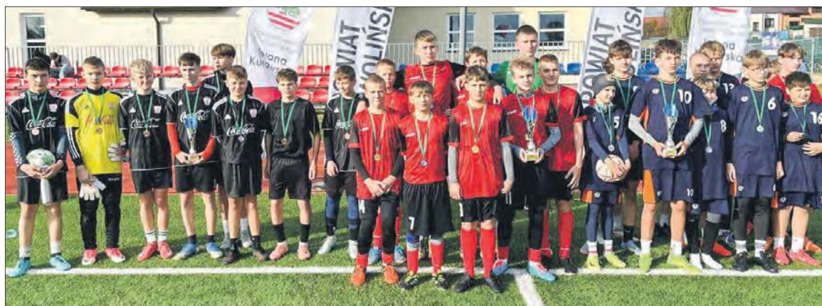
Najlepsze zespoły mistrzostw powiatu Szkolnego Związku Sportowego w piłce nożnej klas 7-8

tof Łapacz, dyrektor Szkoły Podstawowej im. H. Sienkiewicza w Sobolewie. Drużyny z Sobolewa teraz będą reprezentować powiat na zawodach rejonowych. mn