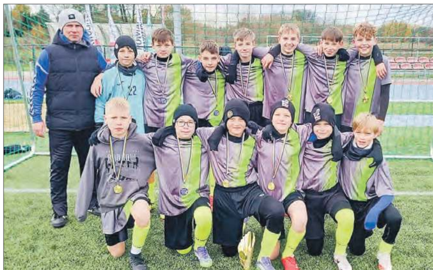
Drużyna SP Górzno (klasa 4-6) - mistrzowie powiatu w piłce nożnej sześciosobowej