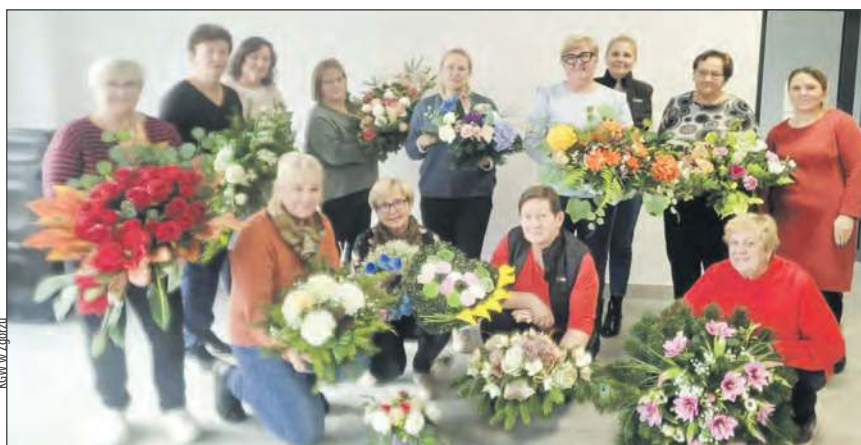
■ Członkinie Koła Gospodyń Wiejskich w Zgórzu wzięły udział w warsztatach florystycznych, zorganizowanych przez MODR Siedlce i PZDR Garwolin

Nie zabrakło elementu rywalizacji. Panie wzięły udział w konkursie na najpiękniejszą kompozycję. Wyłoniono trzy najlepsze prace, a ich autorki otrzymały nagrody. KGW Zgórze podziękowało za organizację, podkreślając, że warsztaty były inspirujące i ciekawe.