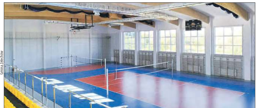
☛ Nowa hala ma wymiary 20 x 40 metrów i wysokość 7,5 metra

Wykonawcą prac była Korporacja Budowlana „Darco” Dariusz Żak z Radomia. Umowę z firmą podpisano 14 czerwca 2024 roku, a plac budowy