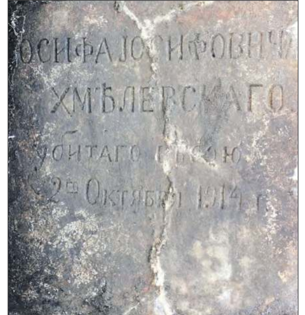
☛ Jedną z ciekawostek, jaka wypłynęła z tegorocznych prac, była tablica epitafijna z pomnika Józefa Chmielewskiego

nia są w fazie projektu, ale na obecnym etapie nie chcę o nich wspominać, dlatego że ich realizacja jest uwarunkowana nie tylko naszymi chęciami czy możliwościami finansowymi, ale instytucjami, z którymi współpracujemy - tłumaczy historyk.