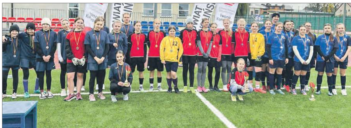
Uczestniczki mistrzostw powiatu Szkolnego Związku Sportowego w piłce nożnej klas 7-8