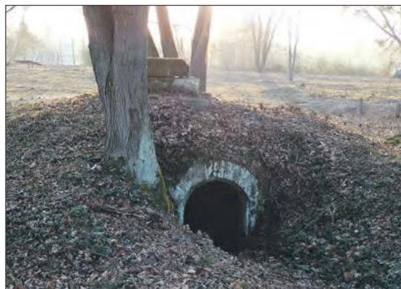
☛ W trakcie prac udało się odsłonić nie tylko nagrobki, ale i całe grobowe piwnice