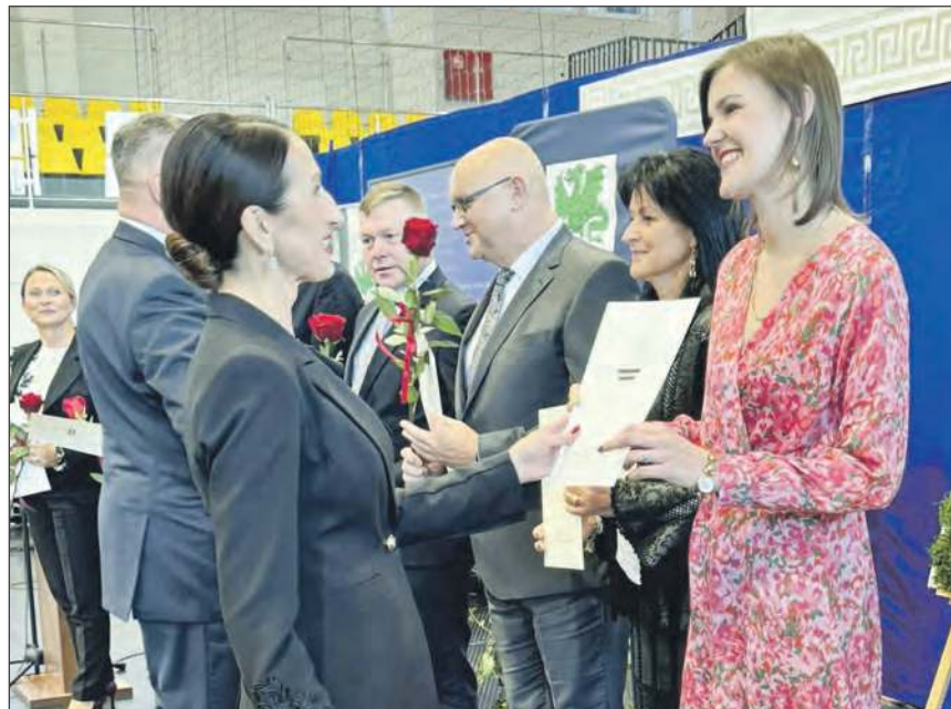
☛ Głównym punktem uroczystości było wręczenie Nagród Starosty Powiatu Garwolińskiego. Otrzymali je nauczyciele, którzy w minionym roku wykazali się szczególnymi osiągnięciami dydaktycznymi

Głównym punktem uroczystości było wręczenie Nagród Starosty Powiatu Garwolińskiego. Otrzymali je nauczyciele, którzy w minionym roku wykazali się szczególnymi osiągnięciami dydaktycznymi. Nagrodę za szczególne osiągnię-