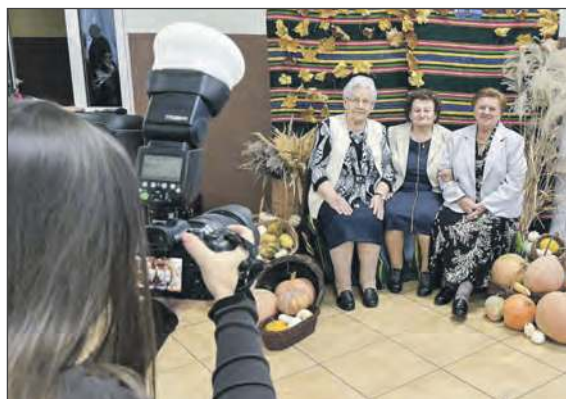
☛ Główną atrakcją była profesjonalna jesienna sesja zdjęciowa, wykonana przez Annę Baran, członkinię KGW