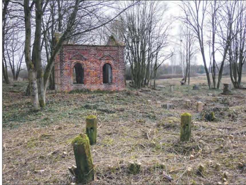
☛ Liczne pozostałości pomników świadczą o tym, że na Cmentarzu Fortecznym było pochowanych dziesiątki ludzi

W poszukiwaniu kolejnych informacji o odnotowanych pochówkach, zespół społeczników posiłkuje się archiwalną prasą, w której nierzadko