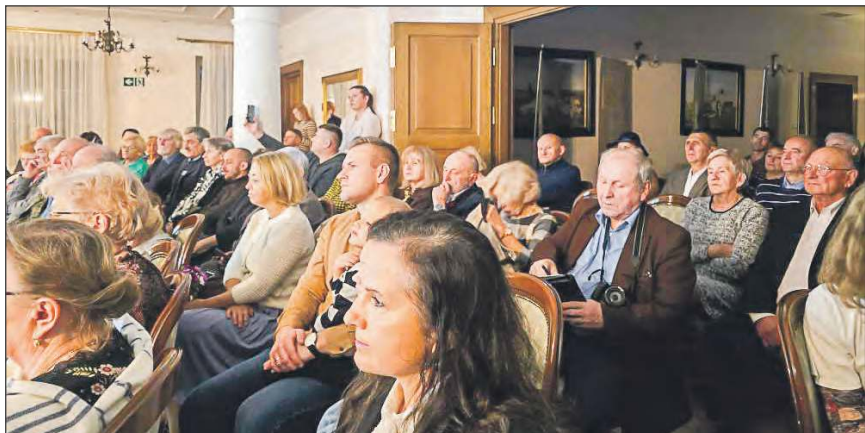
Wstrząsająca opowieść o koszmarze II wojny światowej i opłakanym losie najmłodszych Polaków poruszyła mieszkańców powiatu