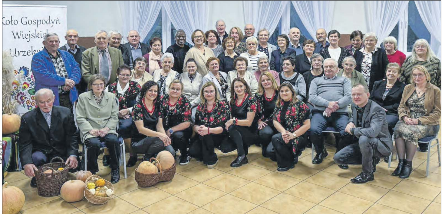
☛ Koło Gospodyń Wiejskich „Urzekające” zorganizowało spotkanie dla seniorów

Główną atrakcją była profesjonalna jesienna sesja zdjęciowa, wykonana przez Annę Baran, członkinię KGW. Każdy senior miał okazję zrobić sobie pamiątkowe zdjęcie. Wywołane fotografie zostaną wręczone podczas świątecznego spotkania w grudniu. - Chcemy, żeby nasi se-