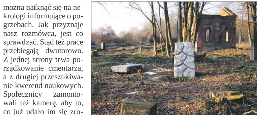
☛ Jeszcze niedawno wiele z pomników było wręcz niewidocznych za szpalarami gałęzi drzew i krzewów