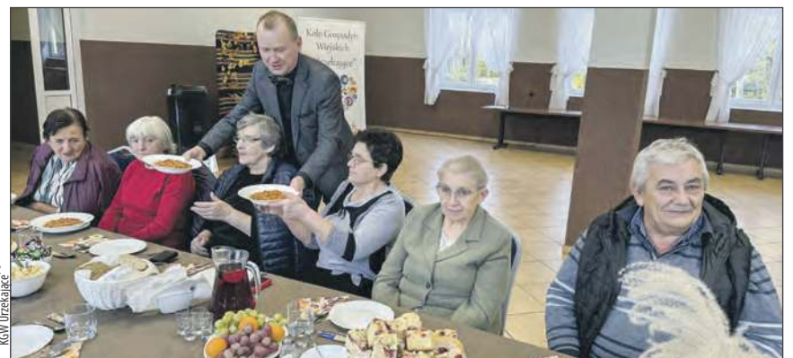
☛ Było to już piąte spotkanie przy wspólnym stole po wakacjach. Na talerzach królowały jesienne potrawy

niorzy czuli się ważni i potrzebni, żeby każde spotkanie było dla nich małym świętem - mówią gospodynie z Jażwin.