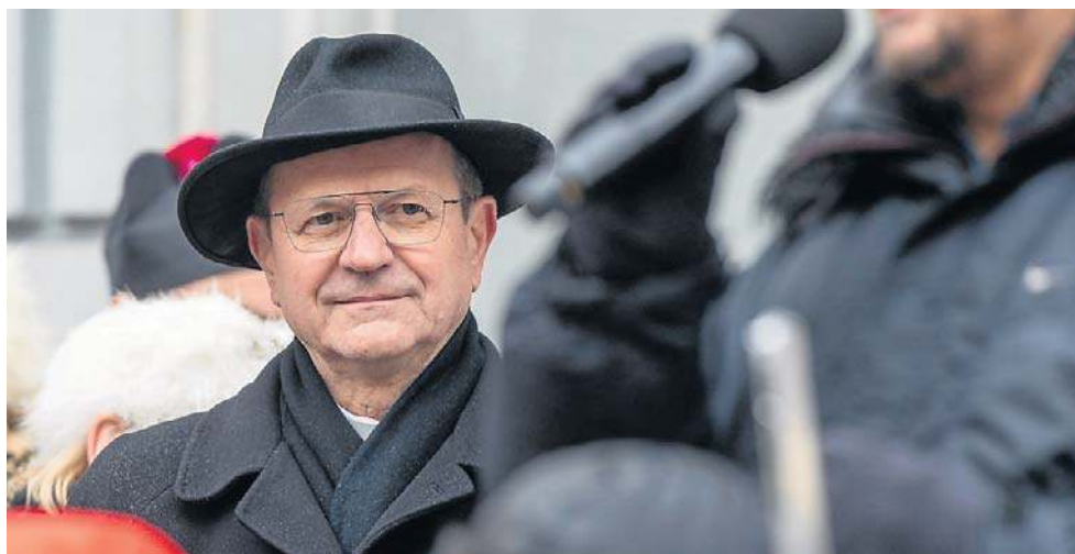
- Wspólnie wypracowywany jest plan działania na wypadek sytuacji kryzysowych - powiedział PAP, abp Tadeusz Wojda

- Istnieją obawy, że wojna dotrze do Polski, co jest zrozumiałe. Na szczęście nie stoimy biernie, czekając na rozwój wydarzeń. W tej kwestii jest powszechne zrozumienie i zgoda.