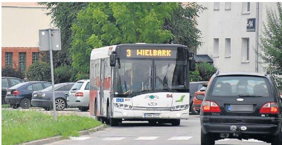
Linia autobusowa nr 3 łączy dzielnice Wielbark i Piaski

Można wyobrazić sobie sytuację, że jednak gdzieś się dokłada i nigdzie się nie zabiera, ale bez pieniędzy to mało prawdopodobne.