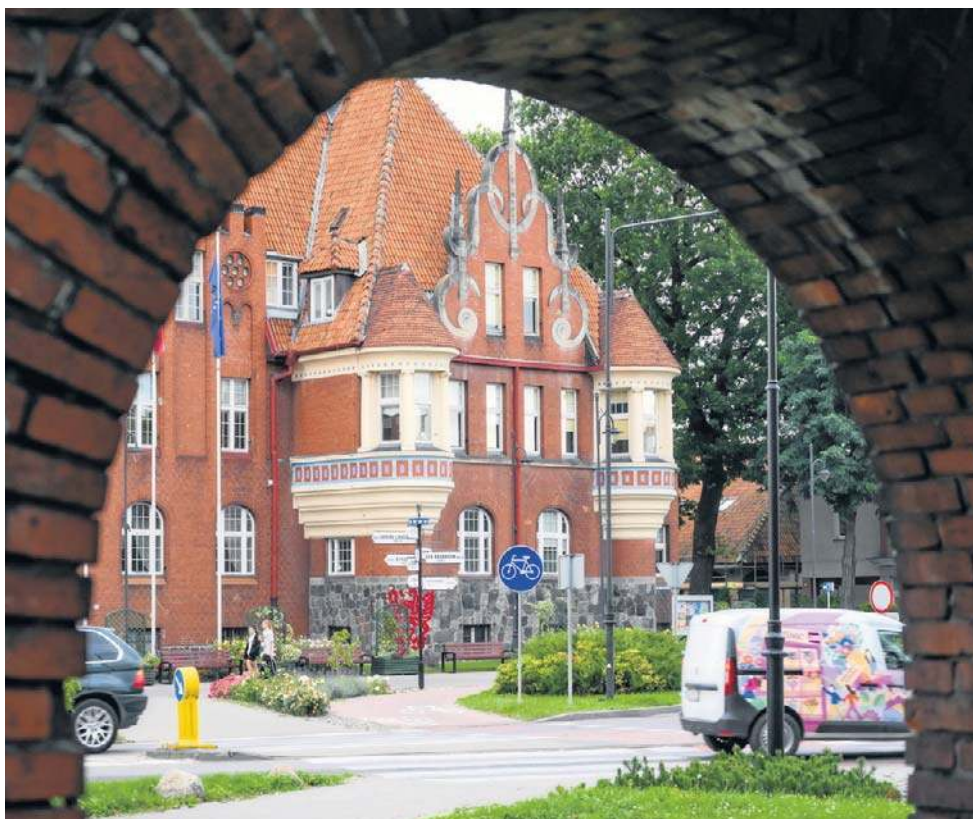
Skandal w związku z podejrzeniami wobec wiceprezydentki wybuchł na początku roku

● kosmetyków o wartości 100,96 zł - której miała doko-