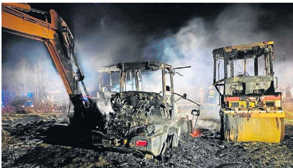
Na razie nie są znane przyczyny wybuchu pożaru na budowie drogi

- Zaraz po dostrzeżeniu pożaru pracownik ochrony wezwał na miejsce jednostki straży pożarnej i policję. Pożar ugaszono, a policja rozpoczęła czynności w tej sprawie - czytamy w oświadczeniu spółki.