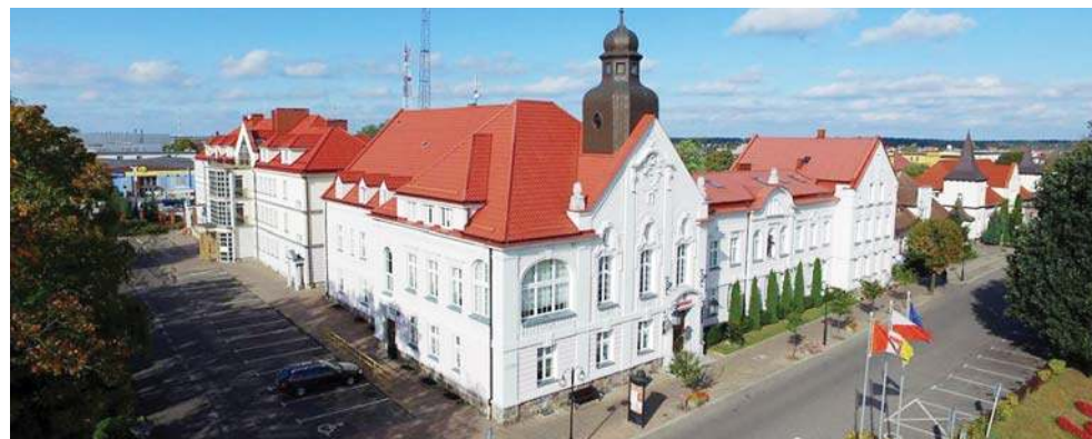
Głosowanie w ramach BO 2026 rozstrzygnięte