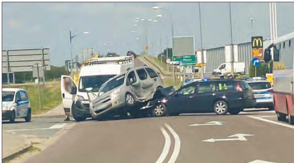
» Dzięki uzyskanej dotacji przy stacji Shell w Garwolinie powstanie nowe rondo, które zwiększy bezpieczeństwo w jednym z najbardziej kolizyjnych skrzyżowań w mieście

» Dzięki dofinansowaniu trzy samorządy otrzymały wsparcie na inwestycje drogowe. Środki pozwolą na realizację długo oczekiwanego ronda przy stacji Shell w Garwolinie, a także modernizację dróg w Kochowie i Pilawie