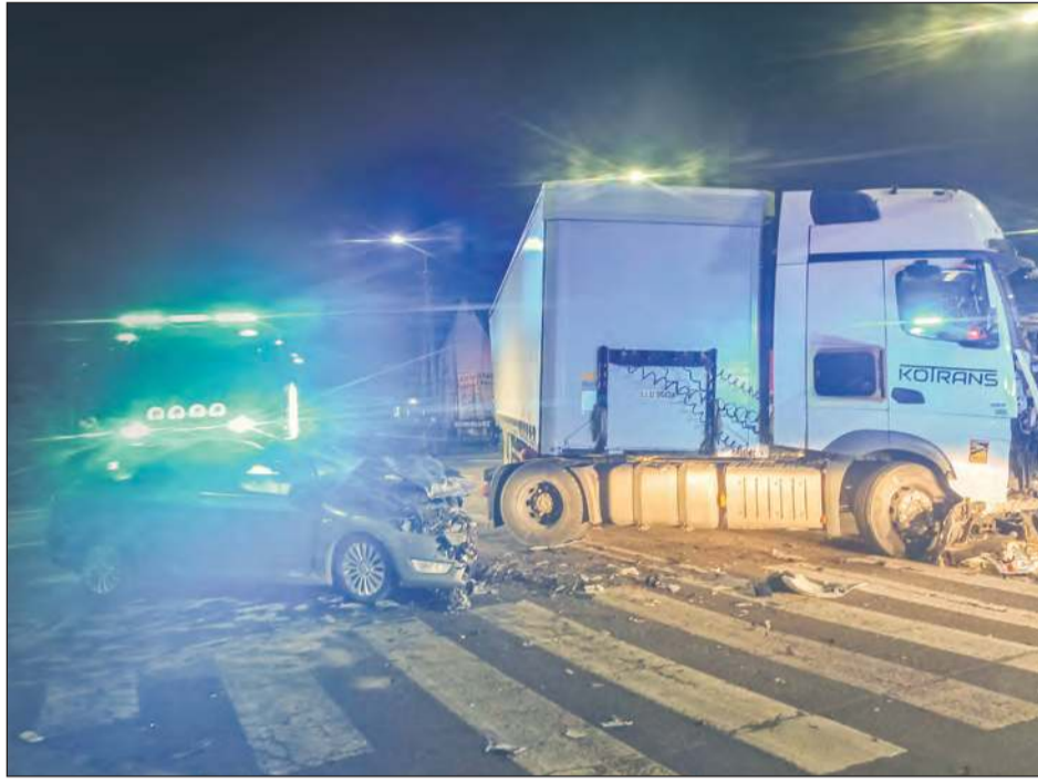
Na skrzyżowaniu w Gończycach doszło do groźnego zderzenia samochodu ciężarowego z osobowym fordem

» Na skrzyżowaniu w Gończycach doszło do groźnego zderzenia samochodu ciężarowego z osobowym fordem. W wyniku wypadku do szpitala trafiły dwie osoby, a na miejscu interweniował śmigłowiec Lotniczego Pogotowia Ratunkowego