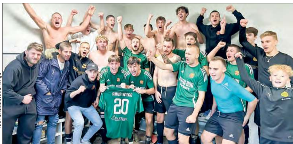
Tak się cieszą piłkarze Amura Wilga po wygranych meczach)

Końcówka rundy przyniosła jeszcze dwa powody do radości. Amur pokonał w derbach powiatu garwolińskiego Orła Parysów 2:0 i zremisował z walczącą o awans do okręgówki Wisłą Dziecinów 2:2. mn