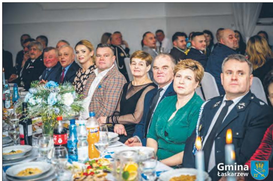
Spotkanie Noworoczne w sali OSP Melanów zgromadziło mieszkańców, samorządowców i przedstawicieli różnych środowisk