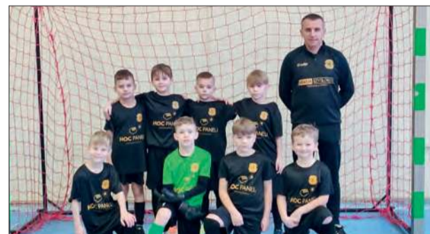
Amur Wilga. Mimo starań ze strony autora artykułu klub nie przysłał opisu zdjęcia