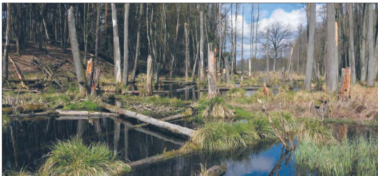
■ Teren tworzonego rezerwatu Dębczyna Dewajtis

W ostatnich miesiącach trwała intensywna debata na temat przyszłości gospodarki leśnej w Polsce. Jednym z jej kluczowych tematów była realizacja rządowych założeń dotyczących objęcia ochroną 20% lasów cennych przyrodniczo i istotnych społecznie. Efektem Ogólnopolskiej Rady o Lasach - cyklu spotkań ekspertów i przedstawicieli branży leśnej - są wytyczne precyzujące kryteria, według których mają być wyznaczone te obszary.