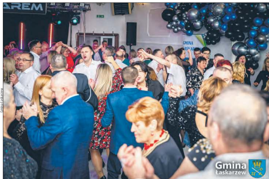
O dobrą atmosferę i niezapomniane wrażenia zadbał zespół Harem, który porwał wszystkich gości do tańca