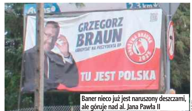
Baner nieco już jest naruszony deszczami, ale góruje nad al. Jana Pawła II

Chociaż od wyborów na prezydenta RP minęło już wiele tygodni, to jednak wielkoformatowy baner z reklamą wyborczą prezesa Konfederacji Korony Polskiej, czyli europośła Grzegorza Brauna widnieje przy al. Jana Pawła II.