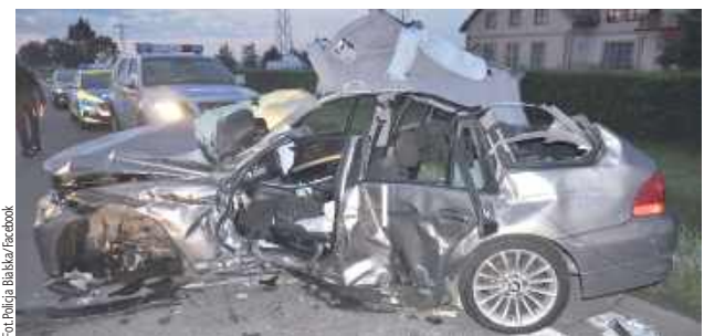
Do szpitala z obrażeniami ciała trafiły trzy osoby