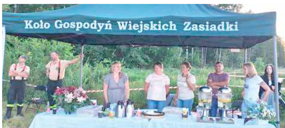
Smakowite przysmaki zapewniło Koło Gospodyń Wiejskich z Zasiadek

Był również czas na widowiskowy pokaz sztuk walki – swoje umiejętności zaprezentowali