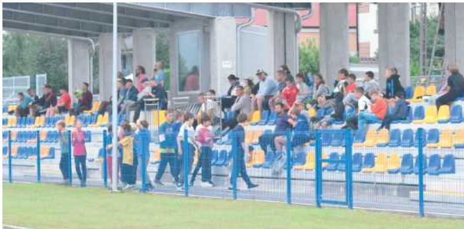
Kibice mogli oglądać mecz z nowych, zadaszonych trybun

Trudno będzie jednak zrekompenzować straty. Dionota Tonin i Jakub Łęcki stanowili trzon ofensywy Huraganu. Tonin, zdobył aż 24 bramki w ubiegłym sezonie i był nie tylko najlepszym strzelcem drużyny, ale i był na trzeciej pozycji w całej lidze pod względem ilości zdobytych goli. Łęcki dołożył od siebie 10 trafień i dzięki temu był drugim najsk-