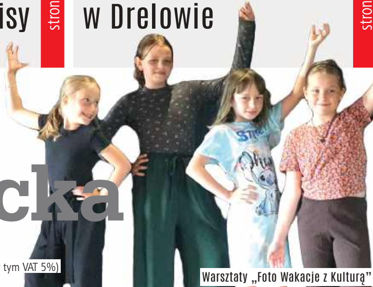
Warsztaty „Foto Wakacje z Kulturą”