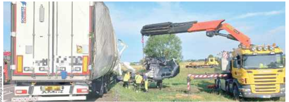
Na czas podnoszenia podnoszenie samochodu ciężarowego droga jest zablokowana

W środę (16 lipca) na skrzyżowaniu DK-2 z ul. Drohicką w Międzyrzeczu Podlaskim doszło do wypadku. - Ze wstępnych ustaleń wynika, że kierująca osobowym Audi 28-latką, wyjeżdżając z drogi podporządkowanej, nie ustąpiła pierwszeństwa ciężarowemu DAF-owi. W wyniku bocznego zdarzenia ciężarówka zjechała na lewe pobocze, przewracając się. Do szpitala z obrażeniami ciała trafiły trzy osoby. Niestety 31-letni pasażer osobówki zmarł w wyniku poniesionych obrażeń - informuje Policja Bialska.