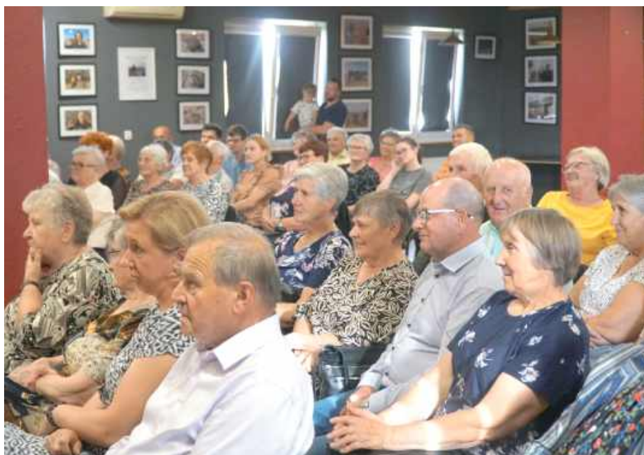
Na wydarzenie przybyło wielu widzów

W ramach cyklicznego projektu Scena Seniora 13 lipca odbyło się spotkanie, które tym razem przybrało wyjątkowo rozrywkowy charakter. Gośćmi wydarzenia była lubelska grupa improwizacji teatralnej Poławiacze Pereł, która podbiła serca publiczności błyskotliwym humorem i scenkami pełnymi nieprzewidywalnych zwrotów akcji.