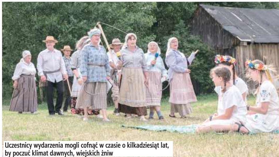
Uczestnicy wydarzenia mogli cofnąć w czasie o kilkadziesiąt lat, by poczuć klimat dawnych, wiejskich żniw