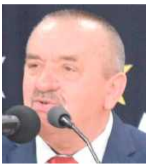
I dyrektor I LO im. J. I. Kraszewskiego w Białej Podlaskiej

Trzeci wynik pod względem zdawalności osiągnęło II LO im. E. Plater (93,62 proc.), czwarty IV LO im. Stanisława Staszica (83,54 proc.), piąty