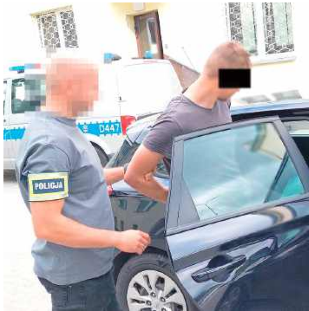
W ciągu dwóch dni policjanci bialskiej komendy jak też podległych komisariatów zatrzymali 14 osób poszukiwanych zarówno przez sąd jak też prokuraturę

- W przypadku 26-latka, do którego zapukali wisznicy kryminalni, mężczyzna poszukiwany był w związku z nieuiszczoną grzywną. Informacje funkcjonariuszy wskazywały, że dodatkowo