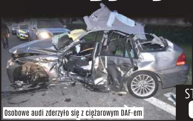
Osobowe audi zderzyło się z ciężarowym DAF-em