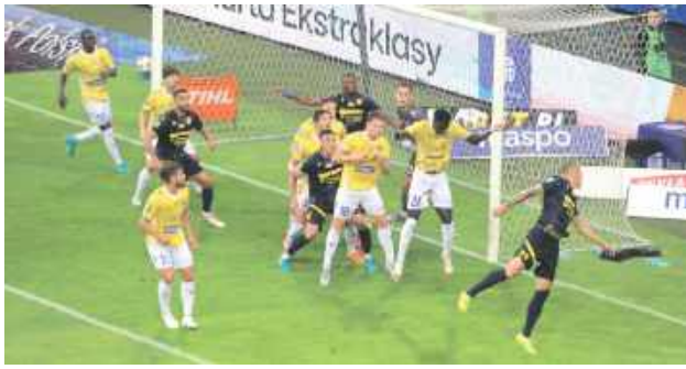
Motor (żółte koszulki) rozgrywa drugi z rzędu sezon w krajowej elicie

Latem do Motoru sprowadzono dziewięciu nowych piłkarzy. W kadrze meczowej na inaugu-