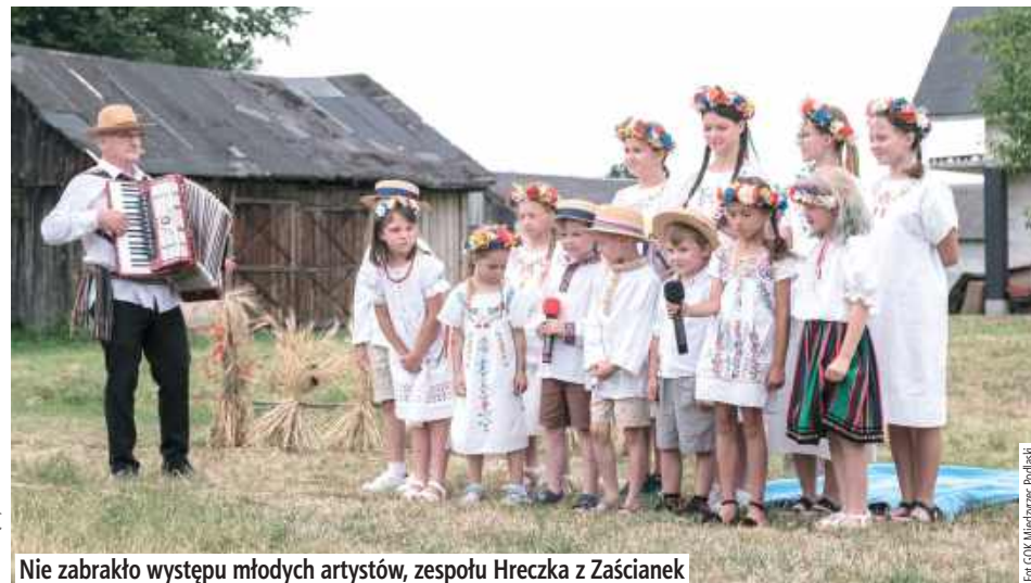
Nie zabrakło występu młodych artystów, zespołu Hreczka z Zaścianek

Dom Ludowy w Zaściankach 6 lipca zamienił się w prawdziwe centrum dawnych tradycji wiejskich. Pod hasłem „Jak to na wsi niegdyś bywało... Kuma żytko żęła”, mieszkańcy gminy i okolic mieli okazję przenieść się w czasie i doświadczyć klimatu dawnych żniw.