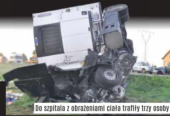
Do szpitala z obrażeniami ciała trafiły trzy osoby