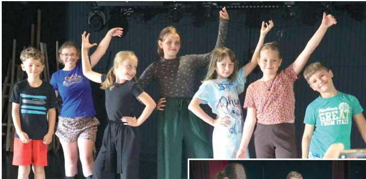
Zwienieniem tygodniowych zajęć był wyjątkowy występ artystyczno-wokalny

Gminne Centrum Kultury w Drełowie zamieniło się w prawdziwe fotograficzne atelier, a wszystko to za sprawą wyjątkowych warsztatów „Foto Wakacje z Kulturą”. Przez pięć dni dzieci ze szkół podstawowych mogły nie tylko poznać tajniki fotografii analogowej i cyfrowej, ale również w praktyce odkrywać magię obrazu.