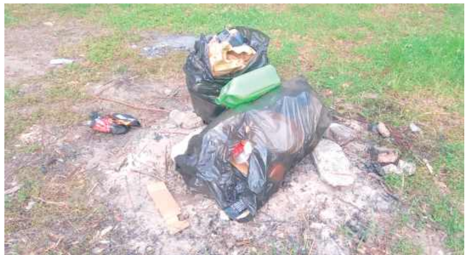
Ktoś zadał sobie trud, by spakować swoje śmieci, ale niestety zapomniał je zabrać - szkoda, bo to ostatni, najważniejszy krok

Żwirownia, będąca jednym z ulubionych miejsc wypoczynku mieszkańców Międzyrzecza i okolic, coraz częściej staje się symbolem nie tylko letniego relaksu, ale także ludzkiej bezmyślności. Z roku na rok rośnie problem zaśmiecania tego malowniczego terenu, który zamiast przypominać o urokach natury, zaczyna przypominać wysypisko.