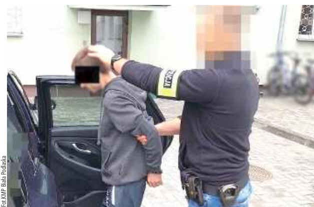
Mężczyźnie grozi kara do siedmiu i pół roku pozbawienia wolności

Sprawca wszczynać miał awantury domowe, podczas których wyzywał, zakłócał spoczynek nocny, popychał i groził pozbawieniem życia. Choć uciekł przed przyjazdem mundurowych, szybko został zatrzymany i trafił do policyjnego aresztu. Dodatkowo policjanci ujawnili przy nim woreczek z narkotyka-