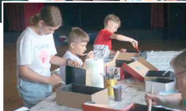
Jednym z punktów programu było tworzenie przez dzieci własnej camera obscura – prostego, pierwowzoru aparatu fotograficznego, który wykorzystuje niewielki otwór do rzutowania odwróconego obrazu na wewnętrzną ściankę pudełka