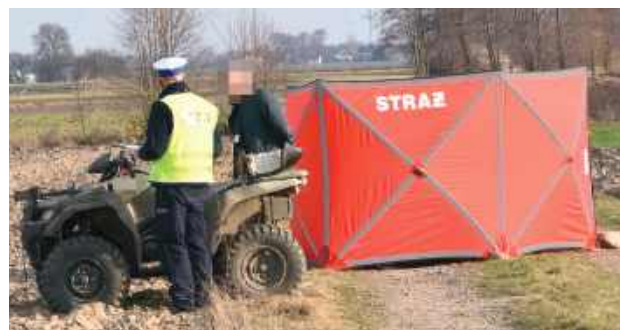
Dramat rozegrał się 21 marca tego roku w Kłębowie (gmina Ulan-Majorat)

Dramat rozegrał się 21 marca tego roku w Kłębowie (gmina Ulan-Majorat). Z ustaleń radzyńskich policjantów pracujących na miejscu zdarzenia wynikało, że kierujący quadem marki Suzuki na drodze gruntowej stracił panowanie nad czte-