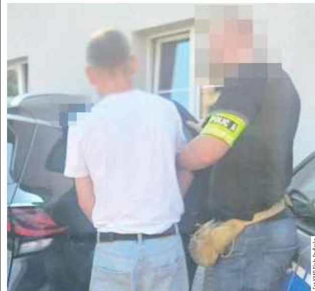
Mężczyzna trafił już do zakładu karnego, gdzie spędzi najbliższe 14 miesięcy

Międzyrzec Podlaski: Policjanci zatrzymali 40-latkę poszukiwanego przez sąd oraz prokuraturę. Za mężczyznę wydane były trzy podstawy prawne, w tym list gończy za przestępstwo niealimentacji. Ukrywał się od marca.