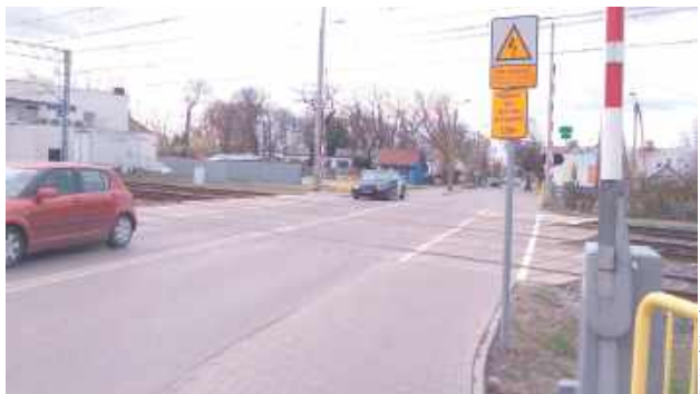
Wielu mieszkańców os. Za Torami lubi obecny przejazd w ul. Łomaskiej, nad którym najpierw została zlikwidowana kładka dla pieszych...

- Inżynierowie Wydziału Dróg Urzędu Miasta Biała Podlaska we współpracy z ekspertami drogownictwa, urbanistyki i inżynierii ruchu stworzyli tę koncepcję przebudowy, by: zapobiec