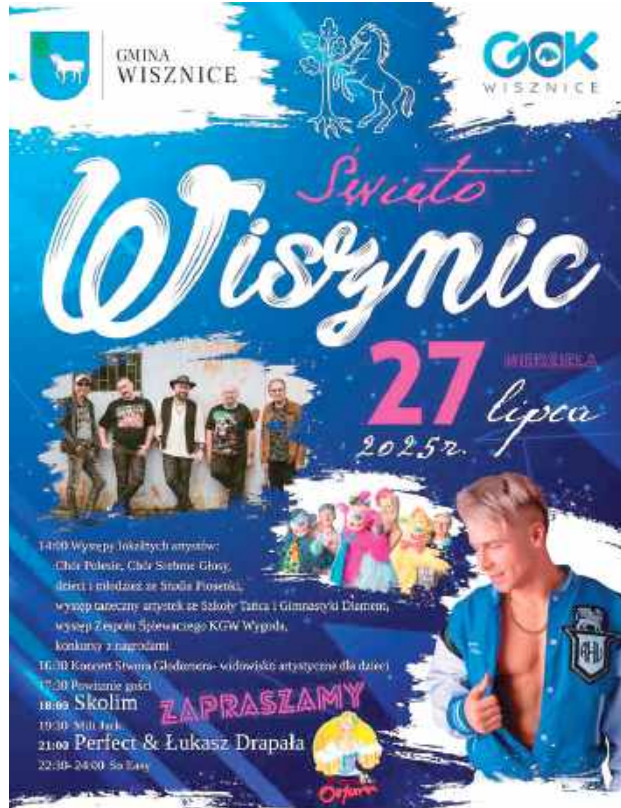
Plakat Święta Wisznic

O godz. 16.30 dzieci porwie do wspólnej zabawy