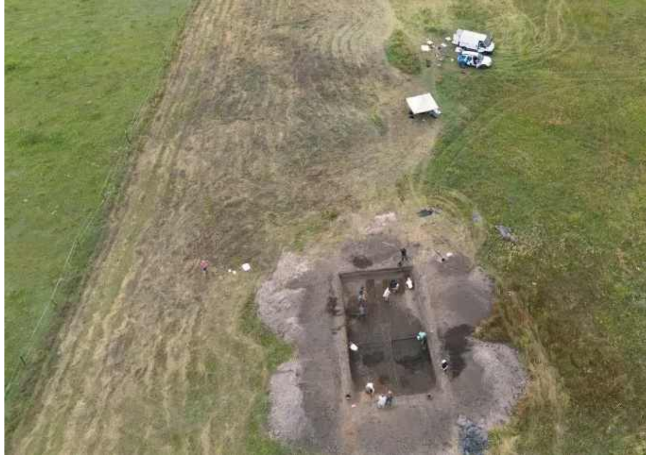
Wykopaliska w Zaborowie z lotu ptaka.

sprawną strukturą społeczną z wykształconymi elitami. Domyślamy się, że ktoś odpowiadał za zapewnienie całego łańcucha dostaw węgla drzewnego i rudy darniowej. Byli też potrzebni wykwalifikowani ludzie do samego procesu, ktoś ich musiał pozyskać albo przeszkolić. Możliwe, że tutaj na Mazowszu był jakiś ród lub władca plemienny, który miał pomysł na biznes. To wszystko spowodowało, że eksplozja hutnictwa wydarzyła się tutaj, a nie gdzieś 100-200 kilometrów dalej. Drugi scenariusz, który możemy rozważać, to bliskość szlaków komunikacyjnych, za jeden z nich mogła służyć nieodległa Wisła - wyjaśnił rozmówca PAP.