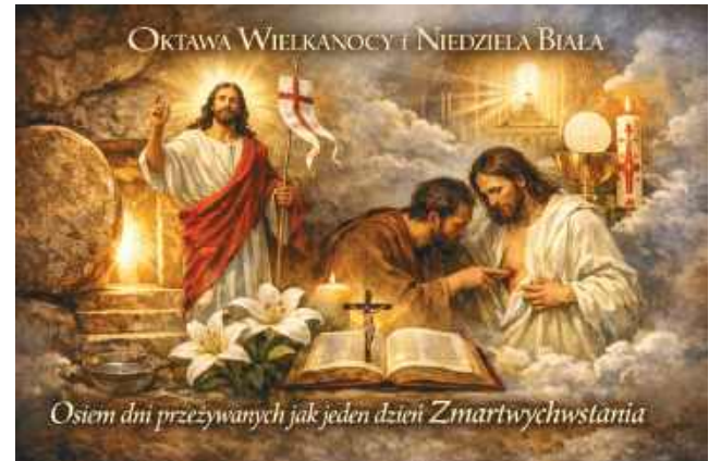
Osiem dni przeżywanych jak jeden dzień Zmartwychwstania

W tradycji katolickiej Niedziela Białą zachowuje charakter chrzcielny i paschalny. To dzień przypomnienia, że każdy ochrzczony został włączony w śmierć