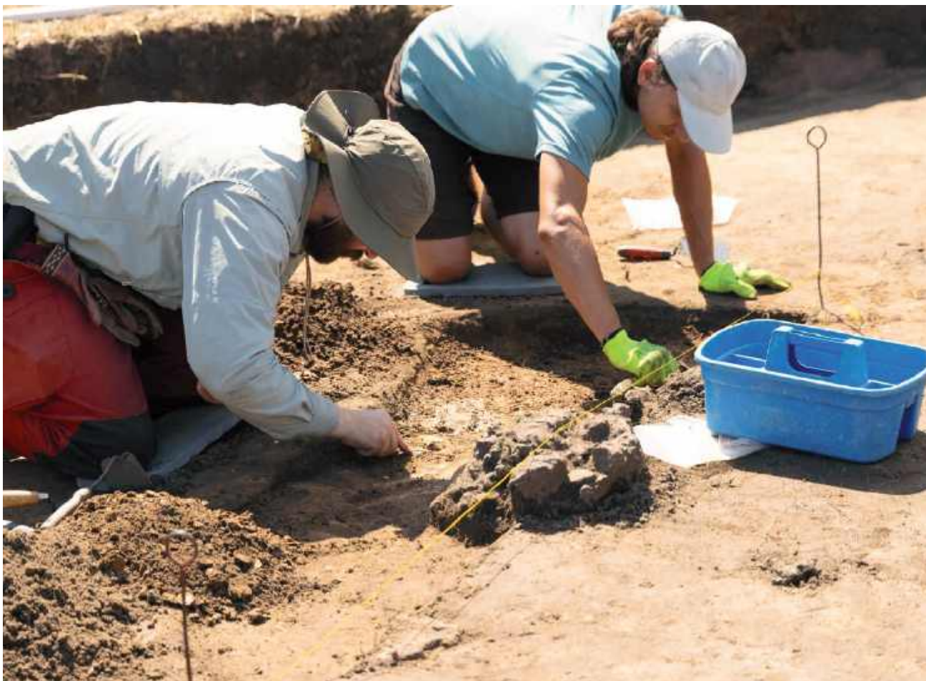
Piec dymarski w trakcie eksploracji. Jego pozostałością jest skupisko żużla - produktu odpadkowego w procesie produkcji żelaza.

Dlaczego tak duże centrum metalurgiczne znalazło się właśnie na Mazowszu? Mogło się na to złożyć kilka korzystnych czynników. - Żeby produkować żelazo na skalę masową trzeba mieć dostęp do wszystkich surowców. Konieczna jest do tego ruda darniowa, która występuje masowo na Niżu Polskim czy szerzej na Niżu Europejskim. Tworzy się ona w miejscach podmokłych, a wiadomo, że okolice Warszawy przecina ją liczne rzeczki. Drugi element to glina, powszechna