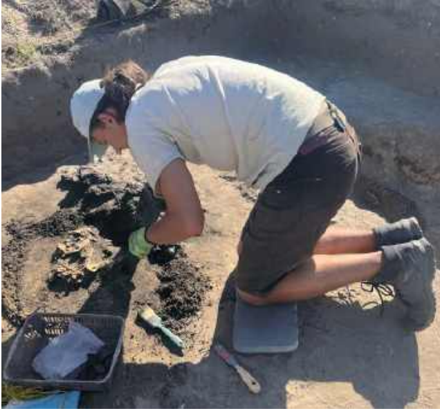
Studenci Wydziału Archeologii UW w trakcie płukania ziemi z wypełnisk pieców dymarskich. Na sitach laboratoryjnych znajdują się zwęglone szczątki nasion i owoców roślin – cenne źródła do badań archeobotanicznych.