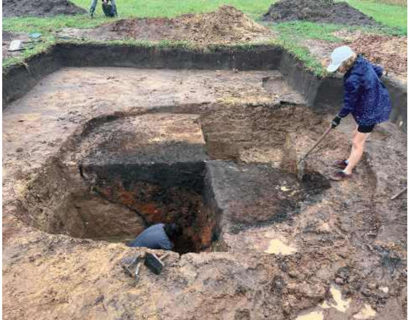
Piec do produkcji wapna z przełomu er. Wapno miało liczne zastosowania. Służyło między innymi do białenia ścian domów oraz wykorzystywano je w procesie garbowania skór.

Najprawdopodobniej ze sztabek, już w kuźniach, kowale wykuwali konkretne przedmioty, które archeolodzy dobrze znają przede wszystkim z cmentarzysk. Choć z badań wynika, że hutnictwo wprowadzili przedstawiciele kultury jastorfskiej, to jego rozwój badacze wiążą z okresem późniejszym (przełom er i pierwsze