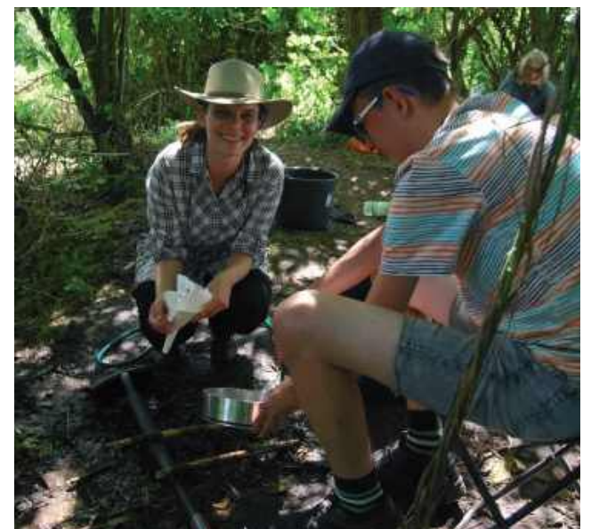
Studenci Wydziału Archeologii UW w trakcie płukania ziemi z wypełniak pieców dymarskich. Na sitach laboratoryjnych znajdują się zwęglone szczątki nasion i owoców roślin - cenne źródła do badań archeobotanicznych.