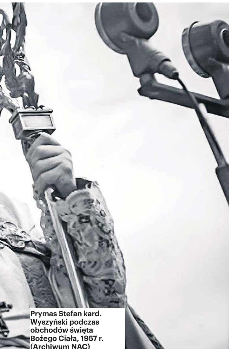
Prymas Stefan kard. Wyszyński podczas obchodów święta Bożego Ciała, 1957 r.

tencji komunistów, uznając porozumienie za „wybieg taktyczny”. Jak zanotował w swoich zapiskach: „trzeba zyskać czas, by wzmocnić siły do obrony Bożych pozycji”.