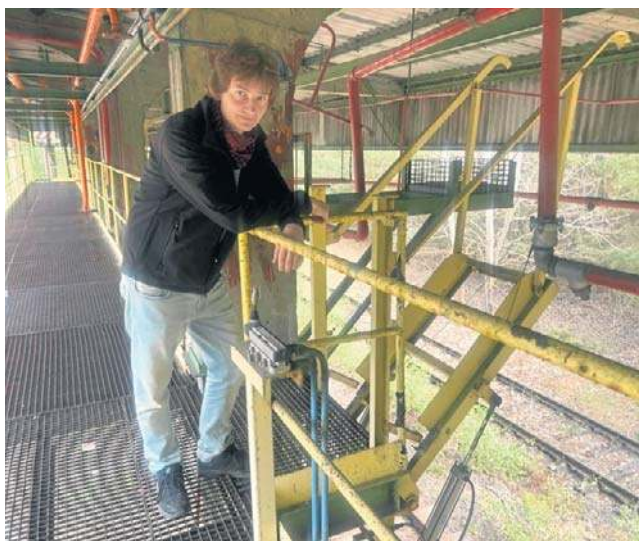
Rampa po bydgoskim Zachemie. „Tory jak w Czarnobylu”

Gwoli wyjaśnienia: wraz z upadkiem ZSRR zamknięta strefa wokół Czarnobylskiej Elektrowni Atomowej uległa podziałowi na dwie części: Ukrainą i Białoruską. Obie znacznie się od siebie różnią i są zarządzane niezależnie od siebie. Strefa ukraińska jest bardziej znana i łatwiej