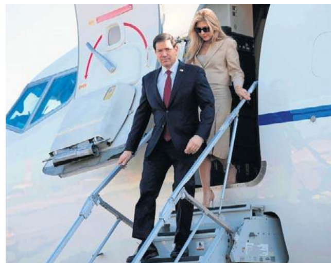
Marco Rubio wraz z małżonką przybyli wczoraj do Rzymu. W czwartek Rubio spotkał się z papieżem

Gdy Leon XIV zaapelował w kwietniu o pokój w Iranie i wezwał chrześcijan do skończenia z wojną oraz z „demonstrowaniem władzy”, prezydent Trump opublikował na platformie Truth Social