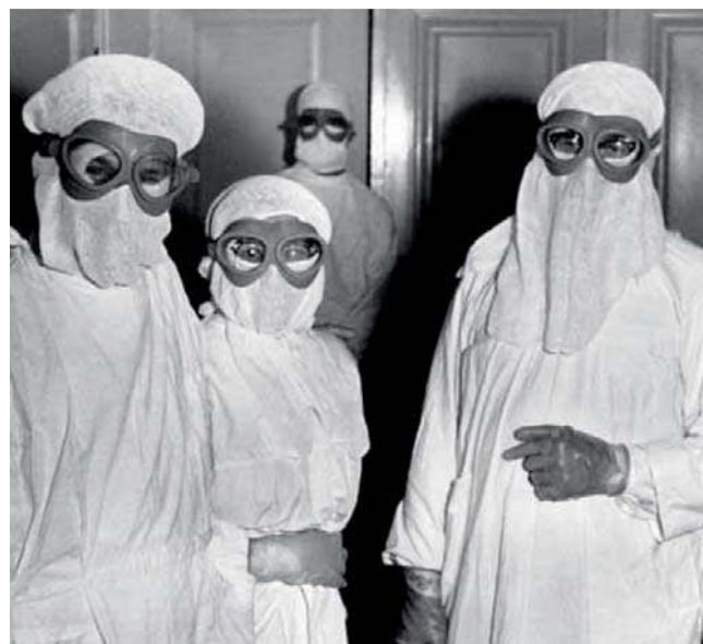
Ubiór ochronny służby zdrowia w okresie epidemii we Wrocławiu. Zachorowało 99 osób (najwięcej było pracowników służby zdrowia), z których siedem zmarło, w tym cztery to lekarze i pielęgniarki

Co ciekawe, pojawiają się głosy, że wyeliminowanie ospy odrąbiono nieco na wyrost. Jest bowiem wielce prawdopodobne, że nie wszystkie kraje zastosowały się do Konwencji o zakazie prowadzenia badań,