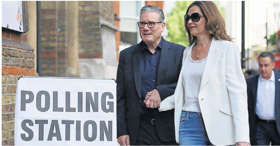
Premier Keir Starmer i jego małżonka Victoria w drodze do lokalu wyborczego. Czy te wybory pozbawią go stanowiska?

Według sondaży wybory przyniosą poważne przetaso-