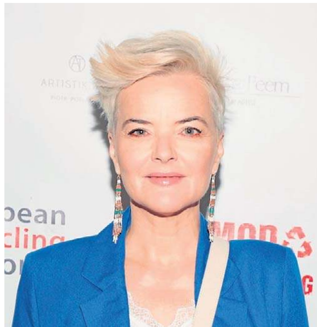
Monika Richardson nie epatuje swoim życiem prywatnym, ale jest bardzo dumna ze swojej córki