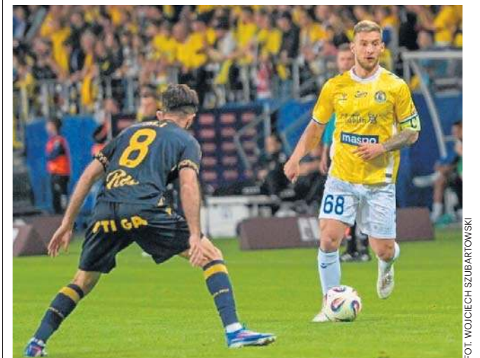
FOT. WOJCIECH SZUBARTOWSKI

Po meczu w Płocku, Motorowców czekają jeszcze 16 meczów starcie z Cracovią (do maja) i w Warszawie z Legią (23 maja). ©©