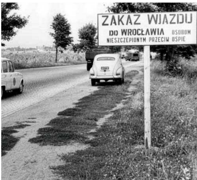
We Wrocławiu w maju 1963 r. wybuchła jedna z ostatnich w Europie epidemii ospy prawdziwej. Stan epidemii ogłoszono 17 lipca, odwołano go po kilku tygodniach, 19 września

miany ospy prawdziwej zabijały nawet ponad 80 proc. osób zarażonych. Najwyższą umieralność obserwowano u osób nieszczepionych.