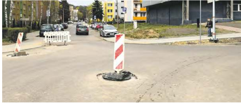
Koniec remontu ulicy Nickla coraz bliżej

MIECHOWICE. ZAKOŃCZONO KOLEJNY ETAP REMONTU ULICY NICKLA. PRZEZ DWA DNI EKIPA ROBOTNIKÓW KŁADŁA ASFALT NA JEJ ODCINKU OD SKRZYŻOWANIA Z UL. FRENZLA AŻ DO SKRZYŻOWANIA W REJONIE BUDYNKU POD NUMEREM 143A.