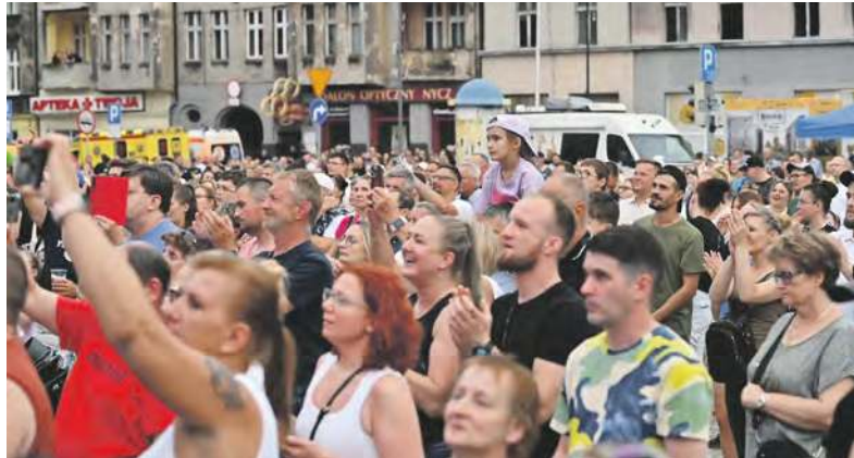
Zagrać dla takich tłumów to bez wątpienia jest coś

Zainteresowani mają czas na to, by się zgłosić do 4 maja. Aby wziąć udział w konkursie należy przesłać wypełniony formularz zgłoszeniowy (znajdziesz go na stronie internetowej www.becek.pl ) wraz z video nagraniem dwóch dowolnie wybranych autorskich utworów. Rzecz jasna najlepiej takich