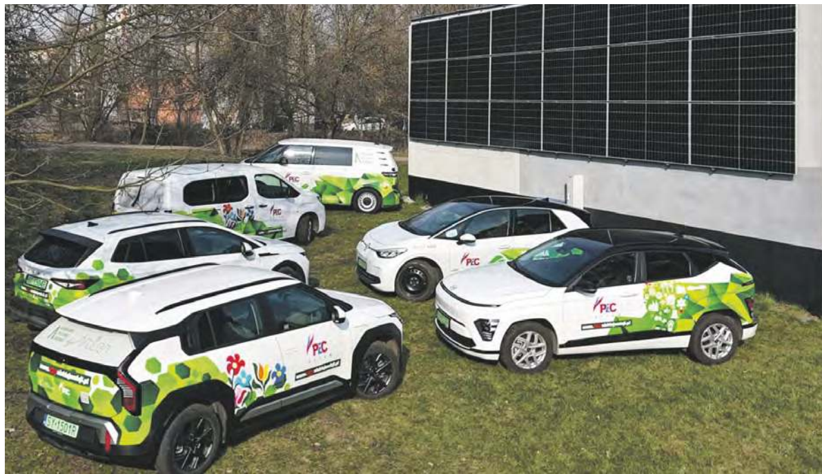
Flota samochodów zeroemisyjnych należących do PEC Bytom.

Rozwijając projekty związane z odnawialnymi źródłami energii i elektromobilnością, przedsiębiorstwo aktywnie uczestniczy w transformacji energetycznej, jednocześnie zachowując poszanowanie dla przemysłowego dziedzictwa regionu. Obecnie Przedsiębiorstwo Energetyki Ciepłej posiada w swoich zasobach 6 pojazdów zeroemisyjnych. Rosnące koszty energii konwencjonalnej powodują, że inwestycje w odnawialne źródła energii stają się nie tylko przyjazne dla środowiska, lecz także opłacalne ekonomicznie. Nie bez znaczenia są także uwarunkowania regulacyjne, w tym planowane wdrożenie systemu ETS2, który obejmie gospodarstwa domowe wykorzystujące paliwa kopalne.