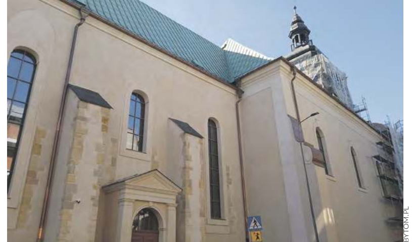
Elewacja świątyni odzyskała blask