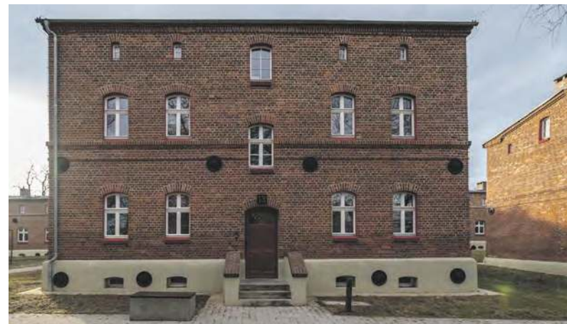
Tyn familok ze Kolonii Zgorzelec jest fest piykny, pra?

Inkszo słonsko partykuła, to „przca”, a więc przecież. I zdanie: „Nie ma dziwne, co mocka ludzi skłudzo sie do Bytonia, przca to piykne miasto” zna-