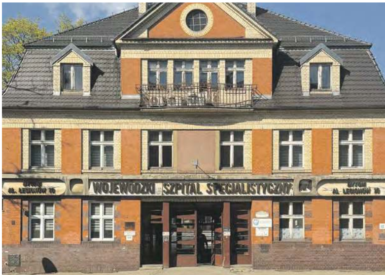
Połączenie bytomskich szpitali....

Z kolei Szafranowicz dodaje: - Kluczowym elementem fuzji jest konsolidacja, która wpłynie na optymalizację struktur medycznych i zarządczych, co realnie uzdrowi finanse przekładając się na sukcesywną redukcję zadłużenia obydwu placówek, wyeliminuje duplikowanie się oddziałów, zapewni efektywniejsze wykorzystywanie łóżek