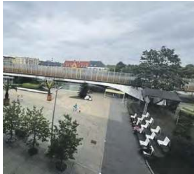
W maju samochody i tramwaje powinny wrócić na estakadę

Ogólnie jednak wydaje się, że sytuacja się unormowała, a miesz-