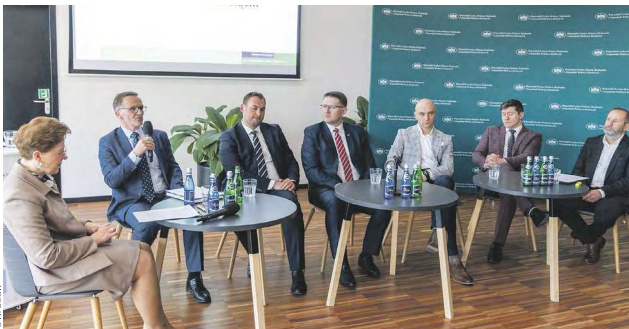
Zdaniem uczestników debaty dekarbonizacja jest nieunikniona, więc trzeba szukać nowych rozwiązań w ciepłownictwie

„PRZYSZŁOŚĆ CIEPŁOWNICTWA W WOJEWÓDZTWIE ŚLĄSKIM - JAK ZMIENIAJĄCE SIĘ REGULACJE KSZTAŁTUJĄ STRATEGIE PRZEDSIĘBIORSTW CIEPŁOWNICZYCH?” TAKIE HASŁO HASŁO PRZYŚWIECAŁO OSTATNIEJ KONFERENCJI Z CYKLU KIERUNEK - ZIELONA TRANSFORMACJA 2026.