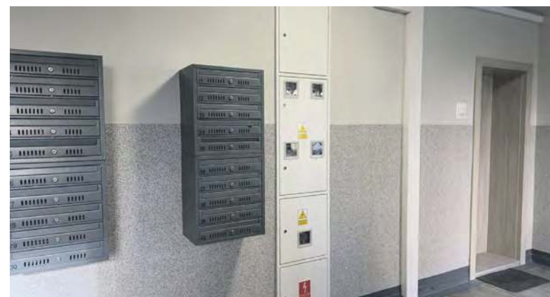
Klatki schodowe w budynkach BSM wyglądają doskonale

Spółdzielnia od lat realizuje plan, który nie zaczyna się od efektu wizualnego, lecz od tego, co najważniejsze. Program wymiany pionów (zrealizowała go firma Ledwoch), poziomów oraz modernizacji instalacji elektrycznej, prowadzony systematycznie od 2004 roku, stanowi fundament wszystkich późniejszych działań. To prace niewidoczne na pierwszy rzut oka, ale