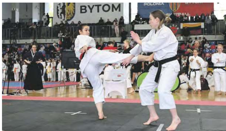
Takich pięknych akcji podczas Silesia Cup oglądaliśmy sporo

Silesia Cup, a więc XVII Otwarty Międzynarodowy Puchar Województwa Śląskiego w Karate Tradycyjnym odbył się w szombierskiej Hali Na Skarpie. Gospodarzem tego wielkiego wydarzenia był klub MUKS Ippon Bytom.