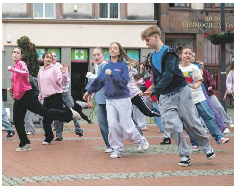
Tancerze, do dzieła!

I właśnie ta piosenka posłużyła do stworzenia choreografii, którą wspólnie ma wykonać pół tysiąca osób. Takie wydarzenie przygotowuje Teatr Tańca