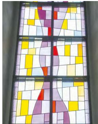
Jeden z odnowionych witraży

ŚRÓDMIEŚCIE. KOMPLEKSOWY REMONT STOJĄCEGO PRZY PLACU KLASZTORNYM KOŚCIOŁA POD WEZWANIEM ŚW. WOJCIECHA TRWA JUŻ WIELE MIESIĘCY, A JEGO EFEKTY SĄ CORAZ BARDZIEJ WIDOCZNE. I TRZEBA POWIEDZIEĆ, ŻE NA WIELU MIESZKAŃCACH ROBIĄ BARDZO DOBRE WRAŻENIE.