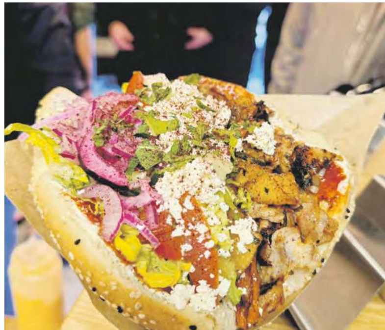
Podobno jest znakomity

Mający miliony wyświetleń w sieci Książuła zachwycił się Kebabem