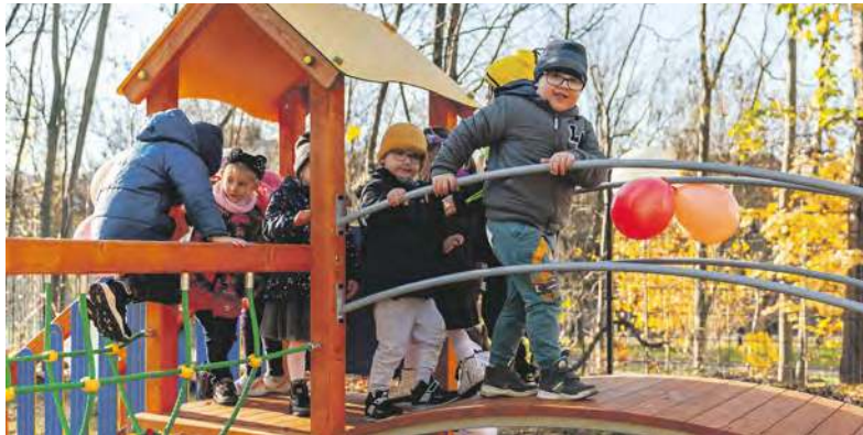
W ramach BBO często tworzone są place zabaw

Wniosek musi zostać poparty podpisami minimum 50 mieszkańców Bytomia,