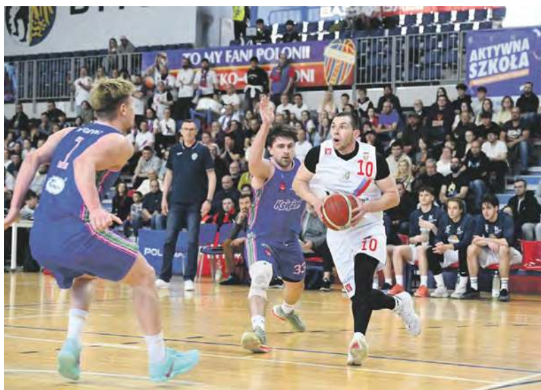
Koszykarze Polonii są już w ćwierćfinale