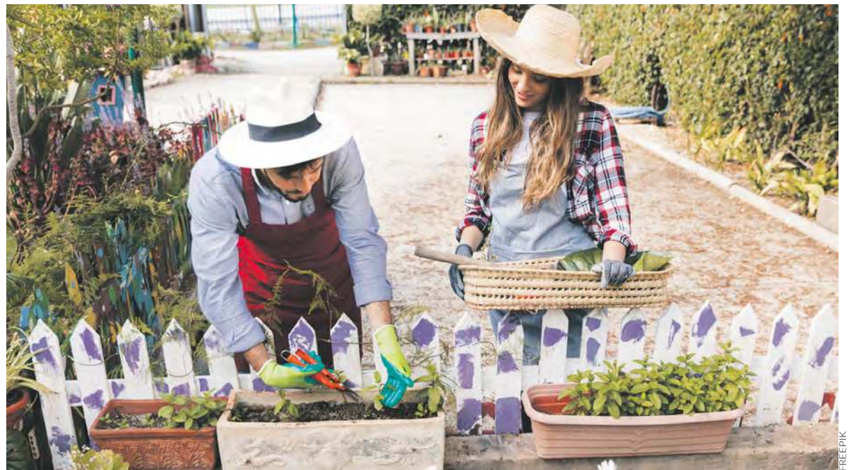
Nie pozwólmy złodziejom i wandalom dostać się do naszych ogródków działkowych

Wartościowe przedmioty dobrze jest oznaczyć w trwały i widoczny sposób oraz zrobić ich dokumentację fotograficzną. Starannie powinniśmy zabezpieczyć altanę lub domek,