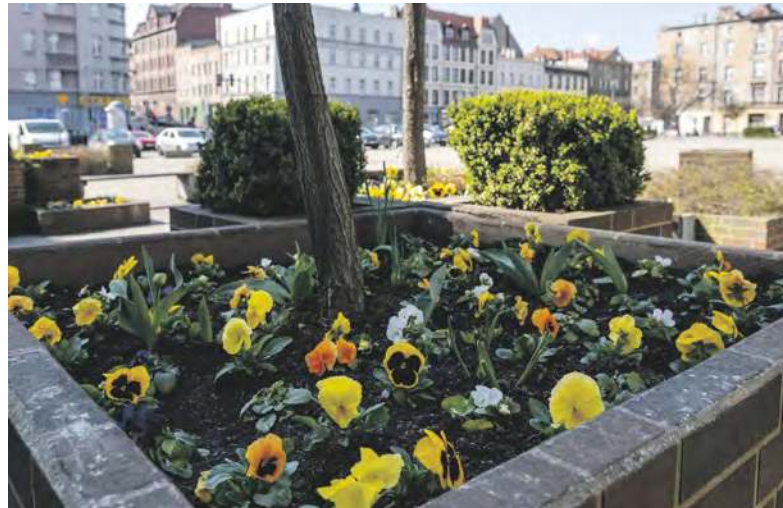
Kolorowe bratki pojawiły się między innymi na Rynku

BYTOM. WYCZEKIWANA WIOSNA WRESZCIE NADESZŁA I W NASZYM MIEŚCIE ZROBIŁO SIĘ BARDZO KOLOROWO OD KWIATÓW SADZONYCH TU I ÓWDZIE, A DO TEGO NA RÓŻNE SPOSOBY. EFEKT TYCH DZIAŁAŃ JEST MIŁY DLA OKA.