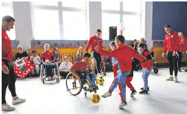
Gierka kontrolna? Proszę bardzo

Rozentuzjadowani gospodarze zarzucili zawodników serią pytań. Interesowało ich między innymi, jak często muszą trenować, by być w for-