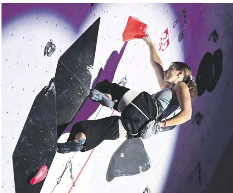
Organizatorzy zadbali o to, by zmagania wspinaczy były widowiskowe

Zmagania zawodników oglądało sporo widzów cały czas żywiołowo wszyst-