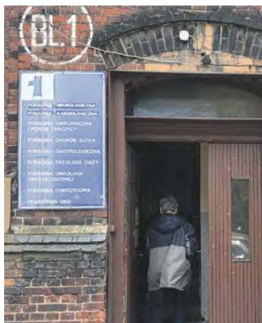
... ma odciąć je od długów

na i przeniesiona do Szpitala nr 2, by oddział i poradnie onkologiczne były skupione w jednym miejscu. Chirurgia małoinwazyjna i zabiegi krótkoterminowe oraz Oddział Kliniczny