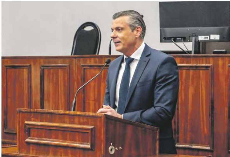
Prezydent Mariusz Wołosz nie boi się osądu mieszkańców

Zgodnie z zasadami Komitet miał od momentu zgłoszenia swej inicjatywy 60 dni na zebranie odpowiedniej liczby podpisów pod wnioskiem o przeprowadzenie referendum. Minimum wynosiło 10 663 - to 10 procent z liczby bytomian aktualnie widniejących na liście uprawnionych do głosowania. Termin gromadzenia zwolenników upłynął 6 kwietnia. Komitet poinformował, że ma 12 166 podpisów, a więc o 1497 więcej, niż było wymagane.