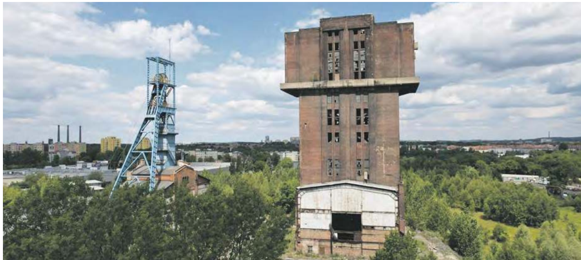
Szyb Krystyna to budowlą przepięknej urody

Aby rozpocząć najbardziej oczekiwaną część prac związaną z remontem charakterystycznego młota, konieczne jest wykonanie niezbędnych robót wzmacniających. Te, opracowane na podstawie koncepcji rewitalizacji