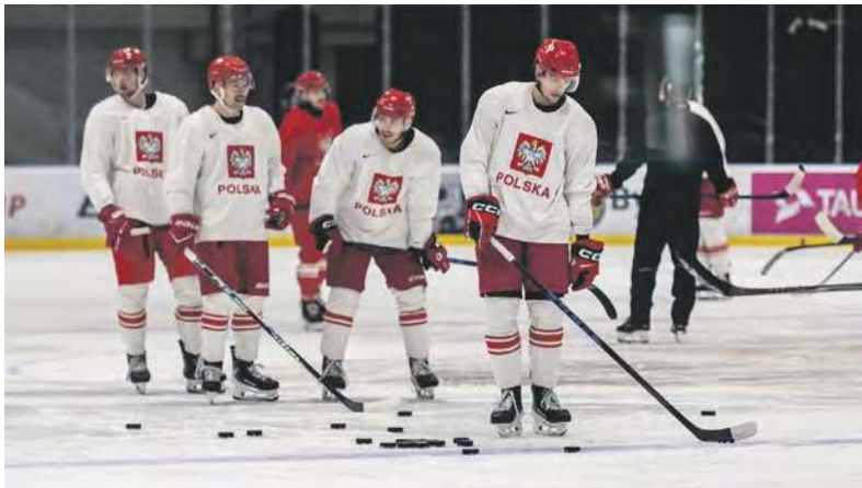
Reprezentacja najpierw trenowała w Bytomiu, a teraz zagra tu z Francją

BYTOM. HOKEJOWA REPREZENTACJA NASZEGO KRAJU NAJPIERW TRENOWAŁA NA LODOWISKU IM. BRACI NIKODEMOWICZÓW, A 29 KWIETNIA PODEJMIE NA NIM FRANCJĘ. BĘDZIE TO OSTATNI MECZ KONTROLNY PRZED MISTRZOSTWAMI ŚWIATA W DYWIZJI IA, NA KTÓRE JEDZIEMY Z WIELKIMI NADZIEJAMI.