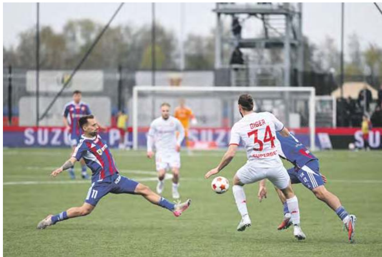
Ciągle czekamy na zwycięstwo piłkarzy Polonii

W minioną sobotę nasi pojechali do Niepołomic na starcie z tamtejszą Puszcą mającą w odróżnieniu od nas kapitalną drugą rundę - tylko jedna porażka i aż 19 punktów zdobytych. Polonia przegrała 1:2. O wszystkim przesądził pierwszy kwadrans, w którym miejscowi szybko wbili nam dwa gole podcinając tym samym skrzydła. To musiało bardzo boleć, bo to goście przeważali w tym fragmencie gry i stwarzali sobie dogodne sytuacje