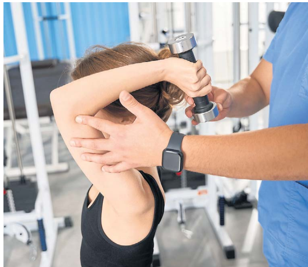
Należy pamiętać, że fizjoterapeuta nie leczy, a przede wszystkim wspomaga proces leczenia oraz znacząco poprawia komfort życia