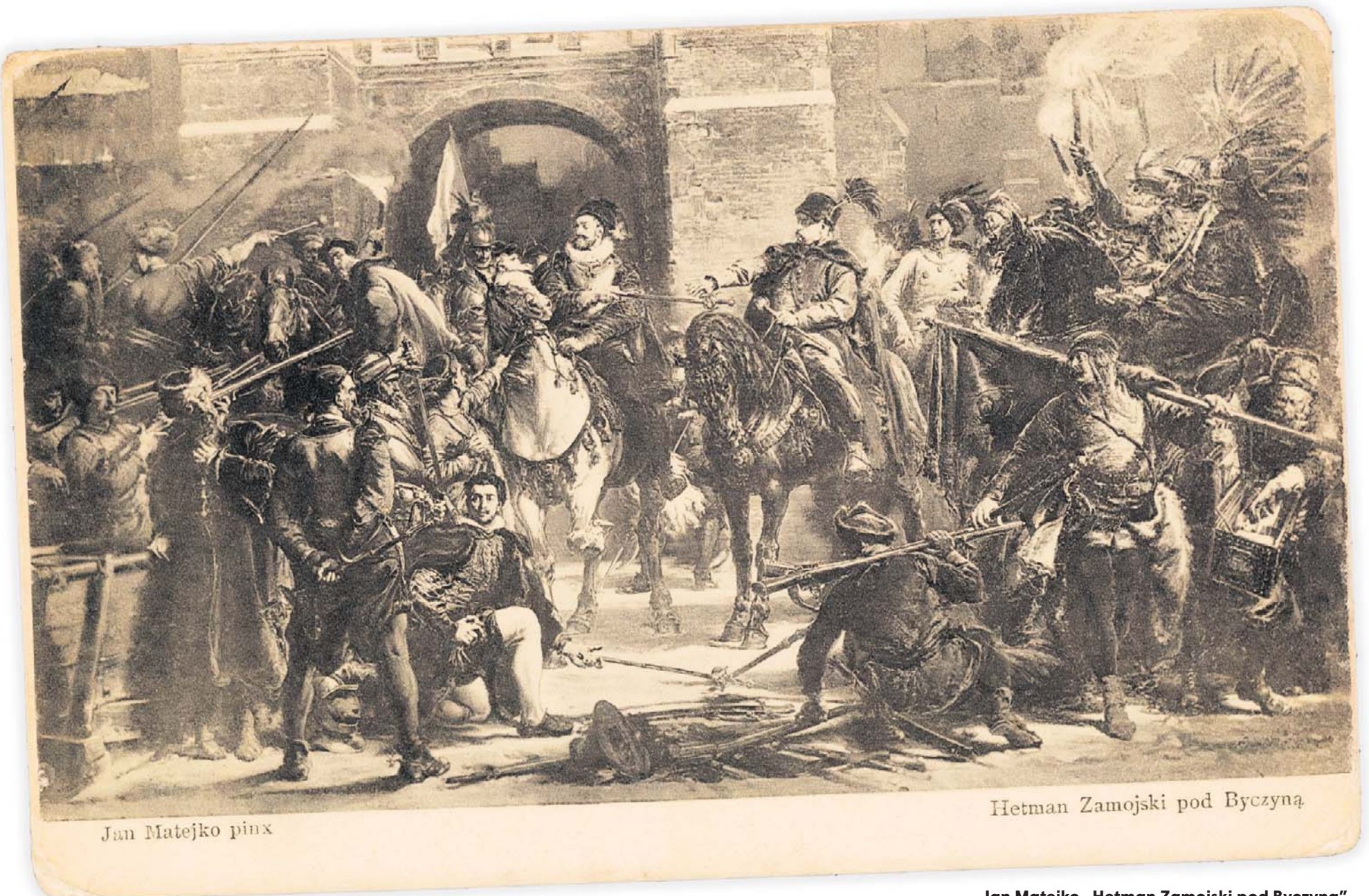
Hetman Zamojski pod Byczyną

Bitwę pod Orszą uważa się za pierwsze zwycięstwo husarii - ale to tylko częściowa prawda. Wtedy bowiem ta formacja była jeszcze lekką jazdą bez charakterystycznych zbroi. Dopiero pod Byczyną wystąpiła ona jako formacja ciężkozbrojna, miała nawet pierwszą wersję słynnych skrzydeł przyczepioną do tylnego łęku siodła. Właśnie tam narodziła się legenda.