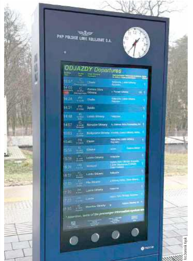
Urządzenia w trybie testowym działają również na peronie na stacji Puławy Miasto