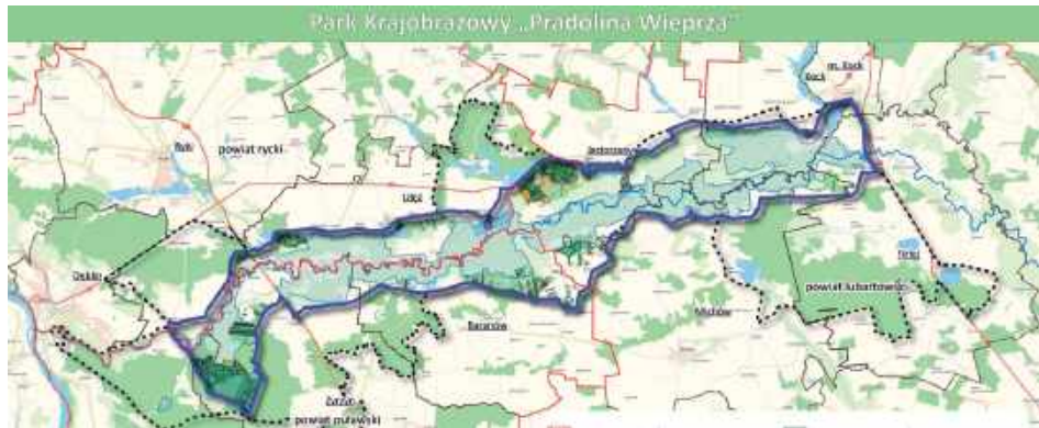
Tak miałyby przebiegać granice nowego Parku Krajobrazowego Pradolina Wieprza

Zespół Lubelskich Parków Krajobrazowych chce na terenie trzech powiatów - puławskiego, ryckiego i lubartowskiego utworzyć nowy park krajobrazowy - Pradolina Wieprza. Przyrodnicy przekonują, że przyciągnąłby do regionu turystów m.in. z okolic, Lublina czy Warszawy.