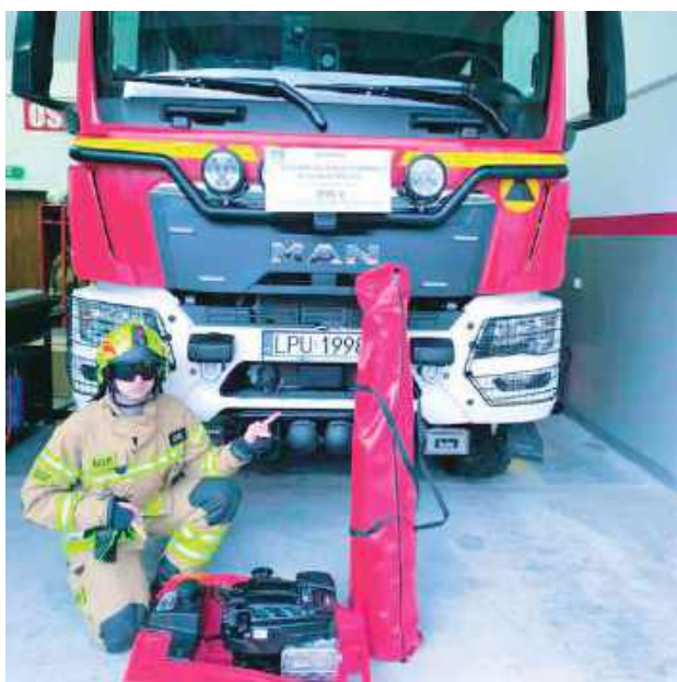
Dzięki dotacji druhowie z Klementowic mają teraz w remizie nową motopompę i parawan, które przydadzą się w prowadzonych przez nich działaniach ratowniczych.