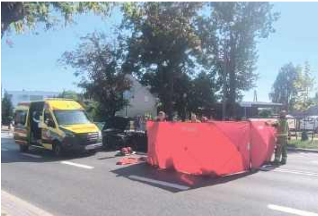
Ratownicy na miejscu długo walczyli o życie młodej rowerzystki. Niestety nie udało się jej uratować

Do tragedii doszło na ul. Dęblińskiej. Kierujący samochodem marki Audi, 20-letni mieszkaniec gminy Puławy, potrącił rowerzystkę, która wjechała na pasy. Po uderzeniu w dziewczynkę kierowca skręcił w lewo i czołowo zderzył się z jadącym prawidłowo z naprzeciwka Volvo, którym kierował 58-latek. 14-letnia rowerzystka odniosła rozległe obrażenia. Mimo długiej reanimacji życia mieszkanki Góry Puławskiej nie udało się uratować.