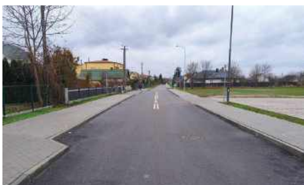
Otwarcia zmodernizowanej ul. Folwarki w Gołębiu dokonano jeszcze przed świętami

Wykonawcą robót była firma STRABAG Sp. z o.o. Zakres obejmował nie tylko wykonanie nowej nawierzchni asfaltowej, ale również roboty ziemne oraz przebudowę infrastruktury podziemnej. Zrealizowano nową kanalicję deszczową wraz ze