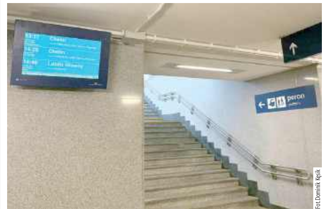
Ekran elektryczny na ten moment wyświetla informacje dla podróżnych przy schodach prowadzących z poczekalni na peron