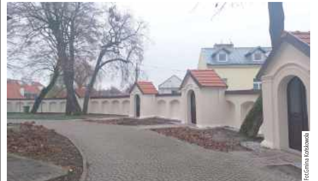
Inwestycja przy końskowolskim kościele pochłonęła 1,39 mln zł

Zakończył się remont ogrodzenia przy kościele p.w. Znalezienia Krzyża Św. i Św. Andrzeja Ap. w Końskowoli. Inwestycja była możliwa dzięki dotacji z Rządowego Programu Odbudowy Zabytków.