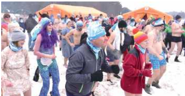
Przed wejściem do wody morsy wzięły udział w krótkiej rozgrzewce