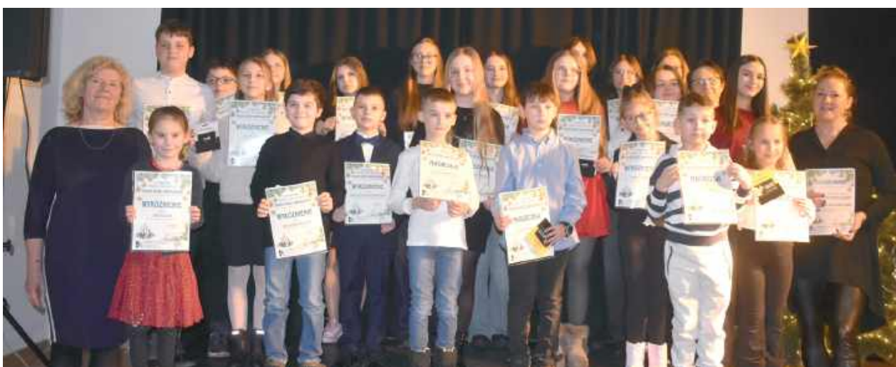
W V Powiatowym Konkursie Recytatorskim „Nasze Boże Narodzenie” zgłosiło się 70 osób. Nagrodzono 21 recytatorów

V Powiatowy Konkurs Recytatorski „Nasze Boże Narodzenie” za nami. W siedzibie MDKu rozdano dyplomy i wyróżnienia. Uczestnicy spotkania podziwiali młode talenty oraz śpiewali kolędy.