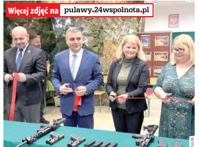
Więcej zdjęć na pulawy.24wspolnota.pl Uroczystego otwarcia strzelnicy dokonały władze Puław, kierownik Wydziału Edukacji i Sportu w urzędzie miasta oraz dyrektor ZSO nr 1. Uczniowie „Dziewiątki” będą korzystali z obiektu m. in. w ramach zajęć z Edukacji dla bezpieczeństwa

Dzięki takim zajęciom młodzież nauczy się prawidłowego postępowania się bronią oraz poprawnej techniki oddawania strzałów. Dziś w Zespole Szkół Ogólnokształcących nr 1 im. KEN w Puławach uruchomiono nowoczesną interaktywną strzelnicę. Zakup został zrealizowany przy wsparciu Ministerstwa Obrony Narodowej.