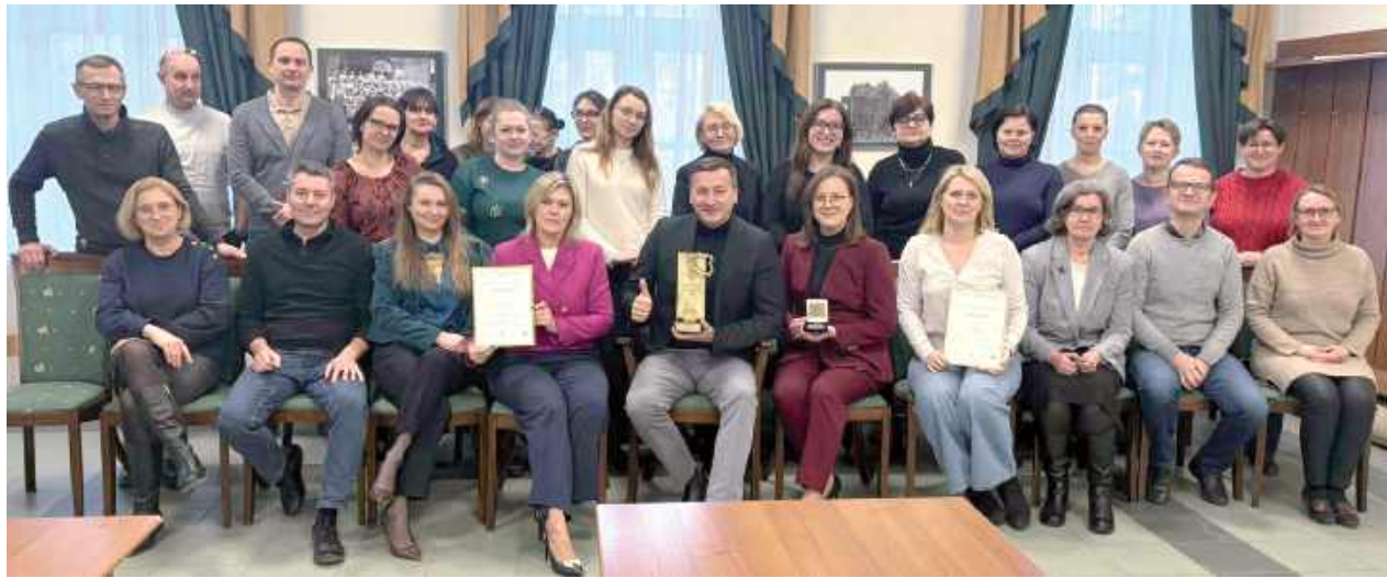
– Nie pracujemy dla rankingów – pracujemy dla skuteczności działań i satysfakcji naszych mieszkańców – podkreśla burmistrz Nałęczowa

Ranking, organizowany już po raz dziewiąty, uznawany jest za jedno z najbardziej prestiżowych i obiektywnych zestawień samorządowych w województwie lubelskim. Powstaje we współpracy z Głównym Urzędem Statystycznym i opiera się wyłącznie na rzetelnych, mierzalnych danych statystycznych, pochodzących m.in. z baz GUS, Ministerstwa Finansów oraz Centralnej Komisji Egzaminacyjnej. Dzięki temu wyniki rankingi odzwierciedlają