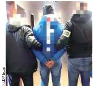
Grozi mu kara do 5 lat pozbawienia wolności

Łęczna: Na trzy miesiące do tymczasowego aresztu trafił 40-latek. Mężczyzna, trzymając w ręku siekiere, groził znajomej pozabawieniem życia. Zabrał jej telefon komórkowy, klucze do samochodu i do pracy oraz dowód osobisty.