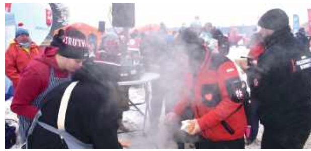
Na uczestników morsowania czekał ciepły poczęstunek przygotowany przez uczniów z ZS nr 1 im. Stefanii Sempołowskiej w Puławach tzw. „Garów”