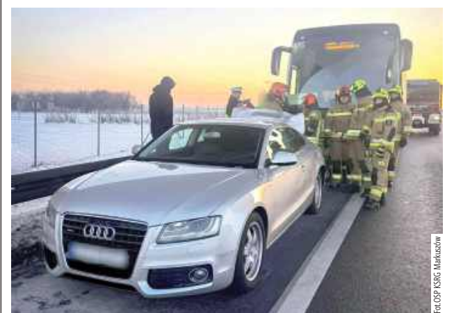
Do zdarzenia doszło we wtorek, 20 stycznia tuż po godz. 7 na drodze ekspresowej S12 w kierunku Warszawy na wysokości miejscowości Olempin w gminie Markuszów.

Jak wynika z ustaleń policji, 26-letni kierowca autobusu marki Mercedes nie zachował bezpiecznej odległości od poprzedzającego go pojazdu i wskutek tego najechał na tył jadącego przed nim Audi, którym kierował 33-latek.