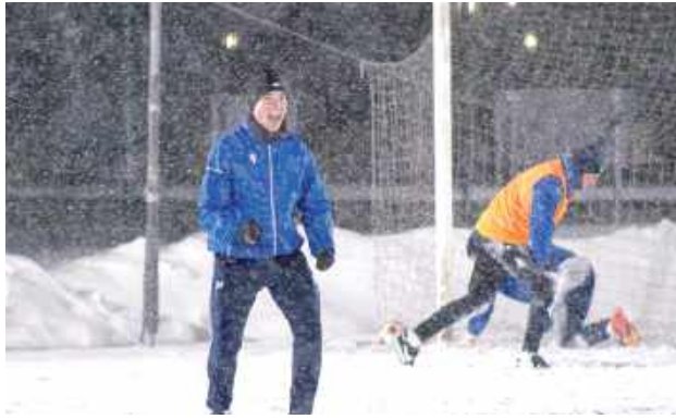
Lewart zaczął granie od wygranej 5:0 z Cisowianką Drzewce