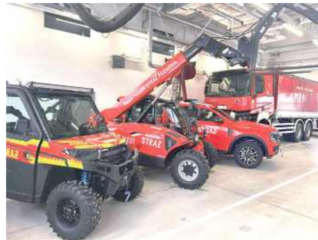
Dzięki dotacji w wysokości 6,2 mln zł puławska komenda PSP zakupiła nowe pojazdy oraz wyposażenie dla funkcjonariuszy

Komenda Powiatowa Państwowej Straży Pożarnej w Puławach wzmocniła swój potencjał ratowniczy, pozyskując nowoczesny sprzęt transportowy oraz specjalistyczne wyposażenie. To ważny krok w kierunku zwiększenia bezpieczeństwa mieszkańców naszego powiatu.