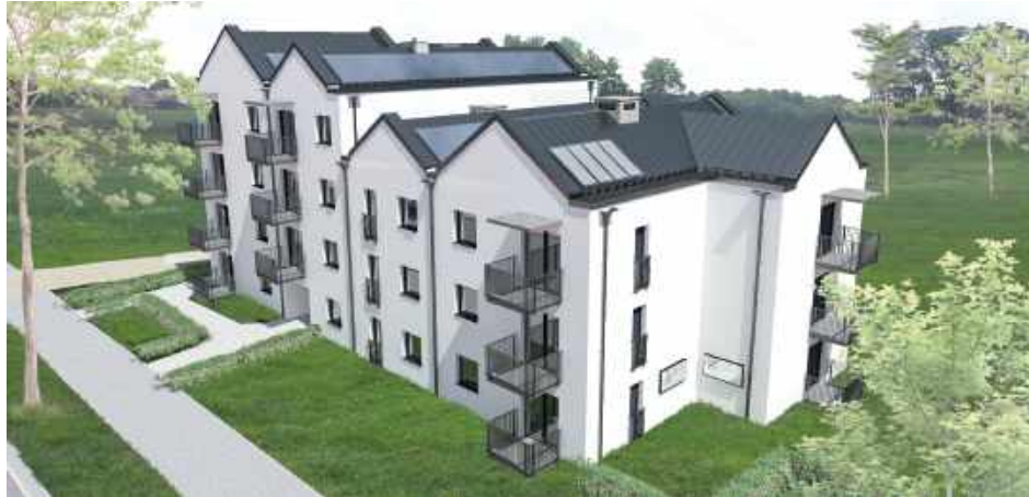
Tak ma wyglądać blok z mieszkaniami na wynajem, który powstanie u zbiegu ul. Słowackiego i Reymonta w Puławach w ramach Społecznych Inicjatyw Mieszkaniowych

Jak informuje prezydent Paweł Maj, w tym roku powstanie dokumentacja na budowę bloku z mieszkaniami na wynajem, a w przyszłym roku mają ruszyć prace budowlane. Pierwsi lokatorzy wprowadzą się do niego za trzy lata.