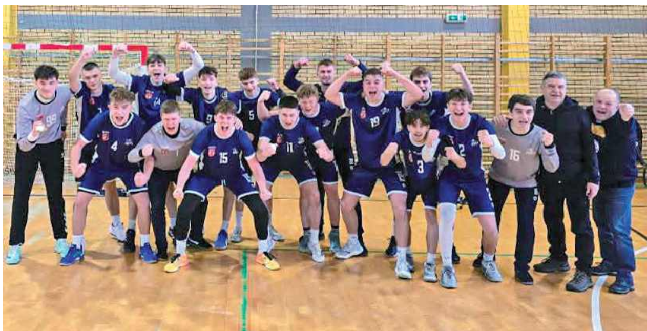
Juniorzy Azotów Puławy wygrali dwa mecze i awansowali do 1/8 mistrzostw Polski juniorów!

Orlen Wisła Płock - Azoty Puławy 45:22 (23:13)