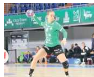
Drużyna z Lublina walczy o mistrzostwo Polski