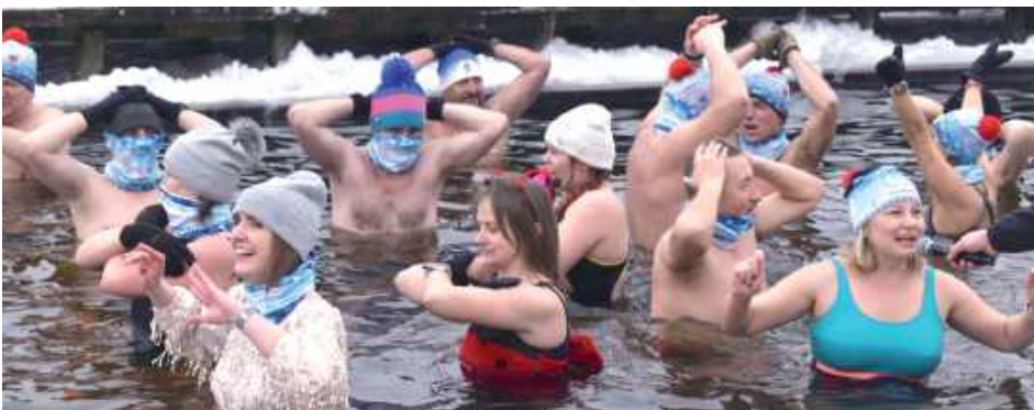
W minioną niedzielę termometry pokazywały kilka kresek poniżej zera. Mimo to grupa uczestników morsowania weszła do lodowatej wody przy

Zimna woda zdrowia doda! Ponad 200 osób wzięło udział w wydarzeniu pt. „Karnawał Morsa – Morsuj zdrowo powiatowo!” w Janowicach. Przez kilku minut uczestnicy morsowali w zalewie w ujemnej temperaturze.