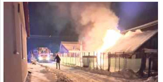
Pożar budynku postawił straż na nogi

Do pożaru w miejscowości Dragany, w powiecie lubelskim, doszło 23 stycznia, a straż pożarna otrzymała zgłoszenie o nim po godzinie 18. Na miejscu pierwsze pojawiło się OSP Dragany i zastało palący się budynek gospodarczo-mieszkalny o konstrukcji drewnianej. To od razu utrudniło sprawę, a do tego okazało się, że kolejnym utrudnieniem jest rozszczelniona butla z gazem.