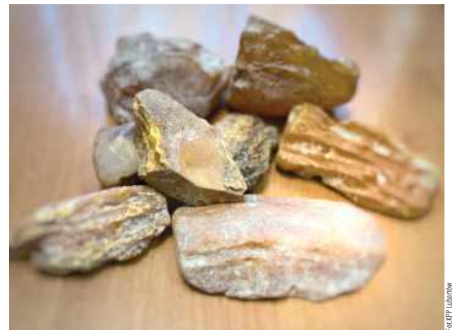
Za kradzież grozi im do 5 lat pozbawienia wolności

LUBARTÓW: Dzięki czujności pracowników kopalni odzyskanych zostało kilkanaście sztuk bryłek bursztynu o łącznej wartości blisko 4 tysięcy złotych.