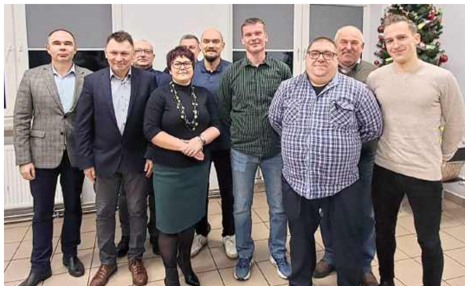
Nowy zarząd Żyrzyniaka Żyrzyn