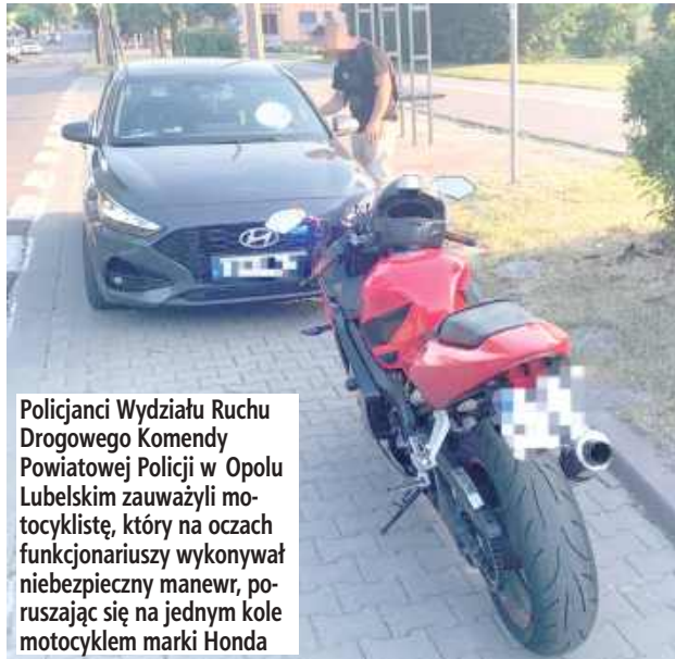
Policjanci Wydziału Ruchu Drogowego Komendy Powiatowej Policji w Opolu Lubelskim zauważyli motocyklistę, który na oczach funkcjonariuszy wykonywał niebezpieczny manewr, poruszając się na jednym kole motocyklem marki Honda

Do zdarzenia doszło w niedzielę, 28 czerwca. Policjanci Wydziału Ruchu Drogowego Komendy Powiatowej Policji w Opolu Lubelskim zauważyli motocyklistę, który na oczach funkcjonariuszy wykonywał niebezpieczny ma-