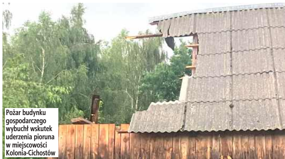
Pożar budynku gospodarczego wybuchł wskutek uderzenia pioruna w miejscowości Kolonia-Cichostów

Działania polegały na zabezpieczeniu miejsc zdarzeń oraz usuwaniu skutków nawałnicy.