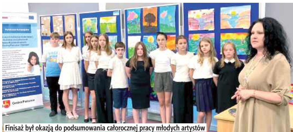
Finisaż był okazją do podsumowania całorocznej pracy młodych artystów

W Szkole Podstawowej nr 1 im. Tadeusza Kościuszki w Parczewie miało miejsce uroczyste zakończenie wystawy prac uczniów uczestniczących w zajęciach koła plastycznego.