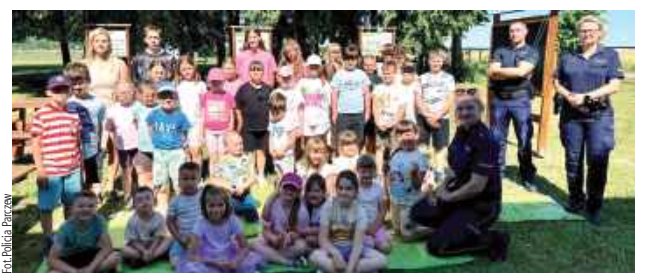
Policjanci rozmawiali z uczniami o zasadach bezpieczeństwa w trakcie trwających wakacji

Ostatni miesiąc to czas wyjątkowej pracy policjantki, która zajmowała się przygotowaniem zajęć dla dzieci i młodzieży pod hasłem „Bezpieczne wakacje 2026”.