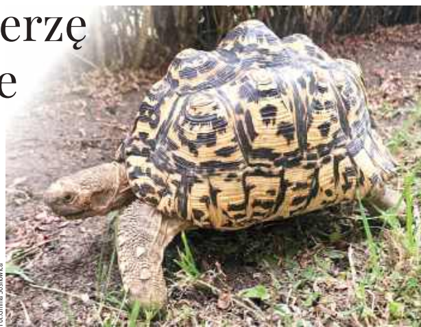
GR Żółw lamparci to gatunek, który zamieszkuje Afrykę Subsaharyjską

Żółw lamparci to gatunek, który zamieszkuje Afrykę Subsaharyjską. Nazwa tego gada pochodzi od charakterystycznego wzorku na karapaksie. Żywi się trawami i kaktusami.