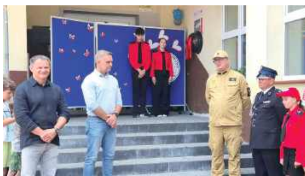
Automatyczny defibrylator zewnętrzny (AED) to nowoczesne urządzenie, które w przypadku nagłego zatrzymania krążenia może zdecydować o ludzkim życiu

W Szkole Podstawowej im. Unitów Drelowskich w Drelowie 19 czerwca odbyło się uroczyste odsłonięcie i przekazanie do użytku automatycznego defibrylatora zewnętrznego (AED). To nowoczesne urządzenie, które w przypadku nagłego zatrzymania krążenia może zdecydować o ludzkim życiu, jest już dostępne dla mieszkańców.