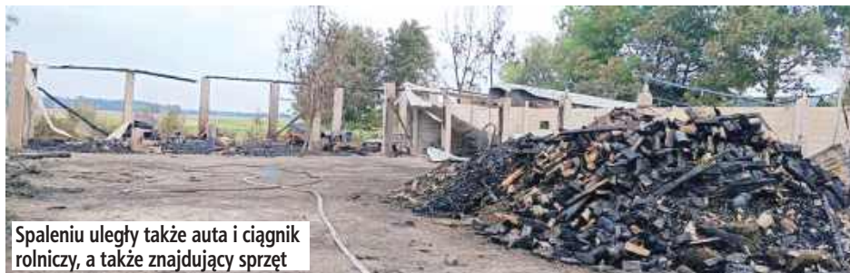
Spaleniu uległy także auta i ciągnik rolniczy, a także znajdujący sprzęt

Biała Podlaska: Do tymczasowego aresztu trafił 48-latek. Jest podejrzany o spowodowanie pożaru kompleksu budynków gospodarczych należących do członka jego rodziny.