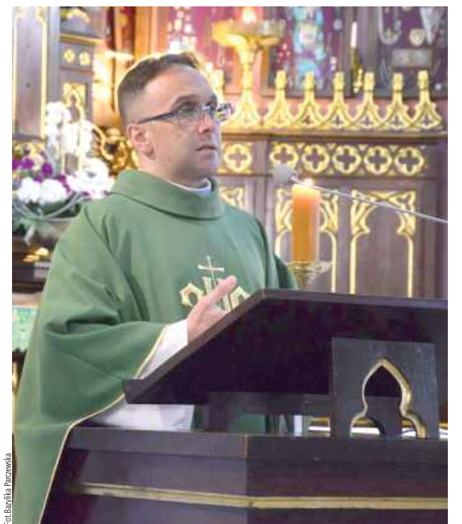
Ksiądz 1 lipca objął funkcję proboszcza w parafii Piotra i Pawła w Międzyrzecu Podlaskim