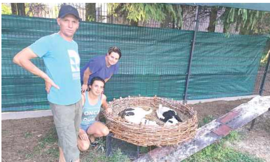
Dzięki szybkiej reakcji wszystkich zaangażowanych osób piskląta są już bezpieczne i trafiły pod specjalistyczną opiekę

Na szczęście losem ptaków zainteresowali się mieszkańcy, którzy zauważyli, że młode bociany nie mają szans na samodzielne przetrwanie. Przekazana przez nich informacja szybko trafiła do Stowarzyszenia Szansa dla Bociana, które natychmiast podjęło działania.