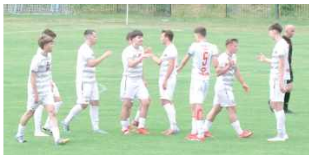
W najbliższej przyszłości okaże się, czy Orleńscy Łuków kolejny sezon spędzą w IV lidze. To bardzo możliwe!

Jeszcze kilkanaście temu wydawało się, że los Orleńców Łuków jest przesądzony. Po zakończeniu sezonu na 14. miejscu w tabeli IV ligi piłkarze z Łukowa musieli pogodzić się ze spadkiem do Klasy Okręgowej.