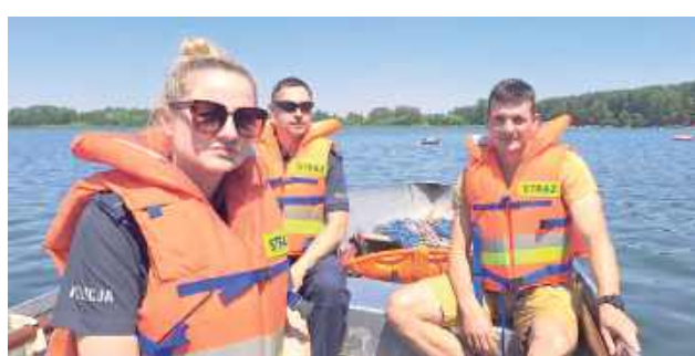
Początek wakacji oraz dobra pogoda przyciągają nad wodę wielu wczasowiczów

prowadzili wspólne patrole na wodzie. W trakcie służby funkcjonariusze skupili się głównie