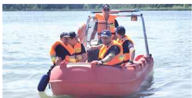
Początek wakacji oraz dobra pogoda przyciągają nad wodę wielu wczasowiczów

Ponadto wraz z druhami z OSP Uhnin dokonaliśmy