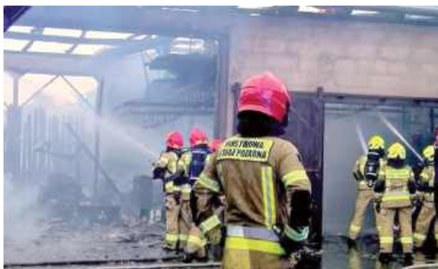
Mimo poważnych zniszczeń najważniejszą informacją jest to, że w zdarzeniu nikt nie ucierpiał

Informacja o pożarze wpłynęła do służb około godz. 17.50. Kiedy pierwsze zastępy