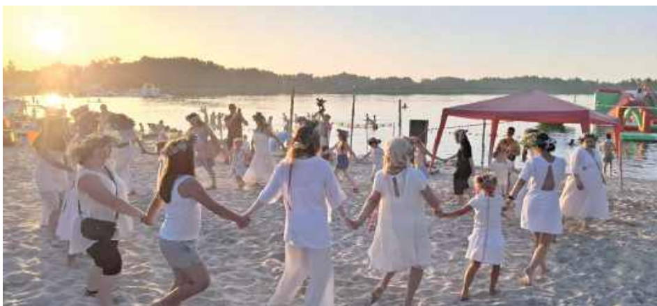
Fot.GOK Dębowa Kłoda