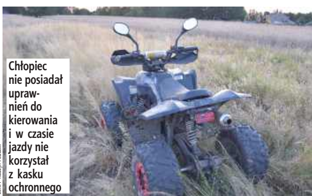
Chłopiec nie posiadał uprawnień do kierowania i w czasie jazdy nie korzystał z kasku ochronnego

Radzyń Podlaski: 14-latek, jadąc quadem, stracił panowanie nad pojazdem i upadł na jezdnię. Mimo prowadzonej na miejscu reanimacji, życia chłopca nie udało się uratować.