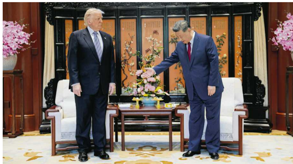
• Prezydent Chin Xi Jinping niedawno gościł Donalda Trumpa, wkrótce powita Władimira Putina

O ile Rosja jest uzależniona od rynku chińskiego, dla Chin zwiększone zakupy w Rosji stanowią pożądane źródło dywersyfikacji dostaw, co zwiększa bezpieczeństwo energetyczne państwa – szczególnie ważne od czasu, gdy kryzys