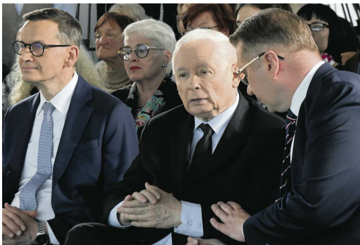
• 25 kwietnia 2026 r., kongres gospodarczy PiS – Myśląc Polska. Od lewej: Mateusz Morawiecki, Jarosław Kaczyński i Przemysław Czarnek

Obecnie Kaczyński nie jest w stanie nawet wyrzucić Morawieckiego ani zabronić mu budowania wewnątrz PiS-u konkurencyjnej dla przywództwa Kaczyńskiego struktury. Jest bezsilny, a autokrata na-