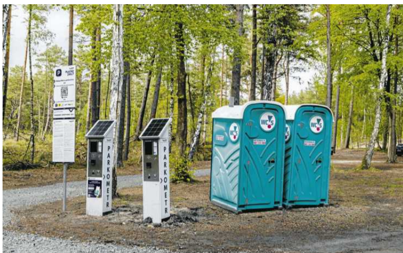
• Parking leśny w Mikoszewie

Po kolei odpowiadamy na wątpliwości naszych rozmówców.