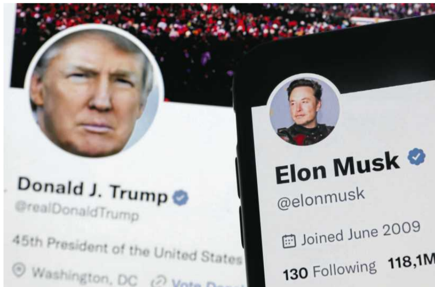
• Administracja prezydenta USA Donalda Trumpa ostro krytykuje Unię Europejską za próbę regulowania amerykańskich platform.

Przypomina mi się w tym kontekście netflixowy dokument o tym, jak platformy projektują uzależnienie – „Dylemat społeczny”. Nawet osoby pracujące dla wielkich platform przyznawały, że nie radzą sobie z produktami, które same pomagały zbudować. Rozumiały te mechanizmy lepiej niż ktokolwiek – i nie były na nie odporne. Sama wiedza nie wystarcza, gdy druga strona ma przewagę tech-