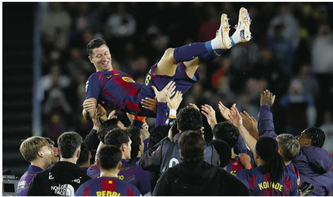
• Pożegnanie Roberta Lewandowskiego na Camp Nou. Barcelona, 17 maja 2027 rok

Zresztą to, że w Barcelonie będzie działać się coś wielkiego, czuć było od rana. Przed