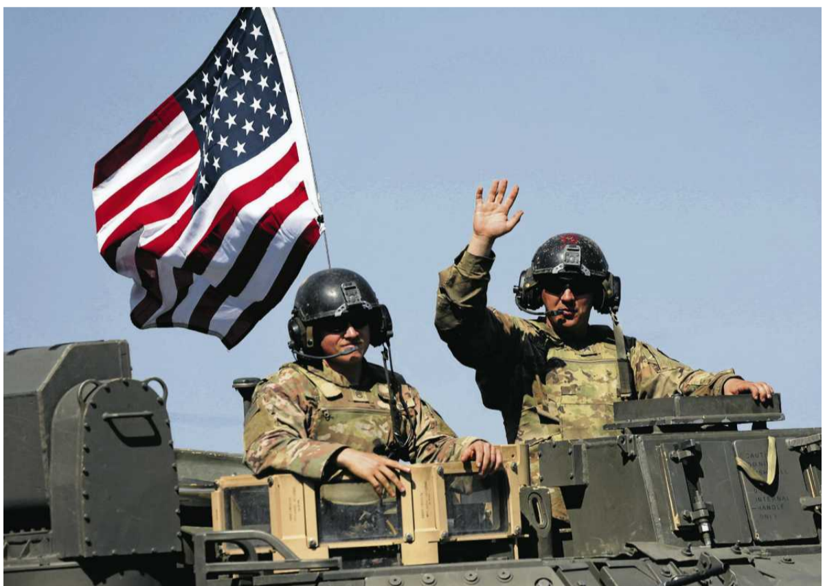
• Amerykańscy żołnierze podczas ubiegłorocznej defilady w Warszawie z okazji Święta Wojska Polskiego

– Ustawa o autoryzacji wydatków obronnych NDAA 2026 zawiera restrykcje dotyczące wycofywania wojsk USA z Europy. Ta rotacja pod ustawę nie podpada, ale kongresmeni mogą ostrzec rząd, że jeśli tego nie naprawi, mogą uchwalić nawet ostrzejsze przepisy, które bar-