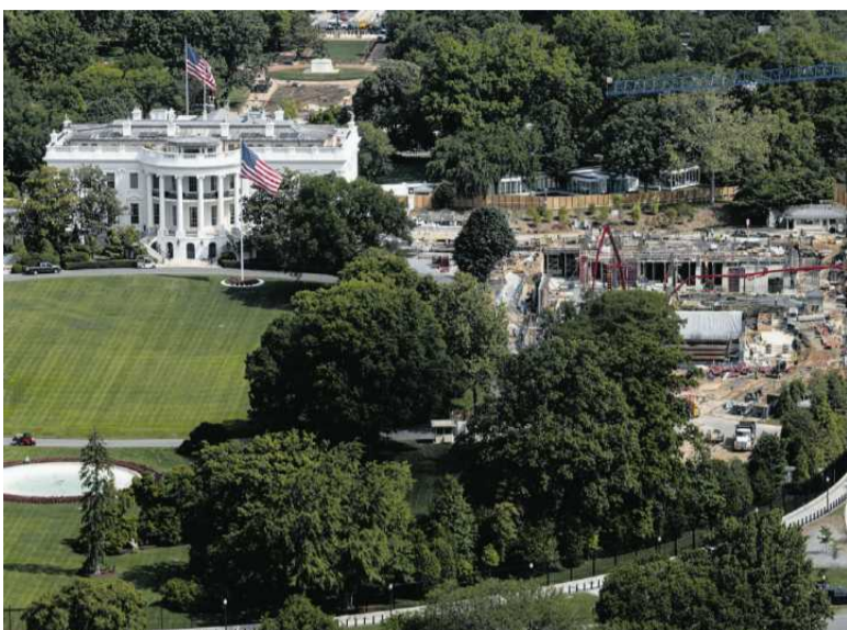
• Trwają prace budowlane nad planowaną salą balową Białego Domu w rejonie dawnego skrzydła wschodniego.

Sala balowa w Białym Domu to jeden z wielu projektów Trumpra, poprzez które chce on zapisać się w historii. Dotychczas kazał m.in. umieścić swoją podobiznę na biletach do parków narodowych i monetach, zapowiedział też, że sam zaprojektuje okręty wojenne „klasy Trump”